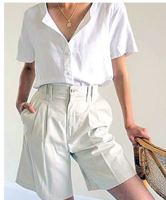
Bermuda é um clássico que vai bem nos dias quentes

O foco deve ser em estratégias de emagrecimento que envolvam a adoção de hábitos alimentares saudáveis e a prática regular de atividades que estimulem a manutenção muscular.