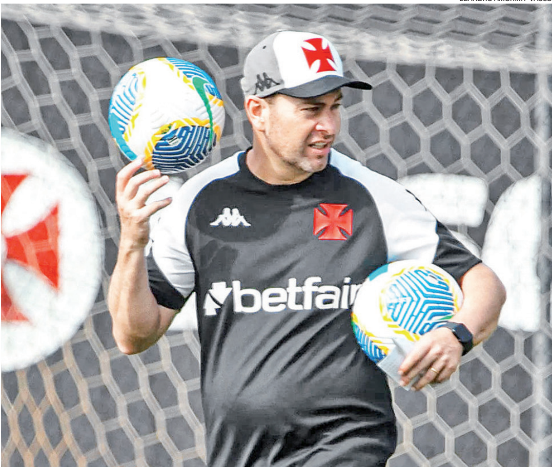
Após criticar o nível de exigência da torcida, Paiva disse que conta com ela na reta final do Brasileiro

“Foi no momento mais turbulento do Vasco em 2024 que nós (torcida + grupo) respondemos da melhor forma. Temos quatro jogos pela frente para fechar a temporada e vamos lutar com todas as nossas forças para buscar o maior número de vitórias. E o apoio deste torcedor é fundamental neste processo, como foi ao longo de toda a história do clube e desta temporada. Sei do privilégio de vestir essas cores e que a exigência do torcedor é sempre para o melhor e para o que o Vasco merece”, acrescentou.