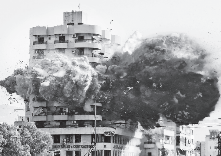
Dezenas de edifícios foram destruídos pelos bombardeios de Israel

O OSDH afirmou que o ataque atingiu três locais