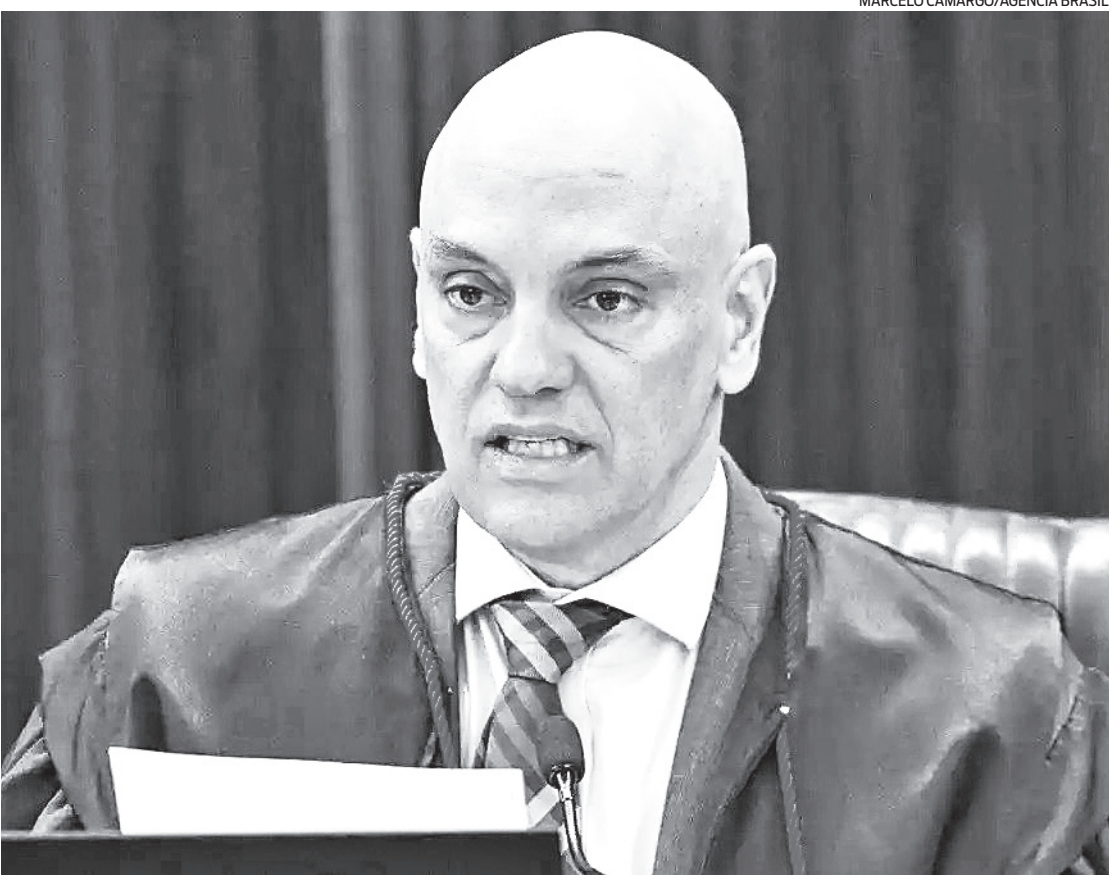
Moraes entende que manter o sigilo beneficia o “trabalho tranquilo” do procurador-geral Paulo Gonet

O procurador-geral já dispõe de extenso material dos inquéritos relacionados às vacinas e às joias do acervo presidencial. O inquérito do golpe reúne essas investigações, além de apurações sobre fake news, milícias digi-