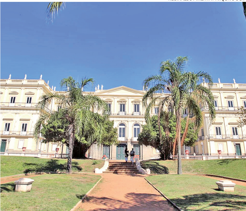
Museu Nacional fica localizado no bairro São Cristóvão, no Rio de Janeiro

O Museu Nacional, a mais antiga instituição científica do Brasil, pode ser declarado Patrimônio Cultural Imaterial do Estado do Rio. Vinculado à Universidade Federal do Rio de Janeiro (UFRJ), fica localizado na Quinta da Boa Vista, na Zona Norte. O tombamento consta no projeto de lei da deputada Verônica Lima (PT) que a Assembleia Legislativa aprovou. A declaração de patrimônio imaterial não impede a realização de obras, reformas e benfeitorias.