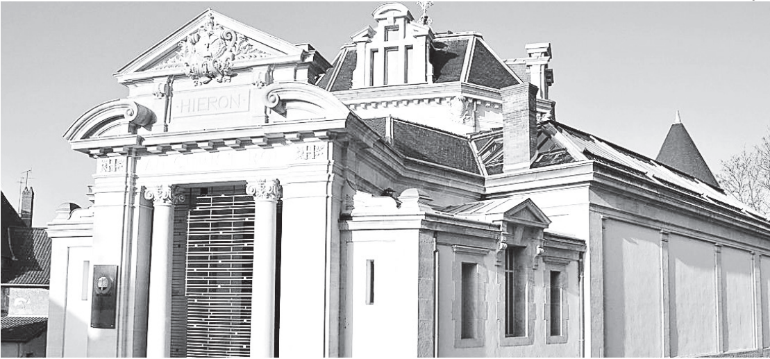
Museu francês de arte sacra de Hiéron já foi roubado outras vezes: uma em 2017 e a outra em 2022

Durante a fuga em uma motocicleta, os ladrões jogaram pregos no asfalto para neutralizar dois veículos da gendarmaria (polícia) que os perseguiram. Para a gendarmaria,