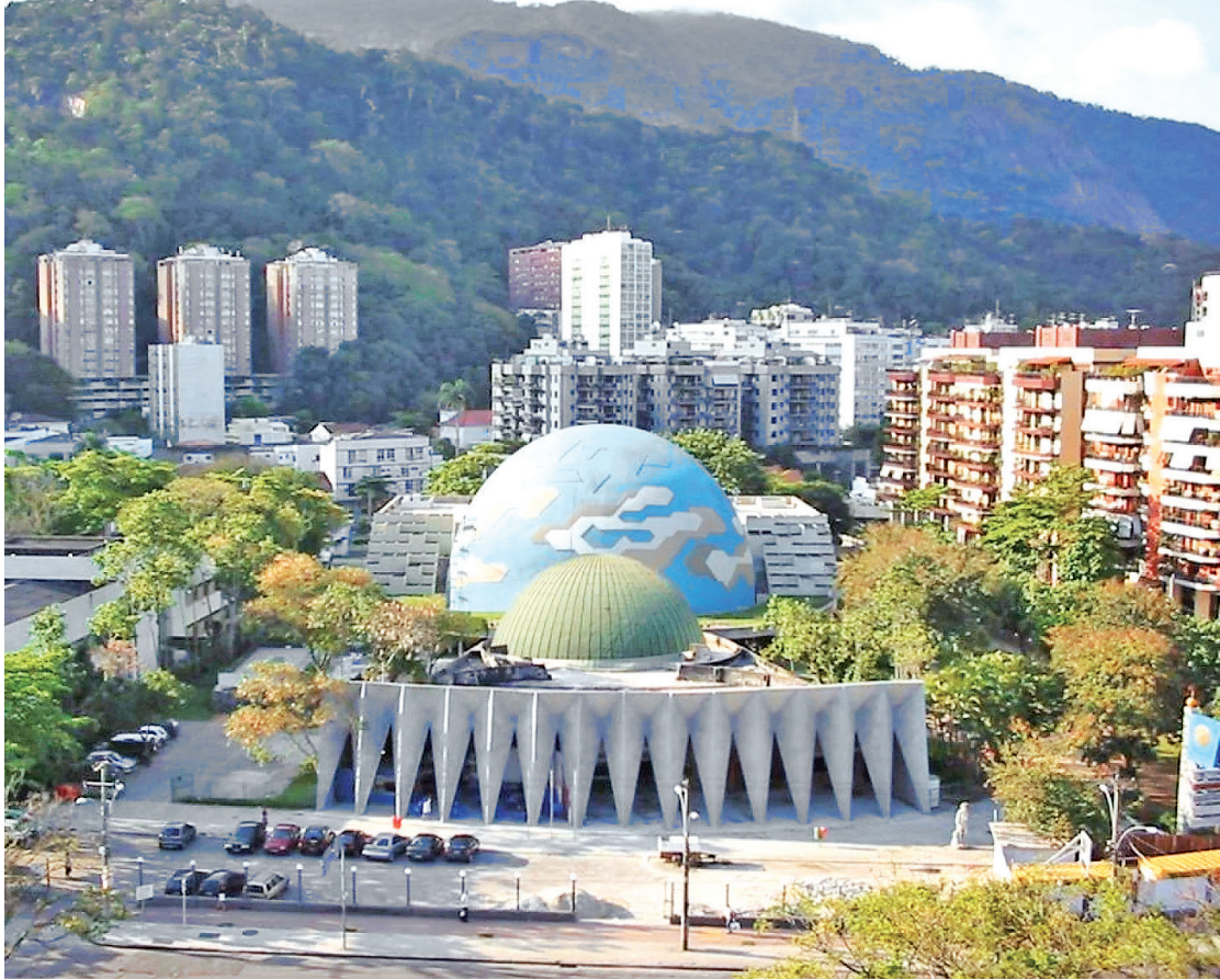
Horários de cada atração podem ser verificados no site oficial do Planetário do Rio

A programação do dia prevê, ainda, oficinas de arte e educação ambiental; apresentações musicais, de dança e circenses; cinema a céu aberto e atividades sensoriais; além da exposição 'Olhe para o Céu', que apresenta fotografias de paisagens celestes. Já amanhã, o Planetário terá atividades voltadas para pessoas neurodivergentes. Haverá visita guiada, sessão de cúpula adaptada (com sons mais baixos e menos luzes), oficina com massinha