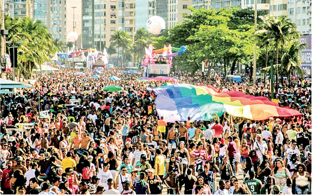
O evento 29ª Parada do Orgulho LGBTI+ Rio acontecerá amanhã, no Posto, 5 em Copacabana

implantada a área de lazer da Av. Atlântica, pista junto à orla. A pista junto às edificações da Av. Atlântica, a partir da R. Joaquim Nabuco até a Av. Princesa Isabel, além de seus acessos, também poderá ser interditada.