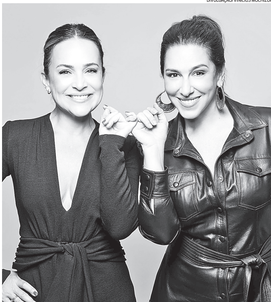
No quadro 'Tô no pod, amiga', internautas enviam histórias de amizade para a dupla

A filha de Regina Duarte detalha o processo de escolha dos convidados e a segurança que eles depositaram no projeto. "São pessoas que acreditam na nossa proposta, querem estar com a gente e bater papo, independente de ter ainda um apelo mais profissional. É a forma como o artista está acostumado a se expor, no nosso caso, eu sinto que a gente começou bem na base da confiança mesmo. Chamamos os amigos de quem gostamos e de quem a gente tem curiosidade de conversar sobre esse tema".