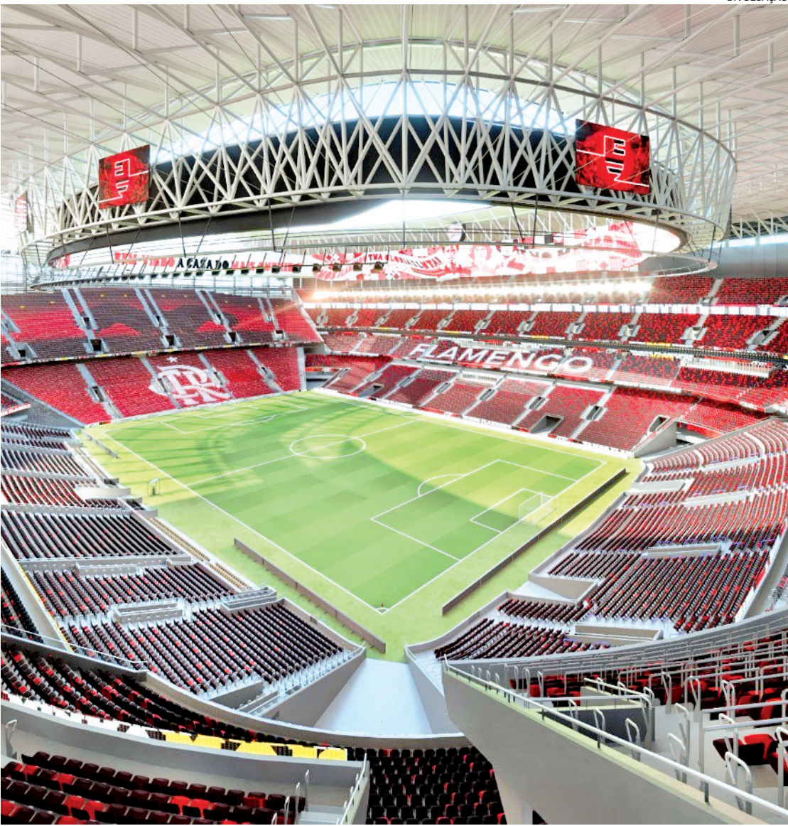
Plano oficial do projeto do novo estádio, previsto para ser inaugurado no dia 15 de novembro de 2029

Gabigol e Nicolás de la Cruz devem estar à disposição para encarar o Fortaleza, na próxima terça-feira, no Castelão