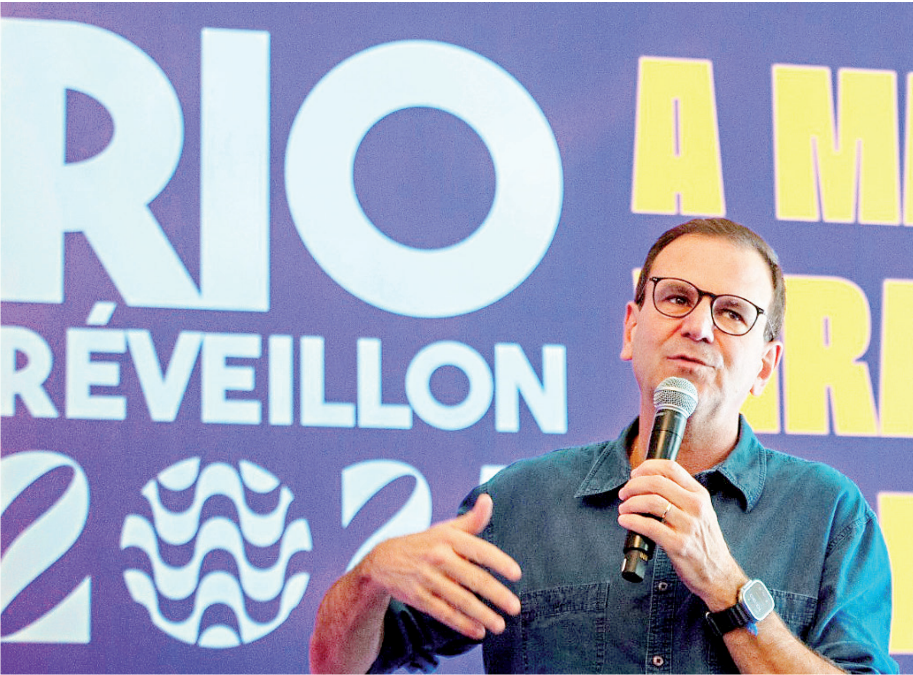
Para o prefeito Eduardo Paes, com a realização do G20 (encontro de chefes de Estado e Governo), o Rio mostrou, mais uma vez, a capacidade de promover grandes eventos

19h - Abertura DJ 20h - Caetano e Bethânia 22h - Ivete 00h12 - Anitta 02h - Xand Avião 03h30 - Unidos da Viradouro