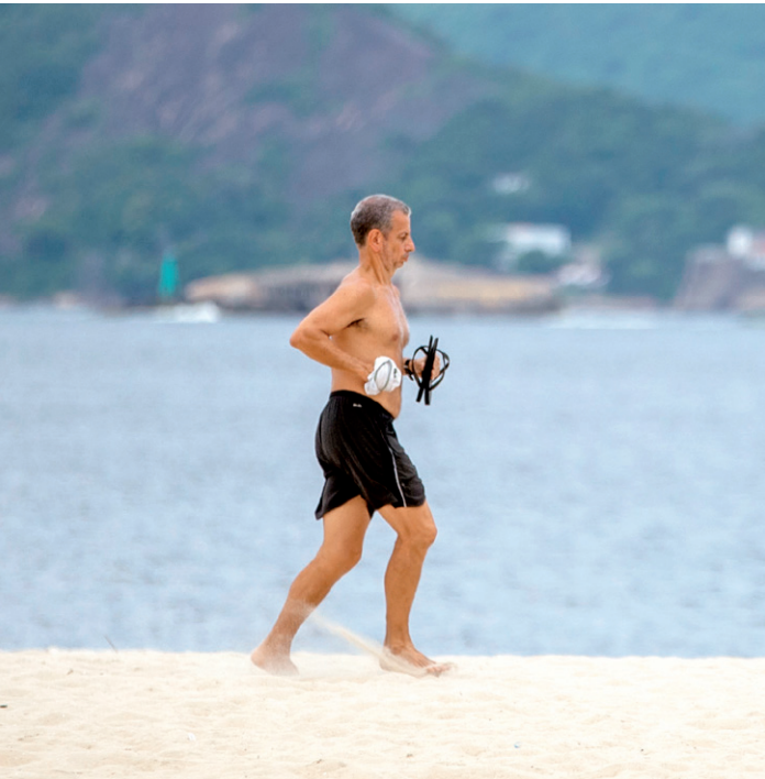
Tempo na cidade do Rio terá melhora somente na segunda-feira

foi apreendido. Em nota, a Polícia Civil informou que o caso foi comunicado na 26ª DP (Todos os Santos) por policiais militares que participaram da ação. O veículo da vítima passará por exame de perícia e os PMs envolvidos e testemunhas serão ouvidos.