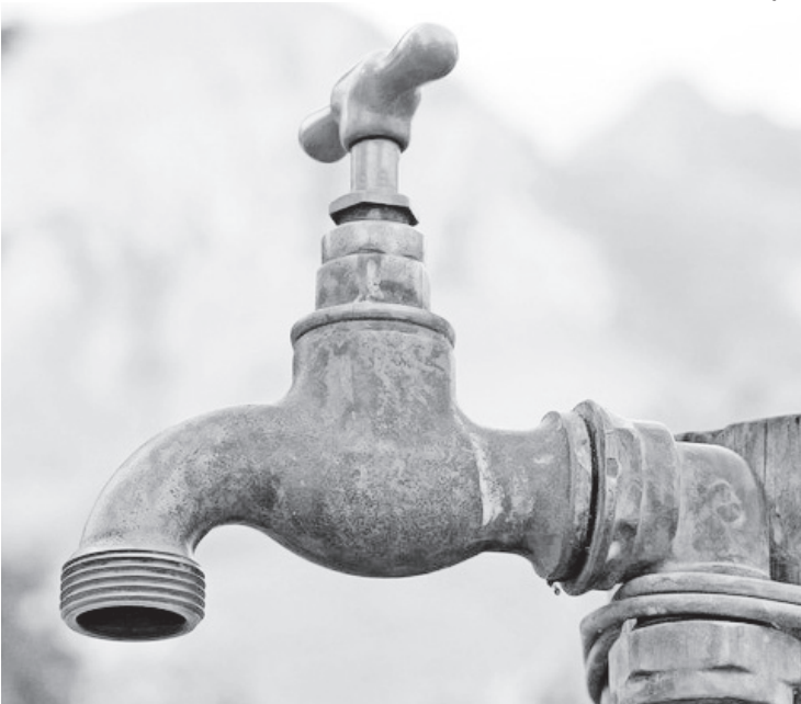
O fornecimento foi afetado em diversos bairros do Rio e na Baixada

filhos de 3 e 7 anos, relatou estar sem água desde terça-feira e falou sobre o prejuízo que teve. “Aqui em casa tem