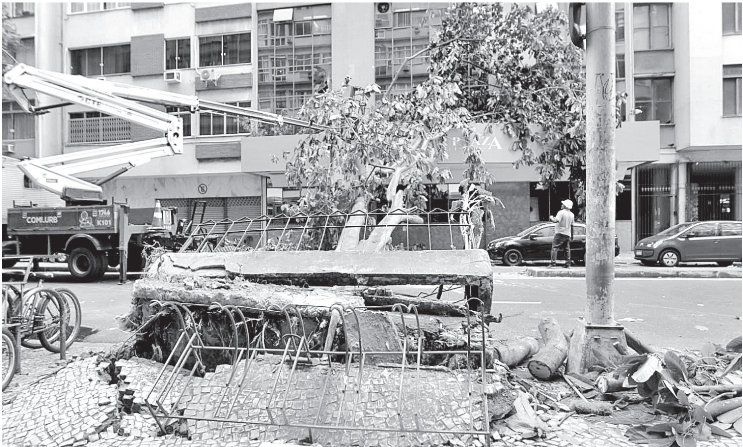
Queda de árvore interdita a Avenida Prado Junior, próximo à Rua Barata Ribeiro, em Copacabana. Chuva causou transtornos no Rio

A previsão para os próximos dias indica continuidade do tempo instável. O Aviso Meteorológico válido até as 23h de ontem estava associado a uma frente fria