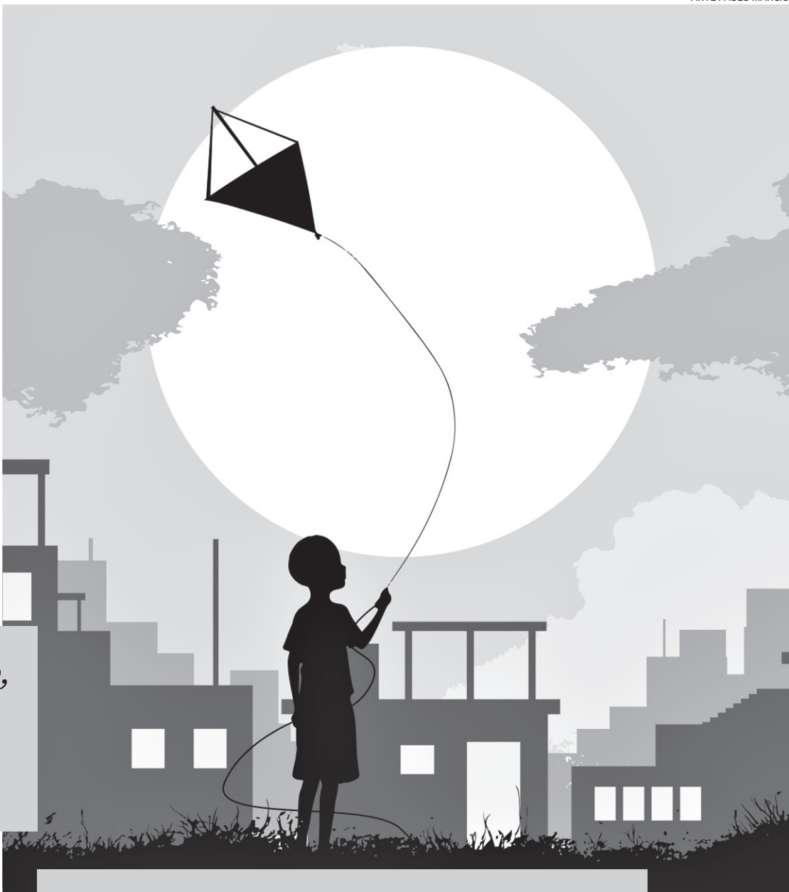
ARTE PAULO MÁRCIO

Não nos acostumemos com a violência. Hoje, como uma só comunidade de fé, elevemos ao Céu nosso grito por paz! Que a graça de Deus toque os corações, e que a boa vontade dos homens e mulheres que Ele tanto ama seja o caminho para a construção de um mundo mais pacífico e justo.