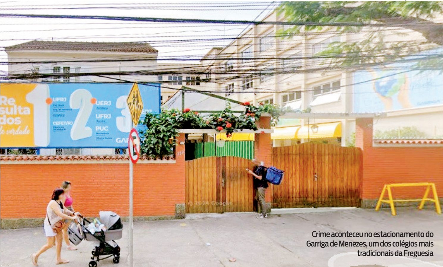
Crime aconteceu no estacionamento do Garriga de Menezes, um dos colégios mais tradicionais da Freguesia