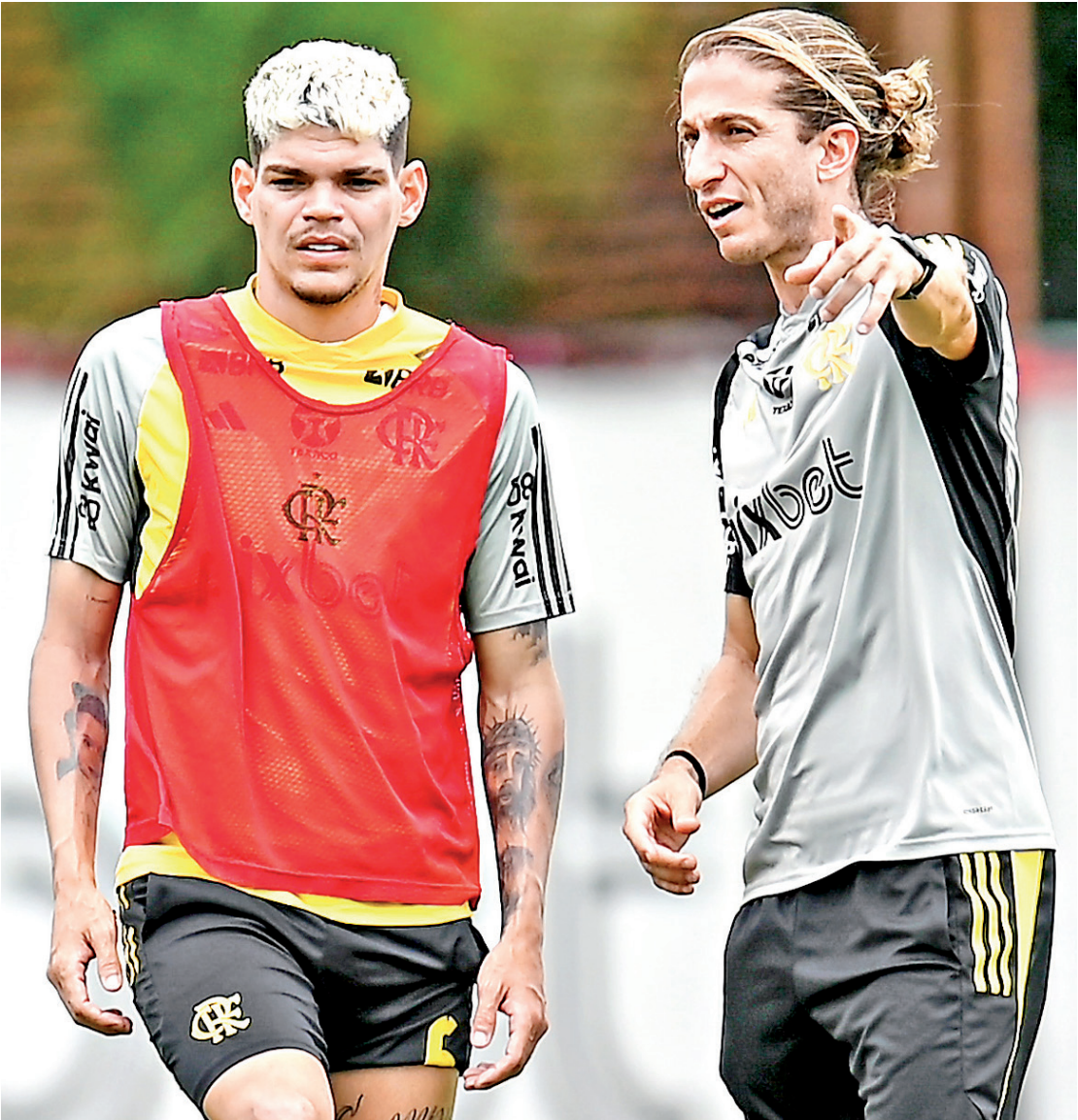
Filipe Luís orienta Ayrton Lucas, que vai substituir Alex Sandro na lateral esquerda do Flamengo hoje

amigos no quebra-quebra de torcedores do Peñarol, no Recreio dos Bandeirantes, e de Cebolinha e Matheus Gonçalves terem escândalos amorosos expostos nas redes sociais, com direito a traição. Evertton Araújo é o favorito para herdar a vaga de De La Cruz, que com uma lesão na coxa direita, deve desfalar o Flamengo por um mês. No ataque, Michael deve entrar no lugar de Bruno Henrique, enquanto Ayrton Lucas substituirá Alex Sandro. É com essa formação que o Rubro-Negro promete partir para cima do perigoso time gaúcho e, com o apoio da Nação rubro-negra, somar mais três pontos para, no mínimo, seguir na quarta posição do Brasileirão e ainda na caça — apesar das chances remotas de título — ao líder Botafogo, com dez pontos de vantagem na tabela de classificação.