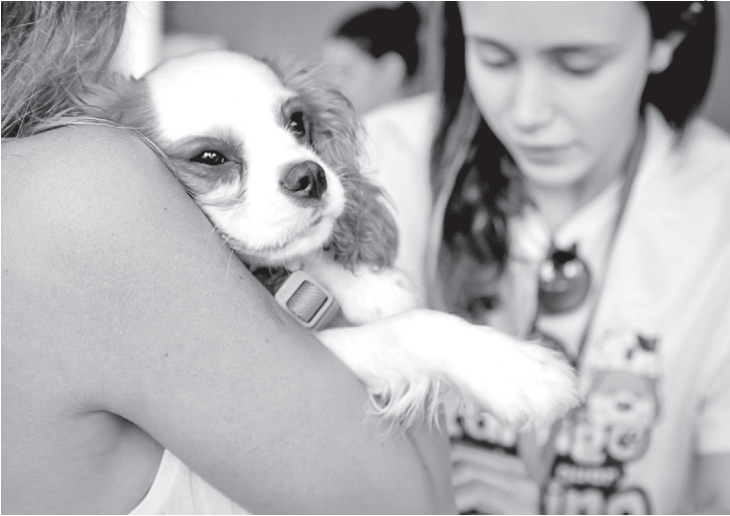
A vacina serve para garantir a proteção aos animais contra a raiva

A vacina contra raiva deve ser administrada anualmen-