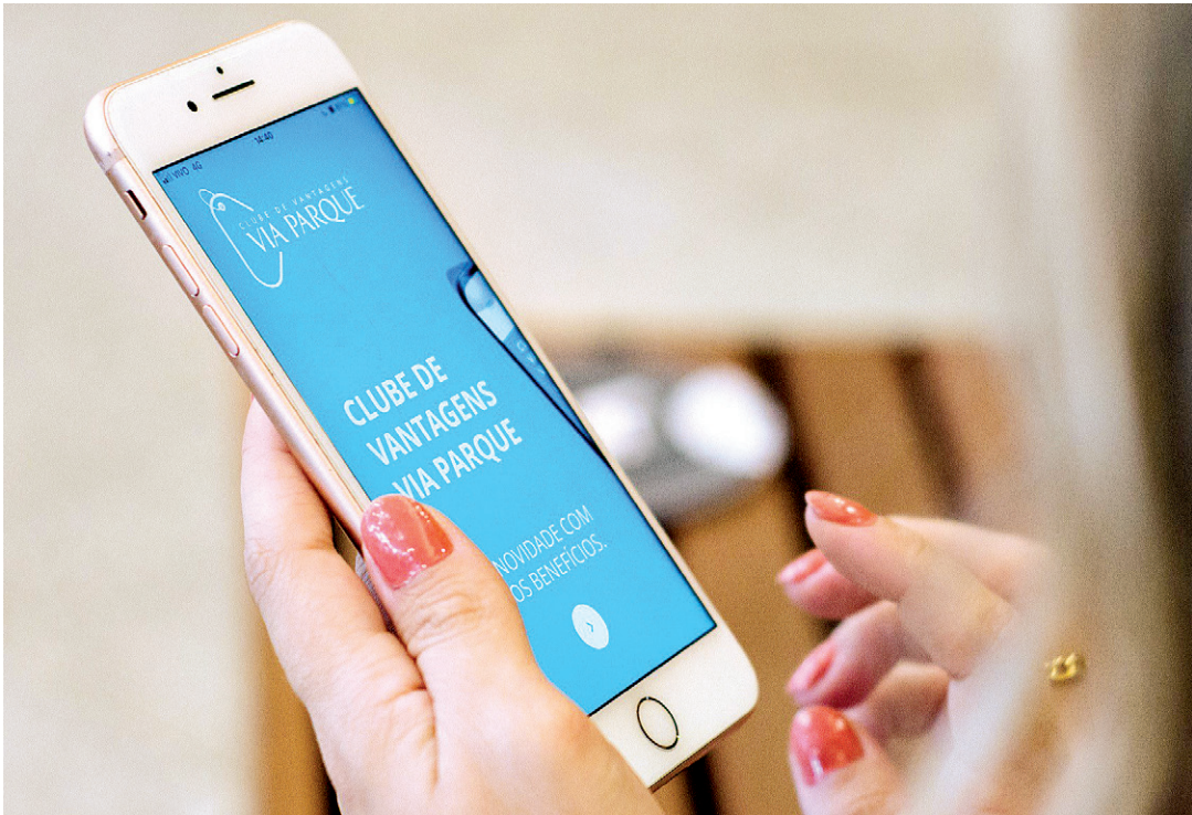
Consumidores receberão alertas sobre fraudes no topo dos anúncios de compras virtuais.

Sites de compras virtuais estão obrigados a publicar com destaque avisos sugerindo que, antes das compras, consumidores consultem a idoneidade das empresas. Entre os itens que devem ser consultados, estão o nome fantasia, CNPJ, telefone e endereço físico. Os sites terão que disponibilizar o endereço eletrônico utilizado na contratação do anúncio e e-mail para os consumidores esclarecerem dúvidas. “Diversos sites de vendas eletrônicas têm surgido com anúncios de produtos com preços bem abaixo do valor de mercado, por vezes metade do valor cobrado por seus concorrentes. O objetivo é coibir fraudes, que são cada vez mais comuns”, afirmou a deputada Zeidan (PT), autora da lei que já foi sancionada pelo governador Cláudio Castro.