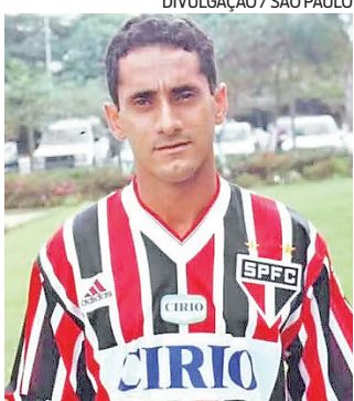
Zé Carlos jogou no São Paulo

■ Zé Carlos, ex-lateral-direito que fez sucesso com a camisa do São Paulo e defendeu a seleção brasileira na Copa do Mundo de 1998, morreu ontem, aos 56 anos. Ele foi vítima de um enfarte fulminante em Osasco, na Região Metropolitana de São Paulo. O ex-jogador estava hospedado na casa de uma sobrinha quando veio a óbito. O Corpo de Bombeiros foi acionado para a residência após os familiares estranharem o fato dele não ter acordado na manhã