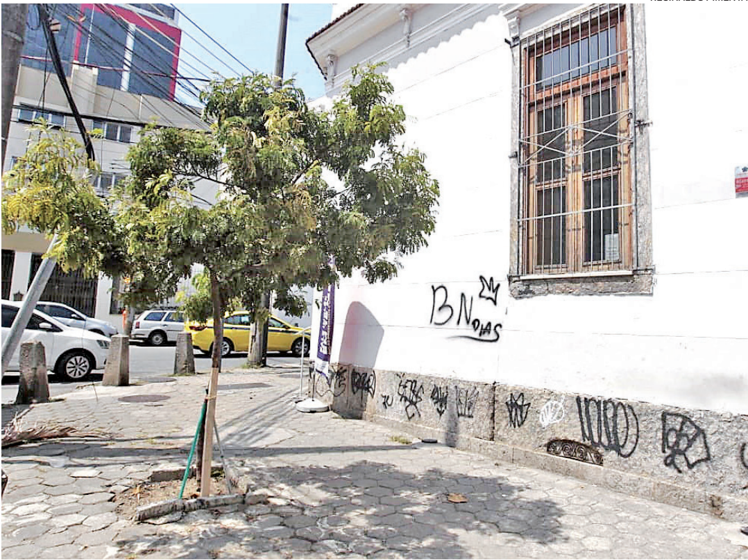
Alvo de polêmica, pau-brasil fica na Rua Vicente de Sousa, em Botafogo, Zona Sul da cidade

dação informou que: “Ao ve-rificar um plantio irregular, o órgão busca identificar o ci-dadão responsável, para aler-tá-lo da realização do plantio com orientações técnicas que evitam riscos futuros. Já em casos de remoção irregular, é solicitada a visita da patru-lha ambiental para aplicar as medidas cabíveis.” Em nota, a Secretaria de Meio Ambiente e Clima afir-mou, por meio de assessor-ria, que recebeu o chamado através da central 1746 e, ao chegar ao local, se deparou com a árvore já replantada no mesmo local. “O estabe-lecimento sofreu uma adver-tência”, disse o órgão.