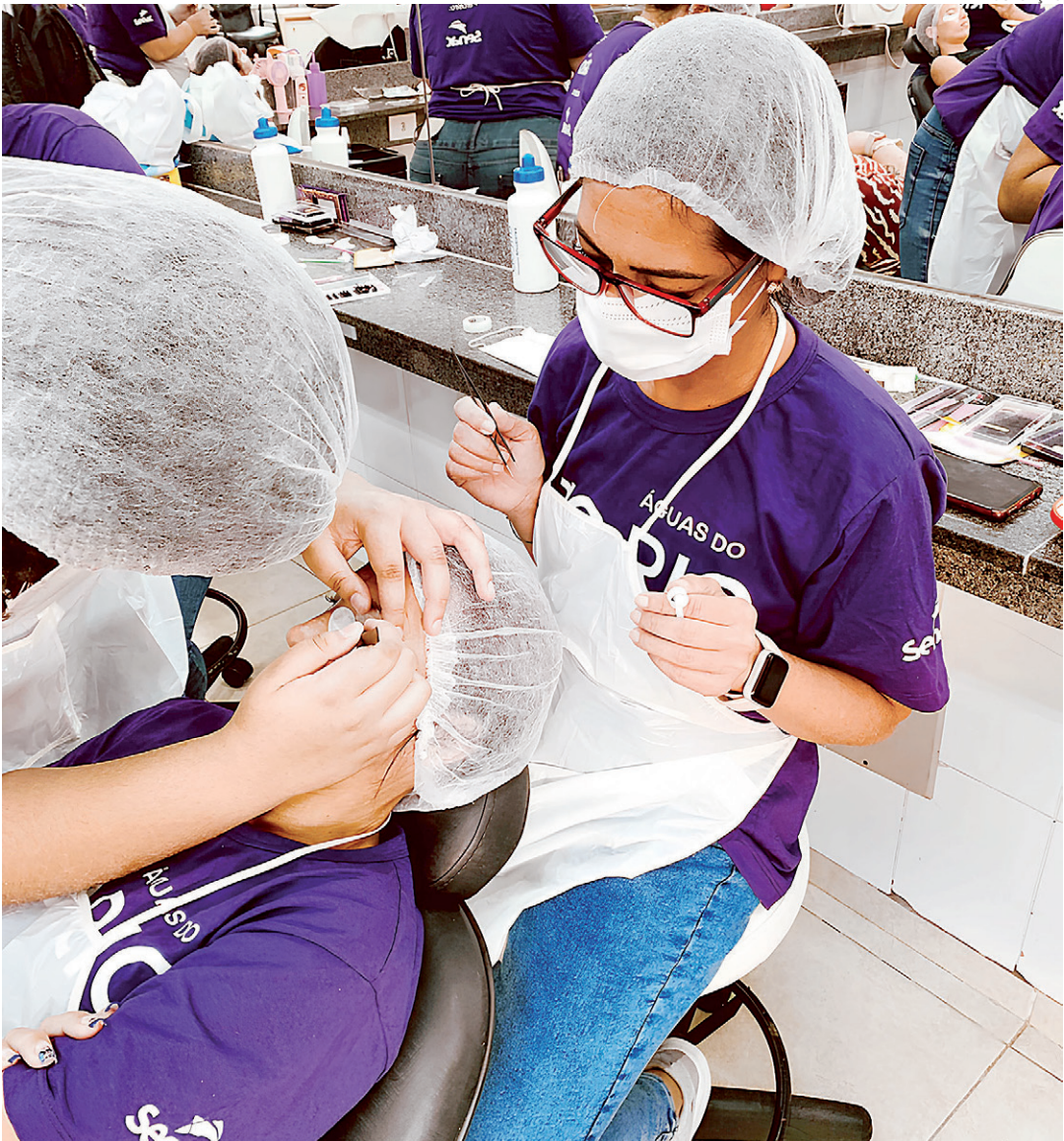
Alunas praticam e tiram dúvidas durante o curso. Educação ajuda a construir um caminho para o futuro

os inscritos recebem vale-transporte para o deslocamento, material para a aula prática e camiseta personalizada.