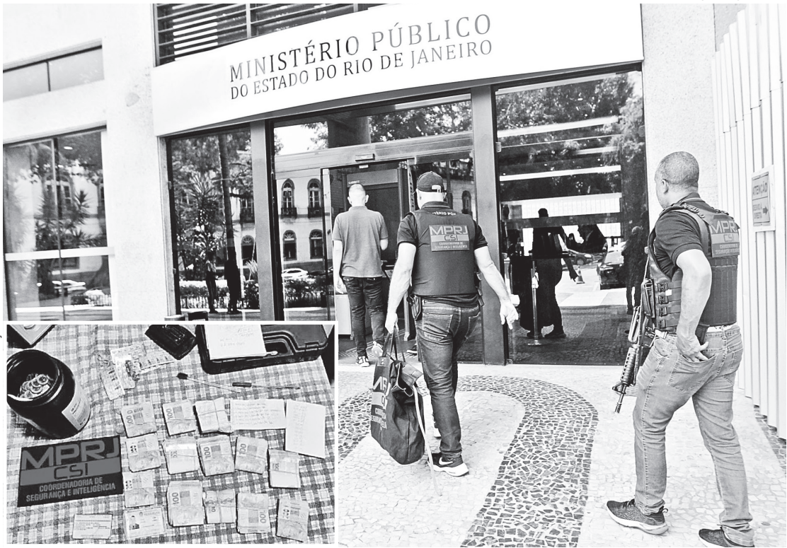
Operação Ministério Público do Rio contra policiais militares suspeitos de envolvimento com milicianos

Segundo denúncia do Grupo de Atuação Especializada no Combate ao