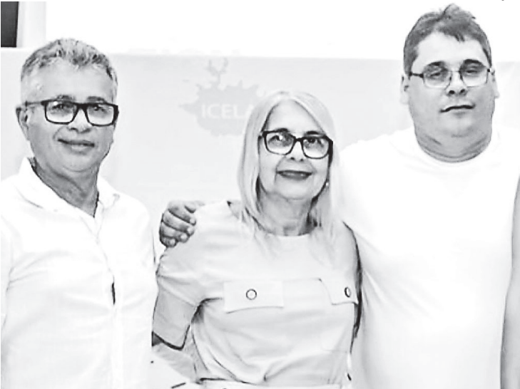
Pais do prefeito foram sequestrados na madrugada de quinta-feira

O caso foi registrado na 48ª DP (Seropédica). Segundo a Polícia Civil, uma perícia foi feita na residência e agentes buscam imagens de câmeras de segurança para esclarecer todos os fatos.