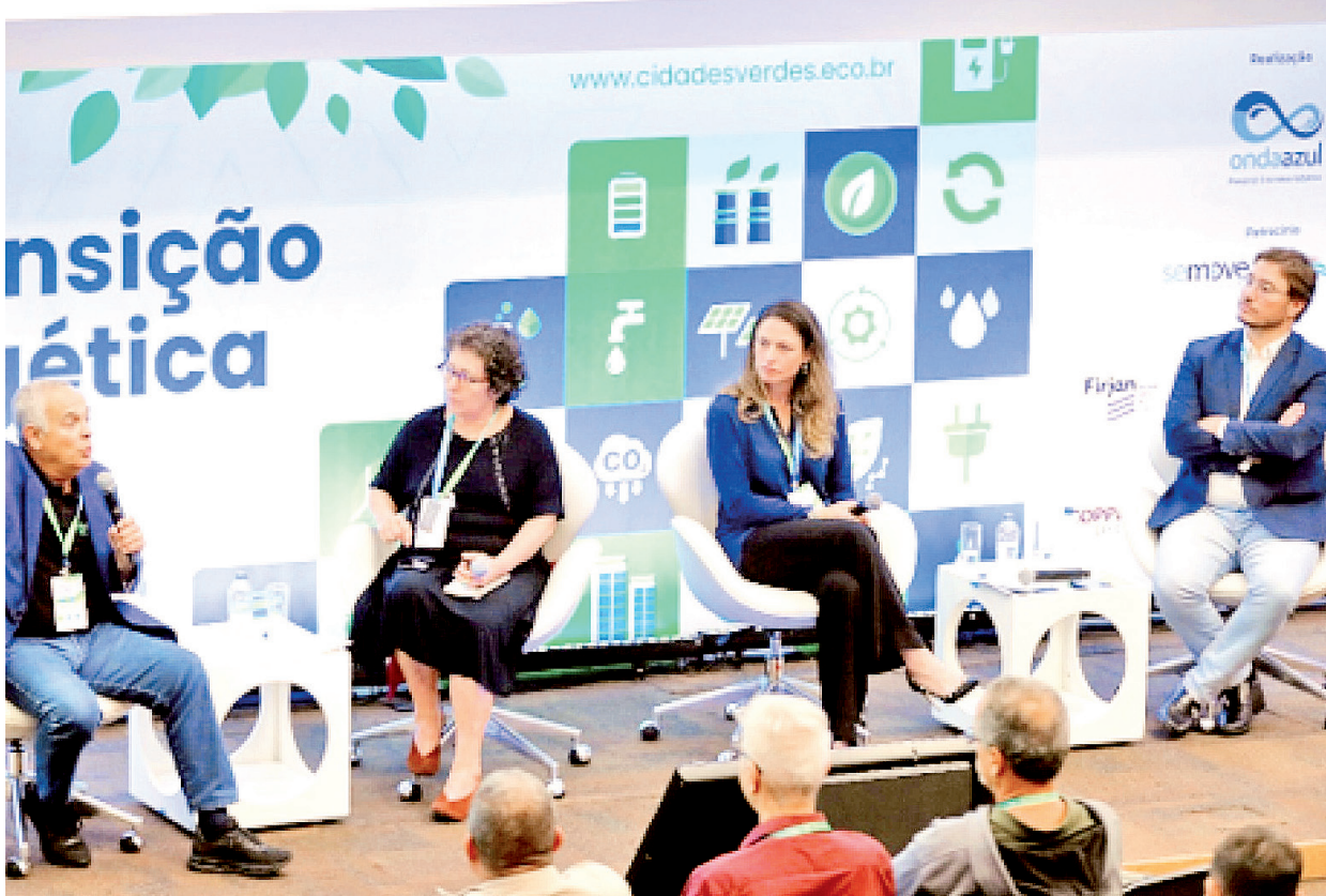
Evento contou com representantes da academia, da iniciativa privada, do poder público e da sociedade civil