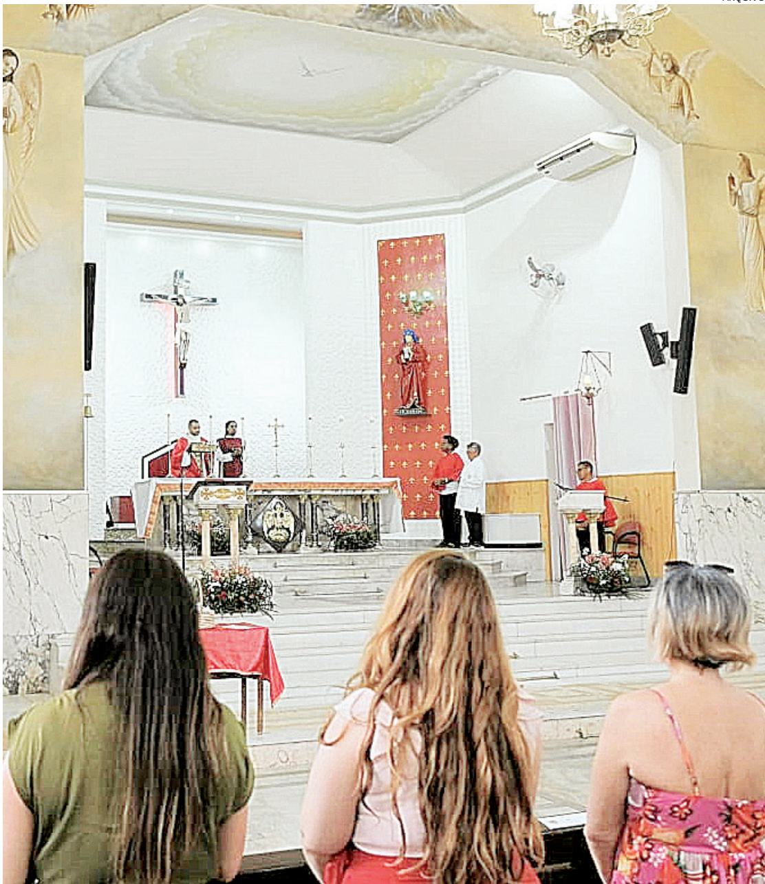
Paróquia São Cosme e São Damião, no bairro do Andaraí, na Zona Norte, tem programação especial