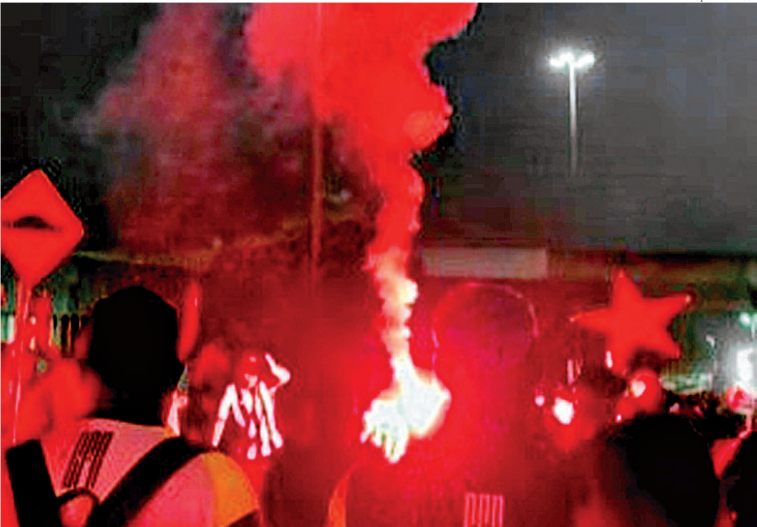
Apesar de ainda ser madrugada, torcida do Botafogo foi ao Tom Jobim, às 5h, festejar os jogadores após a classificação à semifinal da Liberta