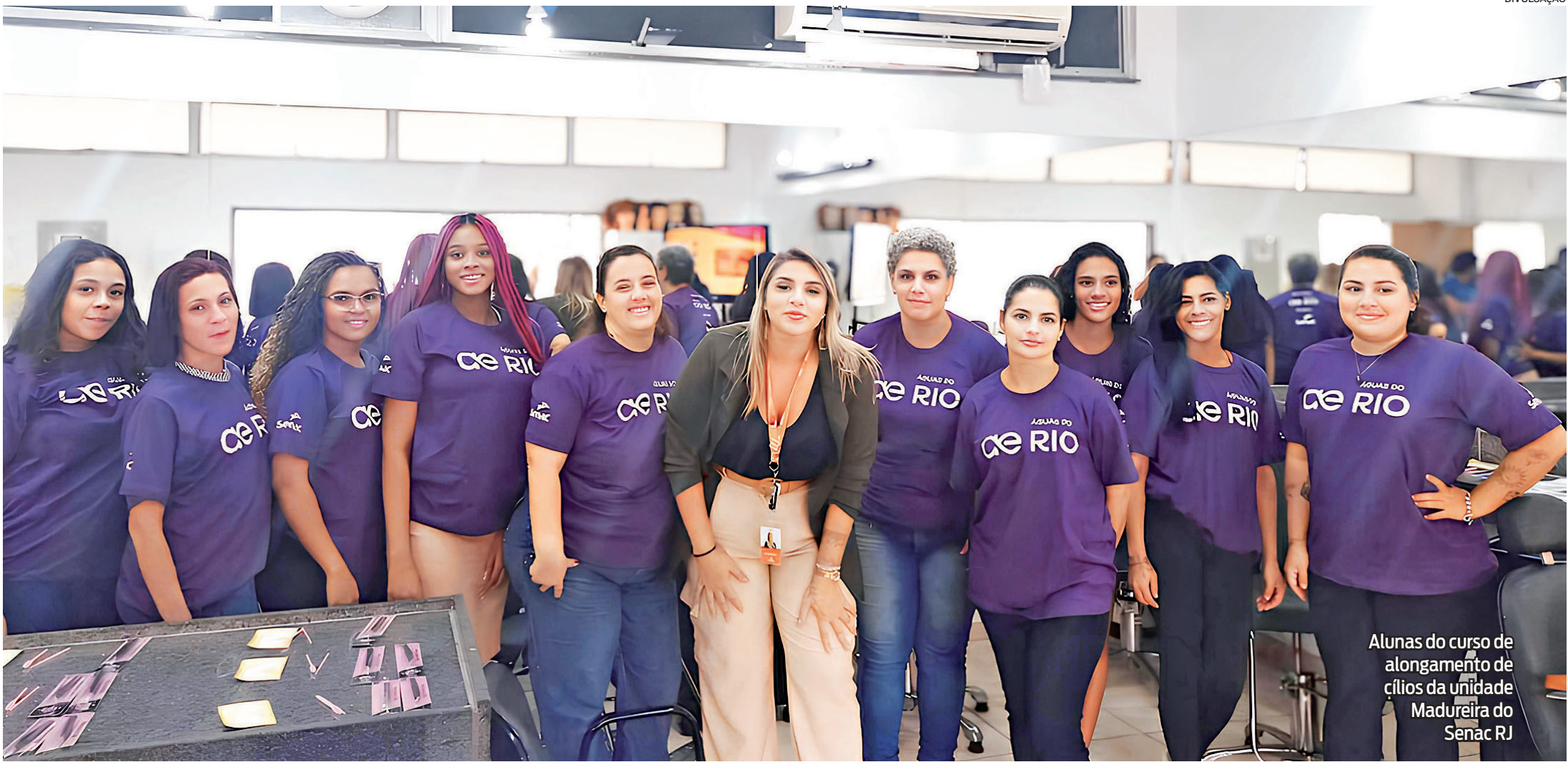
Alunas do curso de alongamento de cílios da unidade Madureira do Senac RJ