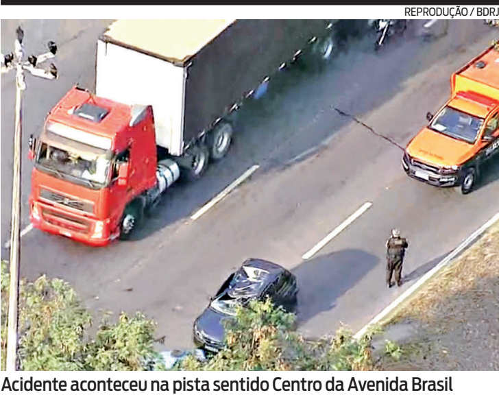
Acidente aconteceu na pista sentido Centro da Avenida Brasil

Um acidente envolvendo um articulado do BRT e uma moto, na manhã de ontem, deixou o motociclista ferido, na pista sentido Barra, da Aveni-da das Américas, no Re-creio dos Bandeirantes, na Zona Oeste. Com a co-lisão, o veículo ficou em-baixo do ônibus. Segundo o Corpo de Bombeiros, o quartel da região foi acionado às 10h para atender ao aci-dente, na saída do Túnel Grota Funda. No local, os agentes encontraram o homem, que não teve identidade revelada, com ferimentos moderados. Ele foi levado ao Hospital Municipal Pedro II, em Santa Cruz. De acordo com teste-munhas que presenciar-am o momento do aci-dente, o condutor da moto fez uma conversão proibi-da entre as estações Pon-tal e Dom Bosco e colidiu com o articulado, que fa-zia a linha 13 (Mato Alto x Alvorada - Expresso), sen-tido Alvorada.