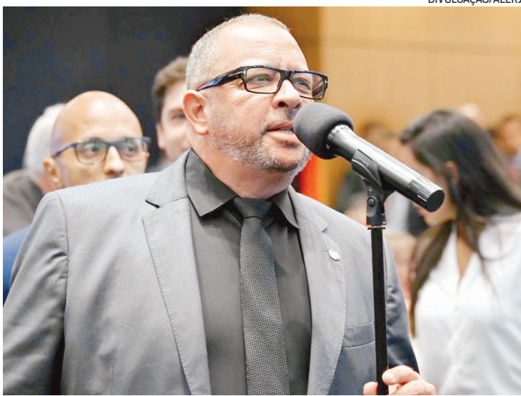
Deputado Guilherme Delaroli é autor do Projeto de Lei 1432/2023

O PL obriga as empresas de aplicativos de entrega a instalarem pontos de apoio aos entregadores em locais de alta demanda de pedidos, com infraestrutura adequada, disponibilizando: água potável; banheiro; refeitório com mesas, cadeiras e micro-ondas; ambiente para descanso, além de pontos de energia para recarga de celular, wi-fi gratuito e estacionamento para moto e bicicleta.