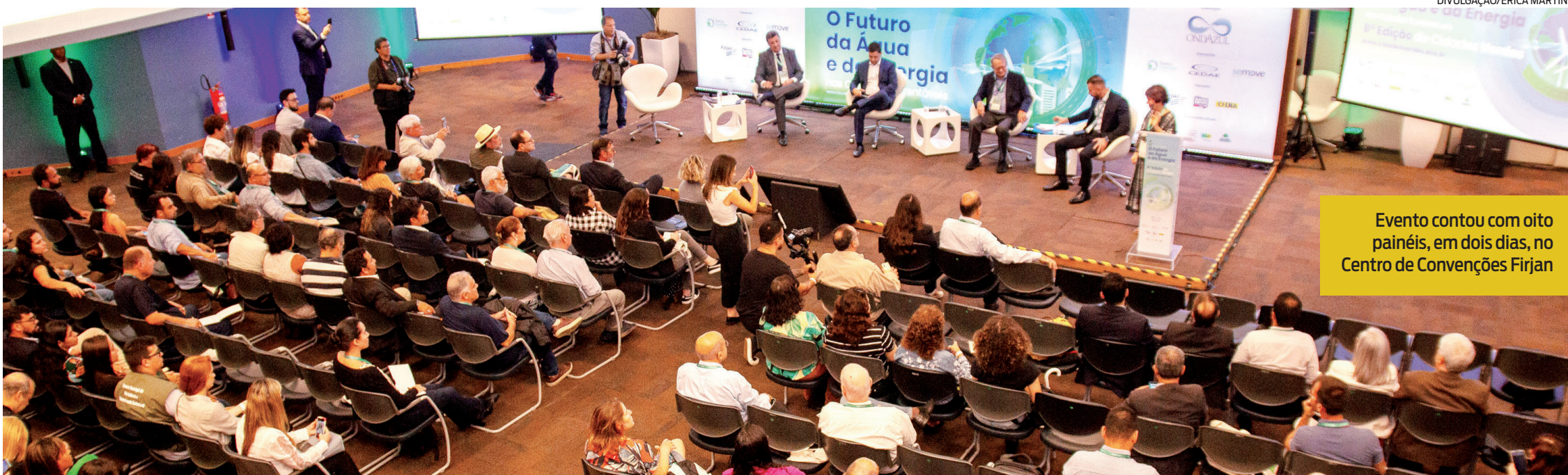
Evento contou com oito painéis, em dois dias, no Centro de Convenções Firjan