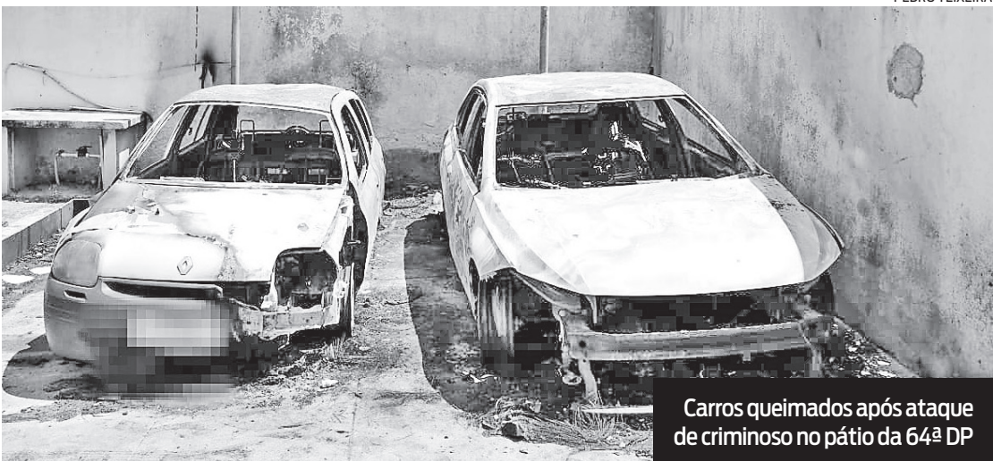
Carros queimados após ataque de criminoso no pátio da 64ª DP

O caso aconteceu na Rua Doutor Arruda Negreiros, no bairro São Mateus, e o Corpo de Bombeiros precisou ser acionado para combater o fogo. De acordo com informações da corporação, soldados do quartel do município chegaram ao local às 5h10 e as chamas foram con-