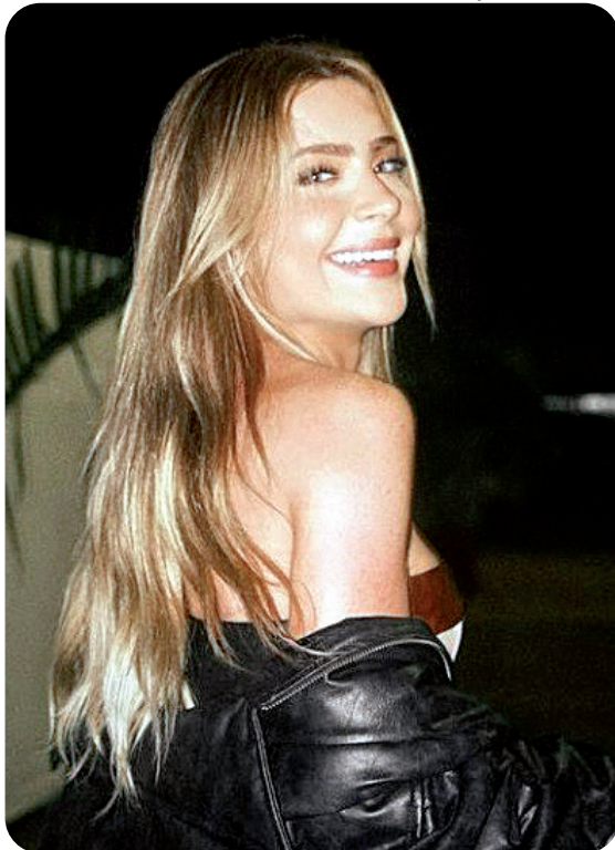
O cabelo de Jade Picon está no tom ‘luz radiante’