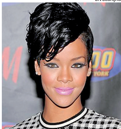
Udam ocut in nonferum oculiam

Agora, para as fashionistas de plantão, os lenços vêm com tudo, principalmente na cabeça. Se usá-lo amarrado ao boné, você ainda garante um visual despojado. E os lenços já foram destaque na cabeça de famosos no Rock in Rio! Essas tendências prometem transformar o guarda-roupa da primavera 2024, trazendo frescor e modernidade aos looks do dia a dia. E aí, qual desses estilos você está mais animada para experimentar?