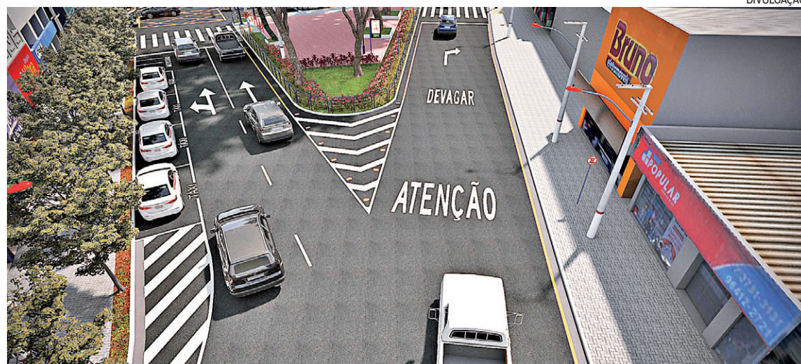
Obra prevê retirada da rotatória da Mumbuca e operação de semáforos no local