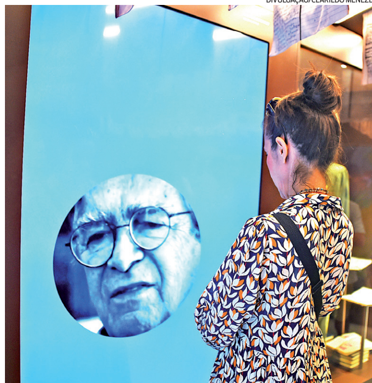
Casa fica aberta de quarta-feira a domingo, das 10h às 19h

O Museu Casa Darcy Ribeiro conta com duas salas de cinema, espaço para gravação de podcast (de uso público mediante agendamento), sala de karaokê, sala de vídeo interativa, sala de espelhos infinitos e mais, sempre usando música (destaque para ritmos