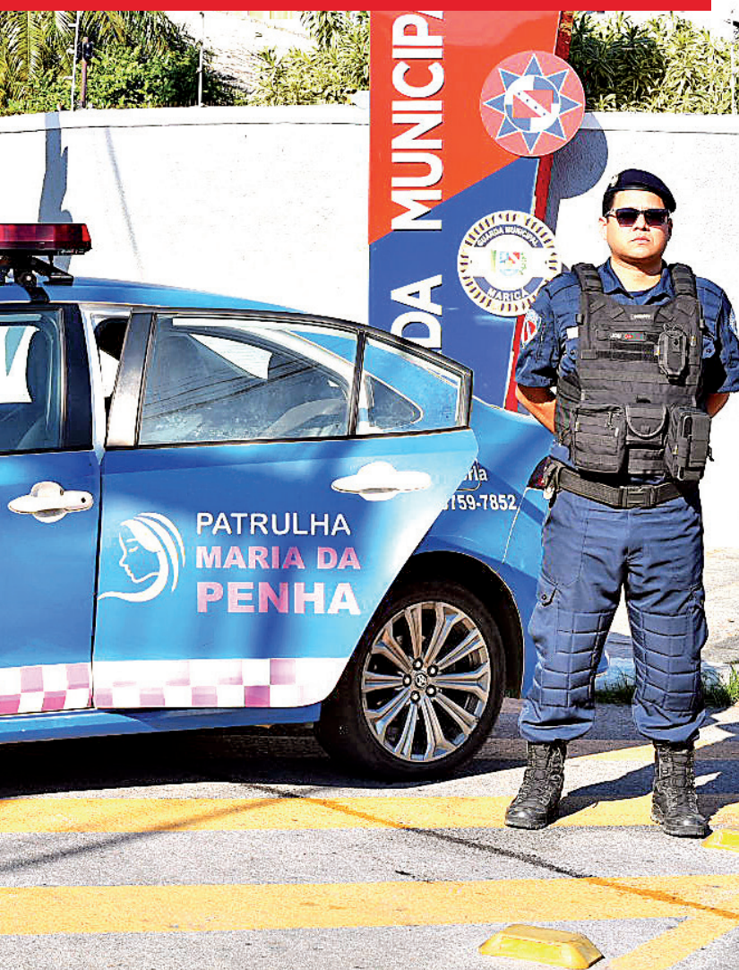
18 agentes e duas viaturas. O atendimento acontece 24 horas