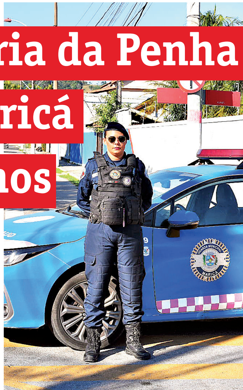
As equipes do Grupamento Maria da Penha da Guarda Municipal contam com

As vítimas podem solicitar acompanhamento da Guarda Municipal na Casa da Mulher (Rua Vereador Luiz Antônio da Cunha, 50 - Centro) ou por meio dos telefones (21) 96809-1516 (Disk Seop) e 153 (Guarda Municipal).