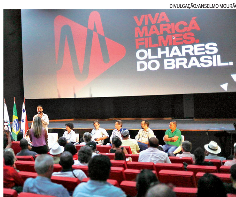
Maricá Filmes foi lançada em evento realizado no Cine Henfil

Em 23 de maio, a Prefeitura lançou a Maricá Filmes, primeira plataforma de streaming pública do país, com 65 obras, entre séries e longas-metragens. O aplicativo traz um catálogo repleto de atrações gratuitas, que está disponível para sistemas Android e IOS e também pode ser acessado na versão online no site www.maricafilmes.com.br . A iniciativa é uma encomenda tecnológica do Instituto de Ciência, Tecnologia e Inovação de Maricá (ICTIM), em parceria com a Secretaria de Cultura. No início da cerimônia, realizada no Cine