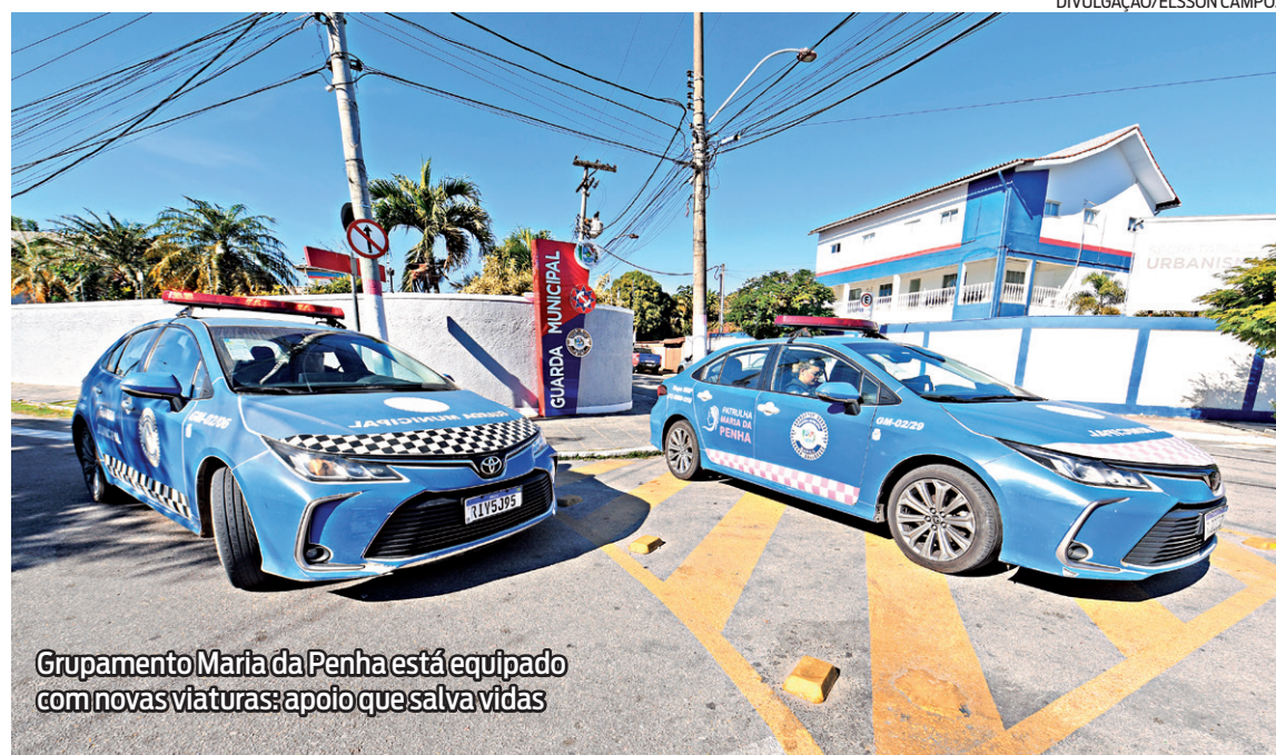
Grupamento Maria da Penha está equipado com novas viaturas: apoio que salva vidas