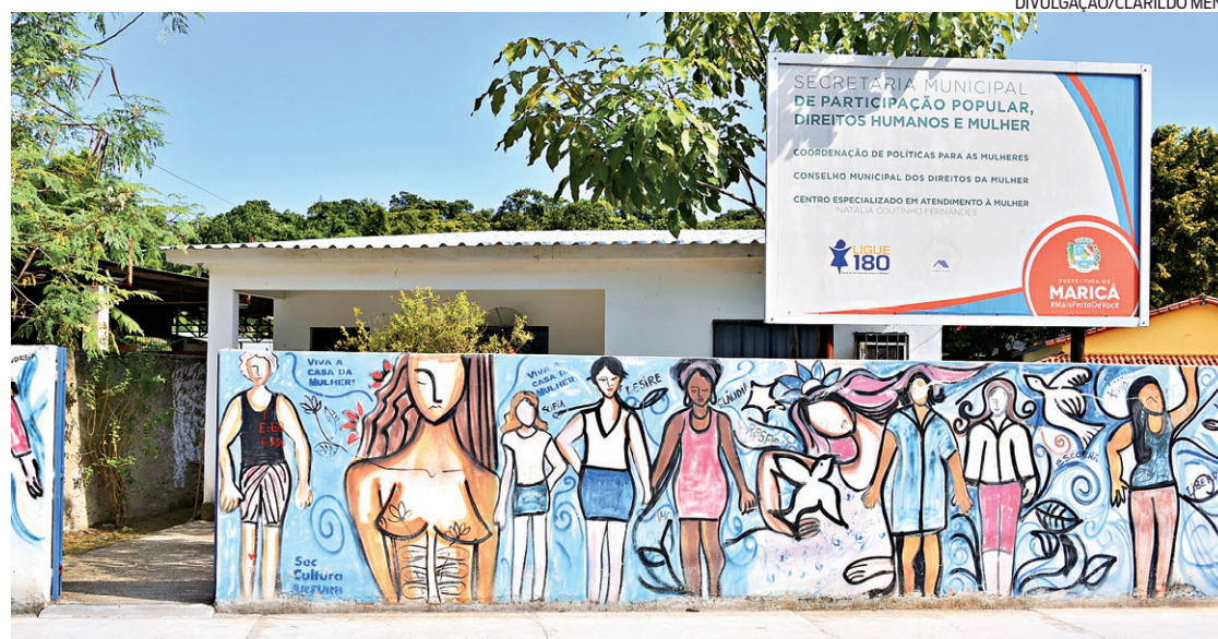
Casa da Mulher oferece acolhimento a vítimas de violência física, sexual, institucional e patrimonial