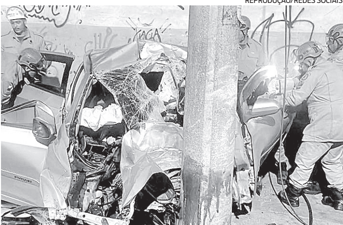
Imagem publicada por testemunha mostra veículo destruído