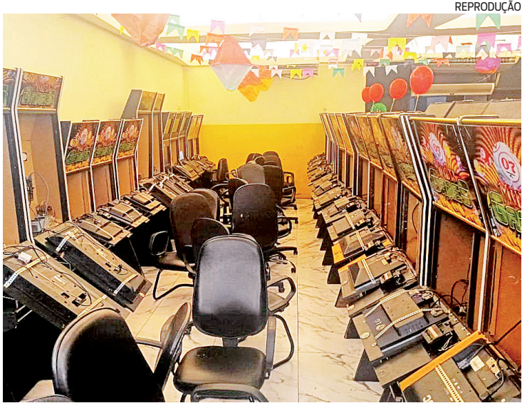
Mais de 100 pessoas foram encontradas no bingo clandestino

A PM apreendeu 83 máquinas caça-níqueis, mais de R$ 5 mil em dinheiro e um telefone celular