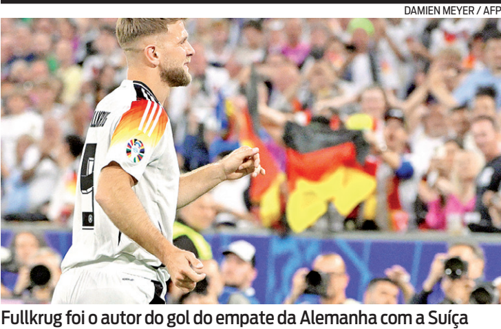
Fullkrug foi o autor do gol do empate da Alemanha com a Suíça