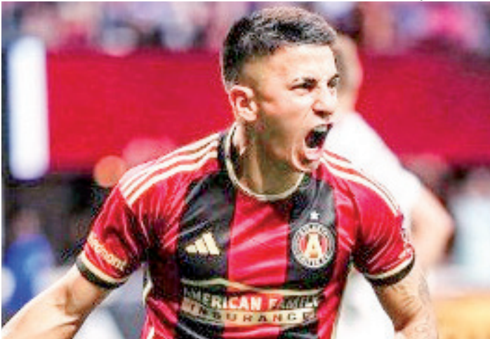
O meia argentino pode reforçar o clube a partir de julho