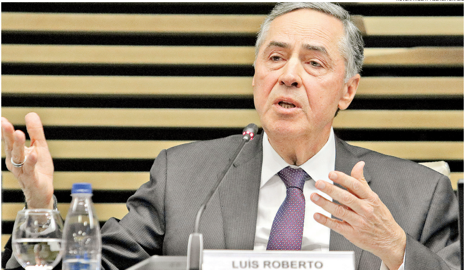
De acordo com Luís Roberto Barroso, a IA tem capacidade de tomada de decisão melhor que o ser humano em algumas matérias

O magistrado ponderou, por outro lado, que há uma preocupação quanto ao impacto da IA no mercado de trabalho, com perda de profissões existentes hoje, além da utilização da tecnologia para fins bélicos, violação da privacidade devido ao amplo uso de dados e a discriminação algorítmica. Ele citou ainda que o risco da massificação da desin-