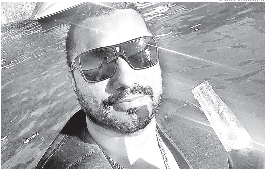
Vítima passou por cirurgia, mas apresentou agravamento de seu estado de saúde e não resistiu

A explosão deixou outras oito pessoas feridas, incluindo um bebê, outra criança e uma mulher grávida. De acordo