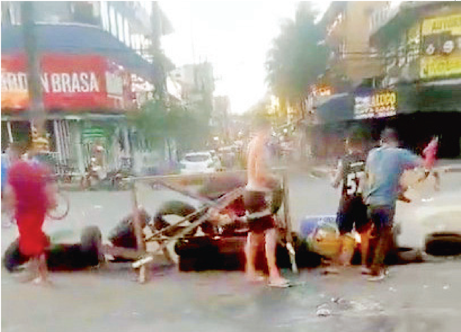
Moradores da localidade conhecida como Chico City ergueram barricadas e colocaram fogo em pneus e pedaços de madeira em pontos da região, que vive onda de violência

A Gardênia Azul vive onda de violência por conta da disputa por território entre criminosos rivais