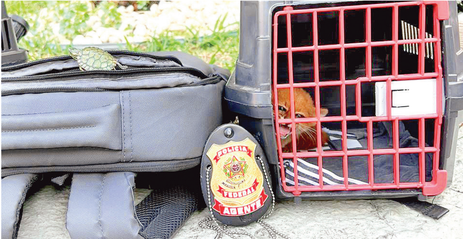
Além do gato-mourisco, a Polícia Federal também apreendeu com os suspeitos um veículo, celulares e uma máquina de cartão de crédito

Caso condenados, eles poderão ter aumento de pena, em razão de um dos animais ser ameaçado de extinção.