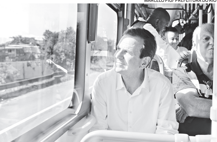
Paes diz que nova conexão será mais rápida e com ônibus novos

“Um dos principais problemas para quem está usando o BRT, e já melhorou muito, tem sido conseguir ônibus para chegar nos terminais, especialmente o Terminal de Deodoro. Então, essa conexão BRT vai ser uma linha normal, só que mais rápida e com ônibus novos”, afirma o prefeito Eduardo Paes.