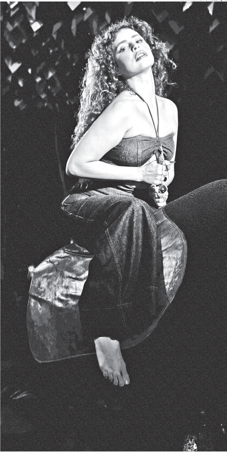
Atriz e cantora Natascha Falcão atua na novela ‘No Rancho Fundo’, da TV Globo

o desfecho, mas um desfecho esperançoso, porque o melhor sempre está por vir”, completa a artista.