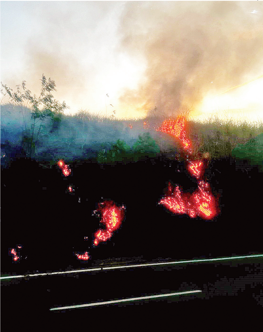
Coluna publicada às segundas-feiras, quartas-feiras e sextas-feiras

Polícia Militar fecha bingo clandestino na Tijuca RIO DE JANEIRO