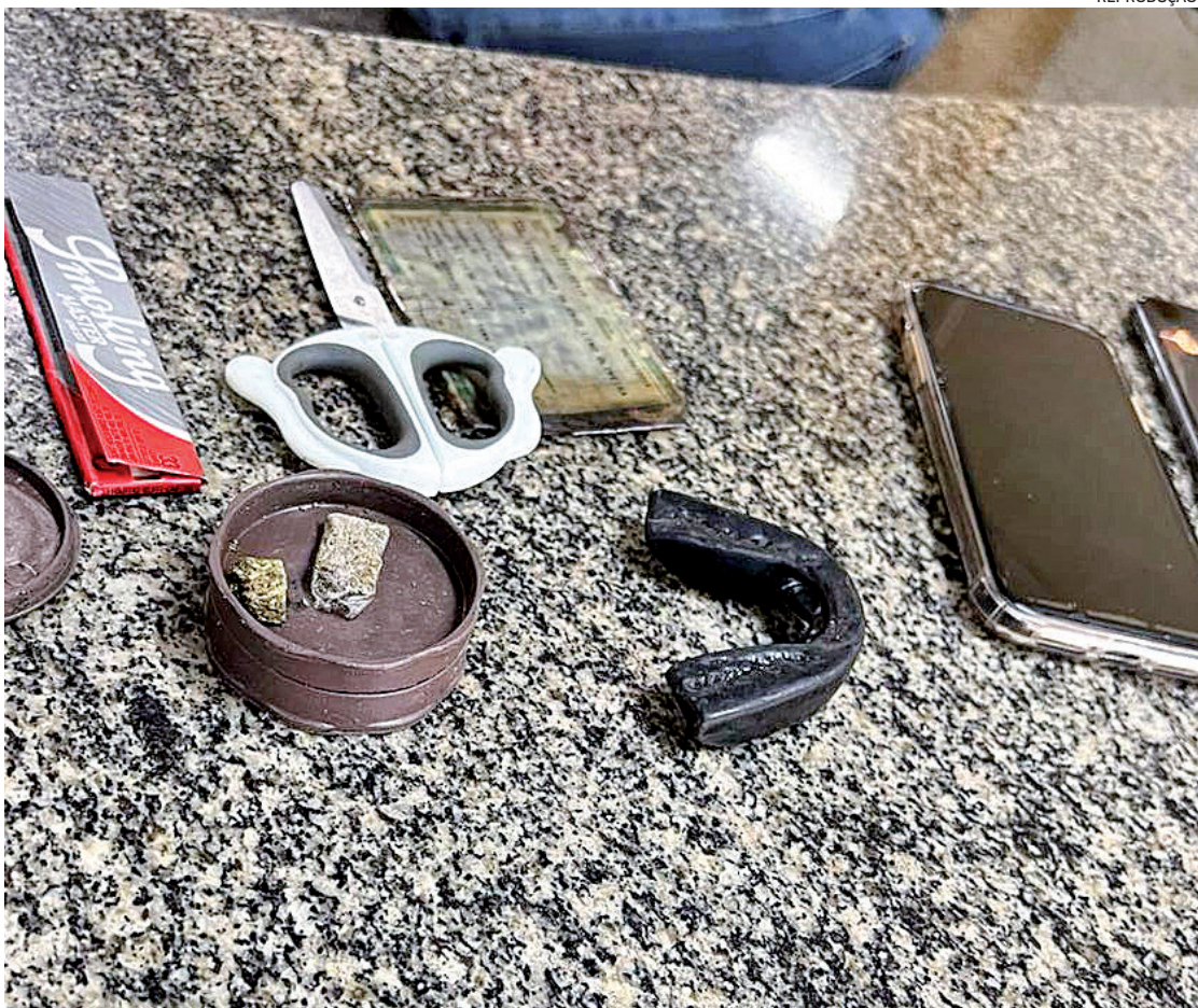
Agentes da Polícia Militar apreenderam uma tesoura, drogas, papel de seda e dois aparelhos de celular

Além da Taquara, nas redes sociais circulavam vídeos de torcedores dos dois times se envolvendo em brigas de organizadas em diferentes bairros do Rio, como em Ricardo de Albuquerque, na Zona Norte. Há