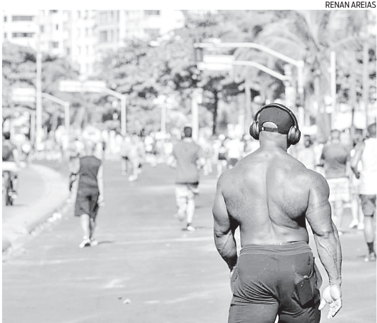
Promessa de inverno mais quente se cumpriu na cidade

Durante a manhã, foi possível ver pessoas praticando atividades ao ar livre, como pedalar de bicicleta ou correr na orla. Para se refrescar, o mergulho no mar também foi uma opção.