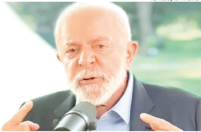
Equipe econômica de Lula vai apresentar necessidade de cortes

Local: mezanino do acesso B (Avenida Chile)