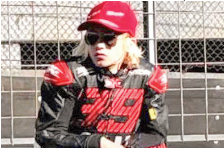
Jovem esportista comemorou o sonho de treinar no Brasil

Durante o primeiro treino livre da Jr Cup, da 4ª etapa do circuito, ele caiu da moto que pilotava após sofrer um “highside” — tipo de acidente em que há excesso de velocidade após uma curva, fazendo com que os pneus percam