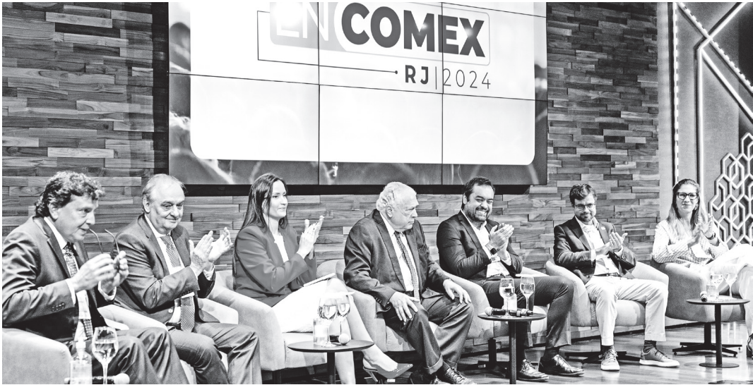
Lideranças discutem comércio exterior, sustentabilidade e inovação no EnComex RJ 2024

Na abertura, o governador do Rio de Janeiro, Cláudio Castro, destacou a importância do estado no PIB do Brasil. “O Rio é o 2º maior exportador do país, tem portos de alta profundidade, é líder em turismo, aço e petróleo. O estado tem potenciais para agora, não para o futuro. Estamos liderando a transição energética, com a única planta eólica offshore sendo testada no Brasil”, disse Castro. Representando o prefeito Eduardo Paes, o secretário municipal de Desenvolvimento Urbano e Econômico, Chicão Bulhões, ressaltou iniciativas para atrair novos investimentos, como o hub Porto Maravalle e a recuperação do aeroporto internacional do Galeão.