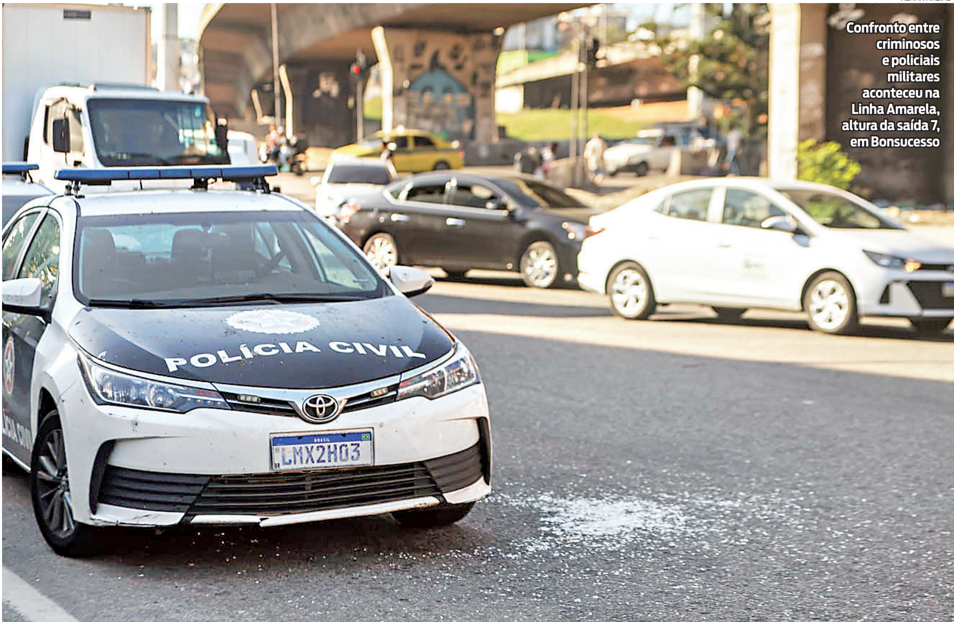
Confronto entre criminosos e policiais militares aconteceu na Linha Amarela, altura da saída 7, em Bonsucesso