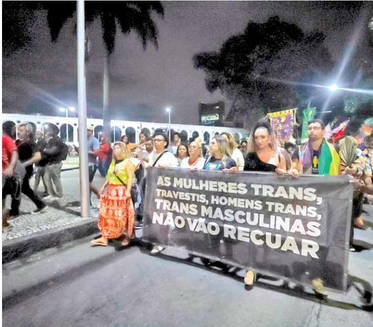
Manifestação no Rio cobrou justiça para vítimas de LGBTfobia

informou o delegado Bruno Ciniello, titular da delegacia da Lapa, sem, no entanto, informar quantas pessoas foram indiciadas pelo crime. Em janeiro, onze seguranças foram intimados a depor. Uma das vítimas, que terá a identidade preservada, diz se sentir grata por ter sobrevivido. “A vida seguiu. Isso é o mais importante. Não viamos estatística”, ressalta. “Nos primeiros meses foi difícil. Nunca acreditamos que aconteceria com a gente. Foi um processo de muita insegurança de ter medo na rua e nos lugares. Ficamos pelo menos dois meses trancadas em casa”, conta.