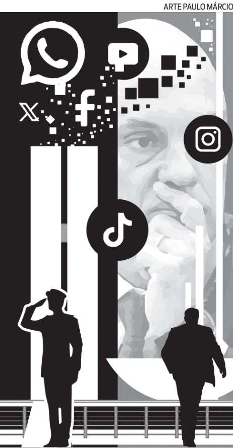
ARTE PAULO MÁRCIO

Já o Supremo Tribunal Federal (STF) tem se posicionado como um poder moderador de fato, apesar de a Constituição de 1988 não prever tal função. Um ministro do STF afirmou certa vez: “nós já temos um semipresidencialismo com