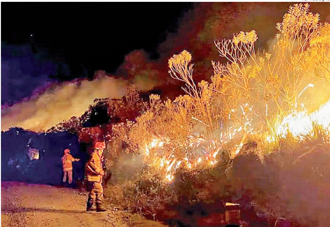
Ainda não se sabe a causa do incêndio no Parque Nacional do Itatiaia.

Incêndio no Parque Nacional do Itatiaia foi de difícil controle para o Corpo de Bombeiros, apesar do esforço coletivo. Ainda não se sabe se foi criminoso, porém, é mais um entre tantos que o estado do Rio tem sido vítima. A Comissão do Cumpra-se, da Alerj, se reuniu para debater o assunto em audiência pública do colegiado. O Inea apresentou estudo segundo o qual somente em março deste ano foram registradas 106 ocorrências de incêndios florestais, que afetaram mais de 900 hectares de mata em 10 cidades. O Colegiado também apontou as consequências que esses incêndios geram para o meio ambiente: destroem a biodiversidade, agravam a crise hídrica, contribuem para o aquecimento global, além de prejudicar a saúde da população.