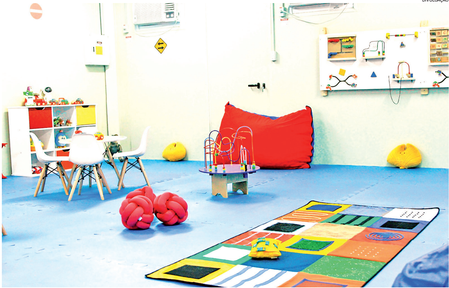
Local de acomodação, que fica na Avenida Francisco Bicalho, em São Cristóvão, acompanha os padrões para possibilitar atendimento

A Fundação Leão XIII inaugurou, nesta terça-feira (18), Dia Mundial do Orgulho Autista, um novo espaço de atendimento para pessoas com Transtorno do Espectro Autista (TEA) que buscam isenção para documentação civil. A sala de acomodação fica na unidade da Leão XIII na Avenida Francisco Bicalho, em São Cristóvão, onde funciona o posto do Detran Acessível. A sala conta com iluminação especial, músicas e sons calmantes, além de objetos táteis para interação - estrutura essencial para acomodar as necessidades sensoriais e reduzir a ansiedade do público autista na hora de buscar os serviços oferecidos no local. “Estamos falando de políticas públicas, políticas inclusivas. O objetivo principal é dar condições para o pleno atendimento das crianças com autismo. Por muitas vezes lidamos até mesmo com a desistência pela falta da estrutura adequada. Essa documentação especial vai garantir, também, acesso a uma série de direitos e garantias. Vamos acompanhar de perto essa ação, investir na capacitação dos nossos colaboradores e levar o projeto para todo o nosso estado”, ressaltou a assistente social e presidente da Fundação Leão XIII, Luciana Calaça.