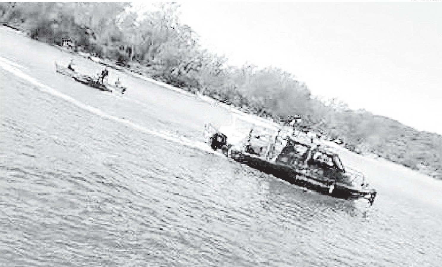
Turistas passeavam próximo à Ilha do Japonês, em Cabo Frio, na Região dos Lagos do Rio, quando a lancha explodiu momentos após abastecer

Também deram entrada no Hospital Central de Emergência outros três adultos. Destes, dois tiveram apenas escoriações leves e foram liberados. O terceiro passou por avaliação e também recebeu alta.