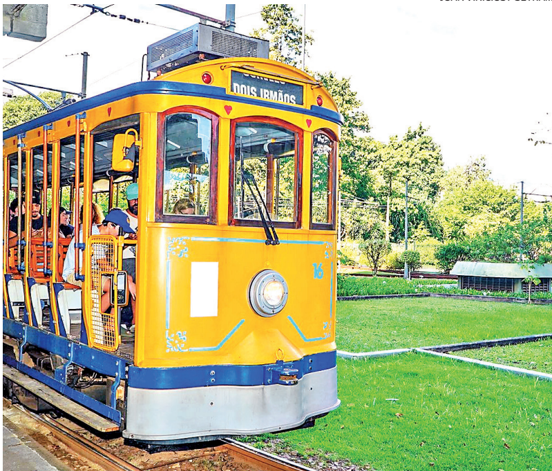
Bondinhos de Santa Teresa têm cada vez mais passageiros.

Os bondes de Santa Teresa estão atraindo cada vez mais moradores e turistas e batendo recordes, superando o número de 2019, com mais de 2 mil embarques por dia em junho. No dia 8, a marca foi de 2.196 passageiros, acima dos 2.122 usuários transportados em um único dia há cinco anos. A conclusão da obra de revitalização do sistema, que inclui a modernização da operação e a retomada do trajeto original, está prevista para o final deste ano.