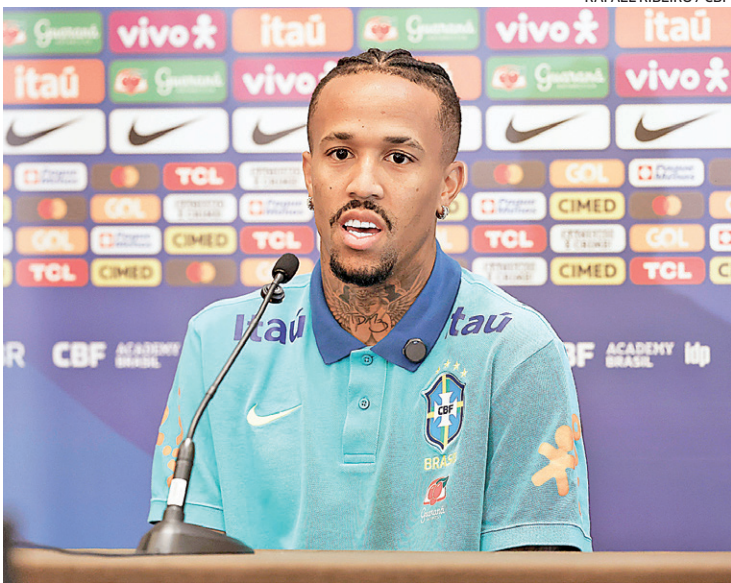
Éder Militão falou sobre sua volta à seleção em entrevista coletiva

O jogador do Real Madrid comentou ainda sobre seu período lesionado e revelou que a Copa América foi seu principal foco