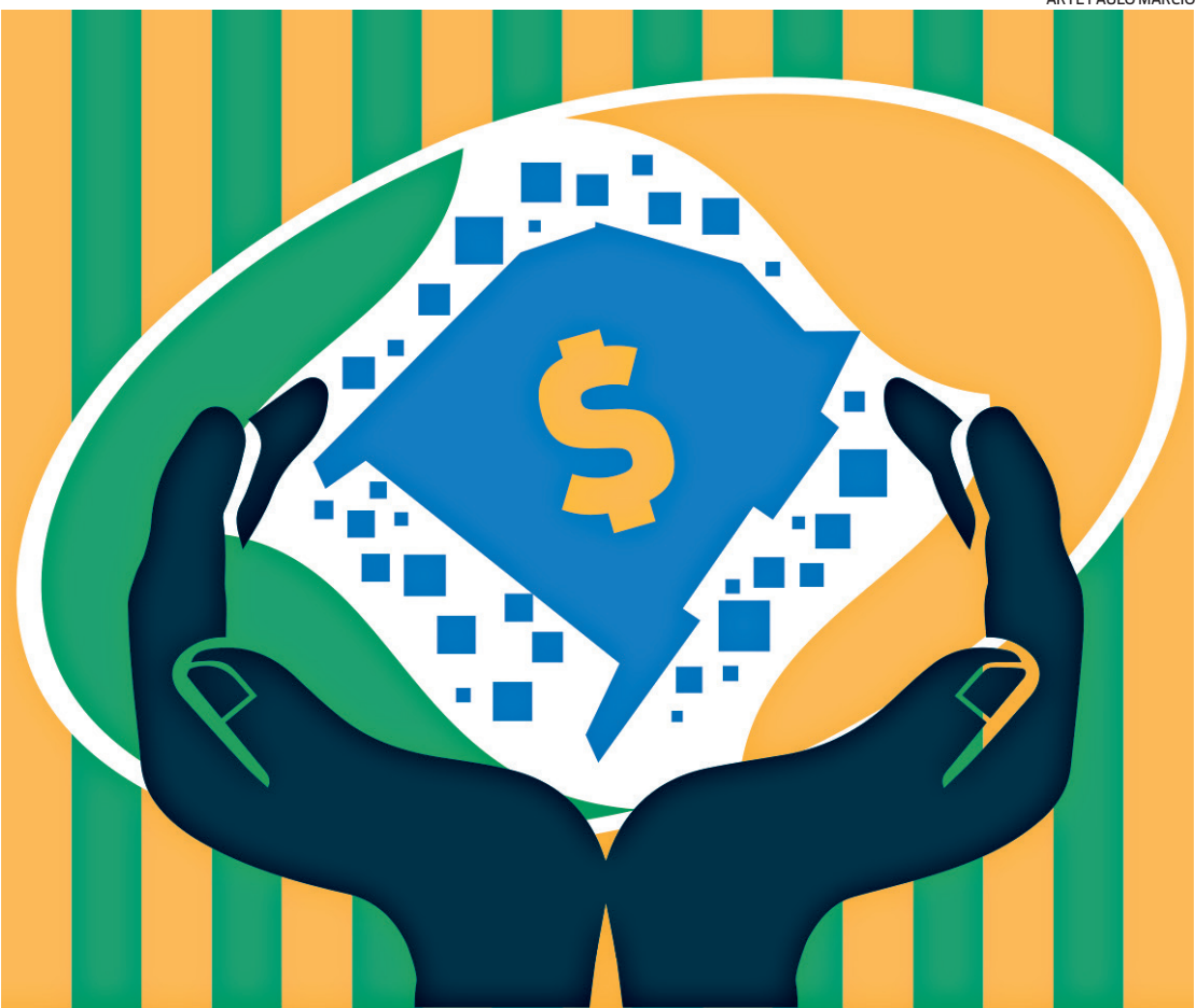
ARTE PAULO MÁRCIO

número do benefício e a renda, iniciando no dia 24 e finalizando no dia 05 de julho. Mas, não são apenas medidas relacionadas à liberação de pagamentos que o INSS anunciou. Algumas referentes à flexibilização de obrigações também foram adotadas. Por exemplo, nos municípios em estado de calamidade pública, foi sus-