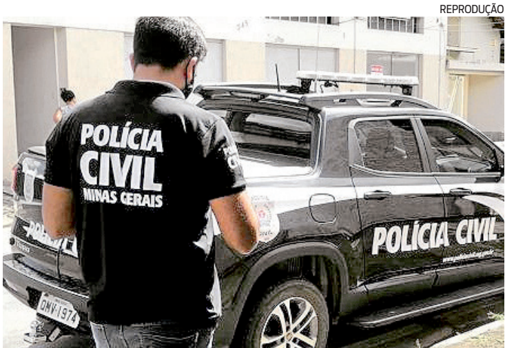
Confusão ocorreu em São João da Vereda, em Montes Claros (MG)

ram que, após a vítima ter iniciado luta corporal com um outro tio, foi surpreendida pelo investigado, que o atacou pelas costas e o apunhalou com 12 facadas, que atingiram a região escapular,