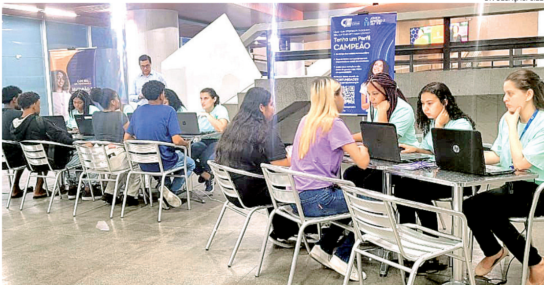
Os interessados nas vagas devem comparecer ao local com um documento de identidade com foto

As oportunidades abrangem diferentes níveis de escolaridade, incluindo ensino Médio, Técnico e Supe-