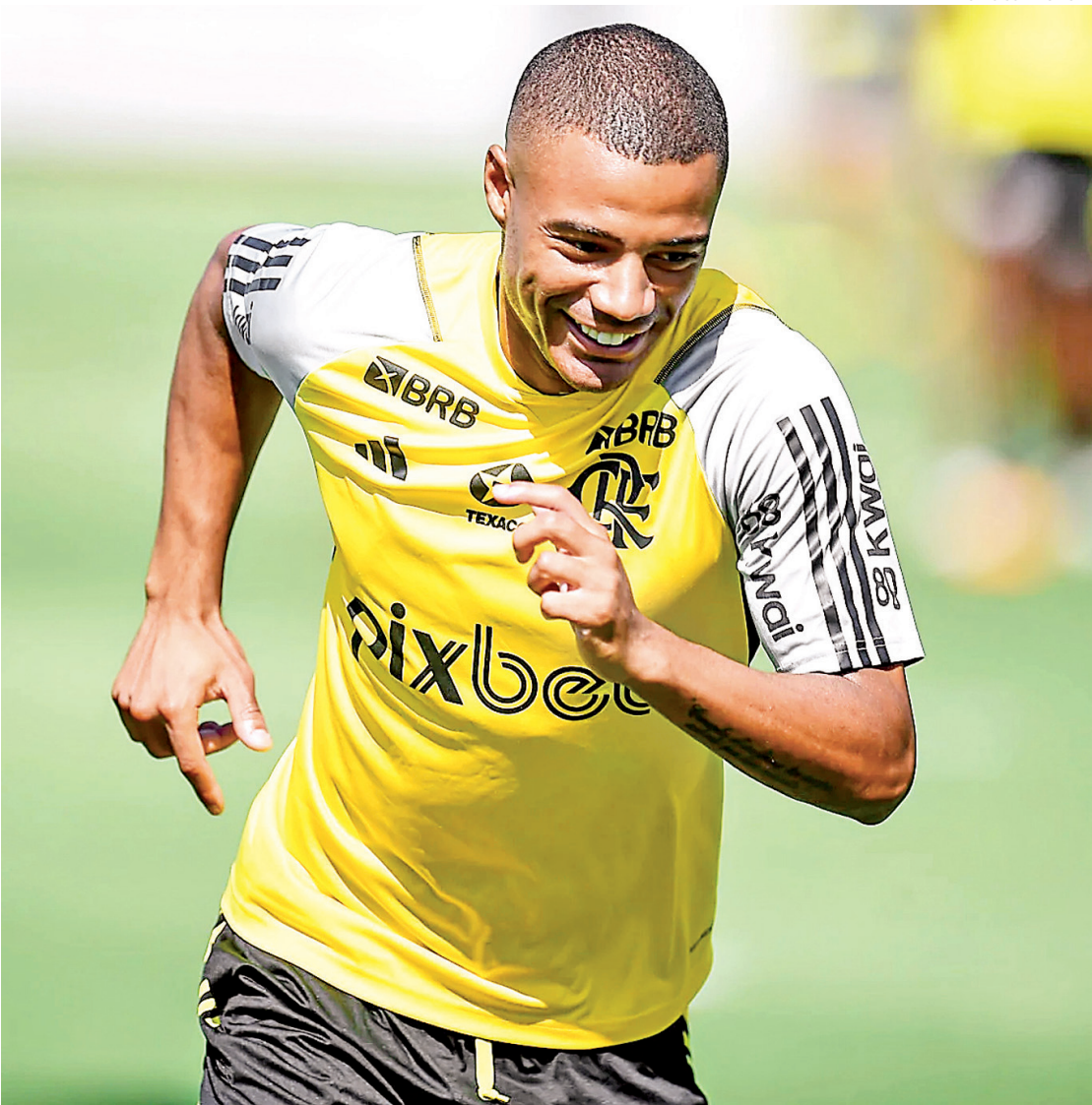
De la Cruz tem sido um dos pilares do meio de campo do Flamengo e caiu nas graças do torcedor

“Torço para que tudo se acerte. Gabigol é um garoto que merece todo o meu respeito. Fui treinador dele não só no Flamengo, mas no seu início no Santos. Então eu torço para que tudo se ajeite”, disse Dorival.