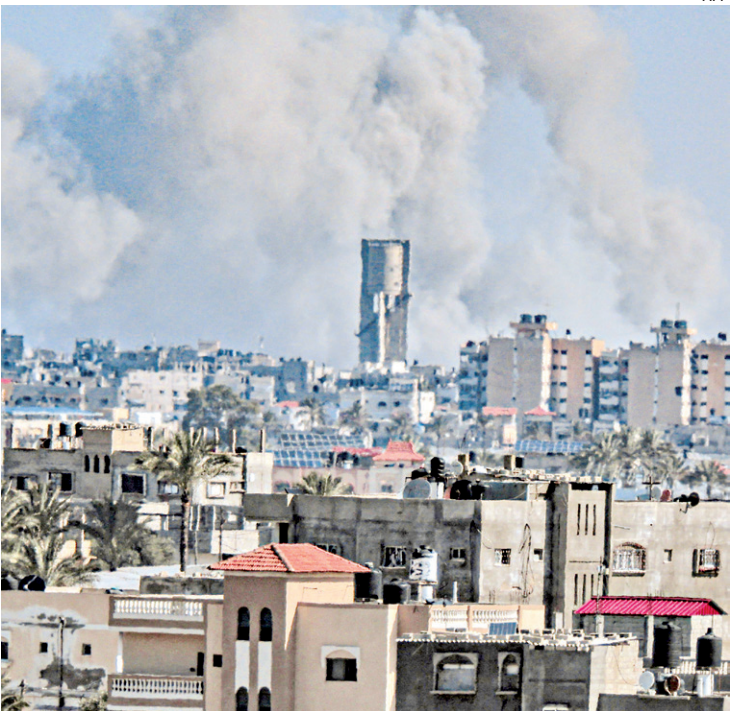
Conflito se agrava enquanto diplomacia internacional tenta trégua

Uma fonte declarou no sábado que o governo israelense tem a “intenção” de retomar as negociações esta semana.