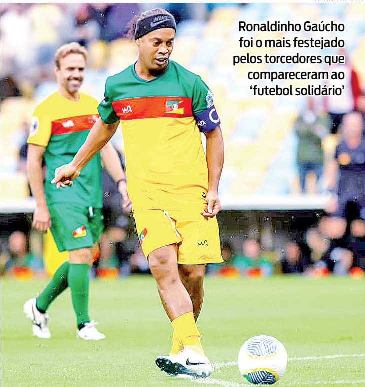
Ronaldinho Gaúcho foi o mais festejado pelos torcedores que compareceram ao ‘futebol solidário’

Ronaldinho Gaúcho marcou dois gols, deu uma assistência e mandou uma bola na trave em cobrança de falta