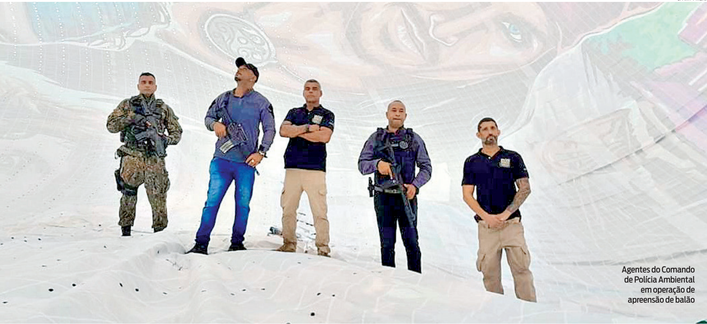
Agentes do Comando de Polícia Ambiental em operação de apreensão de balão