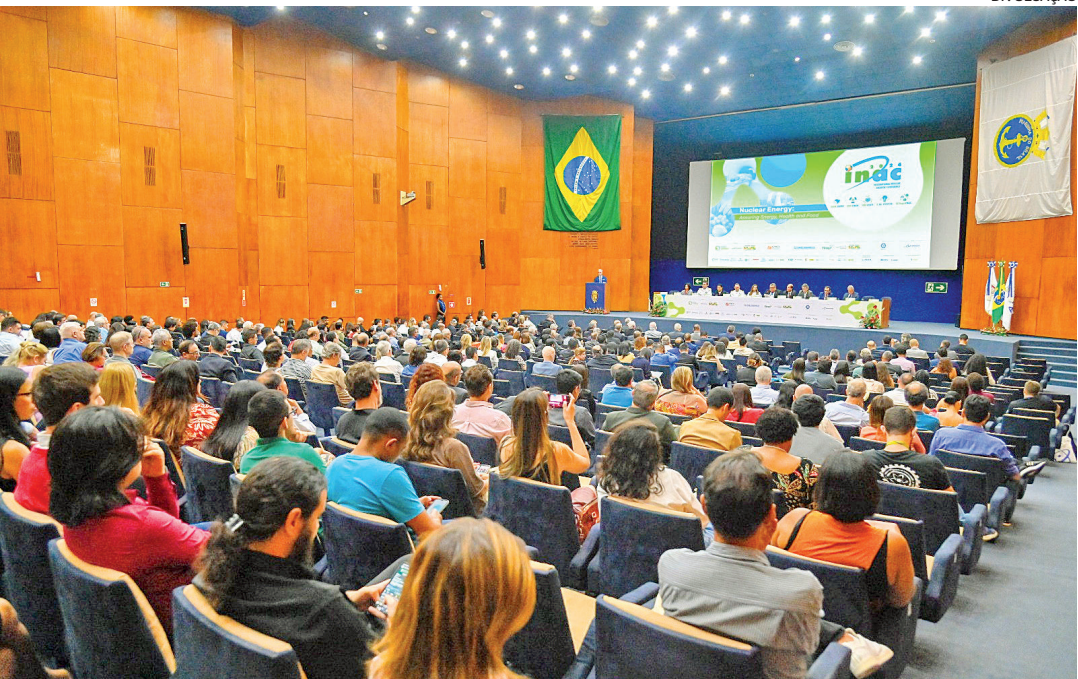
Abertura da XI INAC-2024 reuniu diversas personalidades na mesa e grande público