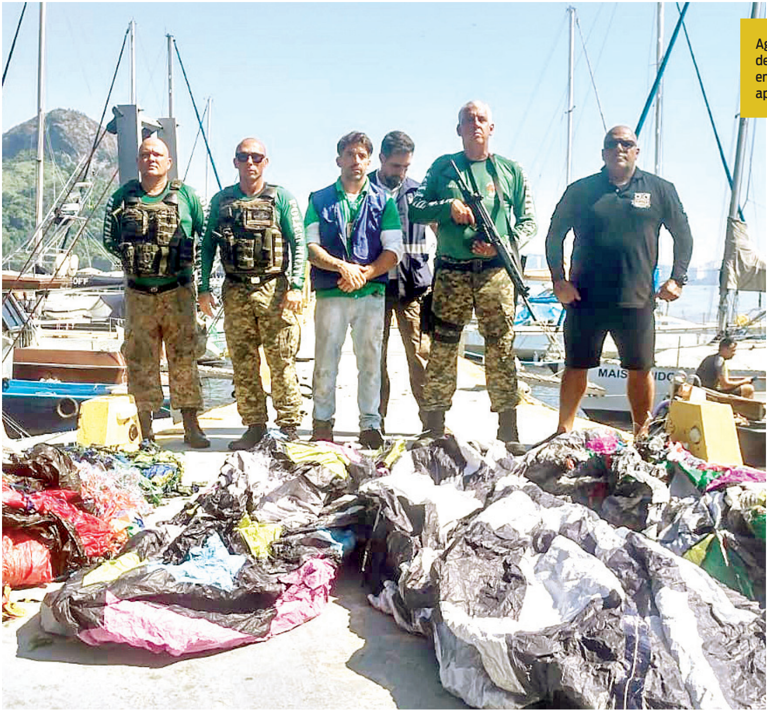
Agentes do Comando de Polícia Ambiental em frente a balão apreendido

transportar ou soltar balões de qualquer tamanho que possam causar incêndios. O objetivo é proteger as flores, plantas e vegetações, e evitar riscos para a vida humana, dos animais e plantas. A pena prevista é de 1 a 3 anos de detenção e multa. Para coibir a prática, a Polícia Militar do Estado do Rio (Pmerj) atua com o Comando de Polícia Ambiental (CPAM), que realiza operações semanais em todo o estado, por meio das oito Uni-