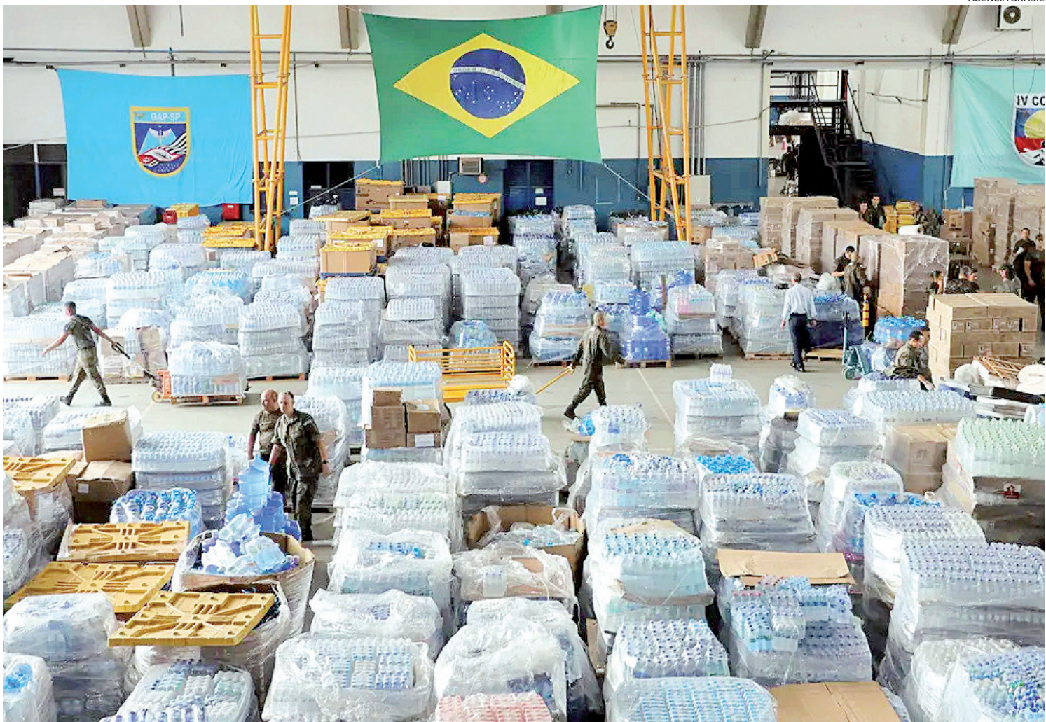
Autoridades pedem para que as doações ao Rio Grande do Sul não parem e orientam sobre quais são os itens prioritários neste momento

De acordo com o balanço mais recente do governo gaúcho, mais de 2,3 milhões de pessoas foram afetadas de alguma maneira, enquanto 581 mil foram desalojadas de suas casas. Ainda permanecem em abrigos temporários 55.813 pessoas. O número de mortes provocadas pelos temporais que atingem o Rio Grande do Sul subiu para 169 ontem.