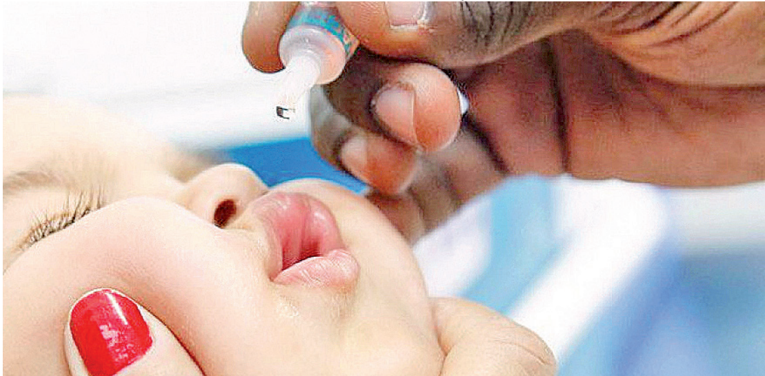
Poliomielite é uma doença grave, que pode causar paralisia infantil; 92 municípios receberão 320 mil doses

“Apesar de ter sido considerada erradicada no país há duas décadas, a poliomielite ainda preocupa a todos, principalmente, pela cobertura vacinal de muitos estados, como o Rio de Janeiro, estar abaixo da meta de 95% e estarem surgindo novos casos da doença em alguns países, aumentando o nosso risco de importação endêmica”, explica a secretária