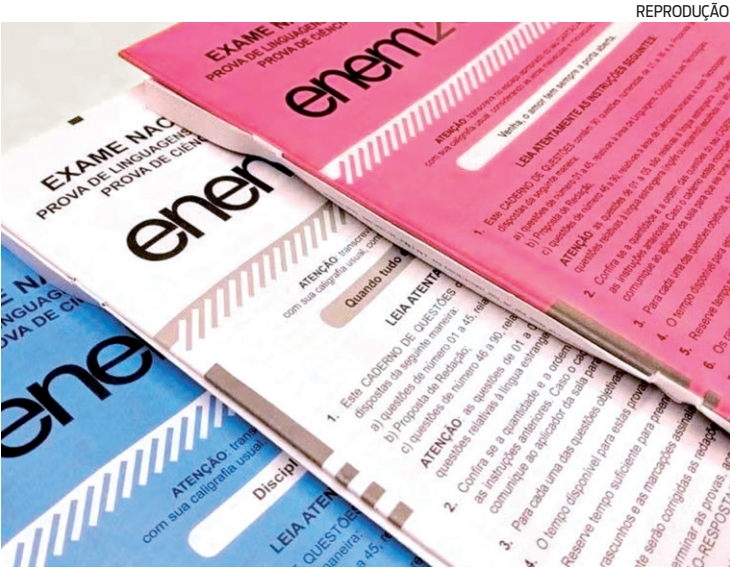
Em 2024, serão ofertadas 264.360 vagas através do Enem

O Enem 2024 será aplicado em todo o país nos dias 3 e 10 de novembro. Na primeira etapa da prova, com 5 horas e 30 minutos de duração, são avaliados os conhecimentos de redação,