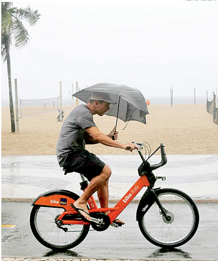
Guarda-chuva foi aliado de quem estava na Praia de Copacabana

manência, imunocomprometidas, indígenas que vivem dentro e fora de território indígena, ribeirinhos, quilombolas, gestantes e puérperas, trabalhadores da saúde, pessoas com deficiência permanente, indivíduos com comorbidades, pessoas privadas de liberdade, funcionários do sistema prisional, adolescentes e jovens que cumprem medidas socioeducativas e população em situação de rua.