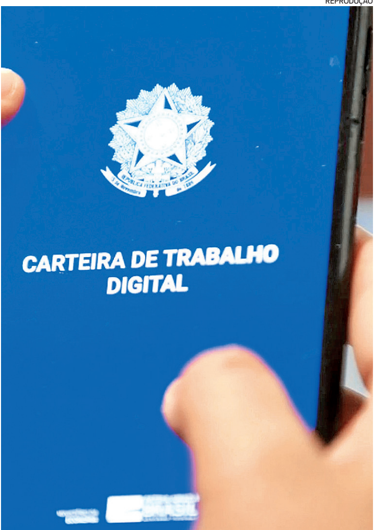
Oportunidades contemplam trabalho presencial, híbrido e remoto