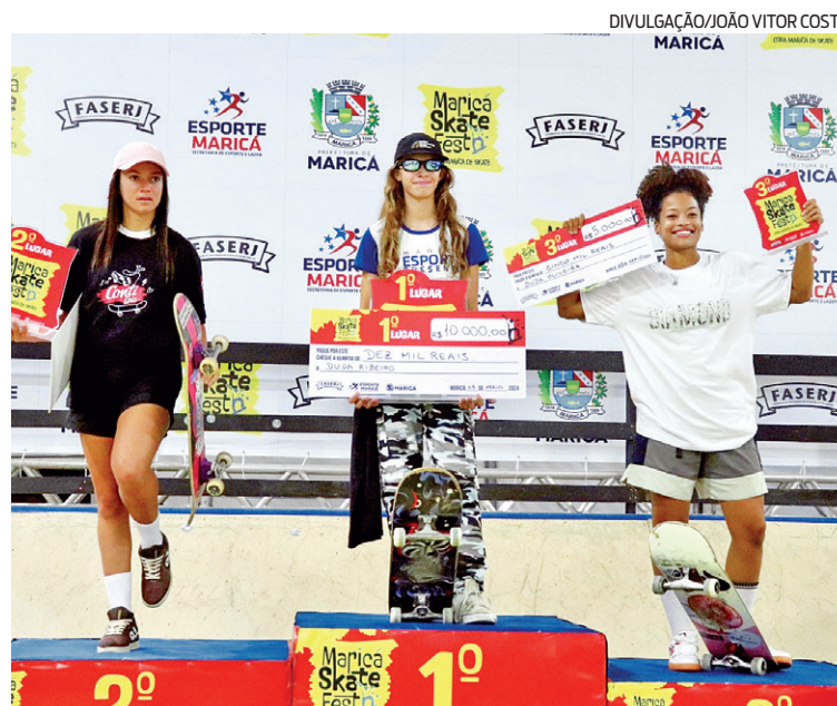
Cerca de 200 skatistas de todo o Brasil participaram da competição

"Demos início a um projeto socioesportivo há três anos atrás e nós observamos