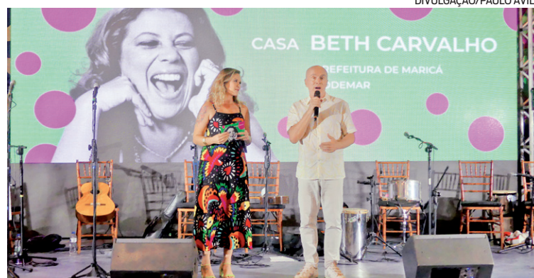
Projeto foi anunciado em 5 de maio, aniversário de 78 anos da cantora

"É o compromisso que a Codemar tem com o desenvolvimento da cultura. O turismo e a cultura são peças fundamentais para Maricá no seu desenvolvimento. Beth Carvalho sempre esteve ao lado das