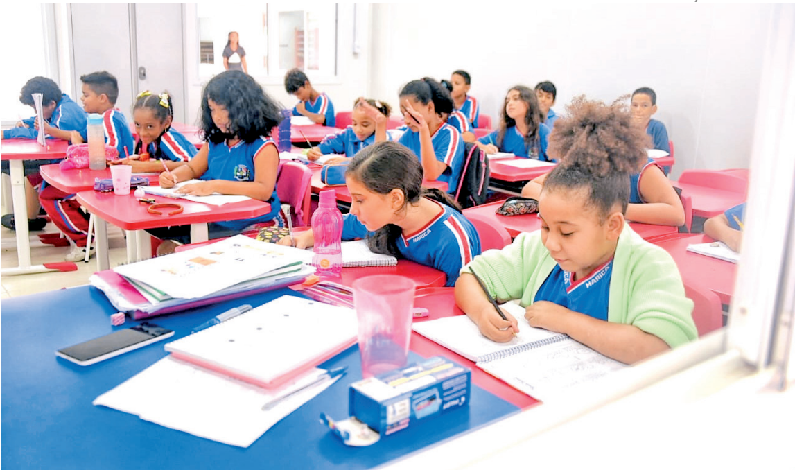
Escola Municipal Amaury Gomes do Nascimento atende 127 alunos de 4 a 5 anos de idade

A Prefeitura de Maricá fez diversas entregas à população no mês de aniversário da cidade. Demanda antiga dos moradores da região, a passarela Sócrates Brasileiro Sampaio de Souza Vieira de Oliveira, batizada assim em homenagem ao médico e ex-jogador da seleção brasileira de futebol, foi inaugurada em frente ao Hospital Municipal Dr. Ernesto Che Guevara. A administração pública