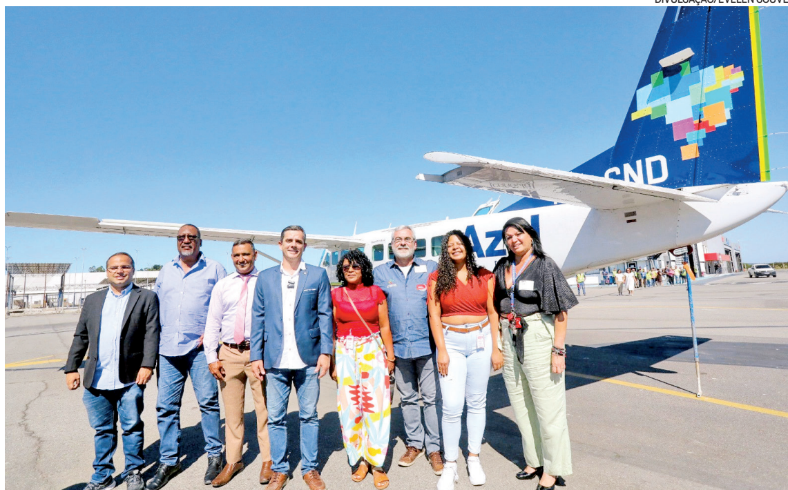
Primeira decolagem de Maricá com destino a São Paulo transportou autoridades e convidados em 06/05

"É um marco importante, pois simboliza o desenvolvimento de Maricá, fazendo com que as rotas para outros estados possam dar a Maricá essa dimensão regional.