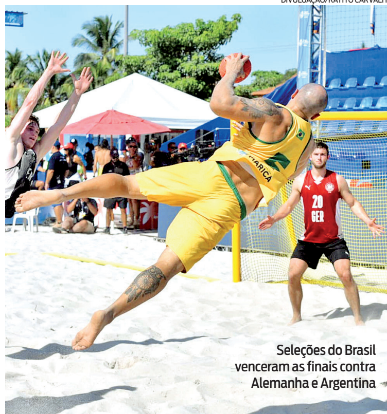
Seleções do Brasil venceram as finais contra Alemanha e Argentina

"É mais um ano onde a gente consolida o Global Tour na cidade, e neste ano