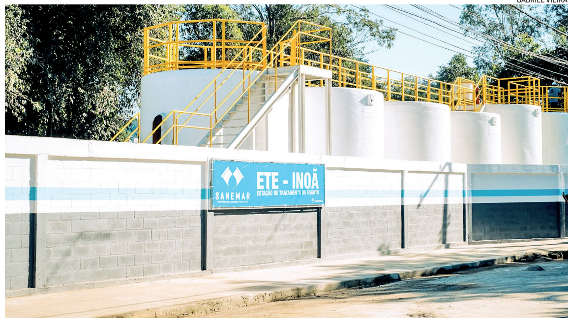
Ao todo, são R$ 525 milhões investidos na construção de 300 km de esgotamento sanitário