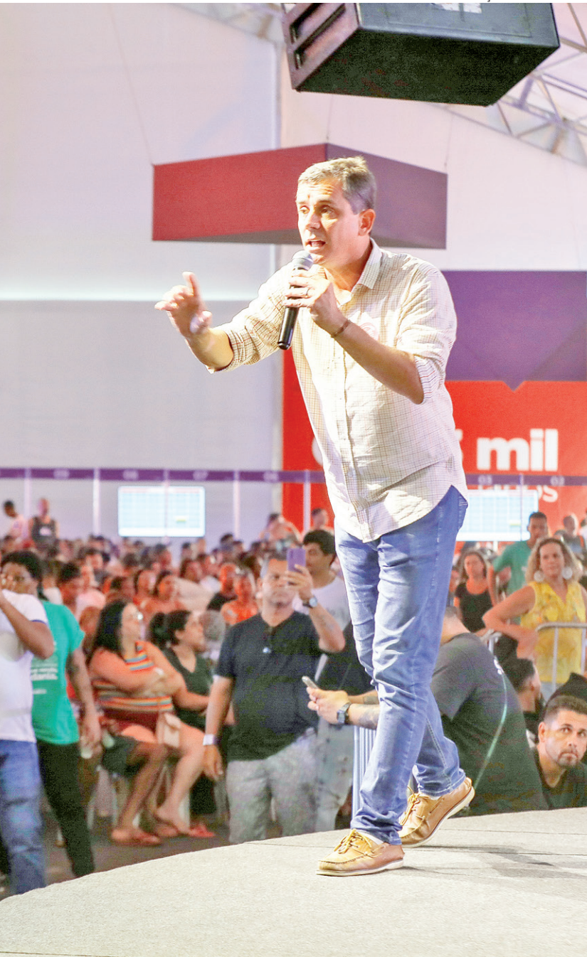
a (RBC), um dos programas sociais de maior impacto na história da cidade