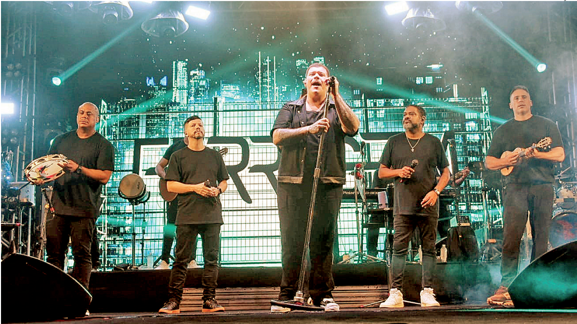
O cantor Ferrugem, um dos nomes mais famosos do pagode, se apresentou na orla de Itaipuaçu