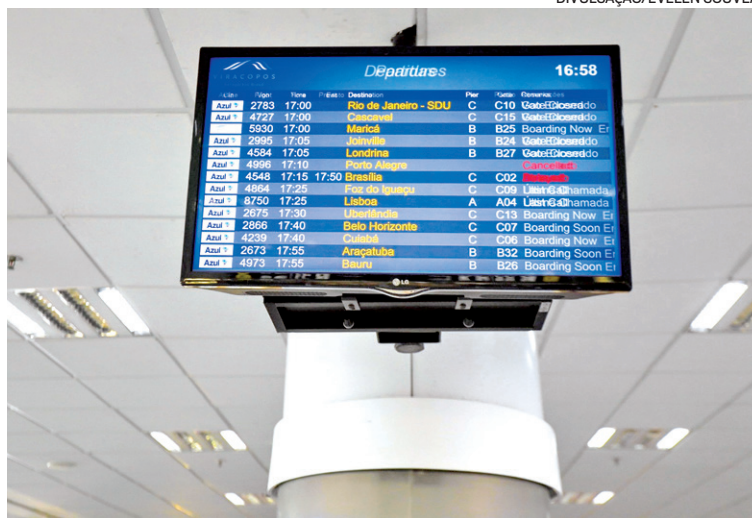
Painel de voo no aeroporto de Viracopos indica "destino Maricá"