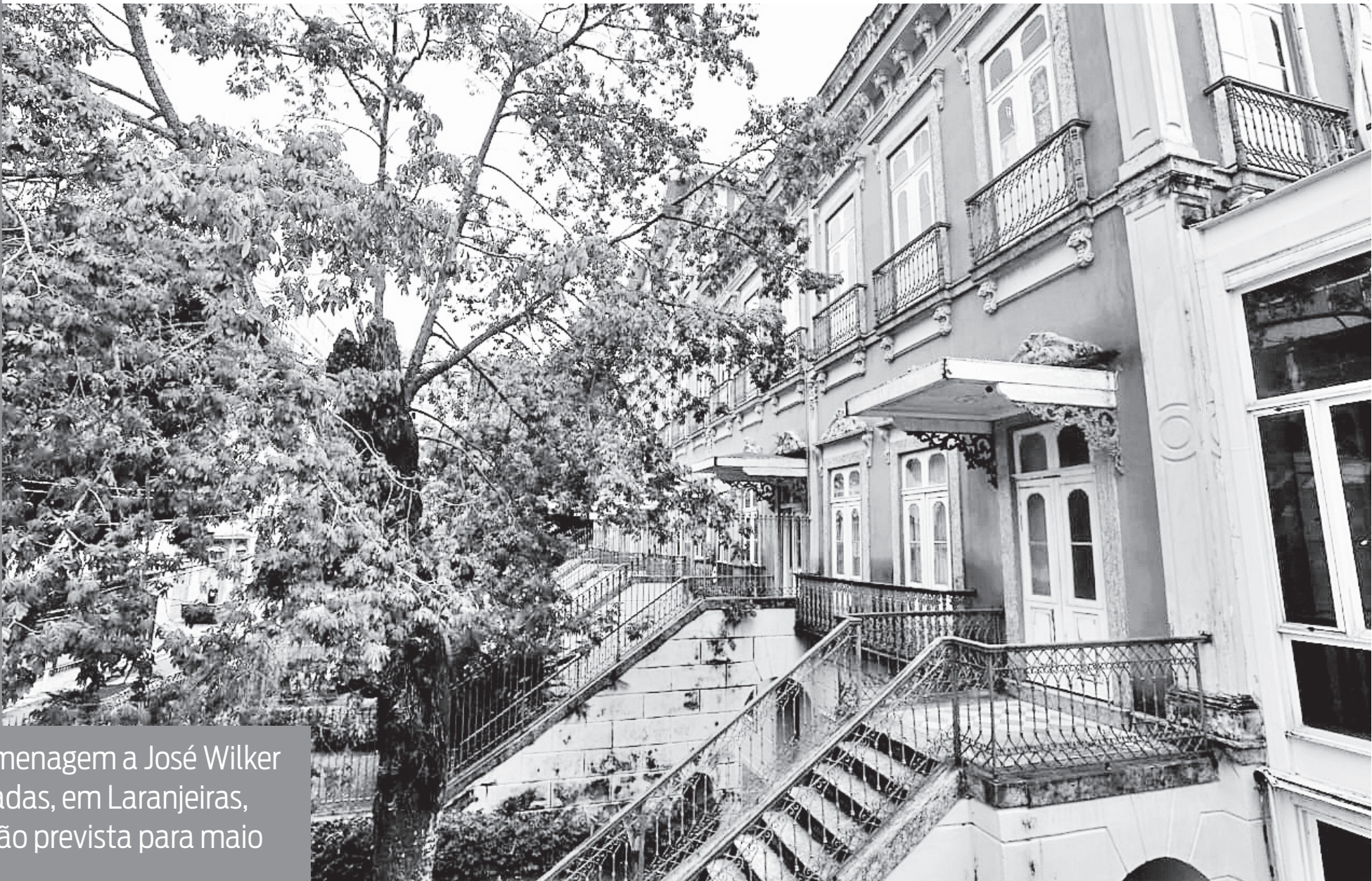
Espaço em homenagem a José Wilker nas Casas Casadas, em Laranjeiras, tem inauguração prevista para maio