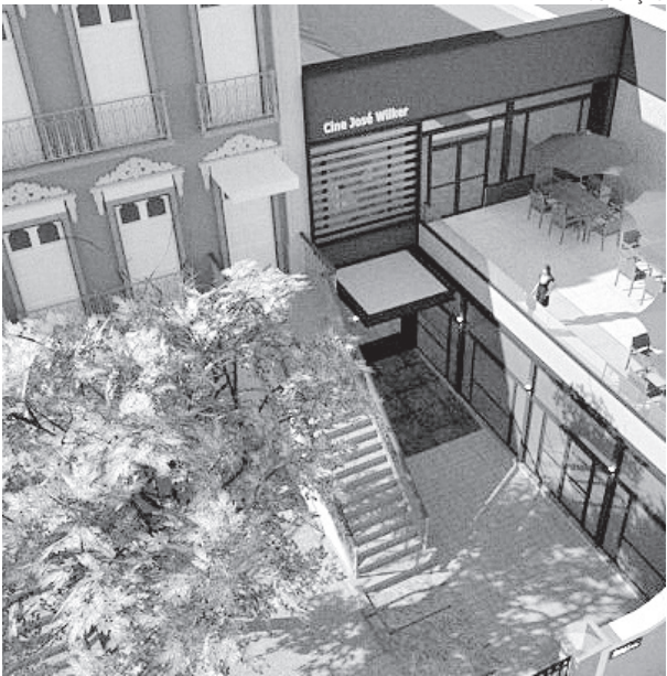
O projeto visa alcançar alunos das escolas municipais