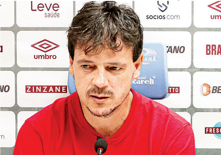
Diniz responsabilizou a imprensa pelo momento vivido no clube

“Aliás isso vale aos que ficam deformando opinião do