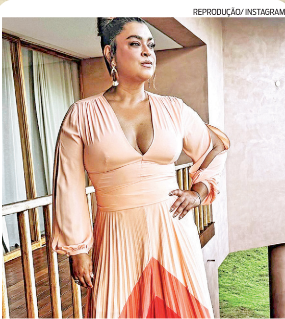
Preta Gil marcou presença em casamento