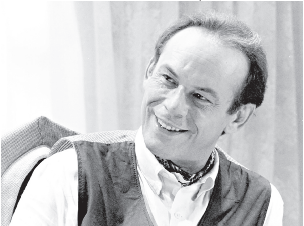
Ator José Wilker foi diretor-presidente da RioFilme