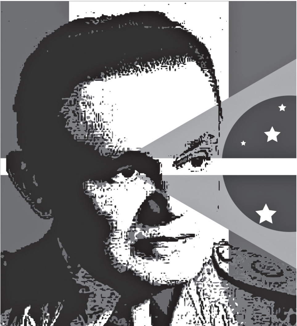
ARTE O DIA