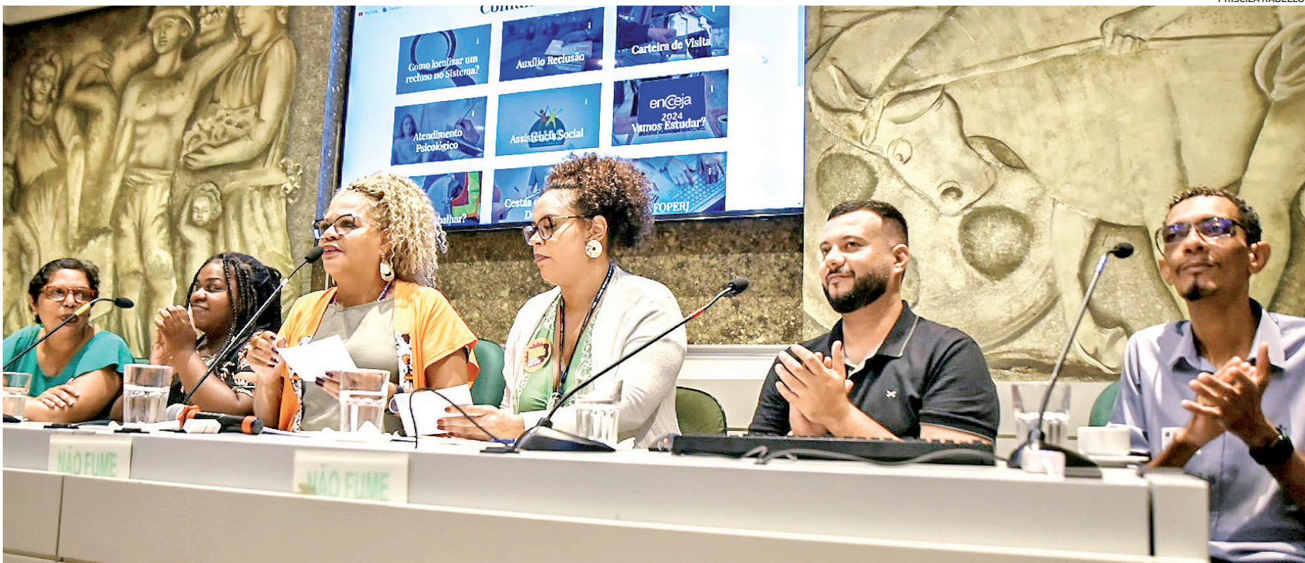
A ferramenta gratuita, divulgada na Câmara Municipal, foi criada por um ex-presidiário e orienta sobre auxílio-reclusão, facilita o acesso à Defensoria Pública e ao Detran

Quando recebeu o direito à liberdade, ele tinha como