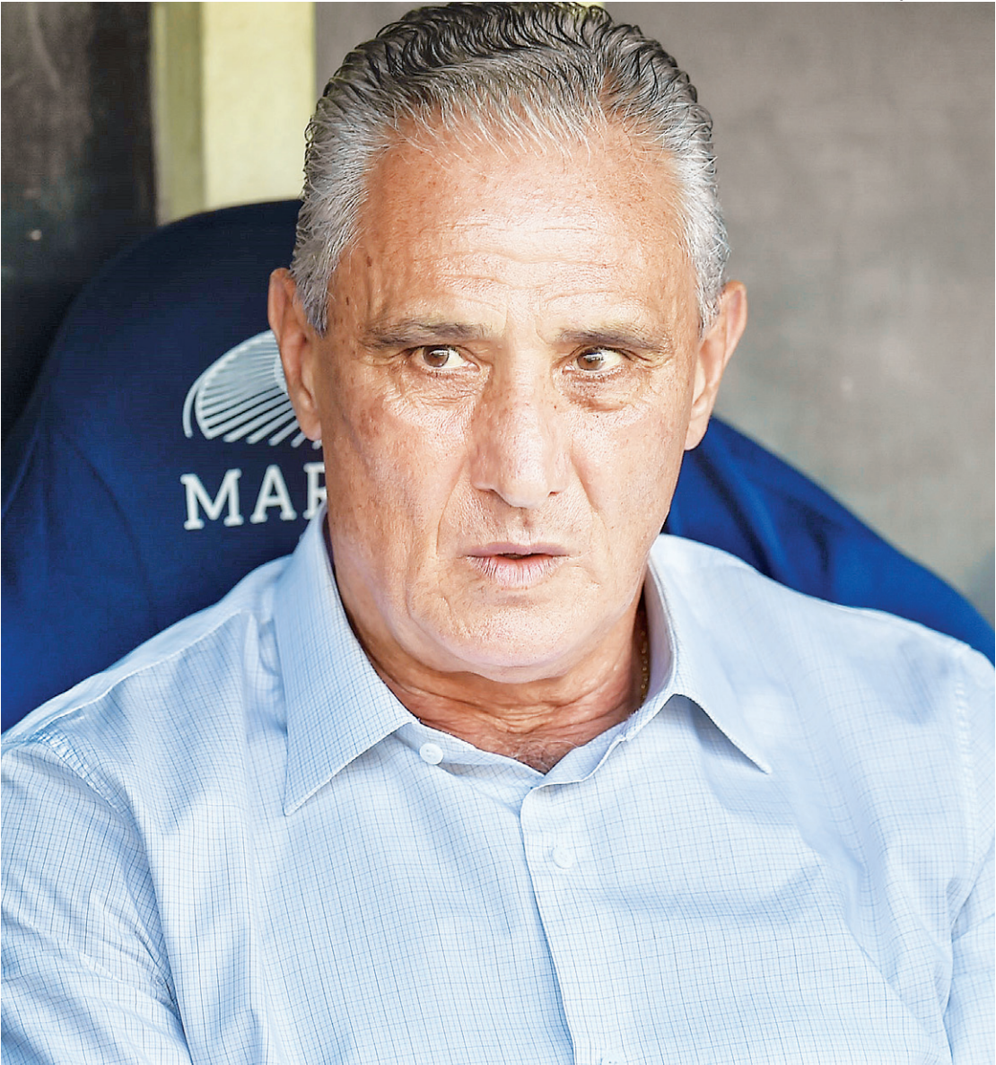
Conhecido por armar equipes que levam poucos gols, Tite alterou o DNA ofensivo do Flamengo

de sábado, após o 0 a 0 com o Fluminense e a classificação para a final do Estadual. Rossi quebrou um recorde histórico no Flamengo: é o atleta com a maior sequência de minutos sem levar gol em partidas oficiais. A marca foi quebrada aos 40 minutos do segundo tempo do Fla-Flu, quando o argentino chegou a 960 sem ser vazado e ultrapassou Cantarele, que ficou 959, entre novembro de 1978 e fevereiro de 1979, sem sofrer gols. Após o clássico, o vice de futebol, Marcos Braz, exaltou o goleiro. “A gente sabe que o esporte é coletivo, mas não posso deixar de fazer um agradecimento e dar os parabéns ao Rossi. Desde 1912, quando começou o futebol do Flamengo, o time não tem uma sequência de um goleiro com esse recorde. Você bateu o Cantarele, o recorde do Flamengo. Você é merecedor desta marca. Que ela se transforme em títulos”, disse Marcos Braz.