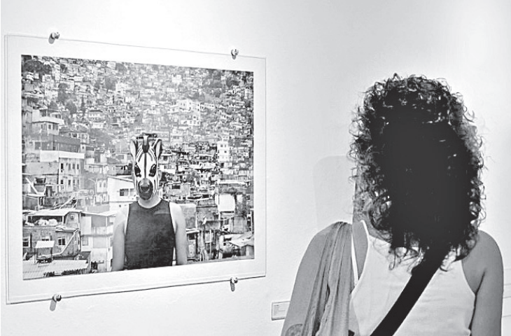
Acervo reúne 43 obras sobre a história do terreno do campus Maracanã

“Entre os artistas, temos discentes e egressos da Uerj convivendo com esses nomes tão importantes da história da arte brasileira,