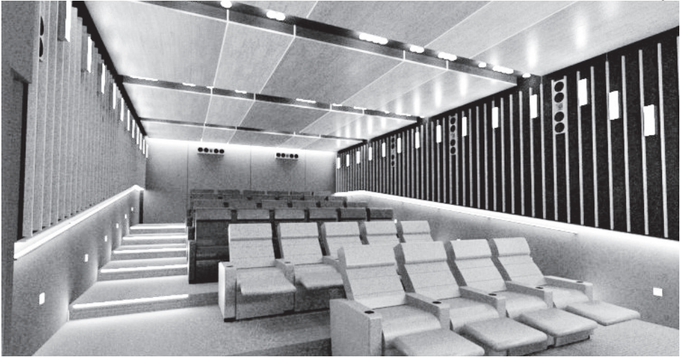
O espaço nas Casas Casadas faz parte de um projeto para ampliar as salas de cinema de rua