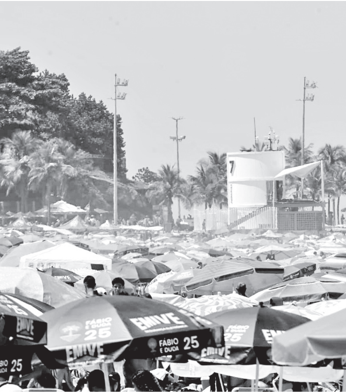
Cariocas e turistas lotaram as areias da Zona Sul do Rio de Janeiro no último domingo de verão