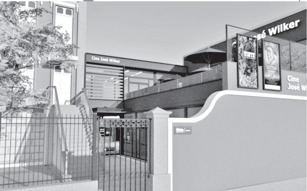
A construção aproveitou a estrutura de uma antiga sala de cinema que foi remodelada

RESGATE A construção do cinema nas Casas Casadas faz parte de um projeto da Prefeitura do Rio de investir na ampliação das salas de cinema de rua da cidade. Em outubro de 2021, o Complexo do Alemão recebeu o CineCarioca Nova Brasília. Agora, além do CineCarioca José Wilker, serão reabertos o Cine Penha e o Ponto Cine de Guadalupe, na Zona Norte, e o Cine Santa, em Santa Teresa. “A abertura dos cinemas de rua é um pleito importantíssimo da população e dos exibidores. Os cinemas de rua são amplamente democráticos, e conseguem impactar um público que as salas de shopping não alcançam”, conclui o secretário.