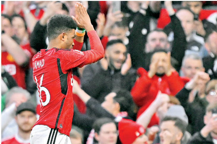
Amad Diallo fez o quarto gol do United sobre o Liverpool: jogaço

O United saiu na frente com McTominay, aos dez minutos do primeiro tempo. Antes do intervalo, aos 44 e 47, Mac Allister e Salah colocaram os Liverpool em vantagem. Já na reta final da etapa complementar, aos 43 minutos, Antony apareceu