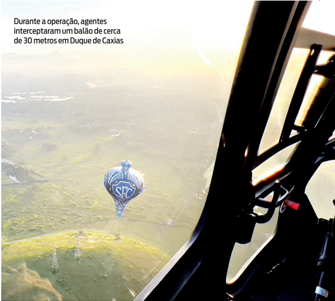
Durante a operação, agentes interceptaram um balão de cerca de 30 metros em Duque de Caxias

A ação contou com policiais militares do Comando de Polícia Ambiental (CPam) e do Grupamento Aeromóvel (GAM), integrada com o Instituto Estadual do Meio Ambiente (INEA) e a Delegacia de Proteção ao Meio Ambiente (DPMA). O objetivo é prevenir e combater a soltura de balões. As equipes atuam com apoio aéreo do GAM e marítimo com embarcação do INEA.