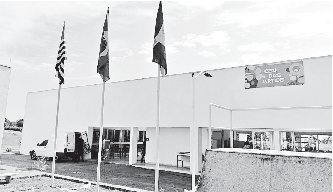
Os Centros de Artes e Esportes Unificados já existem no Estado de São Paulo há muitos anos

Os 18 municípios contemplados, além da capital, são: Angra dos Reis, Barra Mansa, Cabo Frio, Campos dos Goytacazes, Casimiro de Abreu, Itaboraí, Japeri, Macaé, Magé, Pirai, Queimados, Rio Bonito,