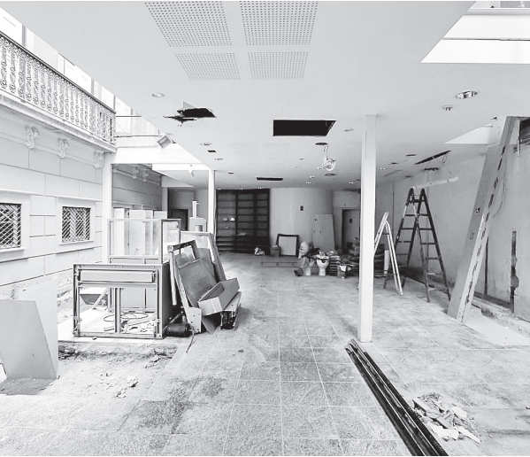
Reforma das Casas Casadas para abrigar o CineCarioca