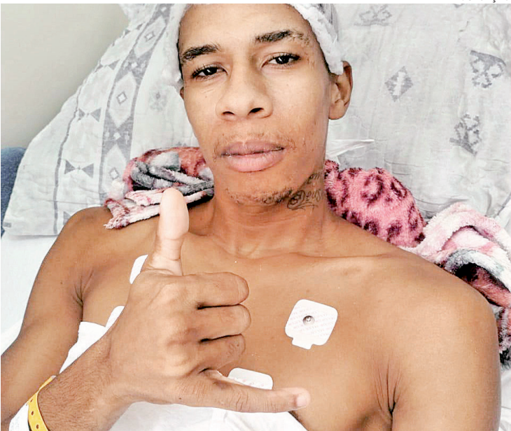
Trabalhador foi baleado após discussão por causa de um pedido