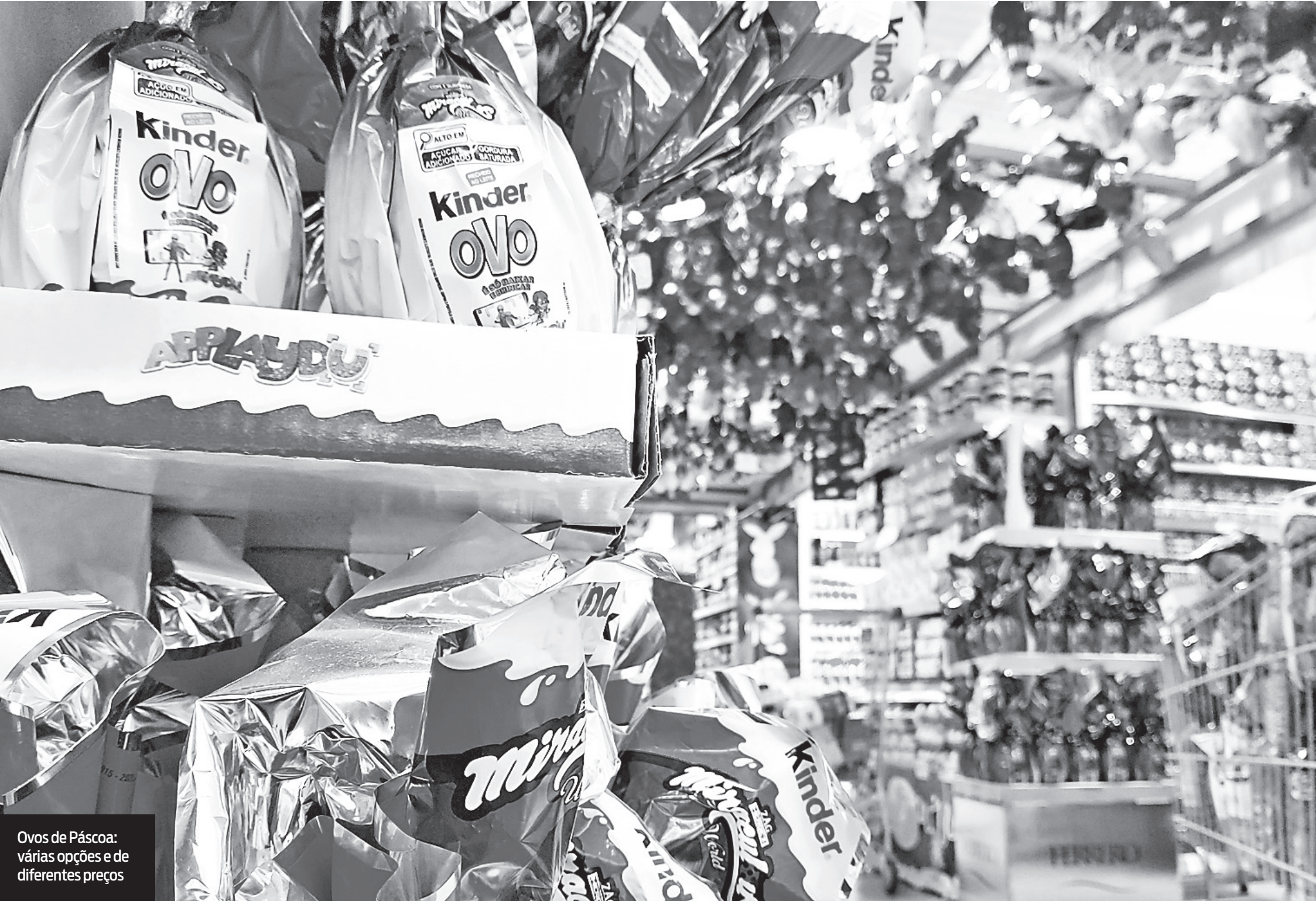
Ovos de Páscoa: várias opções e de diferentes preços