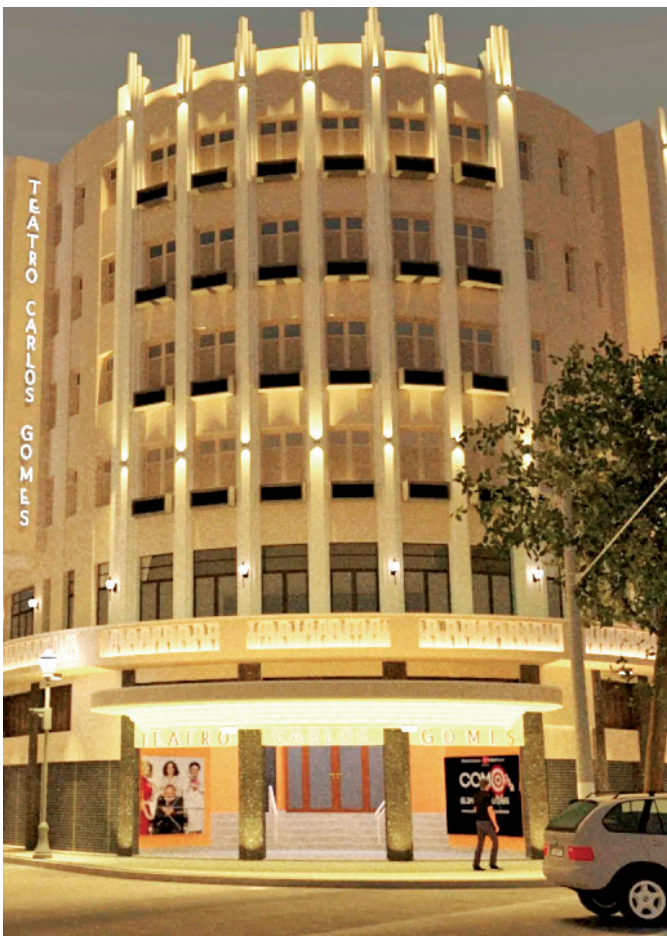
A Prefeitura do Rio divulgou a foto da nova fachada do Teatro Carlos Gomes, no Centro da cidade, que passa por obras, promovidas pela Secretaria Municipal de Cultura.