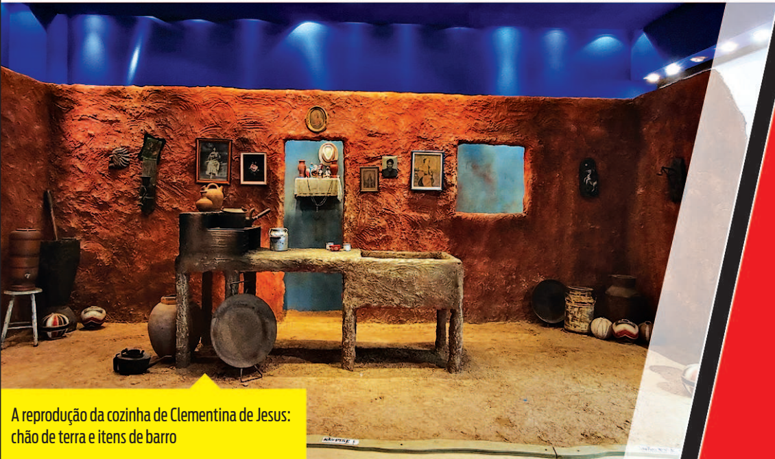
A reprodução da cozinha de Clementina de Jesus: chão de terra e itens de barro

“De lá, avistei a Sete de Setembro do alto. Já se aproximava das 18h e fiquei ali, reparando no vaivém de pessoas. Deduzi que muitas deixavam o trabalho de volta para casa. Algumas passavam com o telefone em mãos, na altura da boca, provavelmente gravando algum áudio”