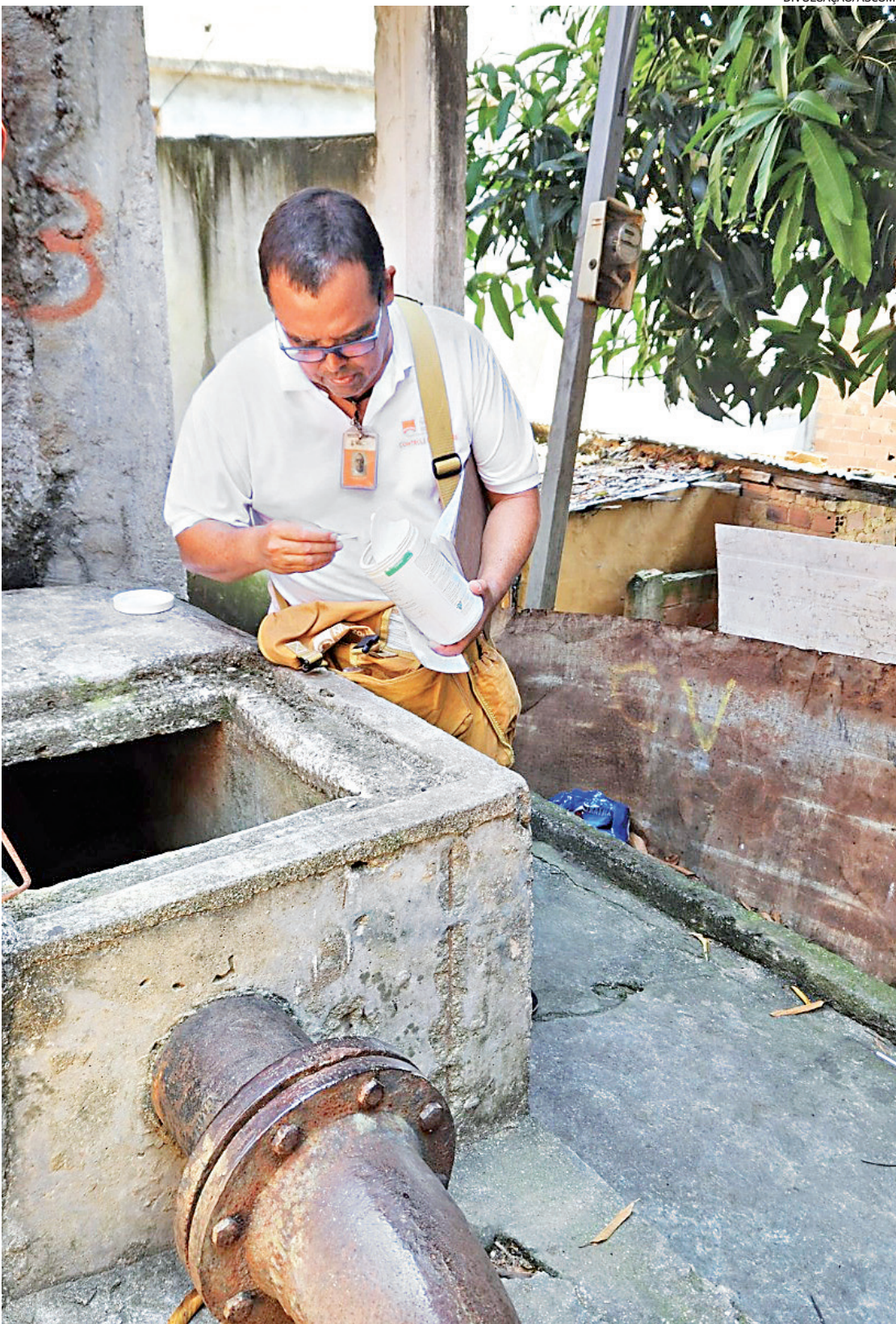
Morro do Palácio: mutirão contra a dengue mobiliza moradores e agentes de saúde da prefeitura

Quem já apresentou recentemente quadro de dengue deverá aguardar seis meses desde o início dos sintomas para receber novamente o imunizante. E os que têm sintomas da doença (febre e dor no corpo) deverão procurar atendimento médico.