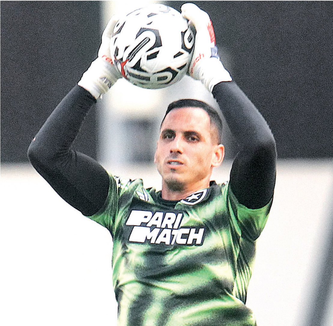
O goleiro Gatito Fernández foi um dos nomes convocados por Daniel Garnero para a seleção do Paraguai