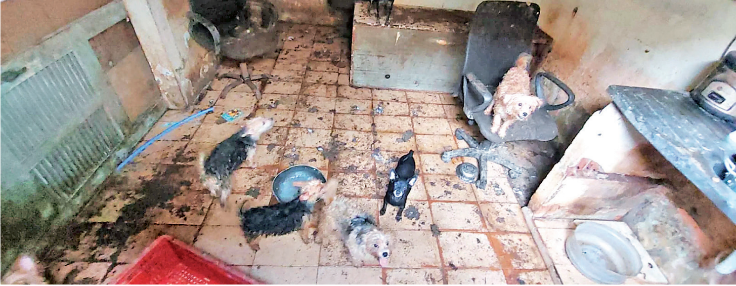
Animais viviam num local insalubre e foram para a Fazenda Modelo aos cuidados de veterinários. Depois serão enviados para a adoção

Caso o adotante seja aprovado, a prefeitura levará o cão até a sua nova residência.