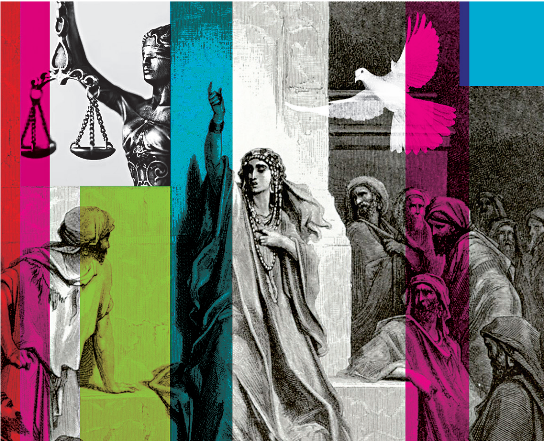
ARTE O DIA

Sua conduta ao buscar sempre a justiça e a verdade, agindo com integridade e em conformidade com princípios e valores consistentes, permite ter a referência ne-