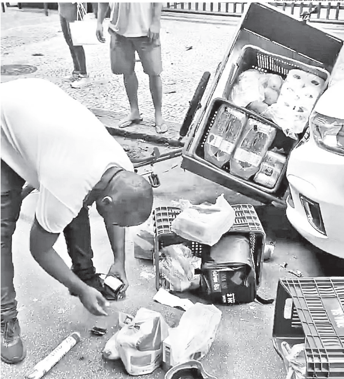
Mercadorias que seriam entregues pelo jovem ficaram jogadas no chão em rua de Ipanema, na Zona Sul

Até o fechamento desta edição, a Polícia Civil e o Supermercados Zona Sul não se pronunciaram.