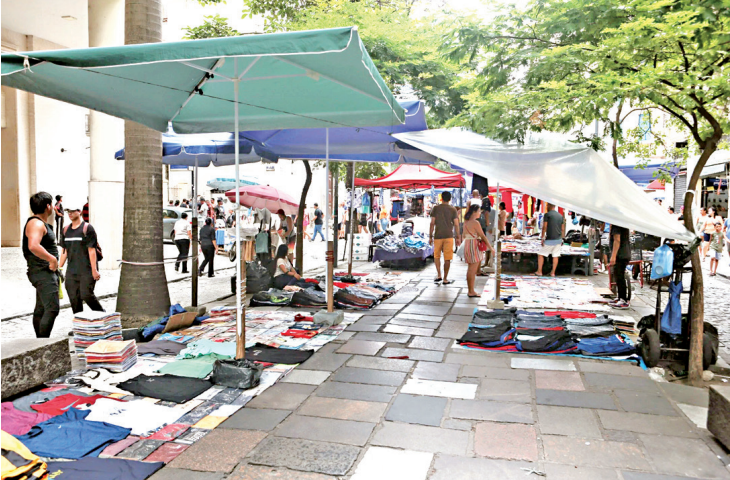
Ambulantes, com apoio do Muca-RJ, armam barracas no Centro

Contudo, movimentos ligados a camelôs repudiaram a decisão e afirmaram que a retirada dos ambulantes do local não resolve a criminalidade. Ao contrário, o Movimento Unido dos Camelôs (Muca-RJ) e o Fórum Popular de Segurança Pública do estado do Rio de Janeiro destacaram que a ação é uma forma de criminalizar e per-