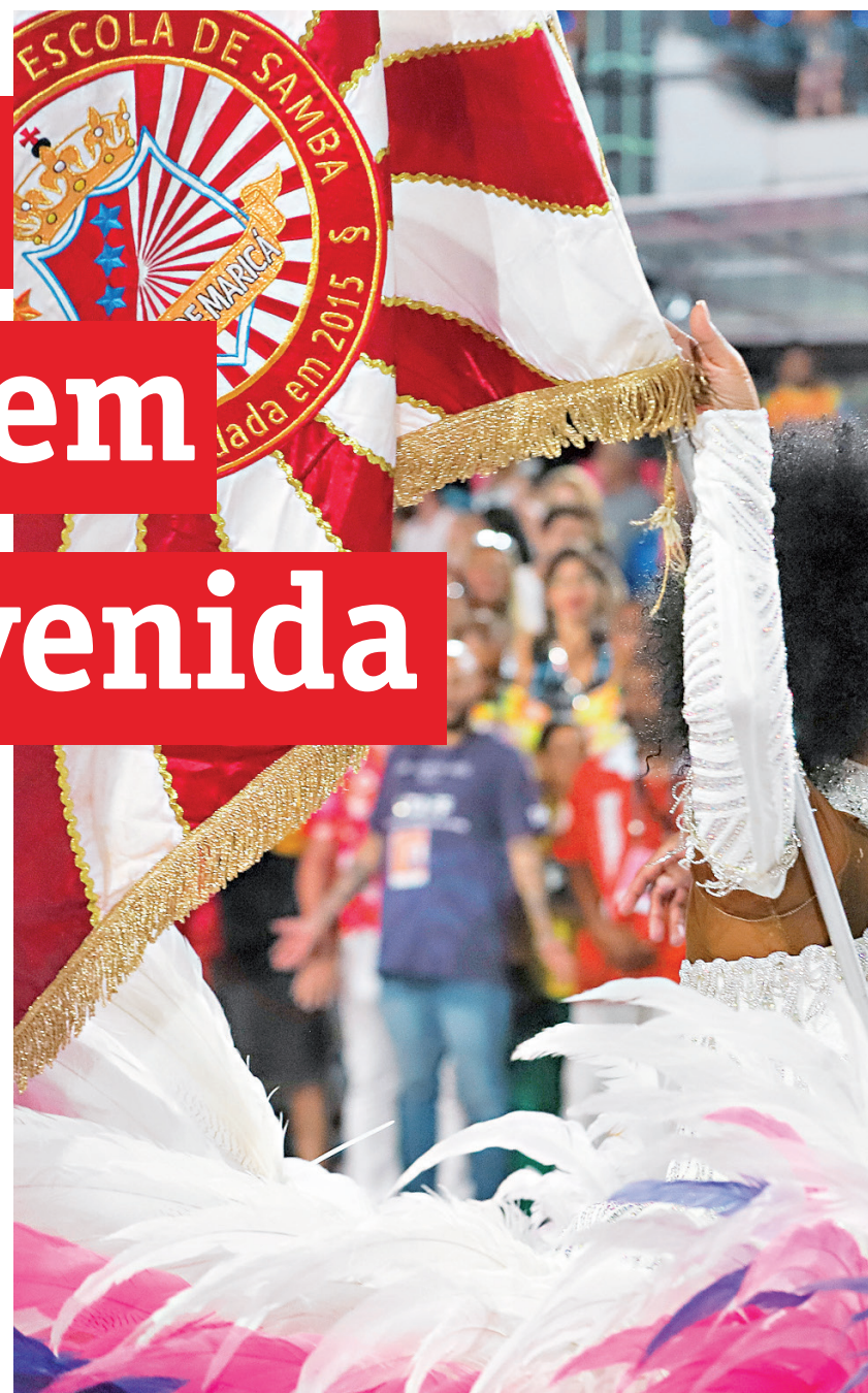
Escola estreou na Sapucaí com enredo "O Esperançar do Poeta", do carnaval

camente como "embaixadora da cidade" neste Carnaval e que retornou à Marquês de Sapucaí após mais de uma década de ausência. Uma semana antes, ela havia visitado a cidade e conheceu de perto as políticas públicas implementadas pelo município, que se tornaram exemplo de gestão no Brasil e no exterior, dizendo-se encantada com diversas iniciativas da administração pública.