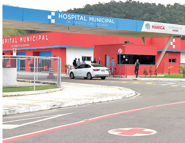
Prefeitura oferece consulta, procedimento e acompanhamento

O Serviço de Prevenção e Tratamento de Câncer de Pele iniciou os atendimentos em fevereiro, direcionado à população em geral e também aos trabalhadores da gestão municipal, com foco nos que atuam em áreas de exposição de risco ao sol. O proces-