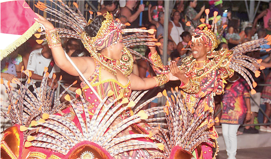
Agremiação levou para a Passarela Adélia Breve o enredo "A Asa Branca Tradição e a saga do sambaião"