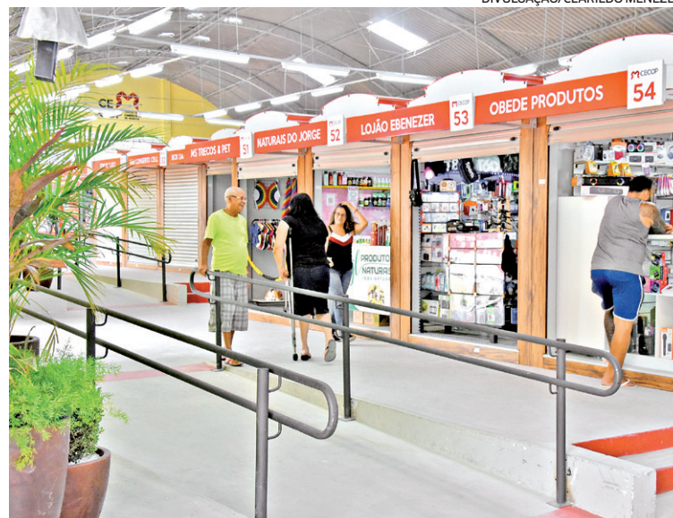
Trabalhadores celebram novo espaço para o comércio no Centro

Nesse ambiente, localizado na Rua Juvenal José Bittencourt, nº 37, os comerciantes ocupam 114 boxes com vendas de comidas, bebidas, souvenirs, artesanatos, peças de arte, vestuário, calçados, acessórios e bijuterias, entre outros. Os comerciantes foram selecionados levando-se em conta critérios específi-