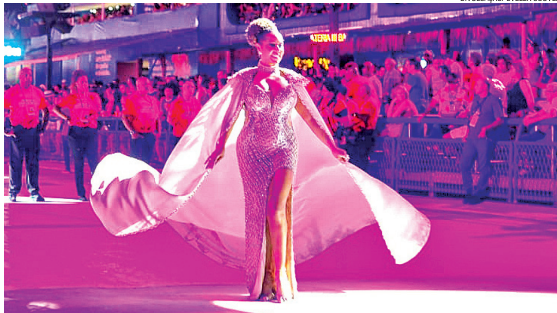
Valéria Valenssa, eterna Globeleza e um dos grandes ícones do Carnaval, voltou à avenida após 20 anos