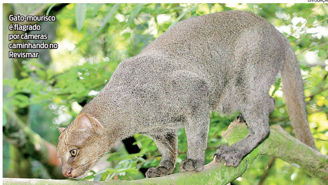
Gato-mourisco é flagrado por câmeras caminhando no Revismar