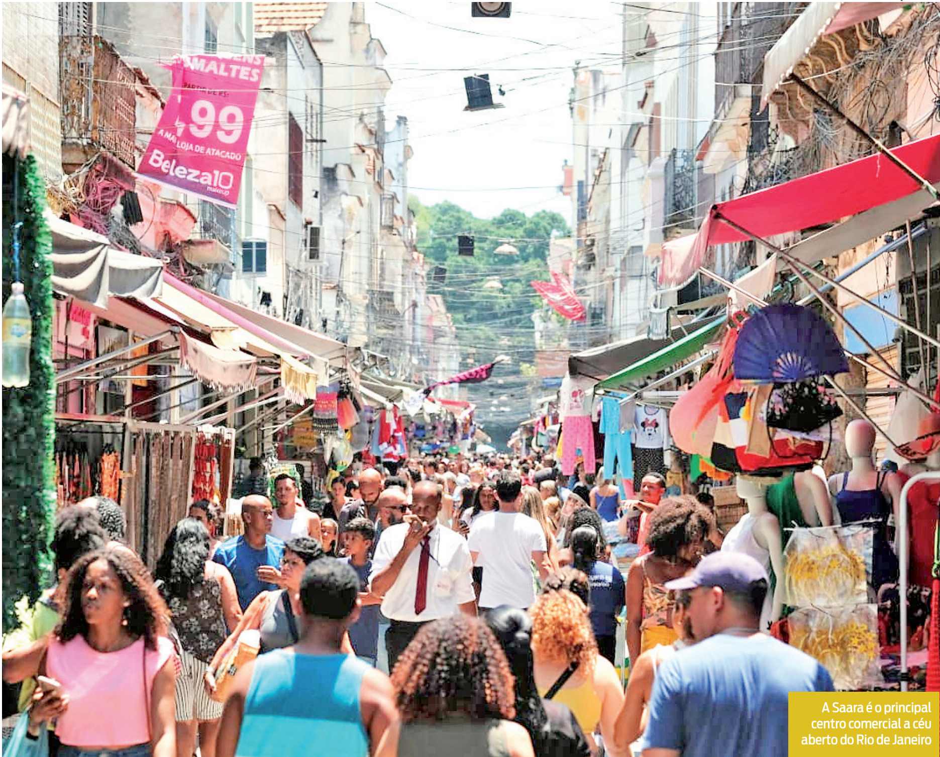
A Saara é o principal centro comercial a céu aberto do Rio de Janeiro

Em casos em que o consumidor deseja efetuar a troca, mas o produto não tenha nenhum defeito, quem define se a mercadoria pode ou não ser substituída é o lojista. Mas essa regra deve ficar clara para o consumidor antes da compra. “A possibilidade de troca de um pro-