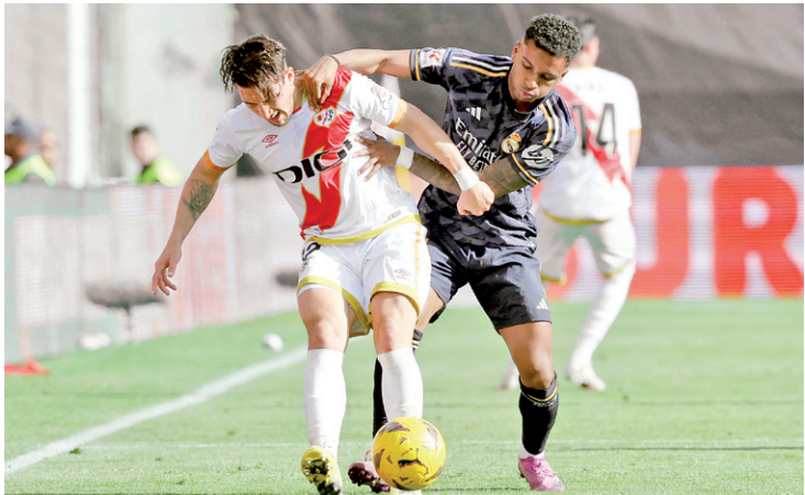
Real Madrid lutou, mas levou gol de revelação da sua categoria de base

Só que o Girona vai entrar em campo, hoje, no Estádio San Mamés, e, se derrotar o Athletic Bilbao, às 17h (de Brasília), diminuirá para apenas três pontos a distância em relação à equipe madrilenha. Promessa de fortes emoções em Bilbao.