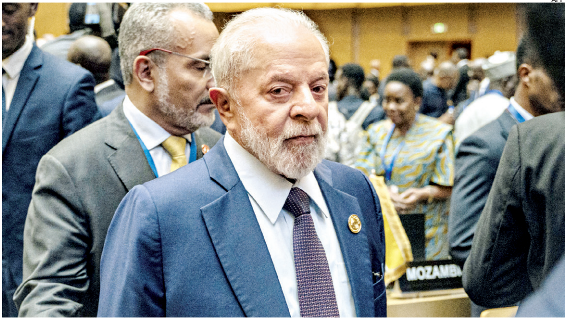
Lula criticou as ações israelenses na Faixa de Gaza, as quais já havia classificado como desproporcionais