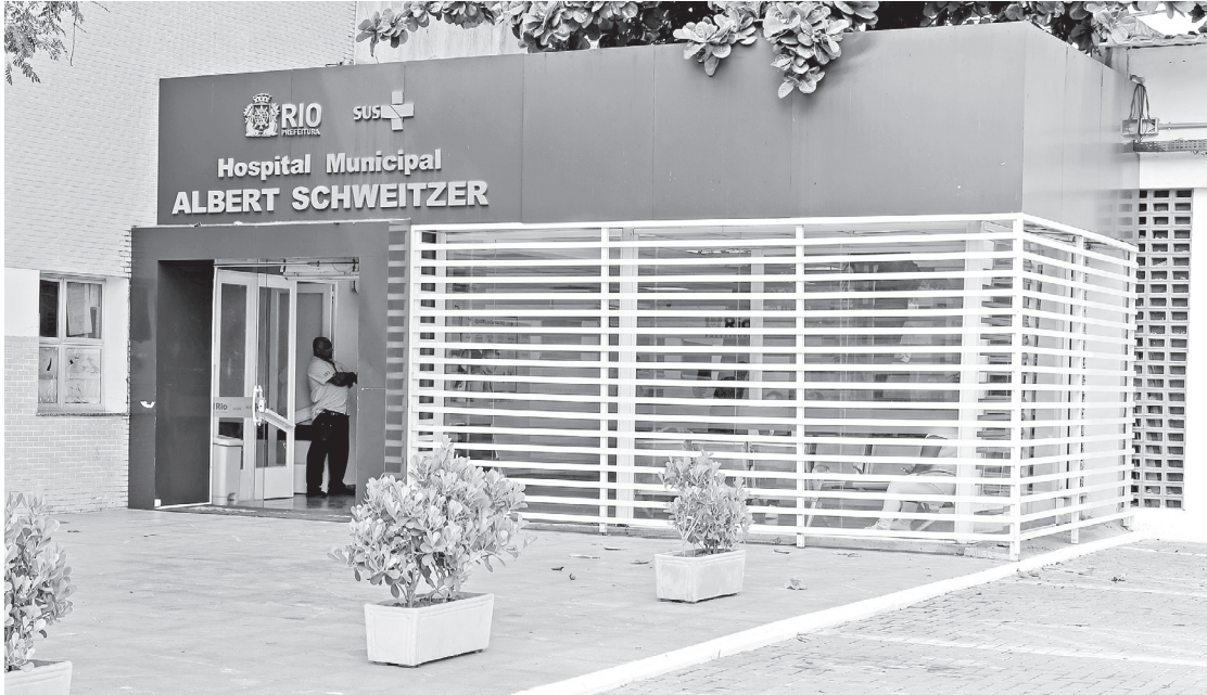
Hospital Municipal Albert Schweitzer foi revitalizado em reforma após queixas de pacientes

Uma das maiores reclamações de pacientes e acompanhantes, o sistema de climatização recebeu 256 novos aparelhos de ar-condicionado e os geradores também foram modernizados. A unidade também recebeu um novo tomógrafo e agora trabalha com dois aparelhos para realizar exames de imagem computadorizados. Também foram realizadas mudanças na área da emergência do Complexo Hospitalar de Realengo, que recebeu pintura, forro, ilumina-