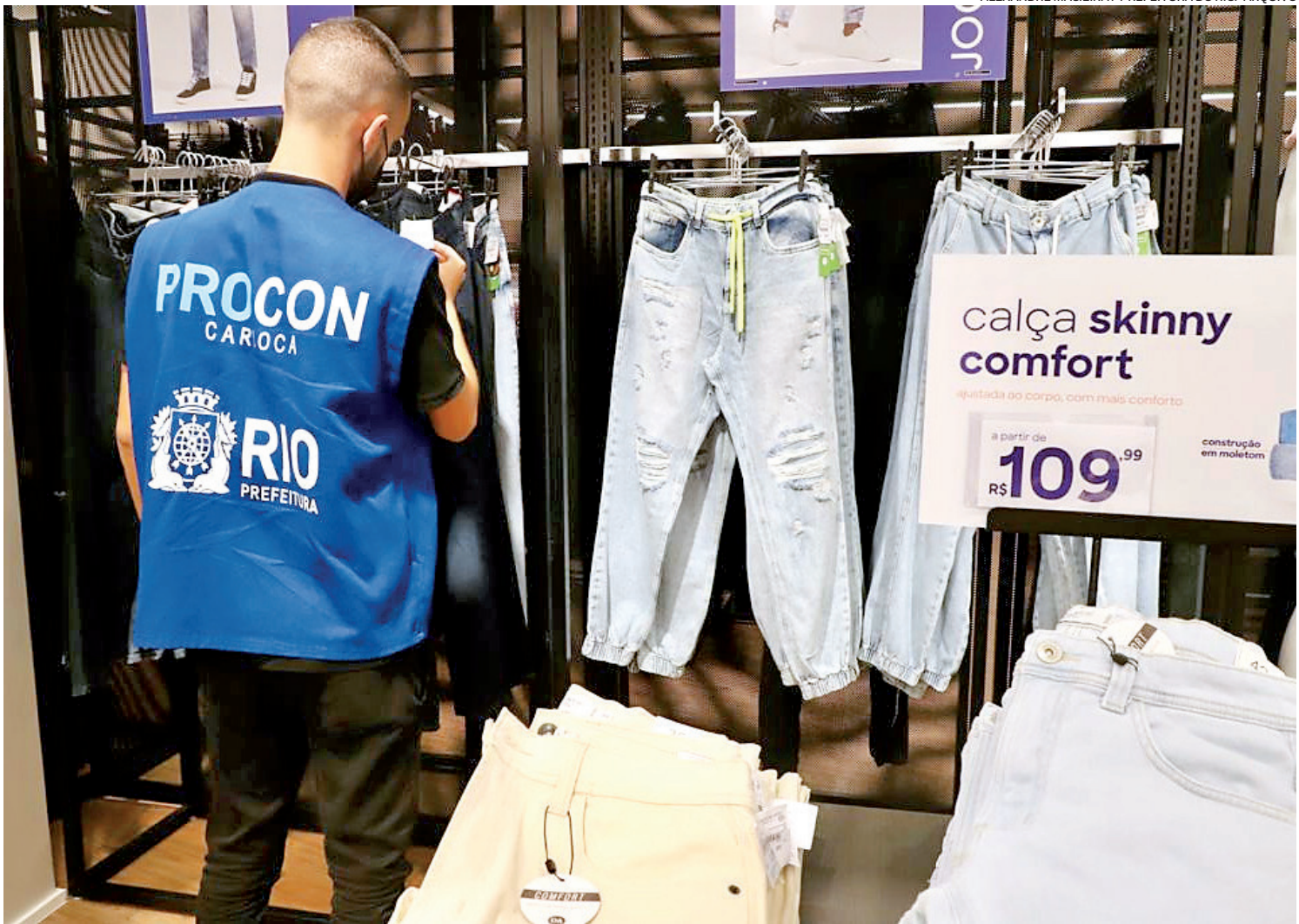
Algumas lojas físicas permitem a troca, desde que a nota fiscal esteja presente e a peça mantenha a etiqueta, informe a Proteste