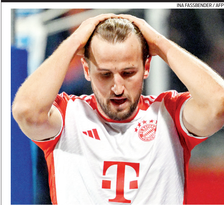
Harry Kane lamenta derrota do Bayern de Munique no Alemão

Outros jogos da 25ª rodada: Villarreal 1 x 1 Getafe, Atlético de Madri 5 x 0 Las Palmas, Osasuna 2 x 0 Cádiz, Celta de Vigo 1 x 2 Barcelona, Valencia 0 x 0 Sevilla, Granada 1 x 1 Almería, Mallorca 1 x 2 Real Sociedad e Betis 0 x 0 Alavés.