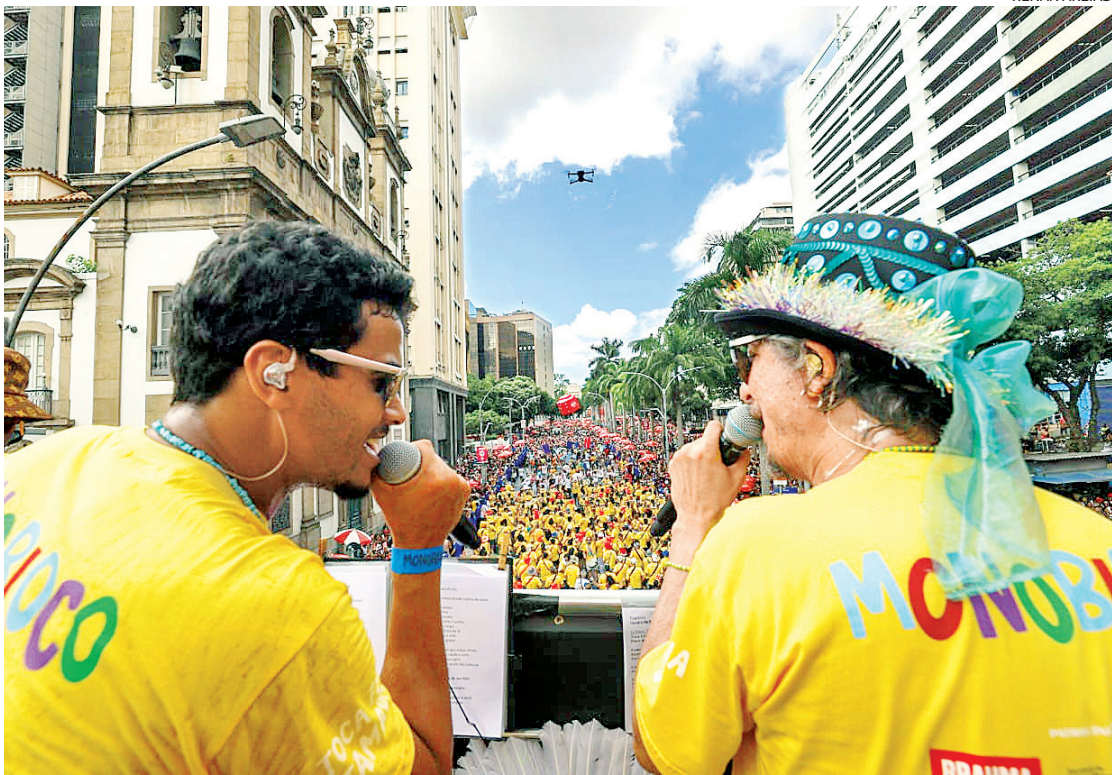
Monobloco foi o último dos megablocos realizados na Avenida Primeiro de Março, no Centro

“Como fui para fora, não participei da estrada deles, mas sempre me convidam quando estou aqui. Enquan-