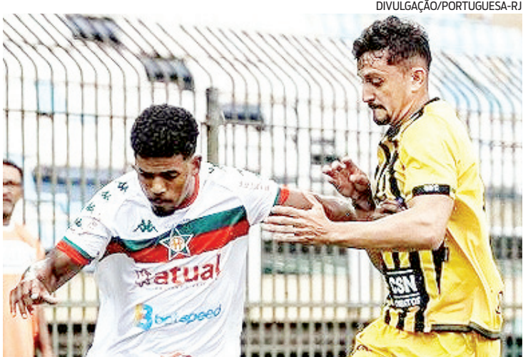
Portuguesa e Volta Redonda fizeram bom jogo na Cidade do Aço