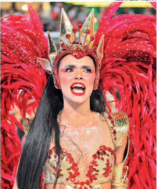
A atriz Giovana Cordeiro na Porta da Pedra