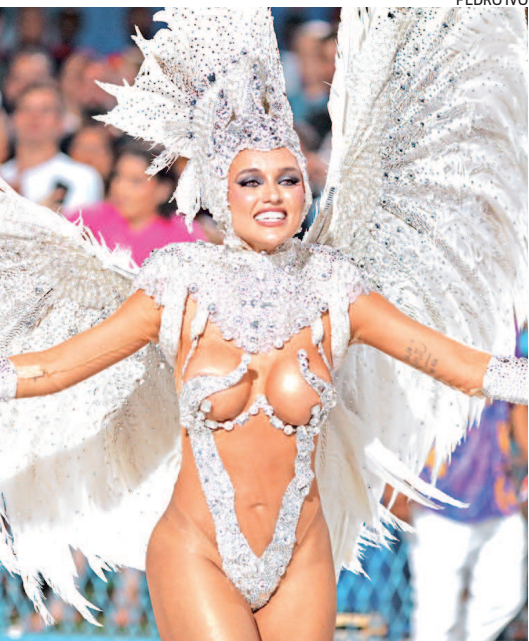
A influenciadora Rafa Kalimann na Imperatriz