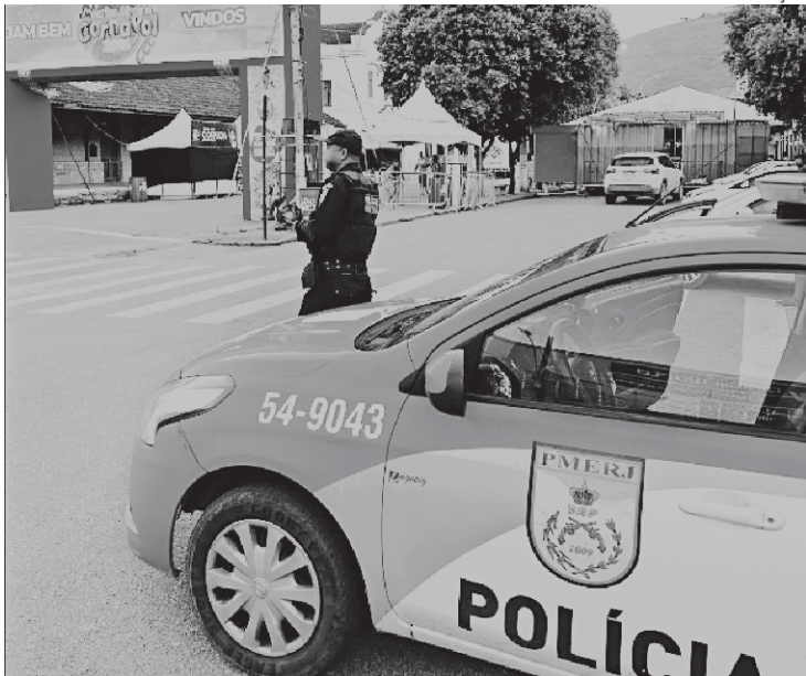
PM apreendeu mais de 180 objetos perfurocortantes

A Polícia Militar prendeu 235 pessoas e apreendeu 36 adolescentes durante o fim de semana de Carnaval. Entre elas, 30 tinham mandados de prisão em aberto. Mais de 12 mil agentes foram mobilizados para atuar no Rio de Janeiro no período da folia. A corporação informou que mais de 180 objetos perfurocortantes, sendo 10 facas, foram apreendidos nos pontos de revista do desfile do Cordão da Bola Preta, no sábado. No dia seguinte, dois homens foram presos após serem identificados pelo sistema de reconhecimento facial. Um deles atuava como ambulante na Avenida Presidente Vargas quando foi preso. O outro foi detido por agentes do Segurança Presente quando descarregava um caminhão de entrega de gelo na Praia de Copacabana. Com um grupo de bate-bo-