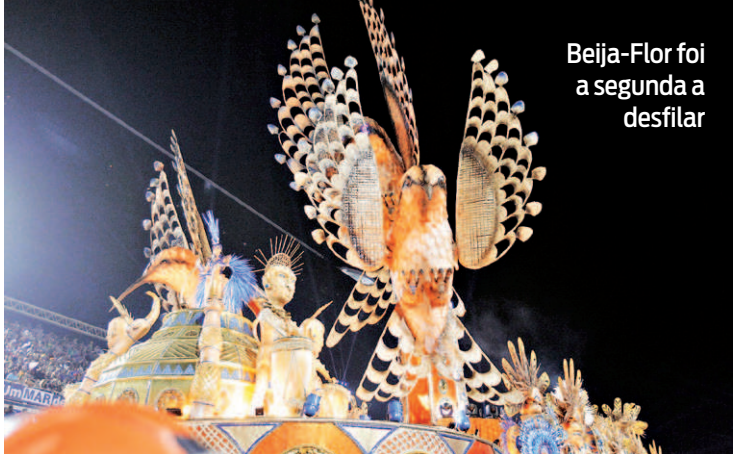
Beija-Flor foi a segunda a desfilir