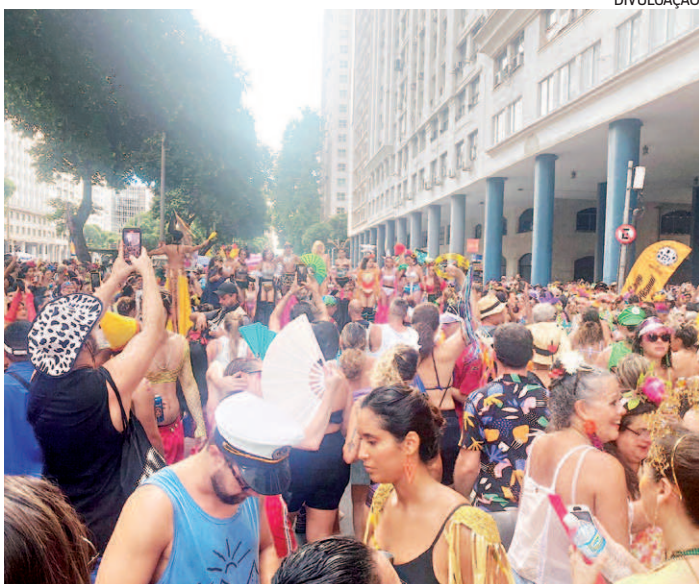
Boi Tolo levou milhares de foliões para o Centro, domingo