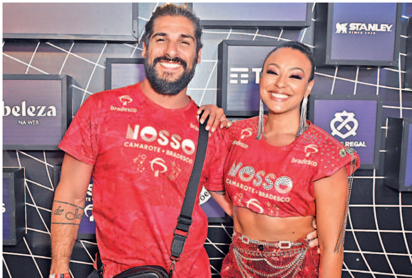
A atriz Sheron Menezes com o marido, Saulo, no Carnaval da Sapucaí