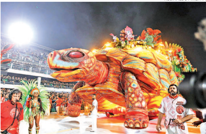
Salgueiro foi a terceira escola a desfilir no primeiro dia

ciou oficialmente, durante seu desfile, que vai exaltar o Estado do Pará no próximo Carnaval. A novidade foi confirmada pelo presidente Milton Perácio no microfone pouco antes do início do desfile. Bastante entusiasmado, o dirigente agradeceu a parceria fechada com o governador Helder Barbalho.