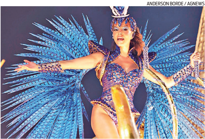
A atriz Giovanna Lancellotti veio na Beija-Flor