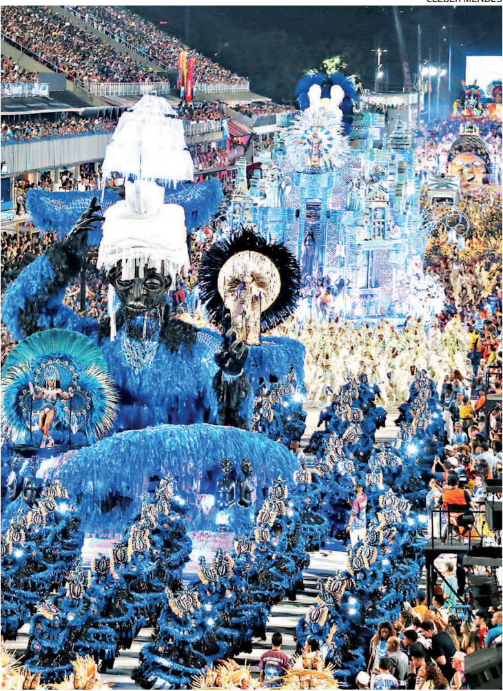
Portela levou para a Sapucaí um desfile belo e emocionante

Embalada para brigar na parte de cima do Grupo Especial, a Mocidade levou para a Sapucaí o enredo ‘Pede Caju que Dou... Pé de Caju que Dá!’.