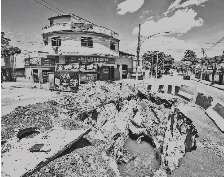
Cratera onde motorista de aplicativo caiu com carro, na Zona Norte