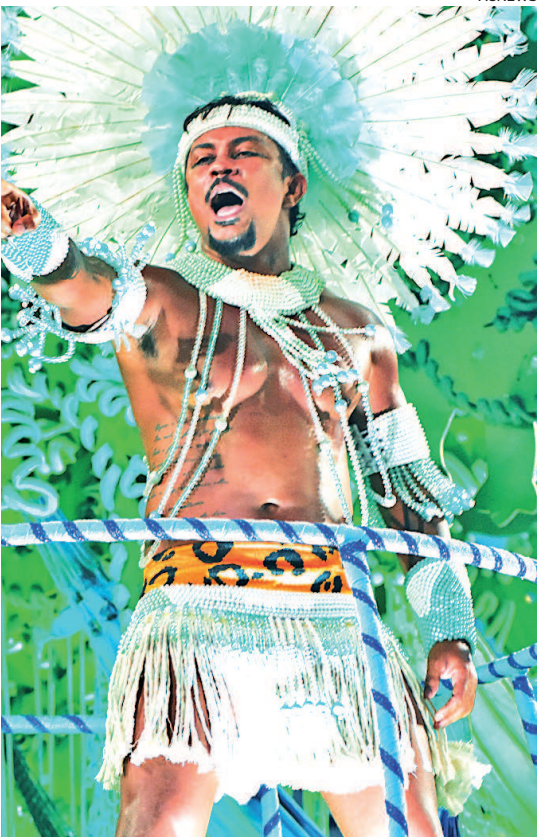
O ator e cantor Xamã desfilou na Grande Rio