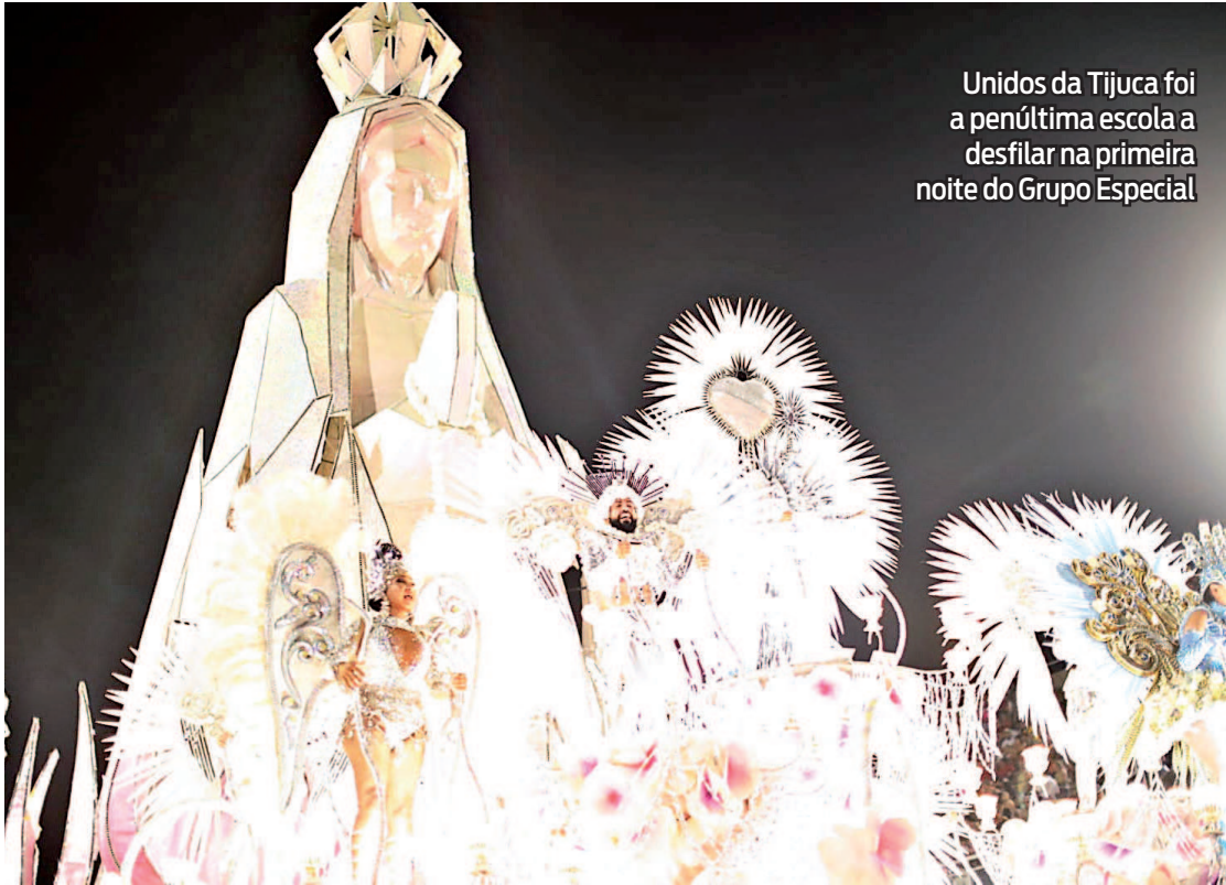
Unidos da Tijuca foi a penúltima escola a desfilir na primeira noite do Grupo Especial