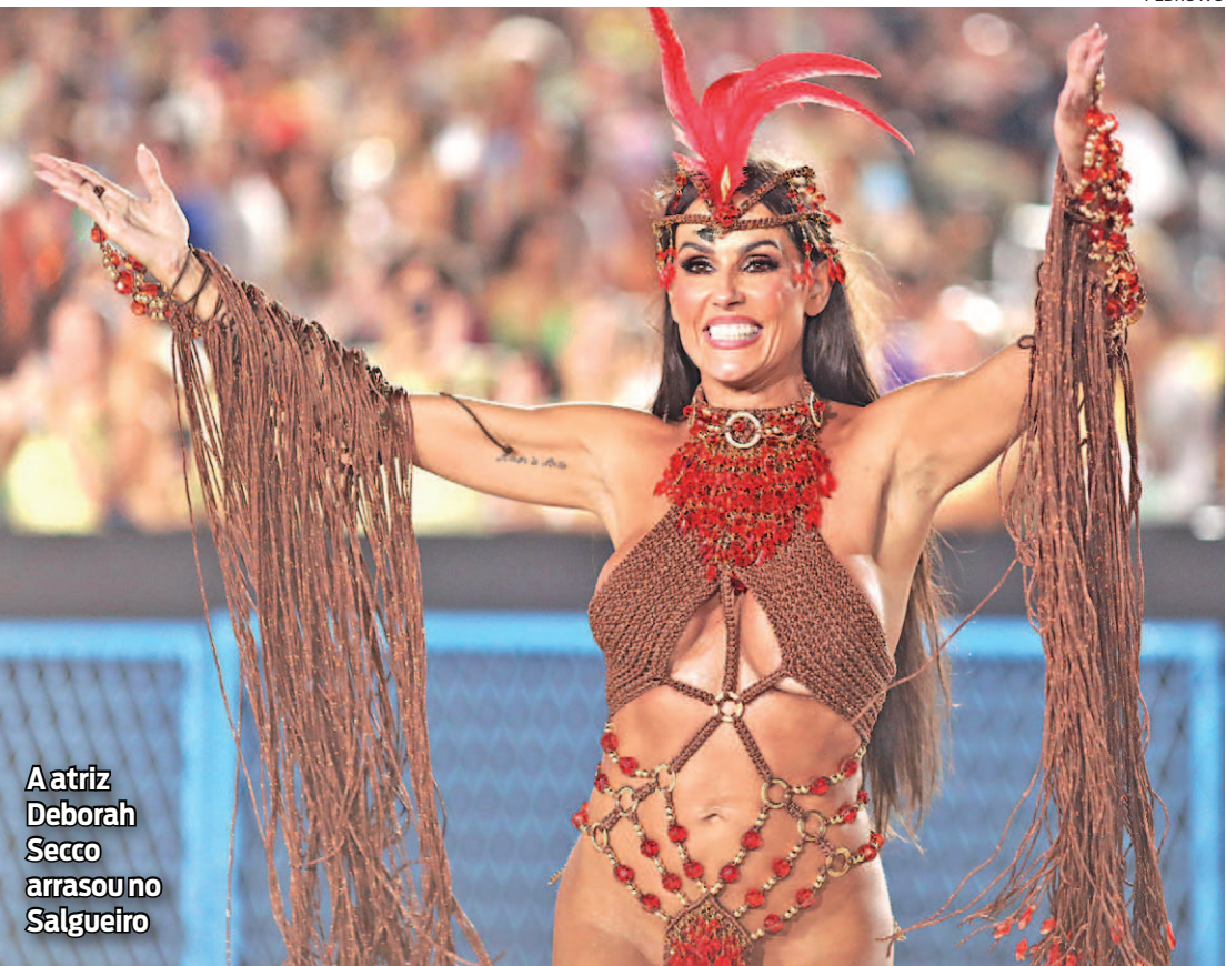
A atriz Deborah Secco arrasou no Salgueiro

A atriz Giovana Cordeiro desfilou na Porta da Pedra, a influenciadora Rafa Kalimann veio na Imperatriz Leopoldinense e a cantora Lexa arrasou como Rainha de Bateria da Unidos da Tijuca.