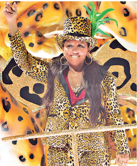
A atriz Regina Casé veio na Grande Rio