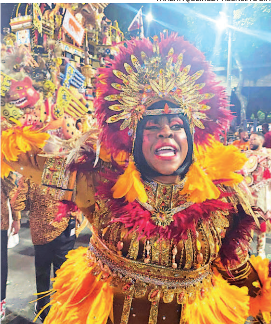
A atriz Cacau Protasio desfilou no Salgueiro