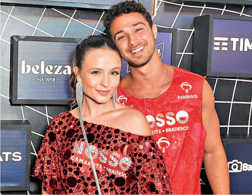
A atriz Larissa Manoela e o marido, o ator André Luiz Frambach