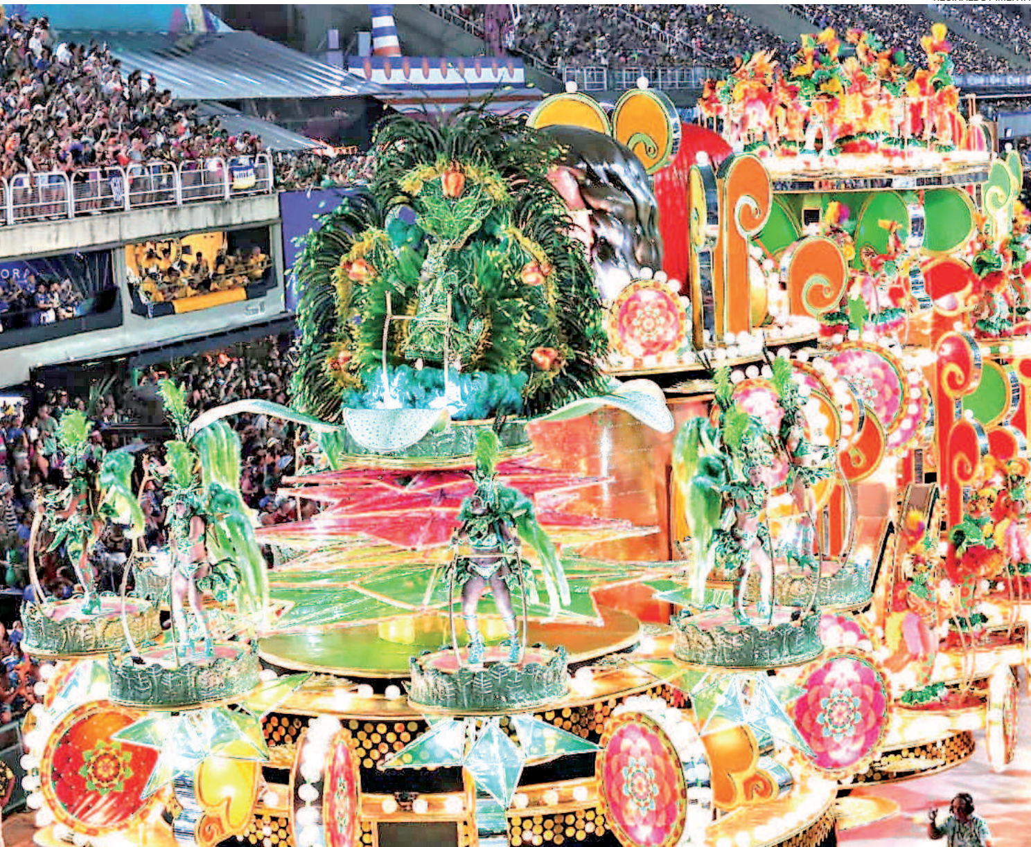
Mocidade Independente de Padre Miguel abriu a segunda noite de desfiles do Grupo Especial, ontem, na Passarela do Samba