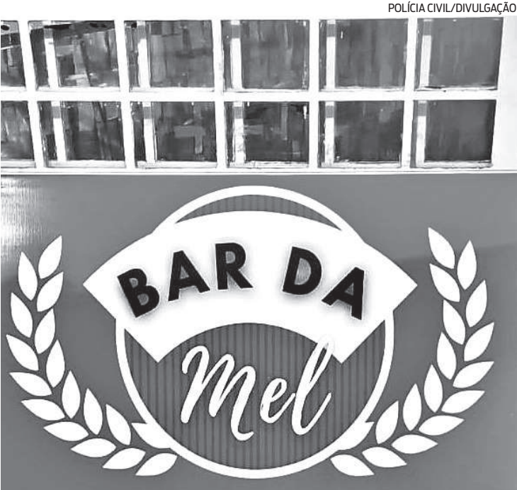
Para a polícia, rifas e bingos envolvendo as atendentes eram frequentes

era escolhida para ser “sorteada” e quem ganhasse a “levava” como prêmio sem o consentimento dela em relação ao cliente ou preço cobrado. O local também anunciava shows “ao vivo” de sexo das profissionais no estabelecimento. A proprietária do estabelecimento responderá pelo crime de manter casa de prostituição, bem como pelas contravenções penais de exercício irregular da profissão e de exploração de jogo de azar. A operação contou com a participação de policiais civis da Delegacia de Polícia de Água Clara e do Setor de Investigações Gerais (SIG) de Três Lagoas.