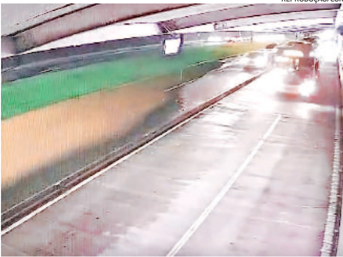
O rompimento causou muitos impactos no trânsito da região

A empresa ainda ressaltou que é preciso ter atenção ao consumo consciente de água durante o período da manutenção e reforça que estão à disposição por meio da Central de Atendimento no número 0800 400 0509 (telefone e WhatsApp).