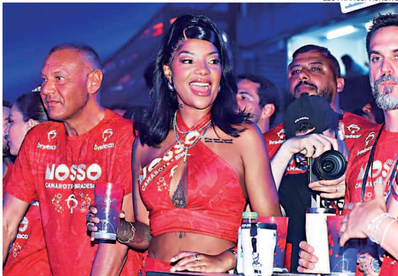
A cantora Ludmilla marcou presença em camarote no Sambódromo