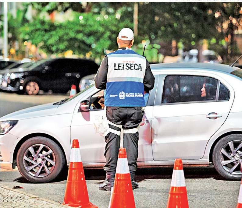
Agentes da Lei Seca atuam nas ruas em todos os dias de folia.

No Plano de Operação do Carnaval do Governo do Estado, a Operação Lei Seca disponibiliza 100 agentes para atuar nas ruas durante o Carnaval, com fiscalização durante o dia. No Sambódromo, há teste de bafômetro nos motoristas dos carros alegóricos dos grupos Ouro e Especial. Já nas ruas e estradas, blitzes diurnas e noturnas fazem parte das ações, além do uso de drones para auxiliar e evitar a fuga e troca dos condutores dos veículos interceptados.