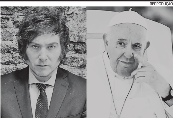
Milei e o Papa Francisco têm audiência agendada na Santa Sé

de conclusão de mestrado e doutorado, por exemplo. A terceira etapa, também quando for o caso conforme edital, é o curso de formação, de caráter classificatório e eliminatório. São os casos em que a pessoa precisa fazer um curso para aprender as funções do cargo. Todas as informações sobre o concurso podem ser conferidas no portal gov.br/concursionacional.