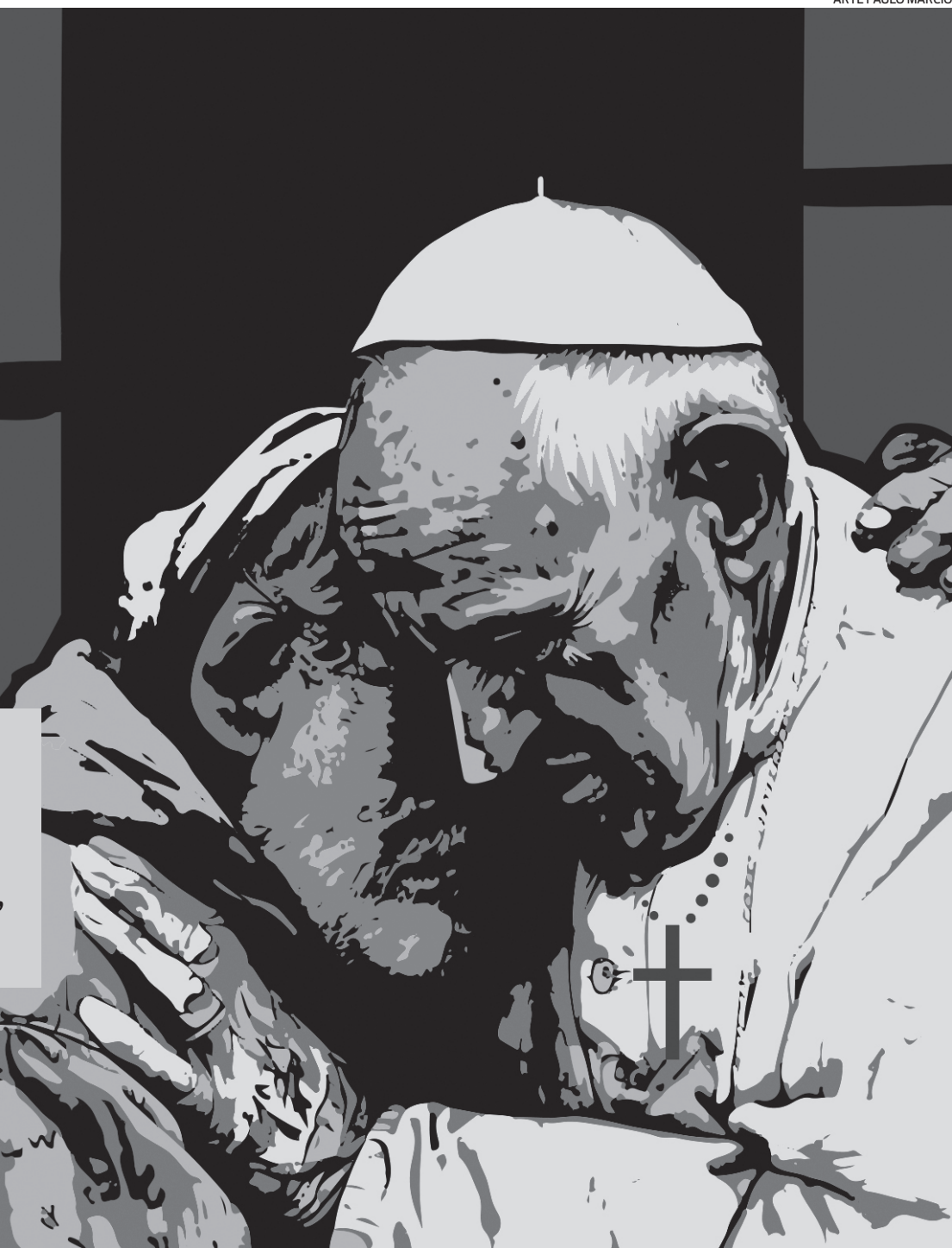
ARTE PAULO MÁRCIO