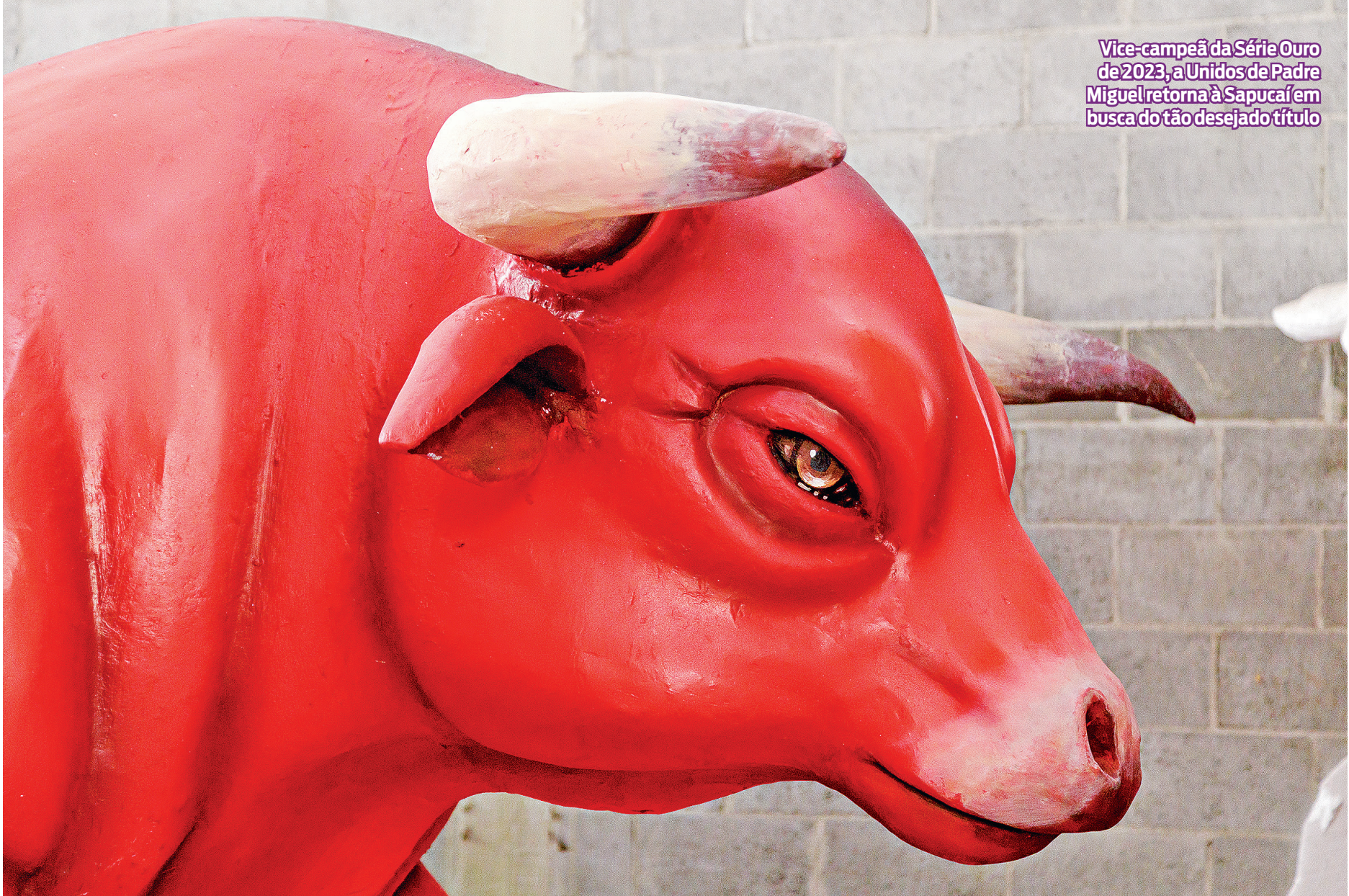
Vice-campeã da Série Ouro de 2023, a Unidos de Padre Miguel retorna à Sapucaí em busca do tão desejado título

UNIDOS DE PADRE MIGUEL Vice-campeã da Série Ouro de 2023, a Unidos de Padre Miguel retorna à Sapucaí em busca do desejado título. A escola da Vila Vintém defende o enredo ‘O redentor do Sertão’, apoiado na figura emblemática de Padre Cícero. A UPM promete apresentar o imaginário místico do povo sertanejo com causos fantásticos, visões e milagres. O enredo pretende unir as histórias de vida do sertanejo com as benfeitorias e obras do padre, resgatando as emoções do povo, tudo isso com magia e espiritualidade.