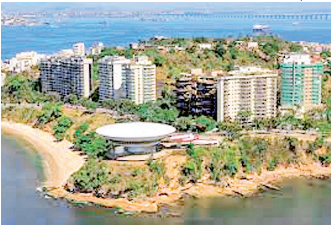
Linha 3 do Metrô ligando Niterói ao Rio deve ganhar atenção nas eleições municipais

A investigação da Polícia Federal que atravessou o caminho do deputado federal Carlos Jordy (PL) foi o mais recente acontecimento político que agitou Niterói. Ele é um dos pré-candidatos ao posto hoje ocupado por Axel Grael. O outro assunto que será tema durante os debates que antecedem a eleição para prefeito da cidade é a construção da linha 3 do Metrô. Um traçado planejado que ligaria o município do Rio de Janeiro a Niterói, que precisaria cruzar a Baía de Guanabara, presumivelmente debaixo d'água. A Linha 3 (Arariboia - Visconde de Itaboraí) está atualmente em processo de licitação e ligará a estação Arariboia (no centro de Niterói) até Guaxindiba, em São Gonçalo, na região metropolitana do Rio.