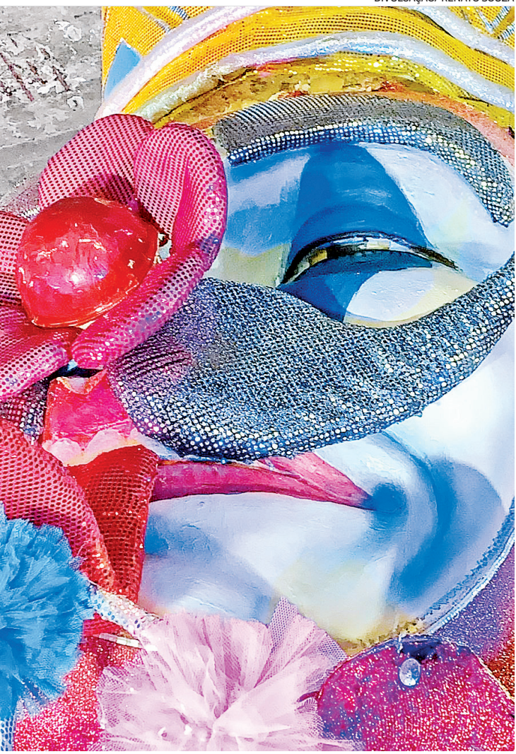
A Em Cima da Hora homenageará os trabalhadores e a luta trabalhista