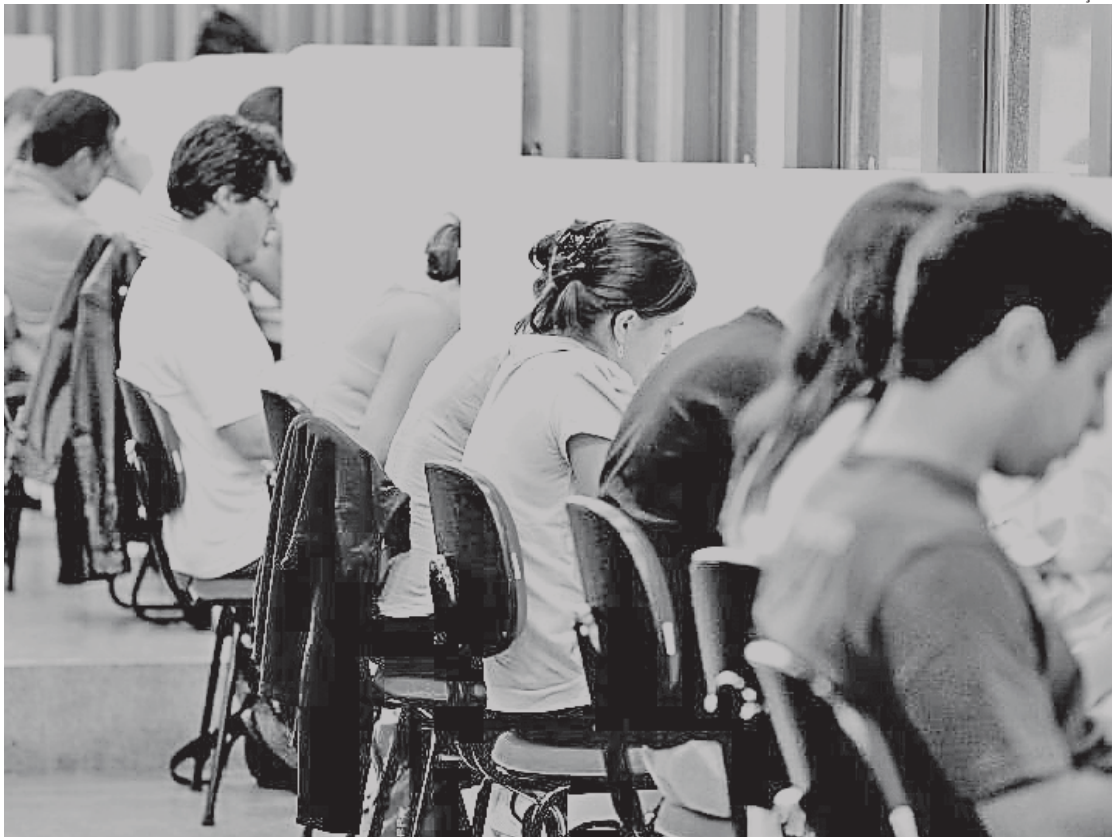
A partir de agora, é importante entender como estão estruturadas as etapas e provas do certame

O Concurso Nacional Unificado (CNU), que teve inscrições finalizadas ontem, acontecerá no dia 5 de maio, e o resultado final está previsto para o dia 30 de julho. Depois de o candidato decidir o bloco de conhecimento a que vai concorrer, entre os oito editais disponíveis, e definida a ordem de preferência das vagas, escolha feita no momento da inscrição, é importante entender como estão estruturadas as etapas e provas do certame. Para os cargos de nível superior, o concurso tem até três fases, de acordo com o cargo escolhido. Mas todos os sete editais têm características em comum. A primeira etapa inclui a prova objetiva, com 70 questões de múltipla escolha, e a prova discursiva, que pode abordar questões de conhecimento geral ou específicos. Em todos os sete blocos, a prova terá 20 questões de conhecimentos gerais, que incluem temas como políticas públicas, democracia e cidadania, Constituição Federal, Programa Nacional de Direitos Humanos, valores éticos do serviço público, diversidade e inclusão, administração e finanças públicas. As 50 questões de conhecimentos específicos vão cobrir conteúdos de acordo