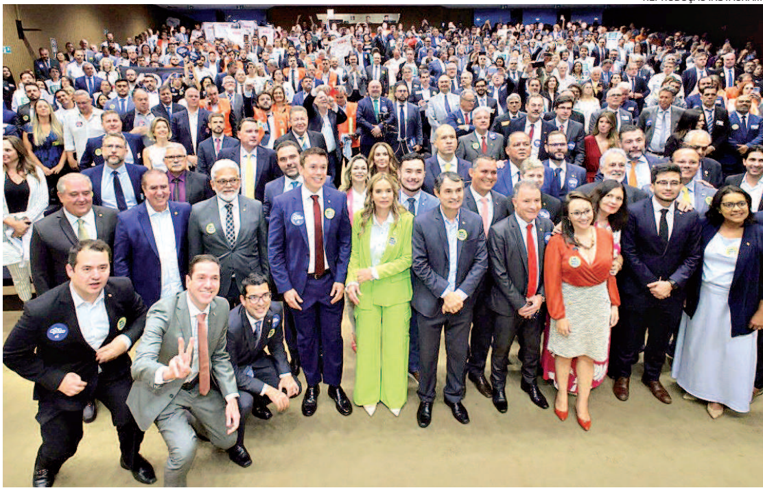
Entidades dos setores de turismo e evento se reúnem em ato em defesa da Perse

MANIFESTO O documento foi assinado por 305 parlamentares. Também participaram