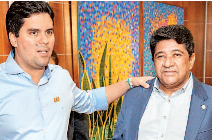
Ministro do Esporte, André Fufuca, e o presidente da CBF, Ednaldo

haja essa interação, até porque nós temos o mesmo intuito, o mesmo desejo, que é trazer a Copa do Mundo feminina para o Brasil. A Fifa está vindo ao Brasil neste mês para fazer uma vistoria em alguns estados, e a gente, por parte do Ministério, também irá até a Suíça ou a França, para entrarmos em contato com o presidente da Fifa, fazendo um diálogo franco, demonstrando que o Brasil tem interesse em seguir a Copa do Mundo femi-