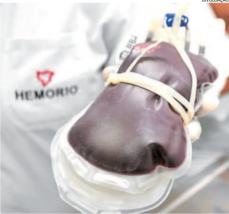
Doações devem para reforçar estoque do Hemorio durante o Carnaval

autorização do responsável), estar bem de saúde e pesar mais de 50 kg. Não precisa estar de jejum, mas é recomendado que o doador não tenha ingerido comida gor-