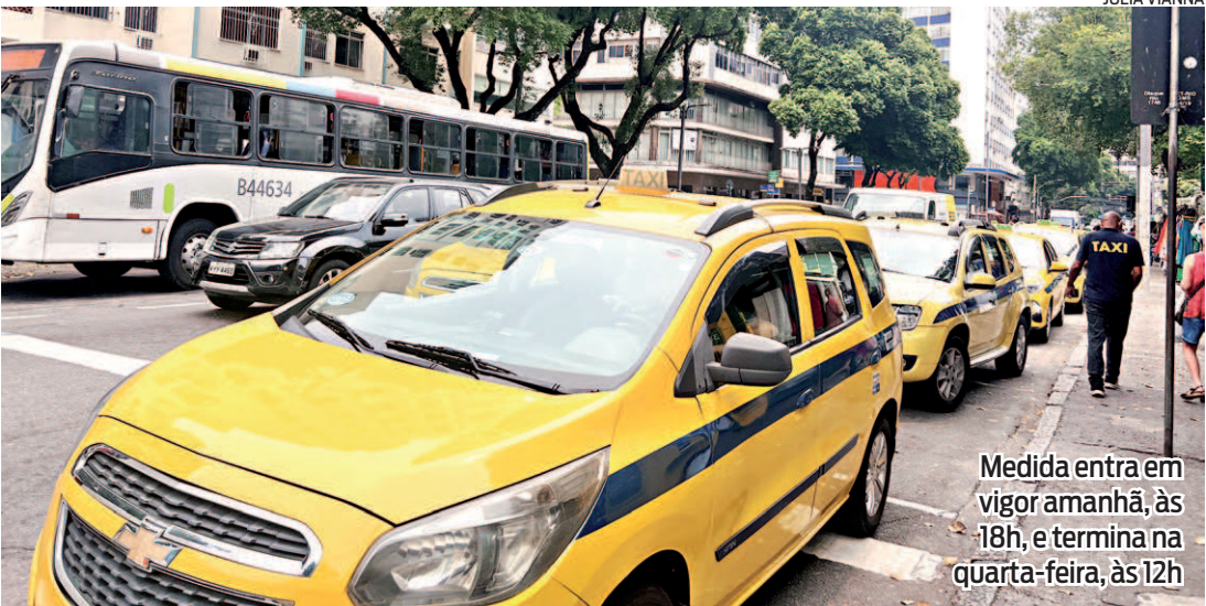
Medida entra em vigor amanhã, às 18h, e termina na quarta-feira, às 12h

Em relação aos táxis executivos, uma tabela de valores pré-fixados, publicada na resolução, será utilizada para viagens contratadas a partir do Sambódromo nos dias de desfile. Os valores variam de acordo com o bairro de destino. Segundo a publicação, a tabela deve ficar exposta em um local visível ao passageiro no interior do veículo e nos pontos de partida. Em caso de pedágio, o valor será cobrado ao usuário.