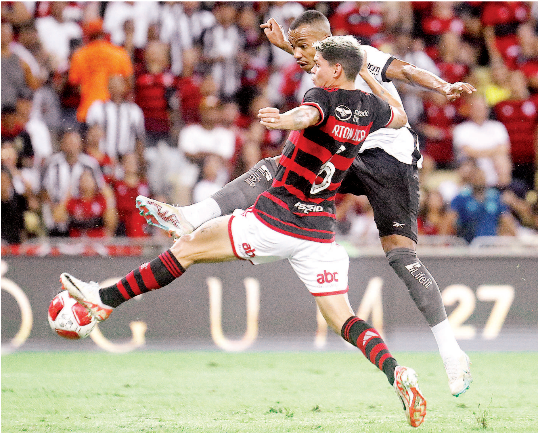
Na base da transpiração, Flamengo e Botafogo tentaram superar a falta de inspiração na busca pela vitória. No fim, a torcida rubro-negra sorriu por último no Maracanã

Pelo lado alvinegro, o Botafogo conseguiu levar mais perigo, mesmo com menos posse de bola, mas foi pouco para balançar as redes rubro-negras. No total, foram três boas chances criadas. A melhor delas veio após um cruzamento de trivela de