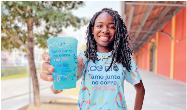
Águas do Rio vai distribuir 140 mil eco copos reutilizáveis