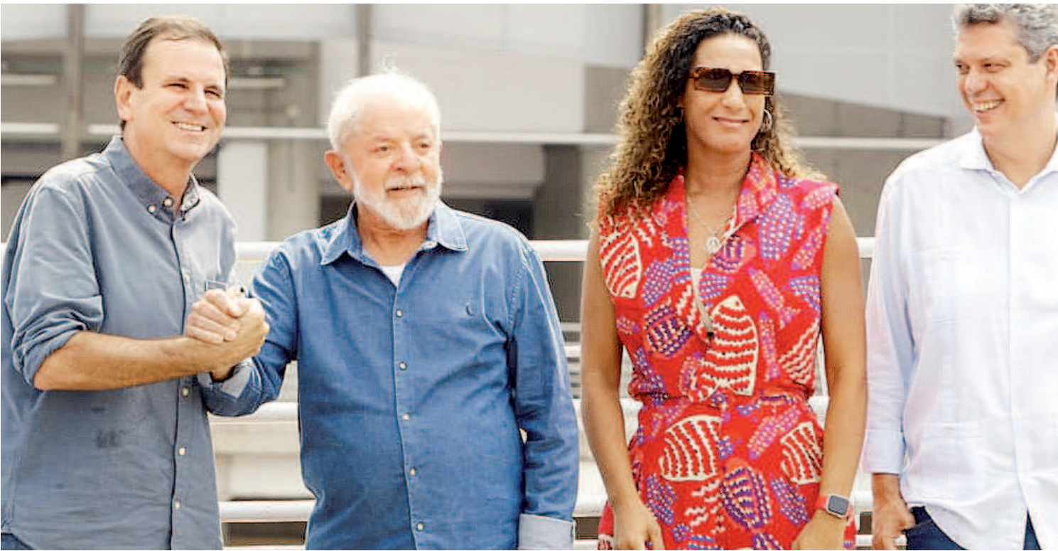
O presidente Lula e o prefeito do Rio, Eduardo Paes, inauguraram o Ginásio Isabel Salgado, na Barra da Tijuca, na Zona Oeste da cidade

sempre foi um país governado por gente que não tinha apreço por educação, o povo não tinha que estudar, tinha que trabalhar, era escravo, depois veio agricultura e agora trabalhar em fábrica, mas a gente precisa de uma profissão”, disse o presidente, que citou nominalmente o jornal O DIA e outros veículos de imprensa do Rio. Ainda segundo o presidente, a instituição federal é mais uma forma de dar oportunidade à população de baixa renda. “A profissão é uma marca muito registrada na vida do nosso povo, a gente quer que as pessoas mais humildes tenham uma profissão. Tem rico que pensa que a gente quer ser pobre, às vezes as pessoas acham que a gente acha bonito ser pobre, mas a gente não gosta, a gente gosta de tudo de primeira e é pra isso que a gente tem que brigar sem se conformar que a gente é de segunda classe e é essa revolução que a educação tem que fazer”, completou.