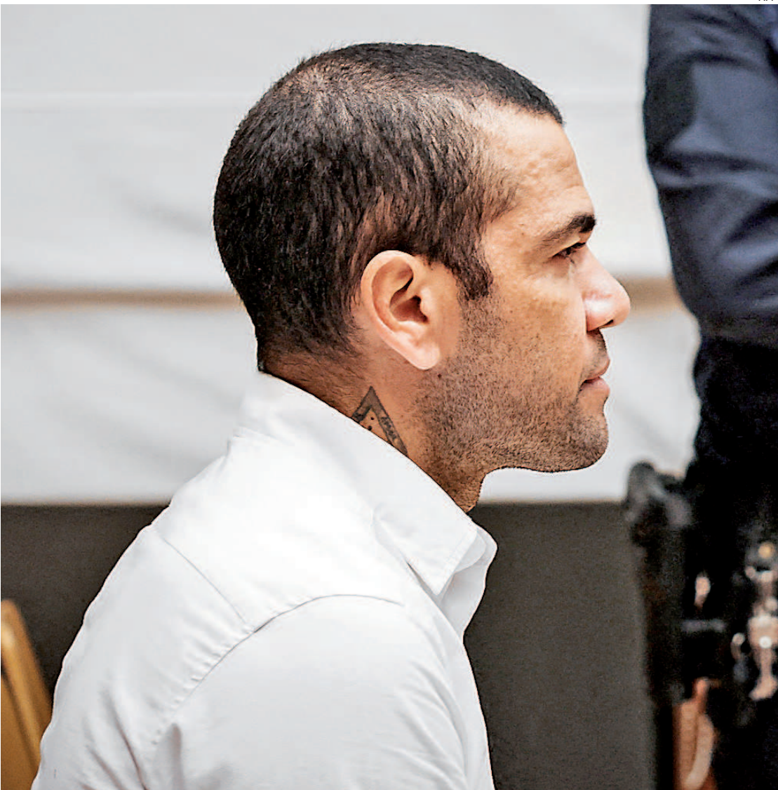
Daniel Alves deu detalhes de como foi o dia em que se encontrou com mulher na boate Sutton

Daniel Alves também detalhou como foi para o banheiro com a denunciante. Ele alegou que, em nenhum momento, forçou a jovem a entrar no banheiro, que foi na frente e a aguardou por alguns minutos no local. Ainda indicou que a relação foi consensual e negou a agressão sexual.