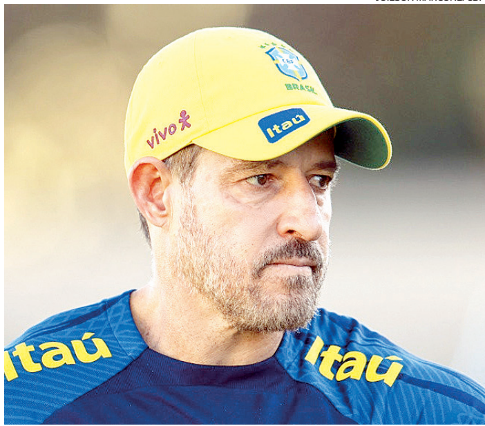
Ramon vem sendo criticado após atuações ruins da Seleção sub-23

Além de Klopp, outros nomes considerados por Deco, diretor de futebol do Barcelona, são os do português Sérgio Conceição, que atualmente comanda o Porto, e o alemão Hansi Flick, ex-treinador do Bayern de Munique e da seleção de seu país.