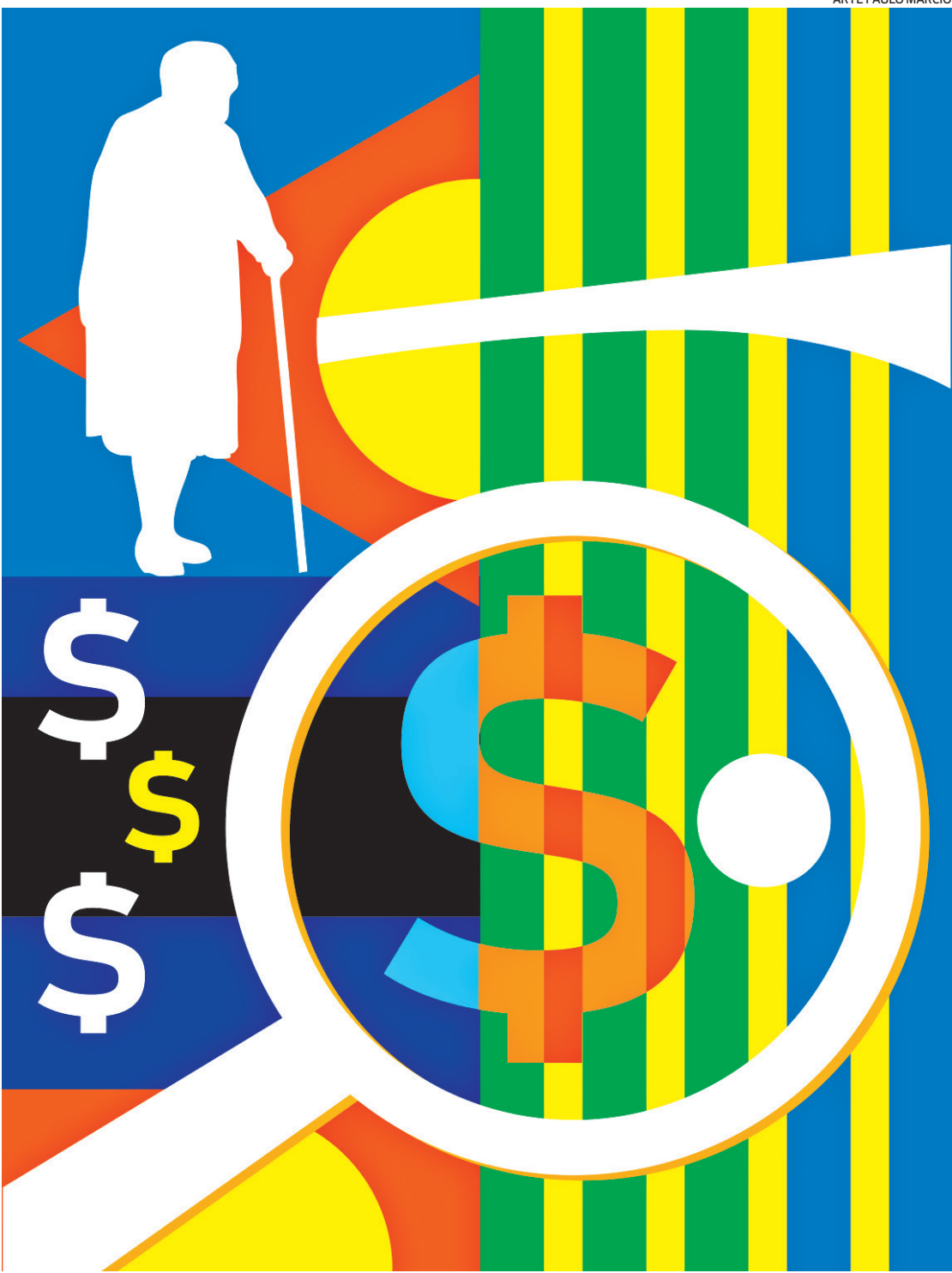
ARTE PAULO MÁRCIO

Os aposentados também podem voltar a trabalhar sem ter o benefício cortado. Contudo, o INSS também restringe a volta ao trabalho de quem está aposentado por invalidez. Além disso, quem se aposentou por atividade especial (insalubre ou periculosa) não pode voltar ao trabalho em situações que coloquem em risco a saúde ou integridade física. Para saber mais informações sobre o INSS, economia e finanças, você pode me acompanhar no meu canal no YouTube, João Financeira, e meu perfil no Instagram, @joaofinanceiraoficial.