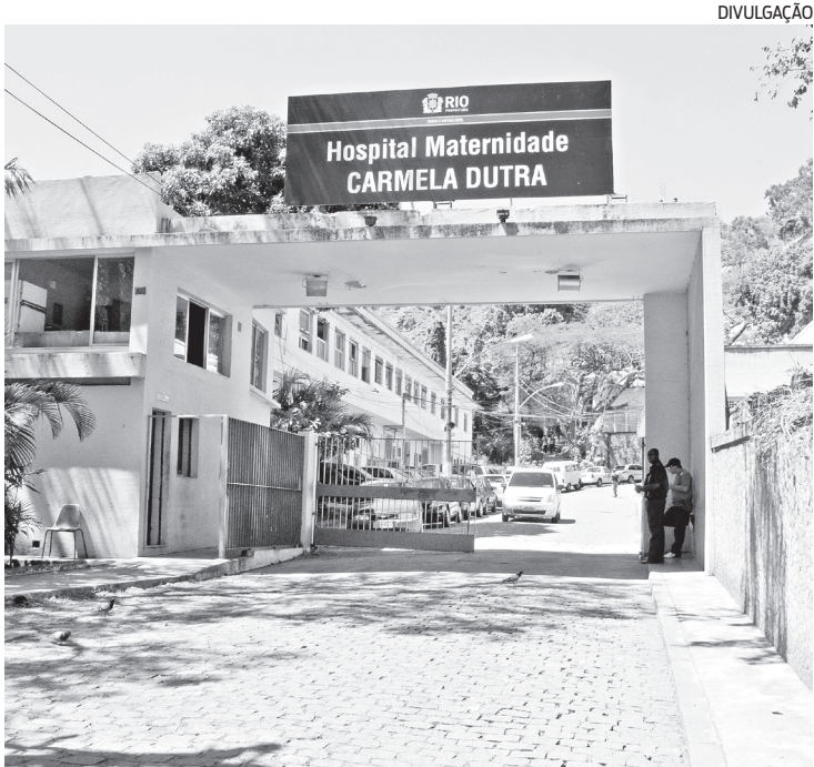
Caso aconteceu em julho de 2023 na Maternidade Carmela Dutra