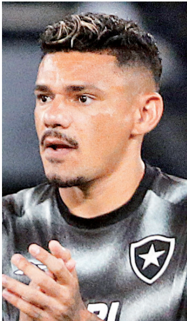
VITOR SILVA / BOTAFOGO