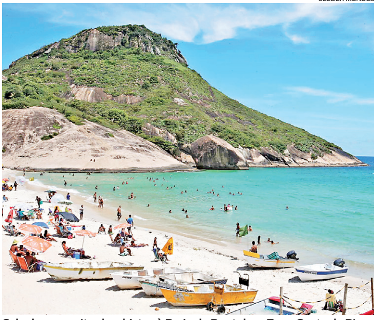
Calor levou muitos banhistas à Praia do Pontal, na Zona Oeste do Rio

Após uma terça-feira com calor, com temperatura máxima de 34°C, céu parcialmente nublado e tempo firme, o dia de hoje