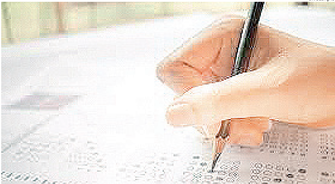
O concurso público unificado prevê a inscrição para a disputa por vagas para mais de um cargo

As taxas são de R$ 90 para os cargos de nível superior e de R$ 60 para o bloco de cargos de nível médio. O CNPU terá 6.640 vagas para 21 órgãos da administração pública federal.