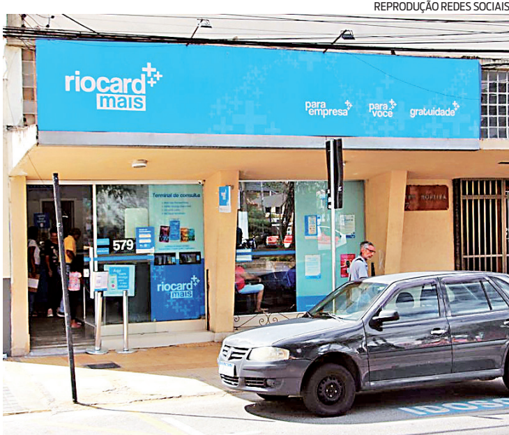
Alunos da rede municipal devem solicitar o cartão na loja da Riocard+

Na loja, será feita uma foto do aluno, e os seguintes documentos devem ser apresentados, de acordo com o Decreto Municipal 46.852/2019: documento de identificação oficial com foto ou certidão de nascimento (se for menor, o original);