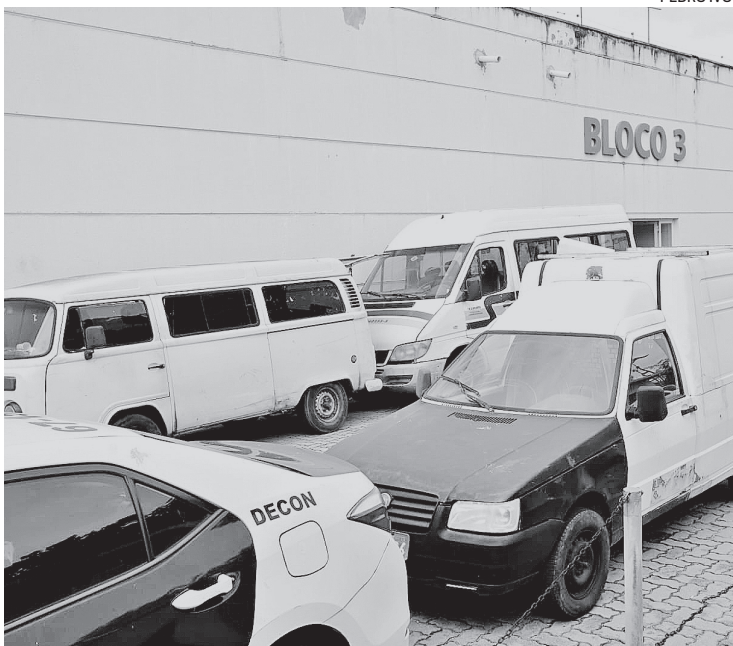
Agentes apreenderam no local uma van, dois carros e uma kombi

na Cidade da Polícia, em Benfica, Zona Norte do Rio, onde ficarão à disposição da Justiça. DEPÓSITO DA PREFEITURA Procurada, a Secretaria de Ordem Pública (Seop) afirmou que o depósito público que os homens foram presos é da prefeitura. Além disso, a pasta informou que está apurando internamente em quais circunstâncias esses furtos teriam ocorrido e que uma sindicância será aberta para a apuração do caso. Reportagem do estagiário Leonardo Marchetti, supervisão de Iuri Corsini