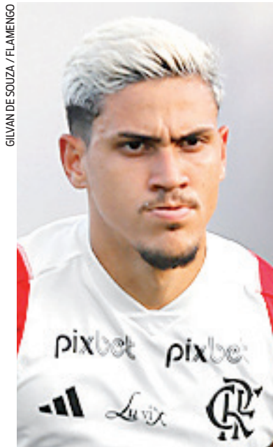
GILVAN DE SOUZA / FLAMENGO