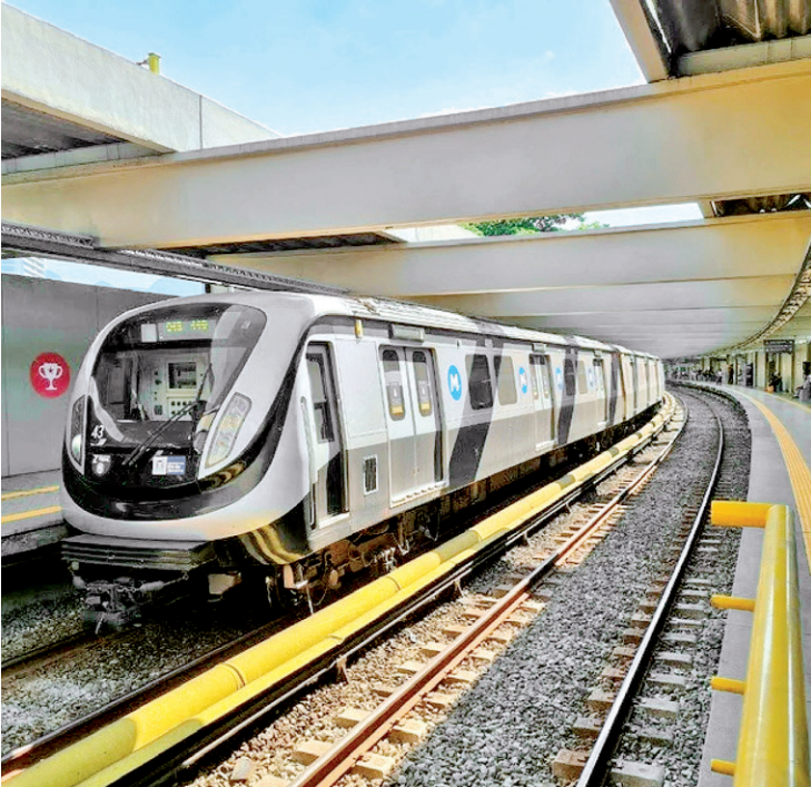
Metrô terá esquema especial no Carnaval até a noite das Campeãs