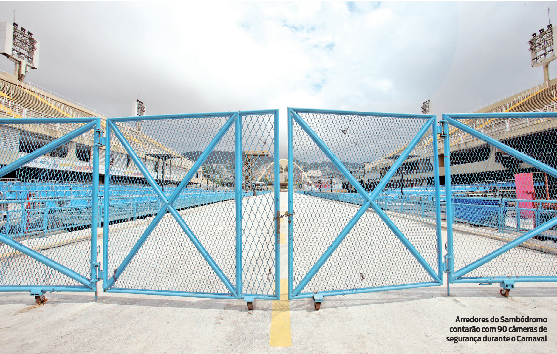
Arredores do Sambódromo contarão com 90 câmeras de segurança durante o Carnaval

As unidades de Atenção Primária, que incluem centros de saúde, clínicas da família, centros de atenção psicossocial, policlínicas e centros de reabilitação não vão abrir na segunda-feira (12) e na terça-feira (13). De acordo com a Secretaria Municipal de Saúde, esses espaços funcionarão das 8h às 12h na sexta (9) e a partir das 13h na quarta (14). No sábado (10), o horário de atendimento será o usual de cada local.