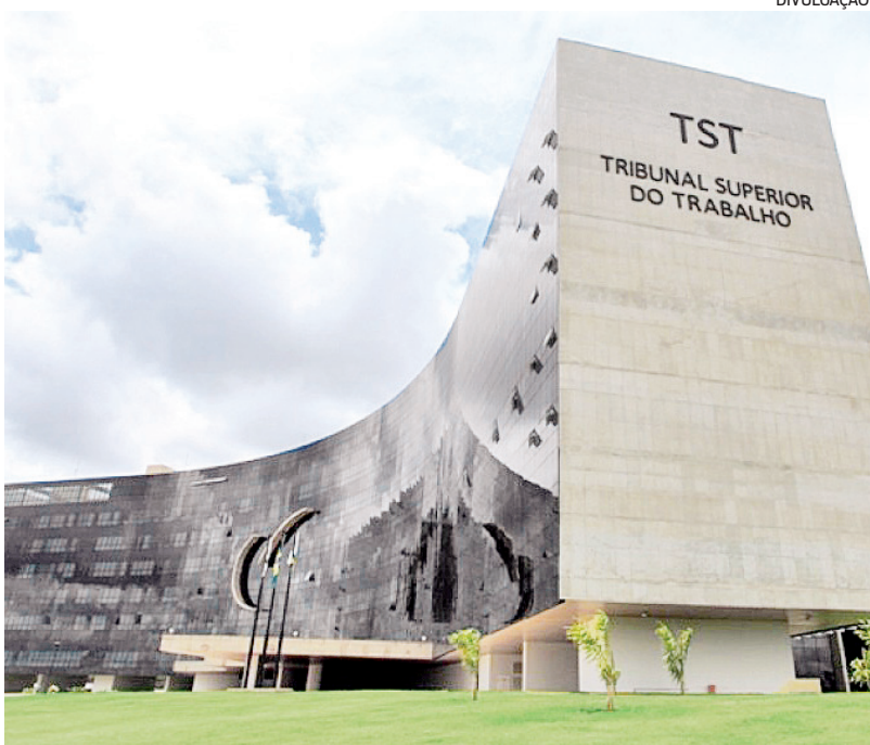
Tribunal Superior do Trabalho de olho em quem descumpre lei de cotas.

De acordo com Lei 8.213/1991, empresas com mais de mil empregados precisam ter no mínimo 5% de postos de trabalho ocupados por pessoas com deficiência ou reabilitadas. Descumprimento pode resultar em multa pesada. E mais, para o TST, é imprescindível que demonstrem realização de esforços firmes e compatíveis com vontade real de querer contratar esses trabalhadores, promovendo e garantindo condições de acesso.