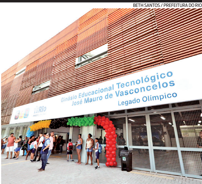
Fachada do GET José Mauro de Vasconcelos no bairro de Bangu

Em 2023, mais de 150 mil cartões foram utilizados por estudantes municipais, que realizaram mais de nove milhões de viagens gratuitas ao longo do ano no sistema de ônibus na cidade do Rio.