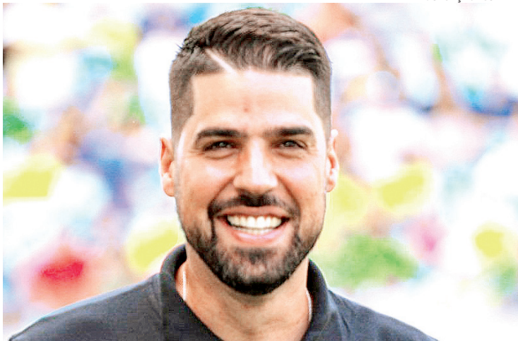
Basta a diretoria concluir o pagamento da multa de António Oliveira

Outro nome que esteve perto de acertar com o Corinthians foi o de Cuca, porém a diretoria temia uma nova rejeição por parte da torcida ao treinador, que pediu demissão da equipe paulista no ano passado após dois jogos. Na época, ele foi pressionado por conta de uma condenação por estupro que tinha na Suíça, em 1987.