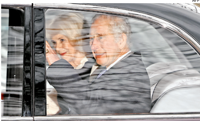
Rei Charles III e a rainha Camilla cumprimentam a multidão

O CPNU permitirá a inscrição para a disputa por vagas para mais de um cargo, desde que dentro do mesmo bloco temático. Uma das vantagens é que o candidato pagará uma taxa de inscrição única. Ao concorrer a mais de um cargo, o candidato deverá classificar as vagas de interesse por ordem de preferência para definir a prioridade em uma possível chamada, baseada na nota alcançada.