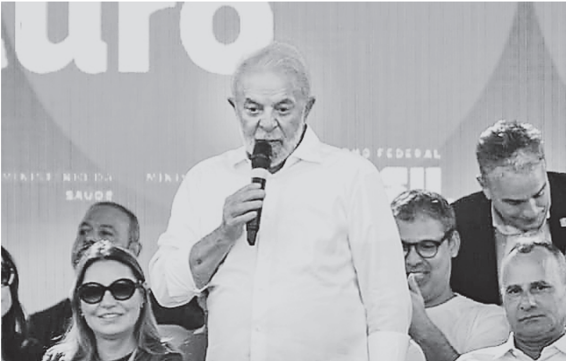
Lula participou de evento que oficializou construção de campus do IFRJ e Hospital Oncológico

“São pequenas coisas que a gente vai fazendo e construindo uma pátria educadora. Uma pátria em que as pessoas começam a sentir que elas têm direitos e que eles são atendidos. Quando a ministra Nísia diz que vamos construir um hospital do câncer em Belford Roxo, nós vamos instaurar ainda quando eu for presidente para que as pessoas sejam tratadas com respeito. O pobre morre esperando uma consulta e, às vezes, nem é atendido. Eu voltei para tratar do povo com respeito, carinho e decência. Eu quero cuidar do povo. Cuidar de cada homem e não