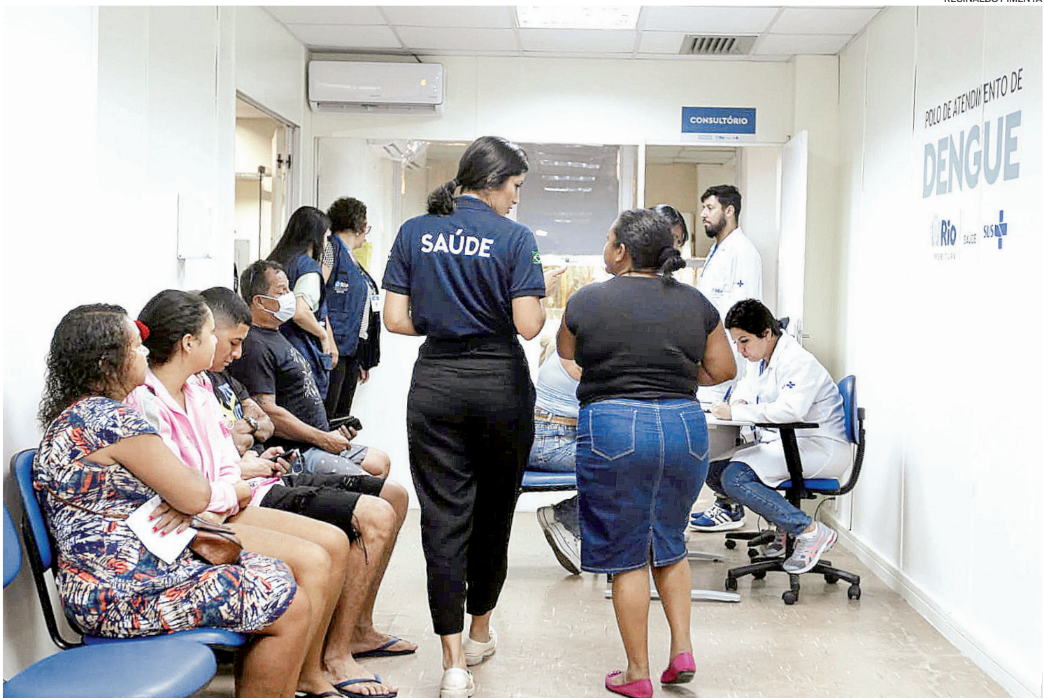
Unidade específica para tratamento de casos de dengue foi inaugurada no Centro Municipal de Saúde Rodolpho Rocco, em Del Castilho

“O paciente faz tudo aqui, colhe sangue, faz o hemograma e sorologia. Se precisar de hidratação, faz aqui mesmo, oral ou venal e, se precisar de internação, também tem leitos dedicados à virose. O objetivo é que a gente consiga reduzir o número de casos graves e óbi-