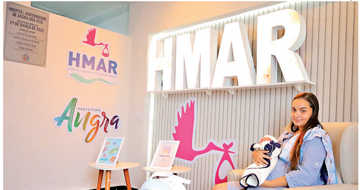
Unidade realizou 22.975 atendimentos humanizados para gestantes somente no ano passado