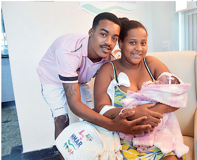
Mães recebem kit para os primeiros cuidados com os bebês