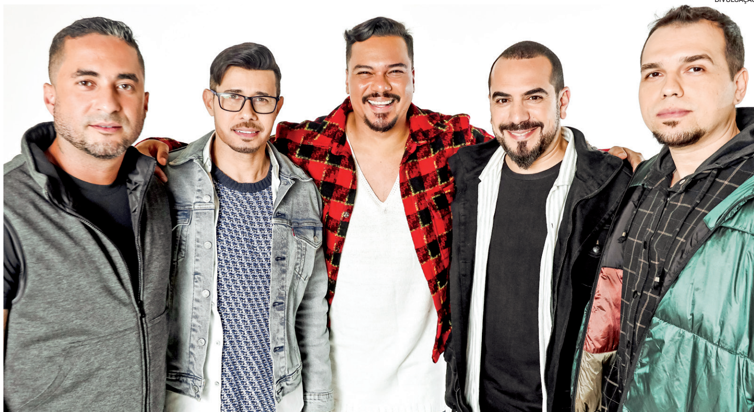
Com seus grandes sucessos, o grupo Sorriso Maroto vai fechar a série de shows gratuitos na Praia do Anil, no dia 14 de fevereiro