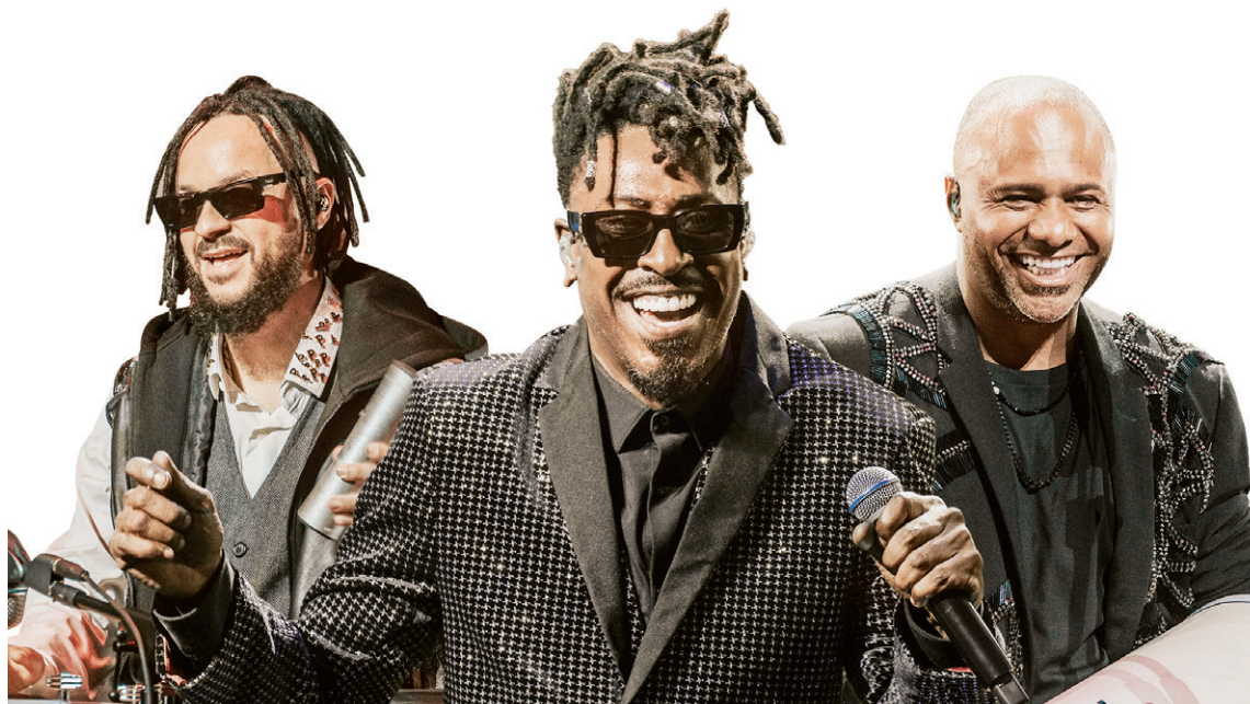
Pagode romântico do grupo Pixote vai abrir a série de grandes shows do Carnaval de Angra dos Reis