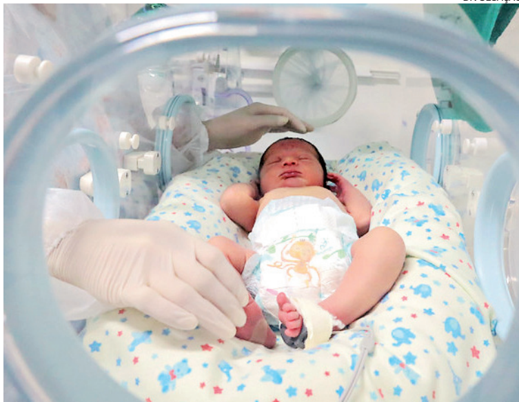
HMAR está sob responsabilidade da Prefeitura desde março de 2022

HMAR possui 61 leitos e oferece atendimento humanizado e qualificado