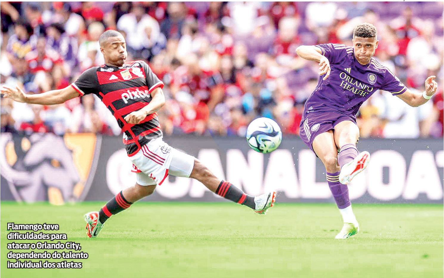
Flamengo teve dificuldades para atacar o Orlando City, dependendo do talento individual dos atletas

Com muitas mudanças, inclusive do Orlando City, foi normal a queda de qualidade no jogo. O Flamengo, que mexeu mais ao longo do segundo tempo, perdeu completamente a identidade e ficou ainda mais com dificuldade de criar. Pelo menos se ajustou melhor defensivamente, mesmo ainda dando levando bola nas costas da zaga, e não levou sustos.