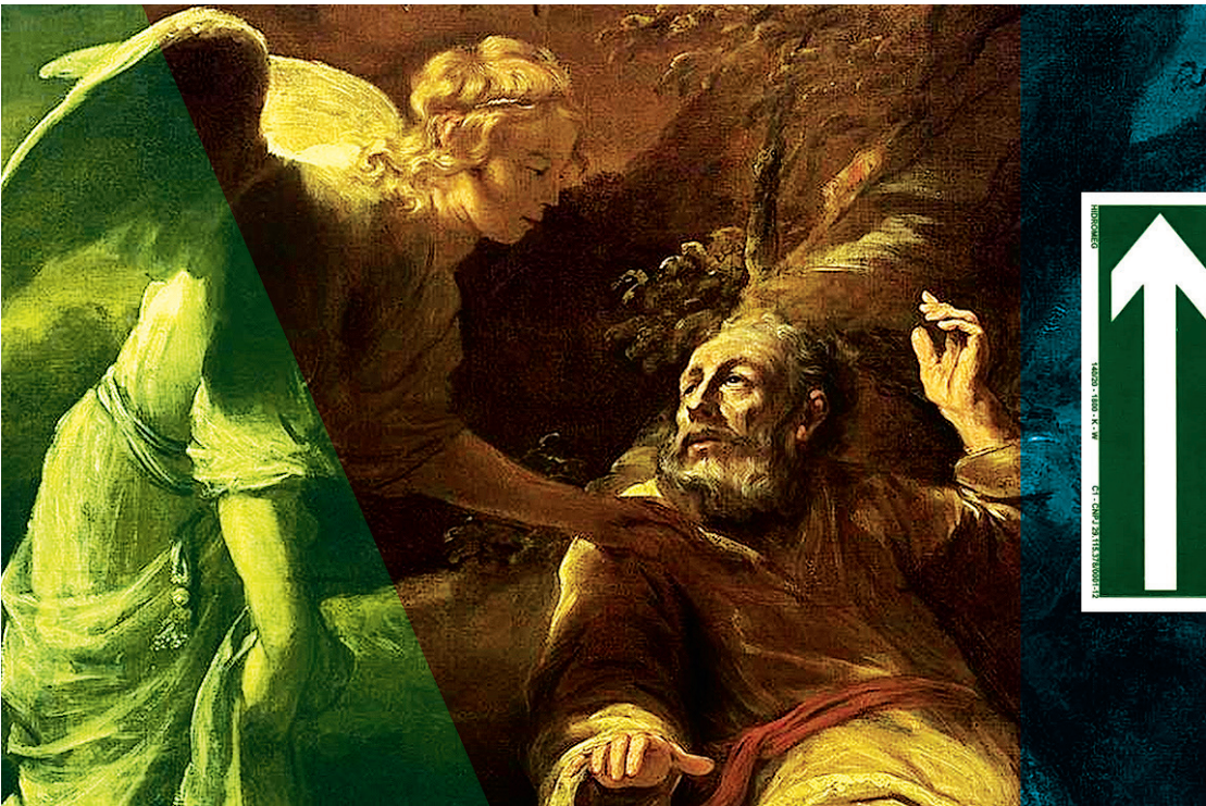
ARTE O DIA