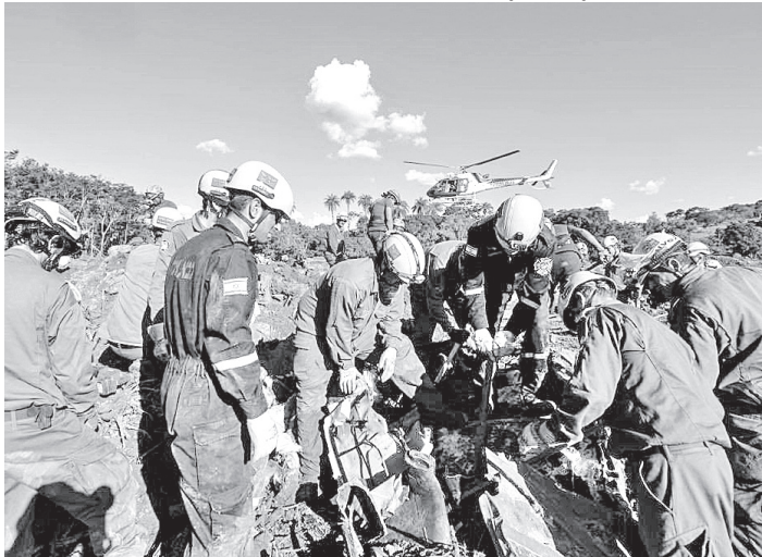
Tropas israelenses foram enviadas para buscas por vítimas