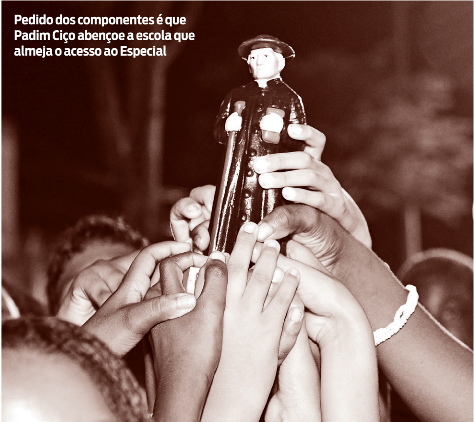
Pedido dos componentes é que Padim Ciço abençoe a escola que almeja o acesso ao Especial