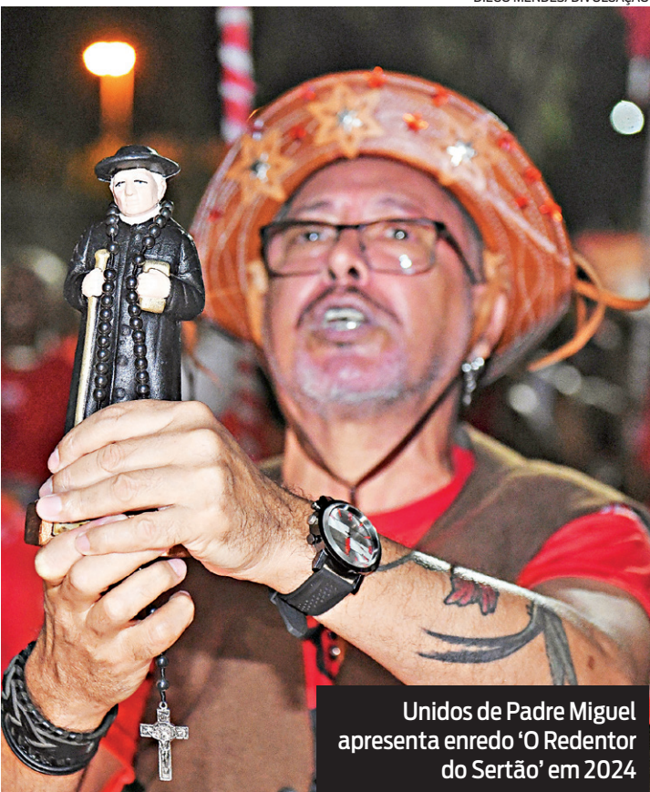
Unidos de Padre Miguel apresenta enredo ‘O Redentor do Sertão’ em 2024

“Minha ligação com o santinho se deve ao fato de o meu saudoso pai ter migrado para o Rio de Janeiro nos anos 50 e,