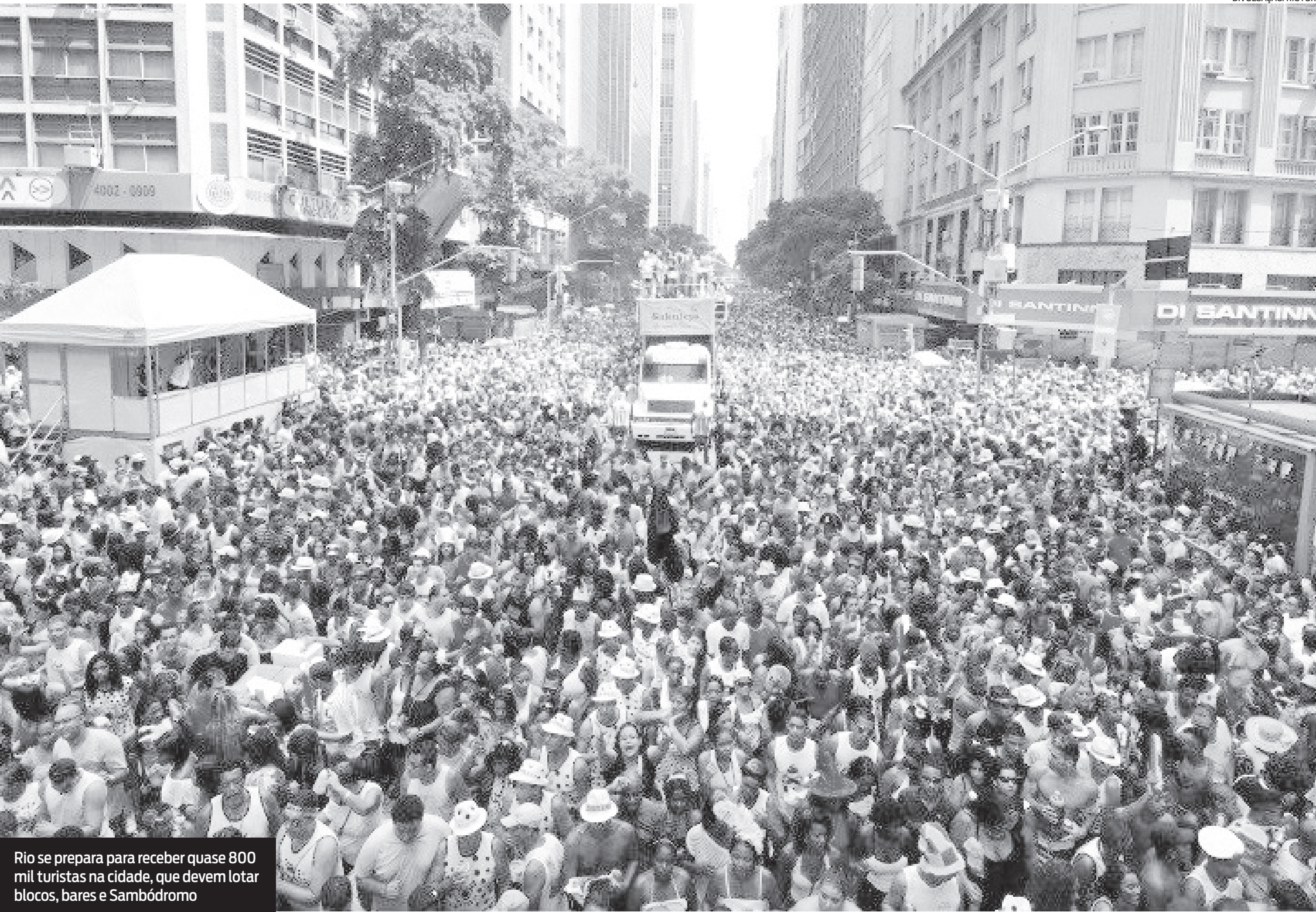
Rio se prepara para receber quase 800 mil turistas na cidade, que devem lotar blocos, bares e Sambódromo