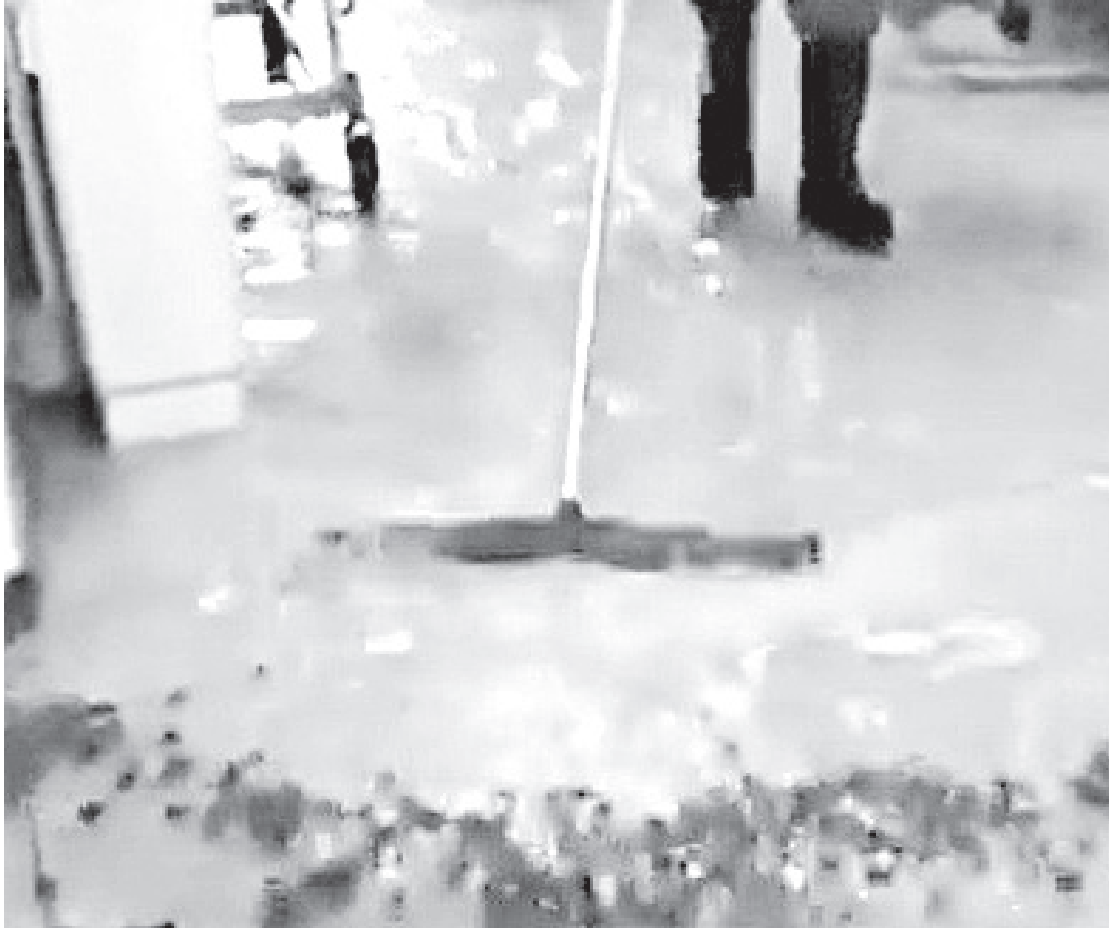
Temporal inundou de sujeira e detritos o interior de um hospital em Feira do Santana, na Bahia

“A Superintendência de Proteção e Defesa Civil da Bahia (Sudec) informa que está monitorando os municípios baianos, atingidos pelas fortes chuvas das últimas horas, e desenvolvendo ações de resposta imediata a fim de minimizar os impactos sofridos pelas populações afetadas”, disse a Sudec em publicação nas redes sociais.