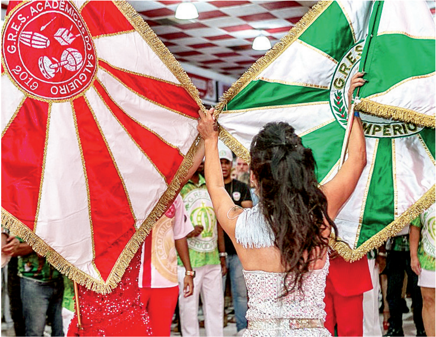
O último encontro entre Salgueiro e Império da Tijuca na rua havia sido em 17 de dezembro de 2023. Hoje, as duas escolas se reúnem de novo

A Rua Conde de Bonfim, no coração da Tijuca, Zona Norte do Rio, será palco de um grande evento gratuito hoje, a partir das 17h. Na reta final do Carnaval, a via receberá os ensaios do Império da Tijuca e do Salgueiro (19h). O trecho percorrido fica entre as ruas José Higino e Uruguai, que sofrerão interdições no trânsito. Os ensaios vão contar com a presença de todos os segmentos e alas de comunidade, além dos torcedores das duas agremiações, que podem acompanhar a festa pelas calçadas. O último encontro das duas escolas na rua havia sido em 17 de dezembro de 2023. O Império da Tijuca vai desfilar na sexta-feira de Carnaval, dia 9 de fevereiro, com o enredo ‘Sou Lia de Itamaracá cirandando a vida na beira do mar’, do carnavalesco Junior Pernambucano, pela Série Ouro. A proposta é homenagear os 80 anos da cantora Lia de Itamaracá. Já o Salgueiro, que está em busca do décimo título de sua história, pisa na Sapucaí no domingo, dia 11, com o enredo ‘Hutukara’, do carnavalesco Edson Pereira. O tema exalta a cultura yanomami.