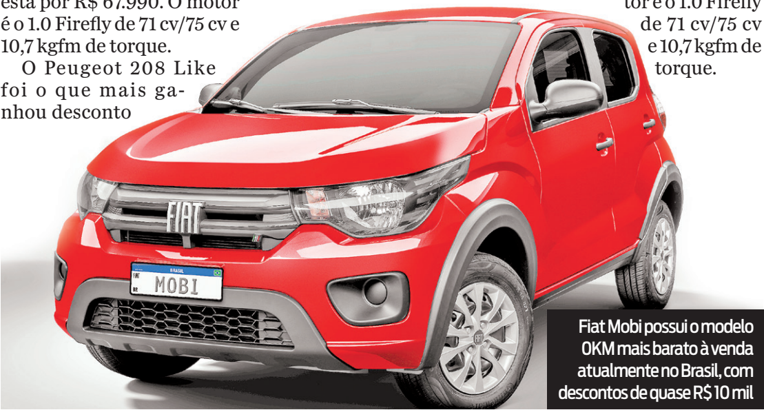
Fiat Mobi possui o modelo OKM mais barato à venda atualmente no Brasil, com descontos de quase R$10 mil

com mudanças no consumo. Por fim, outro modelo com a mesma potência 1.0 é o Fiat Argo, que saiu de R$ 83.490 para R$ 75.975. O motor é o 1.0 Firefly de 71 cv/75 cv e 10,7 kgfm de torque.