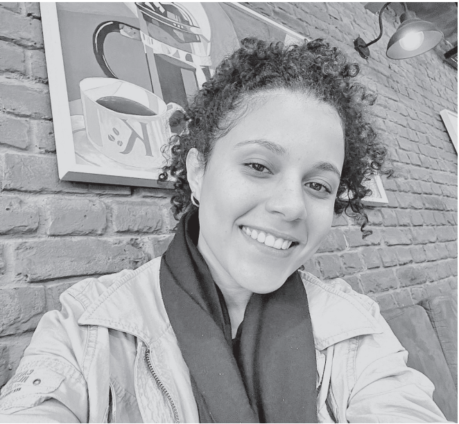
Representante comercial passa primeiro Carnaval no Rio

LOJISTAS PODEM LUCRAR MAIS Para entender os impactos desta chegada para os comerciantes, basta ver a expectativa do Sindicato dos Lojistas do Comércio do Município do Rio de Janeiro (Sindilojas). O presidente da entidade, Aldo Gonçalves, reforçou que o feriado é esperado pelos lojistas da cidade. “O comerciante está sempre antenado com os festejos sociais para oportunizar negócios. O calendário é fonte de expectativas para os rumos da economia brasileira. Os lojistas estão animados com a quantidade de visitantes que estão na cidade e esperam uma presença ainda maior de turistas nacionais e estrangeiros para o Carnaval”, disse. O DIA também conversou com Fabiano Gonçalves, presidente da Federação da Câmara dos Dirigentes Lojistas do Estado do Rio de Janeiro, que elencou os setores que mais lucram neste período. ‘FINAL DO ÁPICE’ “Para o setor dos hotéis, lojas de instrumentos, bares, restaurantes, lanchonetes, supermercado é um momento ímpar, maravilhoso. É o final do ápice do Rio de Janeiro, que começa próximo ao Réveillon e termina no Carnaval”, explicou. Fabiano Gonçalves também destacou que há um produto “queridinho” pelos consumidores. De acordo com ele, há um consumo “absurdo” de cerveja.