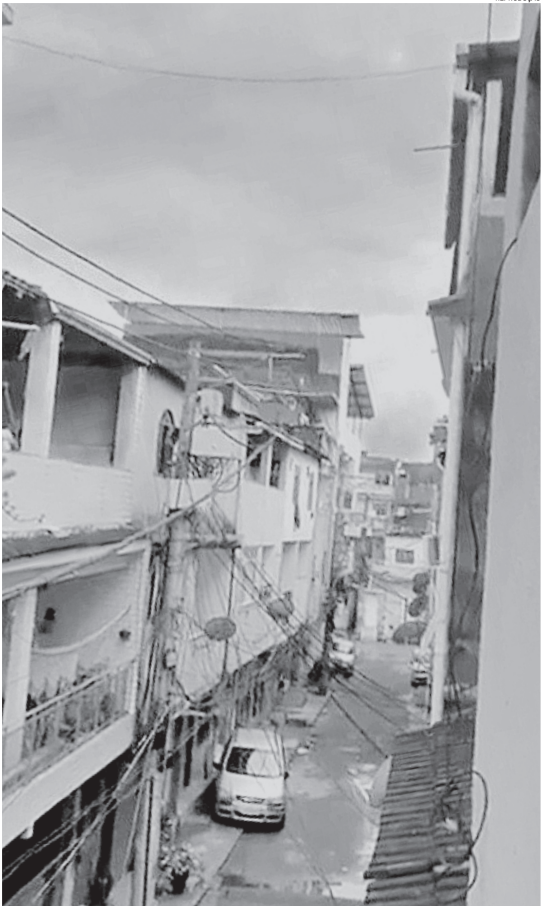
A comunidade da Gardênia Azul tem sido palco da guerra entre traficantes e milicianos desde 2023

O corpo de um homem foi encontrado dentro de valão que corta o Gardênia, ainda na manhã de quinta, horas após os confrontos.