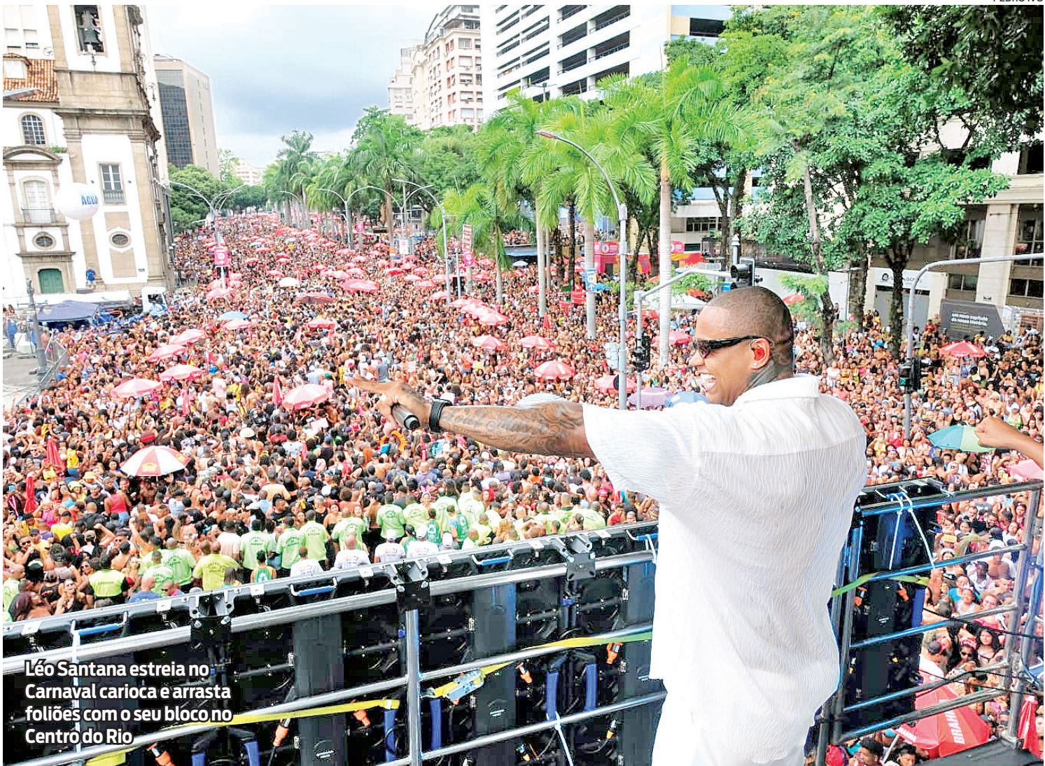
Léo Santana estreia no Carnaval carioca e arrasta foliões com o seu bloco no Centro do Rio

O cantor Léo Santana, uma das grandes estrelas do Carnaval de Salvador, reuniu uma multidão no Centro do Rio, na manhã de ontem, com o seu bloco. Marcado para começar às 8h, o cortejo só teve início mesmo às 10h, na Rua Primeiro de Março, quando o artista subiu no trio elétrico e cantou sucessos como ‘Zona de Perigo’, ‘Contatinho’ e muitos outros. De acordo com a Riotur, o público chegou a 500 mil pessoas, superando a expectativa, que era de 150 mil. “É um sonho antigo, muito antigo, que eu e a equipe LS estamos realizando. Sou muito grato a cada um de vocês. Nesse sábado, de manhãzinha, vocês poderiam estar em qualquer outro lugar, mas estão aqui nos prestigiando. Sou grato a cada um de vocês, a todo povo nordestino que se encontra aqui, a todo povo carioca”, agradeceu Léo Santana. O cantor Ferrugem, que também se apresentou, exaltou a companhia do amigo: “É uma muita alegria estar cantando no bloco com o Léo”. Marvyla, outra a cantar, também destacou a amizade. “Ele não é só um colega de trabalho, mas um amigo. É uma das melhores vozes do país.” Além do astro, um folião também estava realizando um sonho. O bombeiro civil Lucas Terra, de 29 anos, disse que já estava esperando por um show do cantor desde que começou a curtir o Carnaval no Rio, aos 15, quando o baiano lançou seu hit ‘Rebolation’, ainda com a banda Parangolé. “Esse bloco está bom demais. Esperei muito por esse momento. É muito raro podermos ver o Léo Santana, um cantor de quem