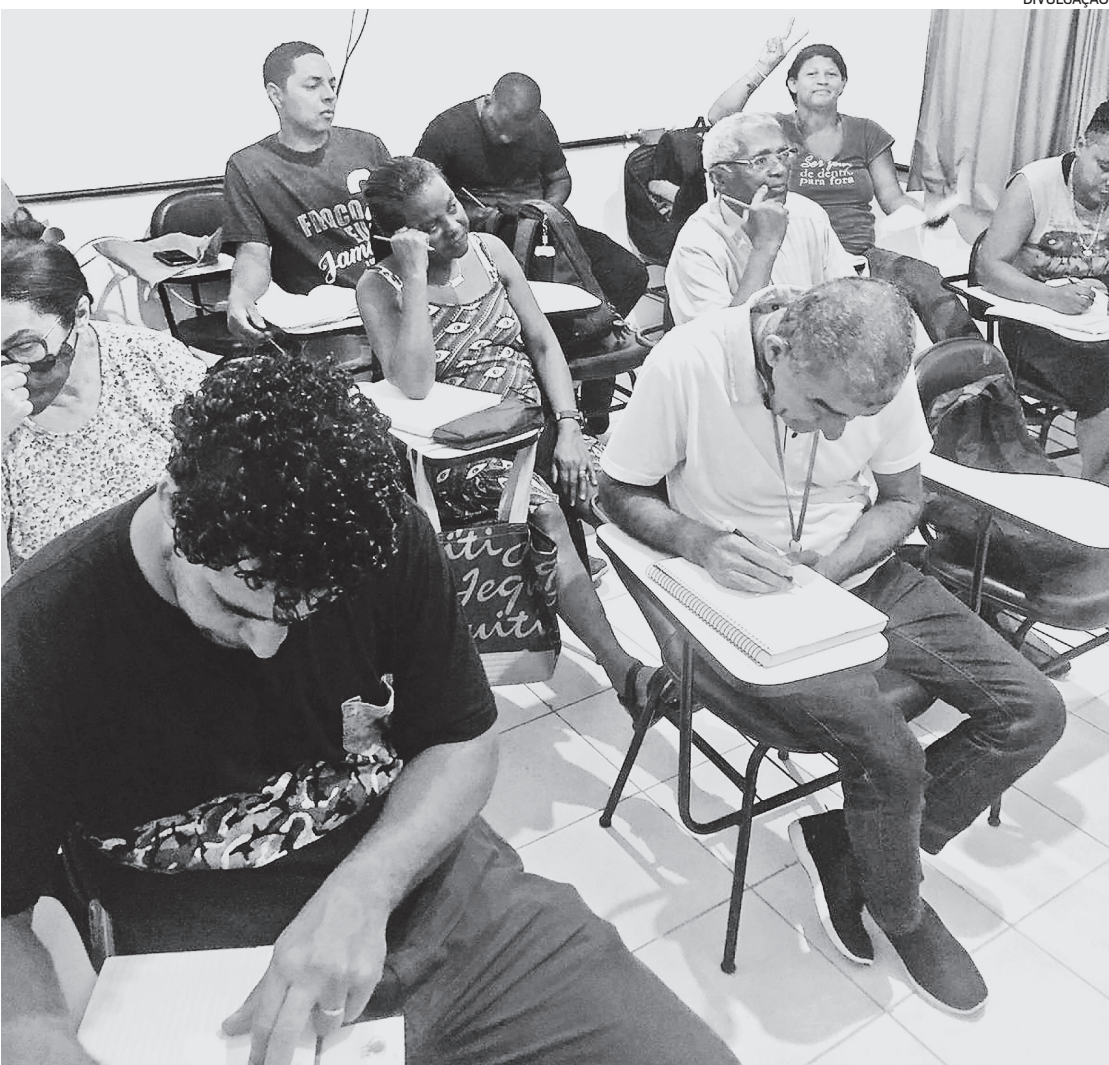
Classe de alfabetização de adultos está lotada e com candidatos em fila de espera por novas turmas