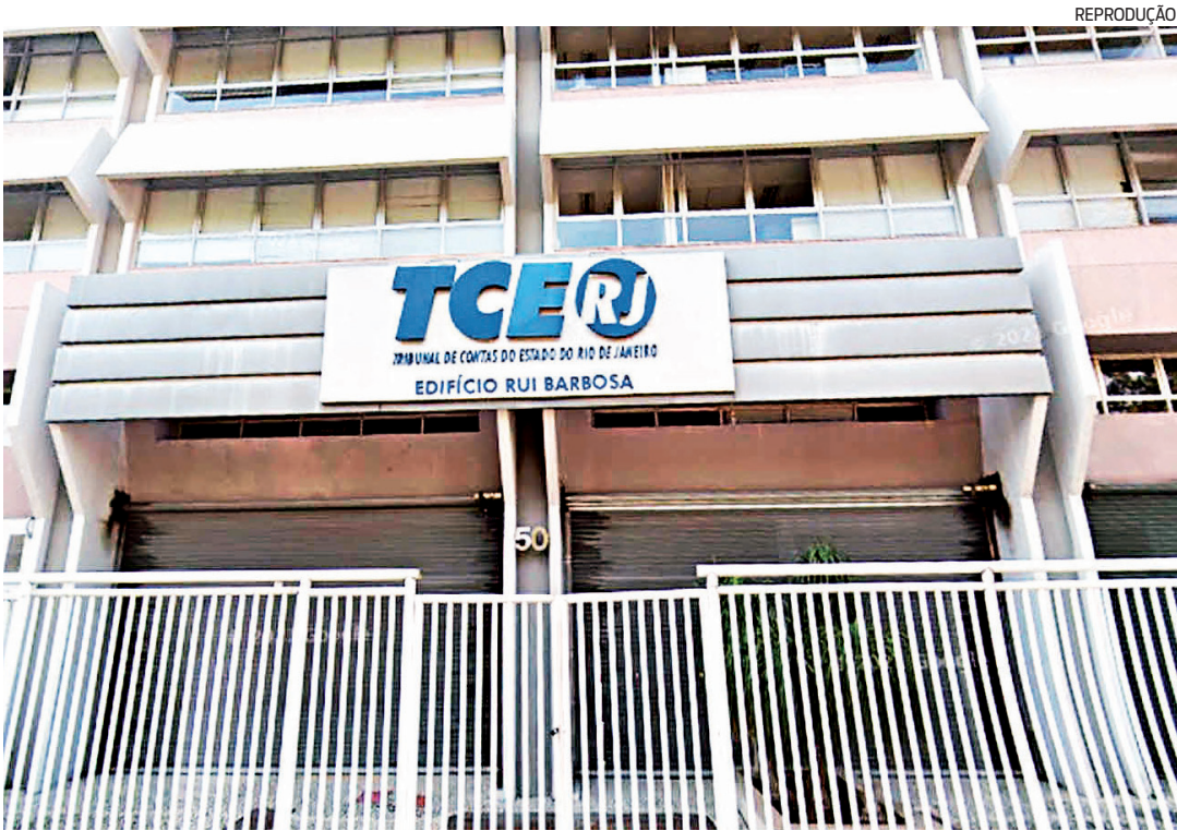
Auditoria do TCE-RJ apontou que prefeituras fluminenses precisam se adequar à LGPD