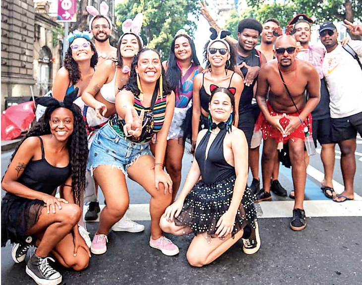
Esbanjando animação, jovens curtiram funks da antiga no desfile

cando valorizar a autêntica cultura carioca, a festa mistura diversos gêneros musicais como funk, rap e samba, resultando em um estilo inovador.