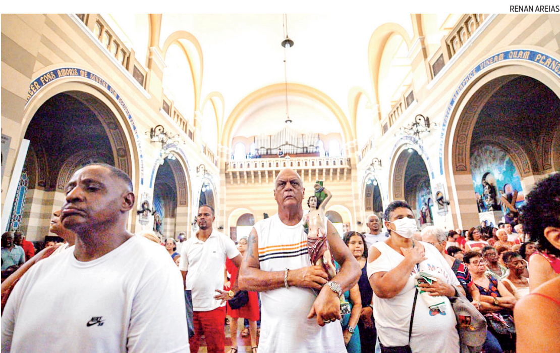
Devoto segura imagem do padroeiro em missa na Tijuca; fiéis também levaram rosas vermelhas e brancas

Santo padroeiro da cidade foi homenageado em seu dia com missas, procissões, carreatas e festas