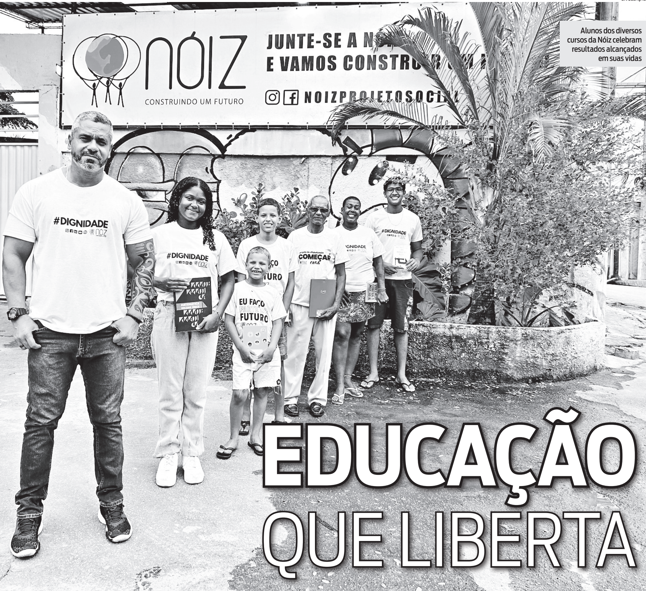
Alunos dos diversos cursos da Nóiz celebram resultados alcançados em suas vidas