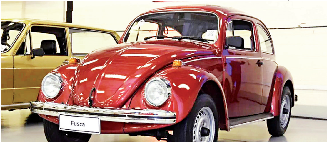
Fusquinha de 1986 é o mais velho do acervo. Modelo saiu da linha de produção e foi direito para o acervo

O documento oficial, que custa R$ 500 e pode ser emitido através do site VW Collection, inclui características do veículo, como chassi,