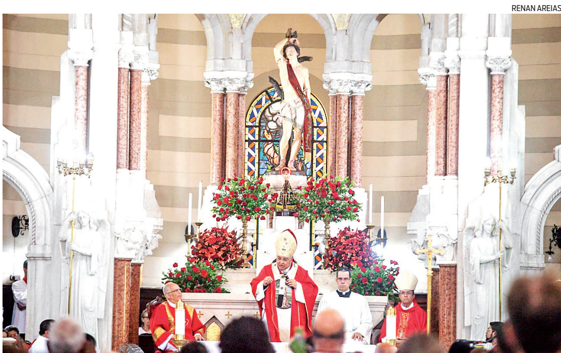
O cardeal arcebispo do Rio Dom Orani Tempesta celebrou missa a São Sebastião na Basílica dos Capuchinhos