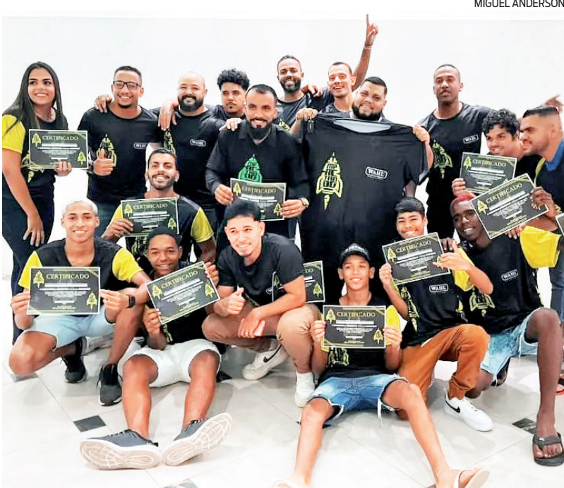
Projeto forma barbeiros no Complexo da Maré.

Um projeto gratuito que forma barbeiros de alto padrão é o grande sucesso do Complexo da Maré. Jaca, reflexo, americano e nevou são alguns dos cortes mais procurados. O programa “Impactando Kelson’s” incentiva a profissionalização de adolescentes, os afastando do crime organizado. O curso tem aulas aos domingos e segundas, das 8h às 12h. O lema do projeto é: “mais pente de máquina, menos pente de fuzil, nosso projeto vai impactar o Brasil”.