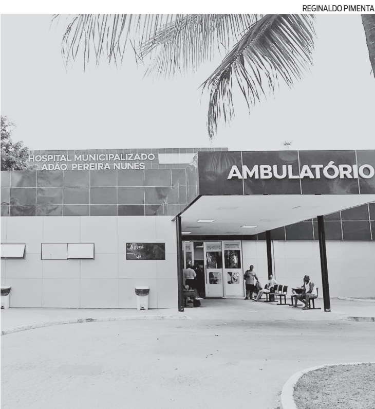
Adolescente está em estado grave no Hospital Adão Pereira Nunes

do Segurança Presente do município foram chamados e, em seguida, equipes do 20º BPM (Mesquita) foram acionadas para uma ocorrência de lesão corporal. No local, o adolescente foi encontrado com marcas de tiro e os policiais descobriram que os disparos partiram do filho de um militar da corporação. A arma e as munições do PM foram apreendidas e a área preservada para perícia. O adolescente foi socorrido para a Unidade de Pronto Atendimento (UPA) de Edson Passos, em Mesquita, e transferido para o Hospital Municipalizado Adão Pereira Nunes (HMAPN), em