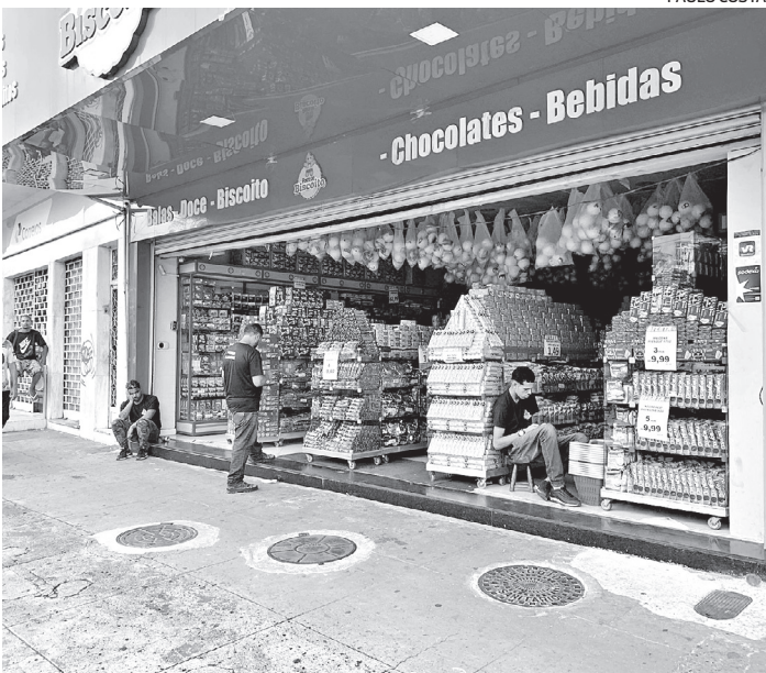
Comércio do bairro registra prejuízos com as quedas de energia

uso do ar-condicionado em todas as corridas. “O ar-condicionado é requisito para o cadastro de um carro na plataforma da Uber em qualquer modalidade de viagens, e o Código da Comunidade estabelece que o motorista parceiro deve realizar manutenção para garantir as condições de funcionamento de todos os itens do veículo, o que inclui o ar-condicionado”, disse a Uber, em nota.