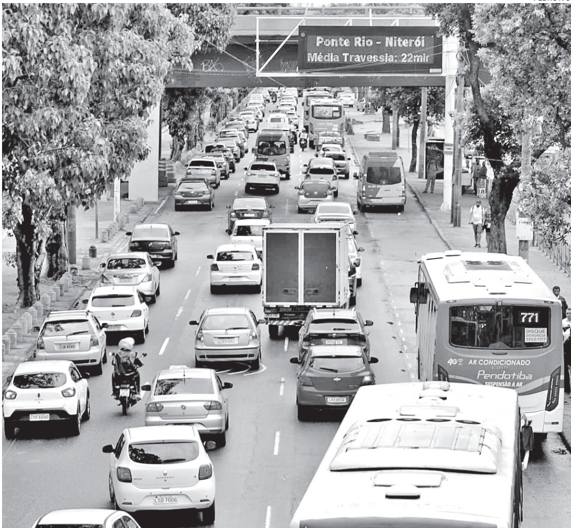
Recentemente, veículos de aplicativos foram obrigados por lei a circular com ar-condicionado no estado

passageiros. Dessa forma, é esperado que durante as viagens o ar-condicionado seja utilizado, independentemente da modalidade da viagem, para proporcionar temperatura confortável para ambos ao longo do trajeto”, comunicou a empresa por meio de nota. A resolução da Secretaria de Defesa do Consumidor, do Governo do Estado, foi enviada às plataformas de transporte no dia 8 de janeiro. O documento estabelecia um prazo de até sete dias para adequação às regras determinadas em decreto, que obriga o uso do ar-condicionado.