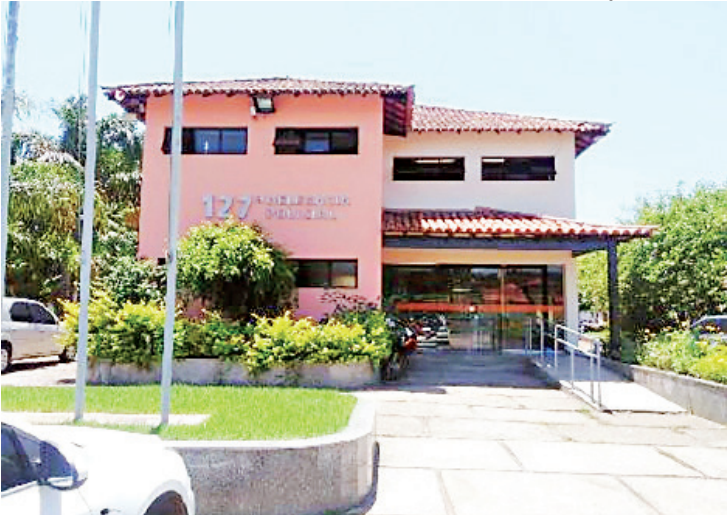
Afogamento de gêmeos é investigado na 127ª DP (Armação dos Búzios)

Ainda não se sabe como os bebês caíram na piscina. Uma perícia foi realizada no local do afogamento e a mãe das crianças já prestou depoimento. “Diligências estão em andamento para esclarecer todos os fatos”, completou a Polícia Civil, em nota.