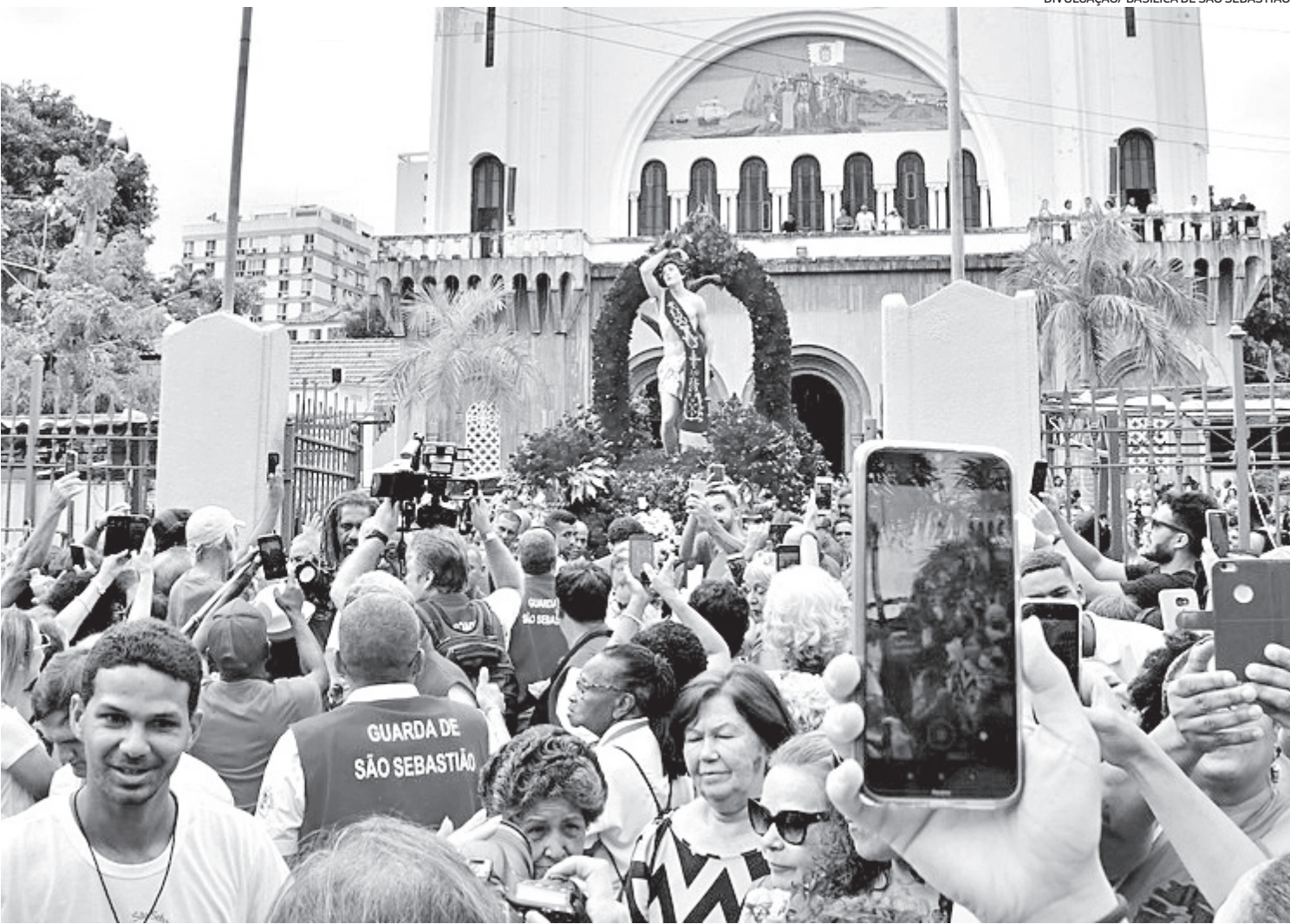
A tradicional procissão de São Sebastião, realizada pela Igreja dos Capuchinhos, na Tijuca, tem início às 16h e término na Catedral Metropolitana

programação começa às 5h, com confissões e a primeira das 15 missas do dia, além da tradicional procissão até a Catedral Metropolitana, com saída prevista para as 16h e passagem pelas principais ruas do Centro. A missa das 9h será celebrada pelo cardeal Dom Orani Tempesta. Caso os fiéis desejem levar água benta para casa, basta que se dirijam aos frades capuchinhos para a benção. Barracas oferecerão lanches e também artigos religiosos na área externa. A imagem do santo será exposta para contemplação, orações, pedidos e agradecimentos. A Igreja dos Capuchinhos espera receber 40 mil pessoas. SINCRETISMO COM OXÓSSI Mãe Mônica de Oyá, dirigente da Casa Espírita Irmãos de Caridade, conhecida como Gru-