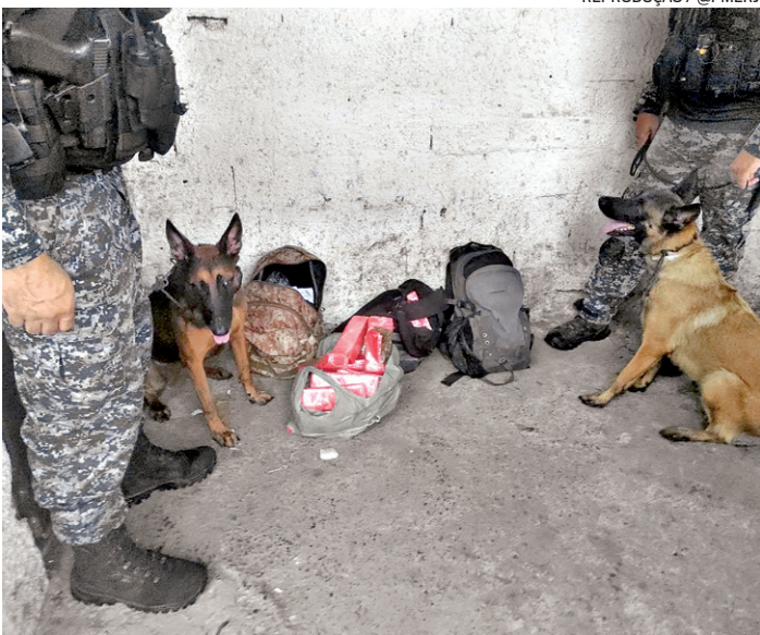
Equipe do Batalhão de Ações com Cães (BAC) apreenderam drogas

A Força Nacional atua no Rio desde o dia 16 de outubro do ano passado, com objetivo de conter a crise na segurança pública causada pela guerra entre milicianos. Em protesto pela morte de um membro de um dos grupos paramilitares, 35 ônibus foram incendiados em um único dia, na Zona Oeste. Ao todo, 300 agentes da corporação e 250 da Polícia Rodoviária Federal (PRF) foram deslocados para reforçar o policiamento no estado.