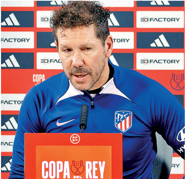
Diego Simeone falou sobre o brasileiro na entrevista coletiva pós-jogo

No clássico entre Atlético de Madrid e Real Madrid, pelas oitavas de final da Copa do Rei, o técnico Diego Simeone discutiu com o atacante brasileiro Vini Jr. No fim, a equipe comandada pelo argentino venceu por 4 a 2, se classificou às quartas de final e o treinador relevou o atrito. “Nada a comentar. Coisas do futebol. O mais importante é o time. Quando viram o que estava acontecendo antes do jogo (homenagem para Griezmann), foi emocionante. Dá um êxtase que é difícil de explicar. O que ficará na memória é o grande jogo que a nossa equipe fez”, declarou Simeone.