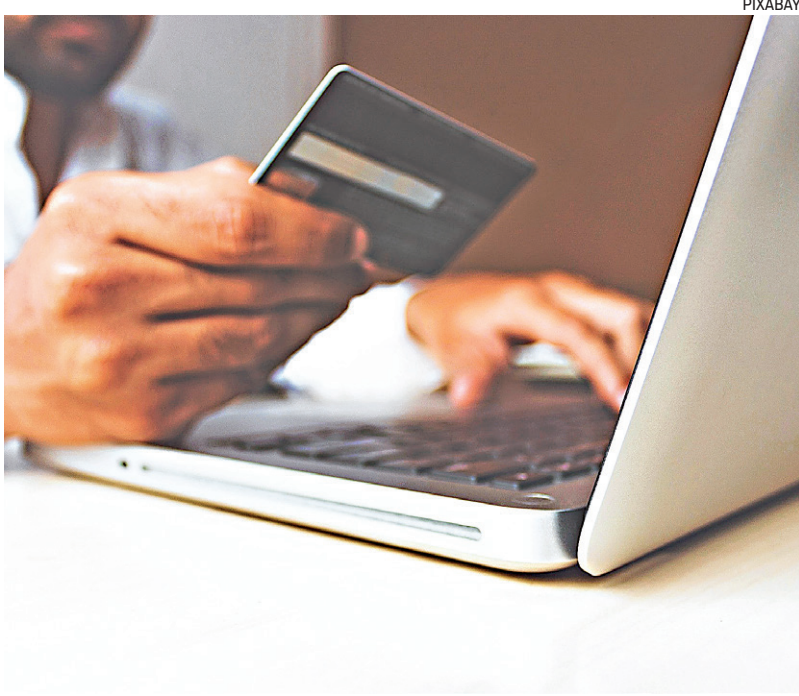
Vendas por pequenas e médias empresas online do Rio surpreendeu.

Pequenas e médias empresas online do estado do Rio de Janeiro faturaram R$ 249 milhões em 2023, 31% a mais do que em 2022. No período, foram vendidos 4,3 milhões de produtos, superando a quantidade do ano anterior em 48%. Os dados são da 9ª edição do NuvemCommerce, estudo anual sobre comércio eletrônico. O ticket médio por compra foi de R$ 212,60 no estado. Os segmentos que mais venderam foram os de moda, acessórios e joias.