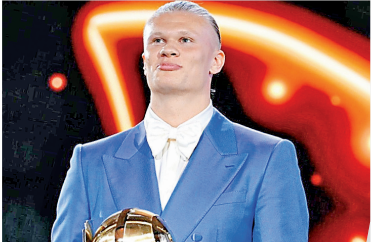
O Globe Soccer é uma premiação da Associação Europeia de Clubes

O atacante Erling Haaland, do Manchester City e da seleção norueguesa, foi eleito o melhor jogador do mundo de 2023 pelo Globe Soccer Awards. A cerimônia de premiação aconteceu ontem, em Dubai, nos Emirados Árabes Unidos. Na temporada passada, Haaland foi fundamental para o Manchester City nas conquistas da Liga dos Campeões, do Campeonato Inglês, da Copa da Inglaterra e da Supercopa da Europa.