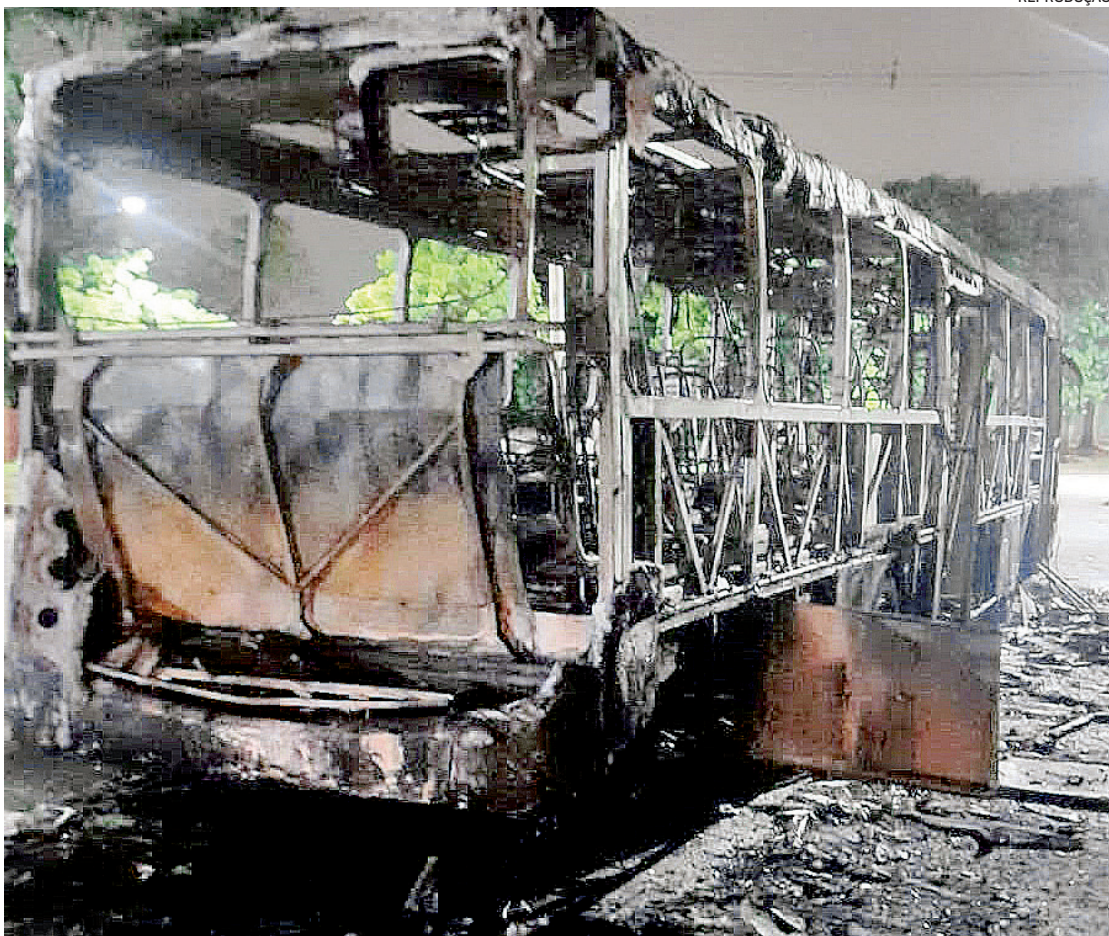
Ônibus da linha Campo Grande x Coelho Neto foi incendiado após anúncio de assalto na noite de quinta-feira

Na quarta, um ônibus da linha 898 (Campo Grande x Sepetiba) foi incendiado durante um protesto de mora-