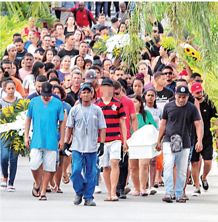
Polícia Civil acredita que o menor entrou no carro e não conseguiu sair

A avó materna teria sido indagada por dois parentes antes de começarem a procurar pelo menino. “A avó não percebe, acreditando que o menor estivesse na casa de outro parente, que todos moram próximos. Quando outro familiar pergunta pela criança que começam a procurar”, explicou Edézio.