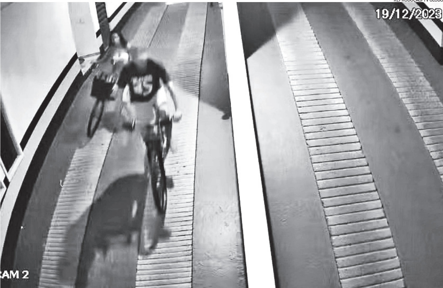
Imagens de câmeras de segurança dos locais onde houve os assaltos flagraram toda a ação e foram usadas pela Polícia Civil