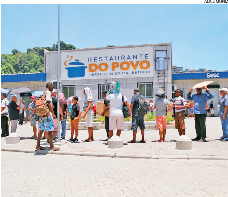
Pessoas sofrem com forte calor à espera de comida.

Sensibilizada com sofrimento das pessoas que ficam debaixo do sol esperando ser atendidas no restaurante popular da Central do Brasil, deputada Marina do MST criou abaixo-assinado para responsáveis colocarem toldo, assento e água potável na porta do bandeirão. “Já tivemos tragédia no Engenho no show da Taylor Swift. Vamos esperar ter outra na Central?”, disse, lembrando que são cada vez comuns ocorrências de insolação devido ao calor.