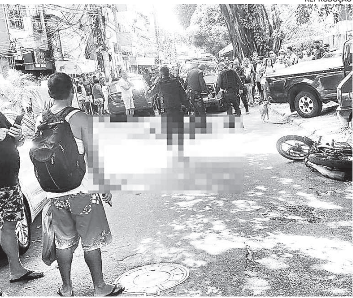
Dois homens morreram e outro ficou ferido em crime no Terreirão

Na ocasião, policiais militares do 31º BPM (Recreio dos Bandeirantes) foram acionados para verificar tiros em uma rua da comunidade. Chegando ao local, os policiais localizaram os dois mortos e o ferido. Uma pistola foi encontrada no local. O caso está sendo investigado pela Delegacia de Homicídios da Capital (DHC).