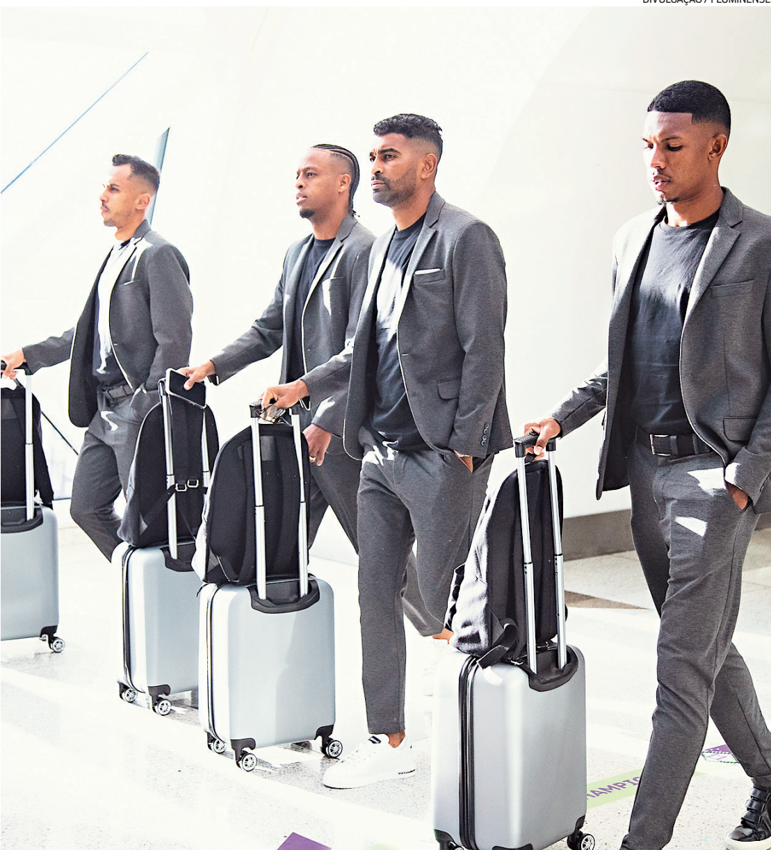
Cena do embarque do time tricolor para o Mundial, em 12 de dezembro: ontem foi dia de voltar para casa

Mundial, o Tricolor ganhou R$ 20 milhões de premiação. O Flu, que venceu o Al Ahly na semifinal, também recebeu um montante pela participação geral no torneio.