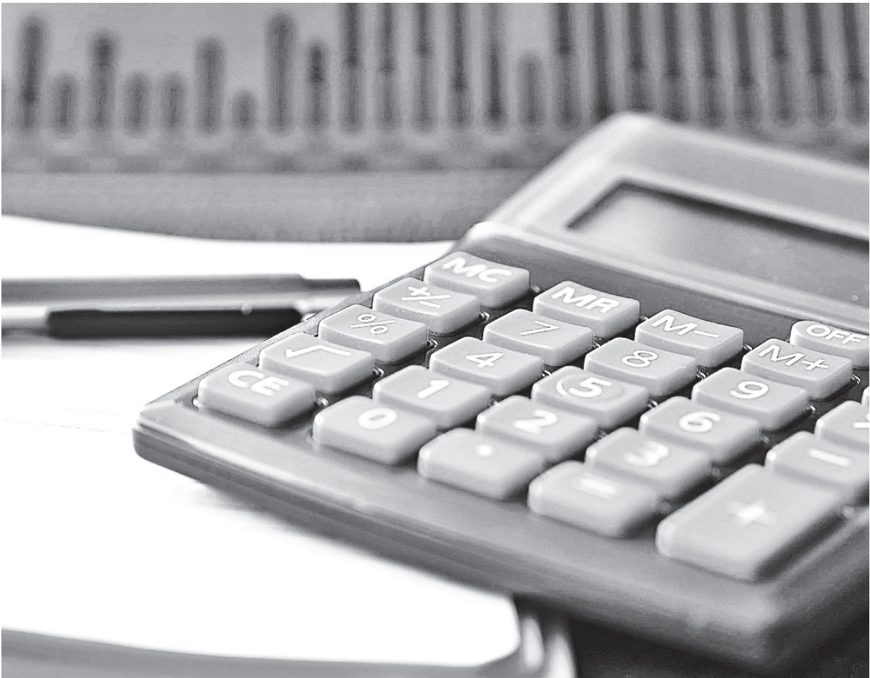
Segundo educadora financeira, o ideal é que a pessoa comece a se programar no início de 2024 já pensando em 2025

Com o extrato do período, fica mais fácil ponderar uma média dos gastos mensais com as contas e saber o valor que é preciso economizar. Conforme Sgarbi, a missão ficará um tanto mais fácil estipulando pequenas metas, como, por exemplo, diminuir em 10% a conta de luz. Aqui, ressalta a educadora financeira, dois pontos são essenciais: definir um objetivo a ser alcançado com a redução e celebrar as conquistas. “Se a pessoa não tiver muito claro o motivo de suas ações, ela desistirá mais rápido, porque é muito difícil viver na escassez. O mesmo acontece com a celebração. A