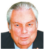
Aristóteles Drummond Jornalista

Setores mais isentos da sociedade brasileira, os 30% não envolvidos na radicalização e divisão ideológica que o país vive, começam a concluir que efetivamente a eleição presidencial teria de qualquer maneira um resultado negativo para o país.