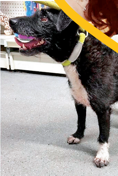
REPRODUÇÃO DAS REDES SOCIAIS