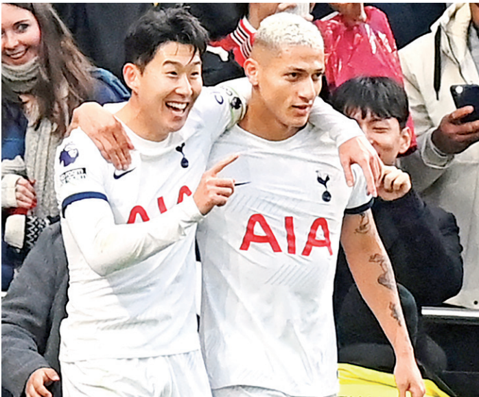
Heung-min Son marcou um gol e deu uma assistência para Richarlison

Richarlison espera recuperar o bom futebol também na seleção brasileira para voltar a ser titular com a camisa da Amarelinha.