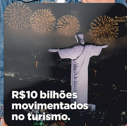
R$10 bilhões movimentados no turismo.