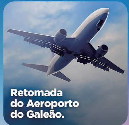
Retomada do Aeroporto do Galeão.