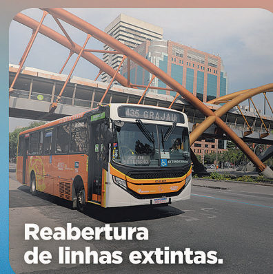
Reabertura de linhas extintas.