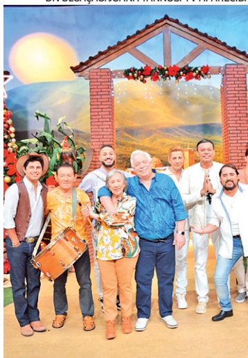
Especial Terra da Padroeira

Além das tradicionais celebrações religiosas, transmitidas diretamente do Santuário Nacional de Aparecida e do Vaticano com o Papa , a TV Aparecida preparou filmes, shows especiais e programas com temática de Natal e de Ano Novo. Destaque da grade festiva da TV Aparecida é o Terra da Padroeira - Especial de Natal , que será exibido no domingo (24), às 9h.