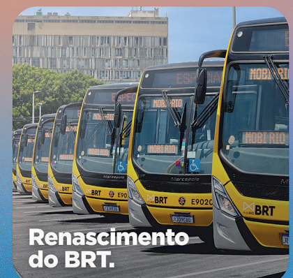
Renascimento do BRT.