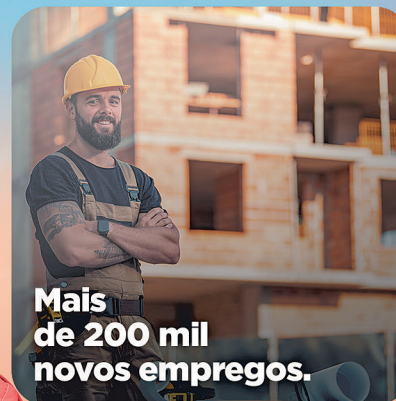
Mais de 200 mil novos empregos.