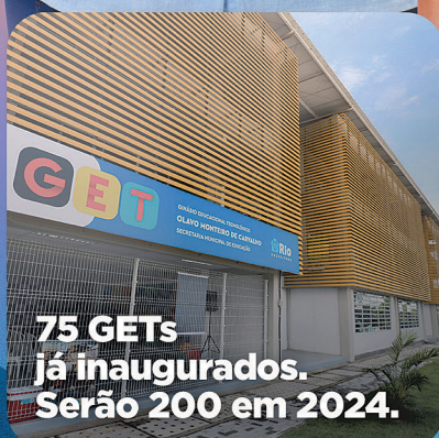
75 GETs já inaugurados. Serão 200 em 2024.