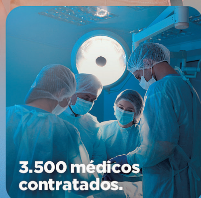
3.500 médicos contratados.