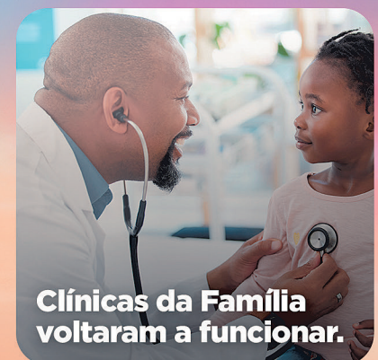
Clínicas da Família voltaram a funcionar.