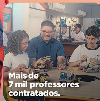
Mais de 7 mil professores contratados.