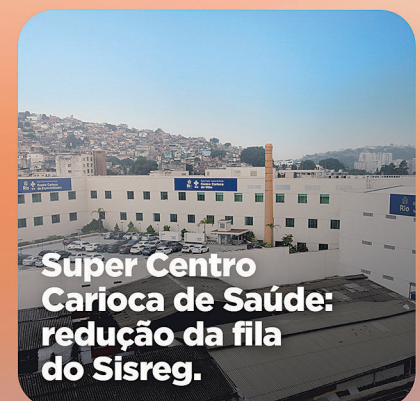
Super Centro Carioca de Saúde: redução da fila do Sisreg.