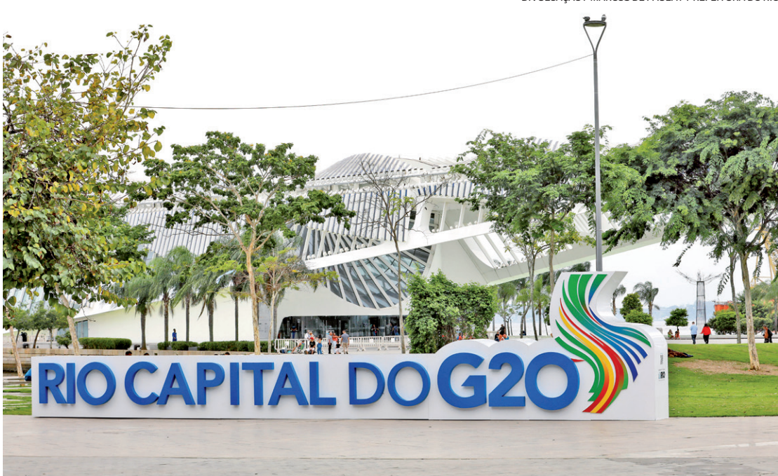
Brasil assumiu ontem a presidência do G20 e a cidade do Rio passou a ser considerada a capital do mundo

“O G20 coloca o Rio, mais uma vez, no centro do mun-do. Como cidade global, as-sumimos não só o papel de anfitriões, mas também de liderança em defesa de um papel mais expressivo das cidades nas decisões e nos acordos globais. O G20 é nos-sa Olimpíada do PIB. É uma oportunidade única para consolidarmos o Rio como potência do desenvolvimen-to sustentável, recapitali-