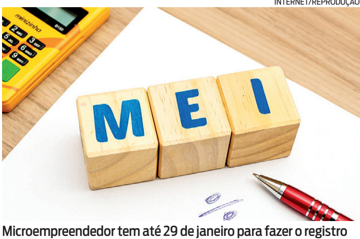
Microempreendedor tem até 29 de janeiro para fazer o registro