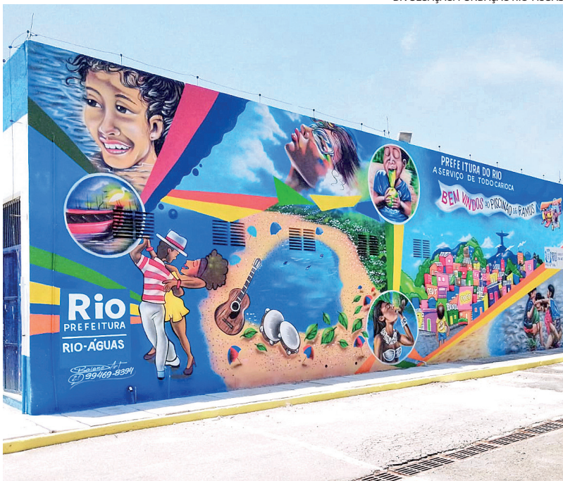
Mural no Piscinão de Ramos é do artista Leandro da Conceição.

O maior corredor de arte urbana da América Latina fica no Rio e tem deixado a Avenida Brasil mais colorida. O Piscinão de Ramos também entrou na rota das cores e, agora, a Estação de Tratamento de Água do local ganhou murais de grafite pintados pelo artista baiano Leandro da Conceição Santa- na, que é morador de Ramos e se inspirou no próprio Piscinão e na Baía de Guanabara para suas criações. A iniciativa é da Fundação Rio-Águas.