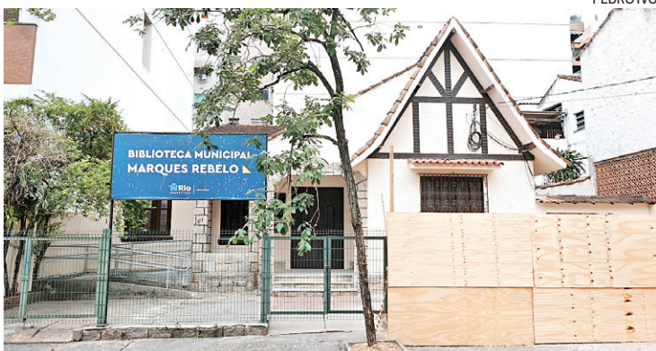
A Biblioteca Municipal Marques Rebelo na Tijuca, passa por obras

O valor foi utilizado para aquisição de acervo, inclusive acessível, novo mobi-