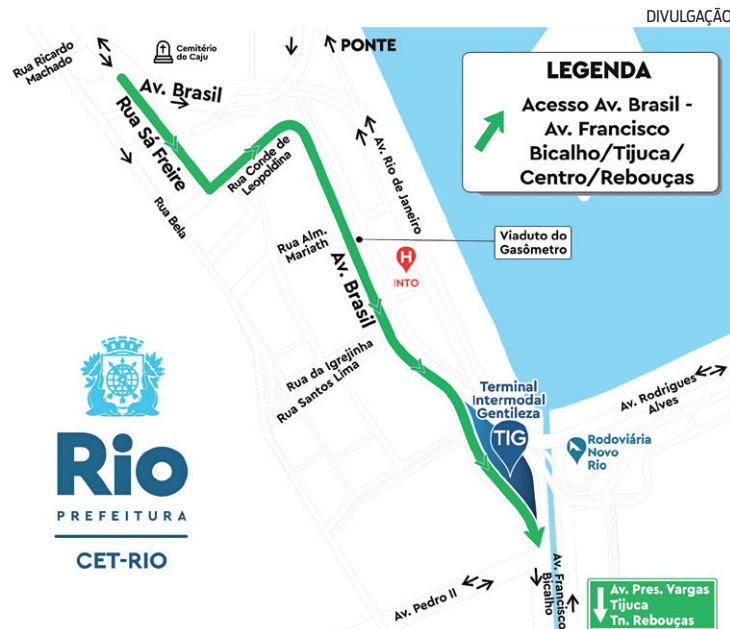
O trecho estava interditado para obras do Terminal Gentileza

reção ao Centro, Tijuca e ao Túnel Rebouças sem necessidade de transitar pelo Viaduto do Gasômetro. Com a reabertura, fica restabelecida a ligação direta, anteriormente existente, entre a Avenida Brasil e a Avenida Francisco Bicalho. A pista lateral da Avenida Brasil, no sentido Centro, via por onde circulavam cerca de 13 mil veículos por dia antes das obras, se constituirá em uma alternativa viária, aliviando o Gasômetro, que se apresenta saturado, recebendo um volume médio de 7.200 veículos por hora, superando os 115 mil por dia por sentido. Com a transferência parcial do fluxo veicular do Gasômetro para a pista lateral da Avenida Brasil é esperada melhora na fluidez e, consequentemente, redução dos tempos de viagem no acesso ao Centro e Zonas Norte e Sul. É, portanto, uma entrega importante para o sistema viário da cidade. O percurso liberado, em continuidade da pista lateral da Avenida Brasil a partir do Caju, se utilizará das ruas Sá Freire, Conde de Leopoldina e Avenida Brasil até a chegada na Avenida Francisco Bicalho e terá capacidade para comportar 3.000 veículos