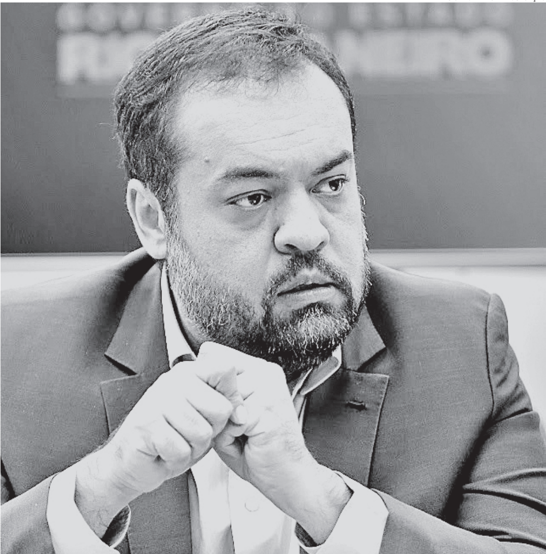
Castro diz que trabalho integrado com o Ministério da Justiça vai reforçar resultados investigativos da Civil

bra de sigilo fiscal e bancário. Além de duas delegacias: uma de Combate a Corrupção, focada em desvio de dinheiro público, e outra de combate às Organizações Criminosas, que trata da lavagem de dinheiro do tráfico, milícia e grupos criminosos. O quinto órgão é o Gabinete de Recuperação de Ativos, que visa recuperar esse patrimônio para que o Estado