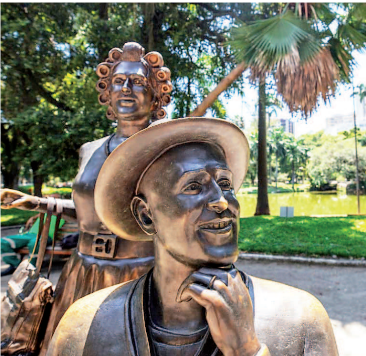
Homenagem ao ator Paulo Gustavo no Campo São Bento