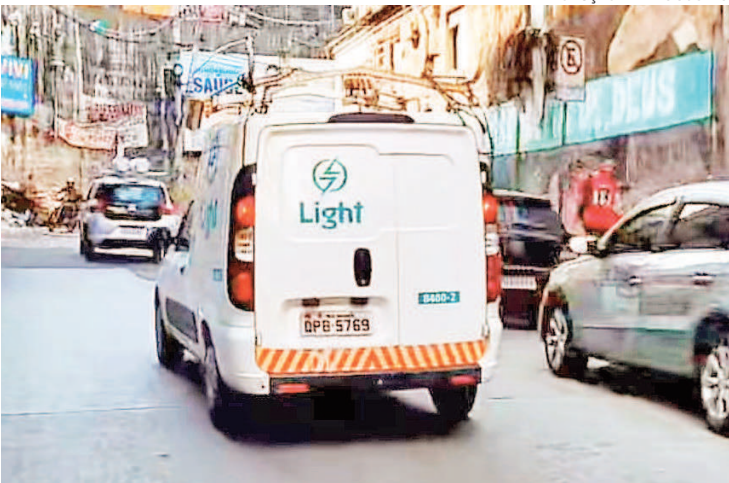
Áreas mais afetadas são Chachopa, Vila Verde e Portão Vermelho

O prazo determinado pela Justiça para a empresa realizar os reparos e restabelecer a energia terminou na segunda-feira, sob risco de multa diária de R$ 50 mil. Na tarde de segunda-feira, moradores fecharam a Autoestrada Lagoa-Barra no-