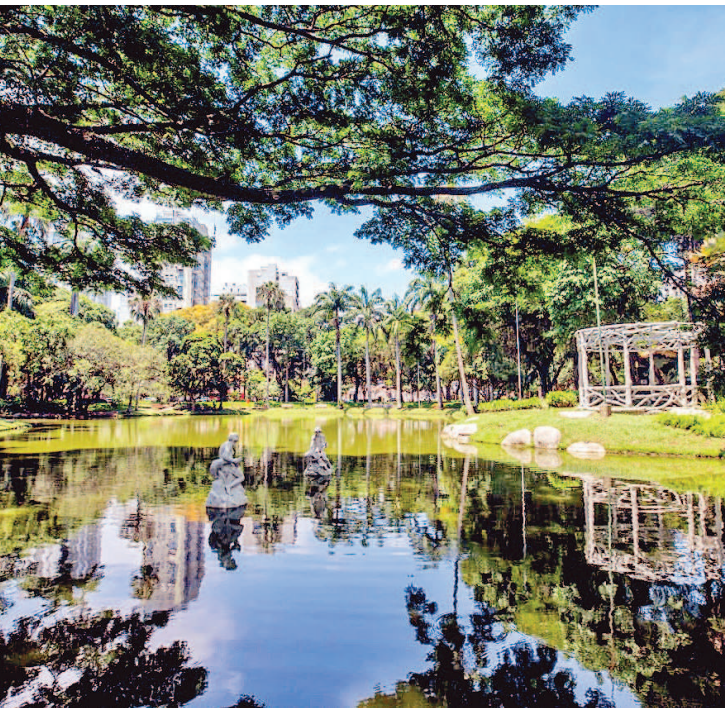
Campo São Bento é um dos lugares mais visitados em Niterói