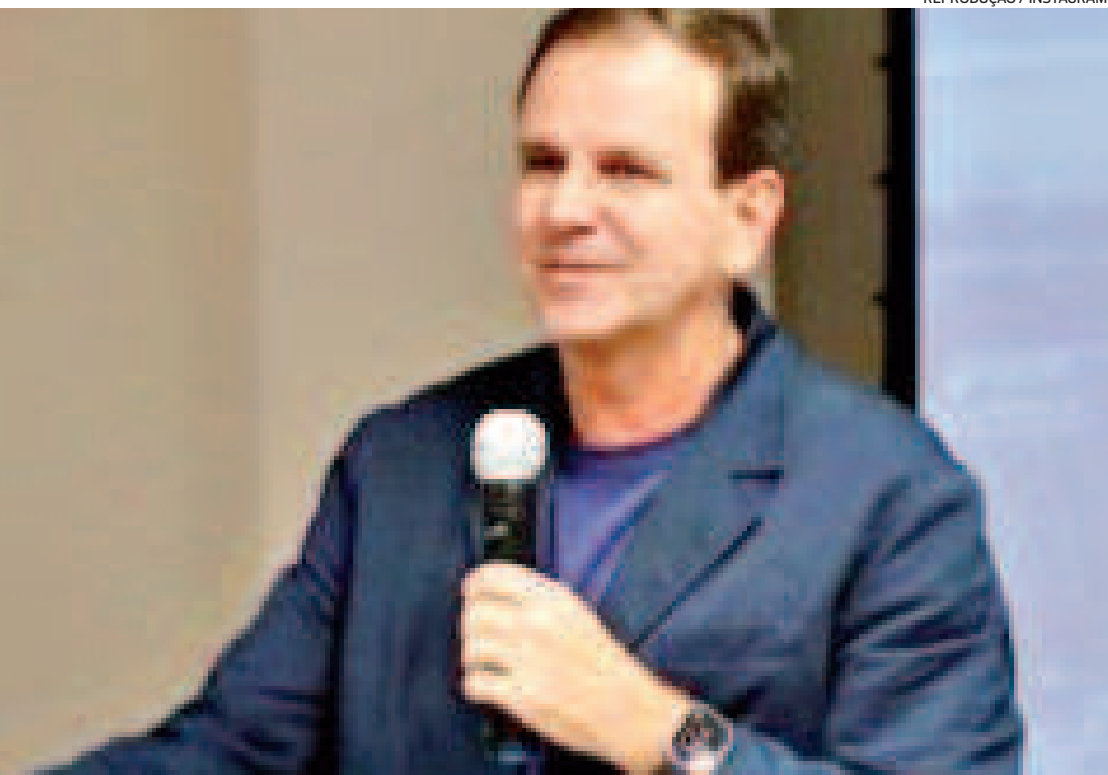
Paes pediu, de acordo com Soranz, a elaboração de um plano para casos onde há indicações médicas