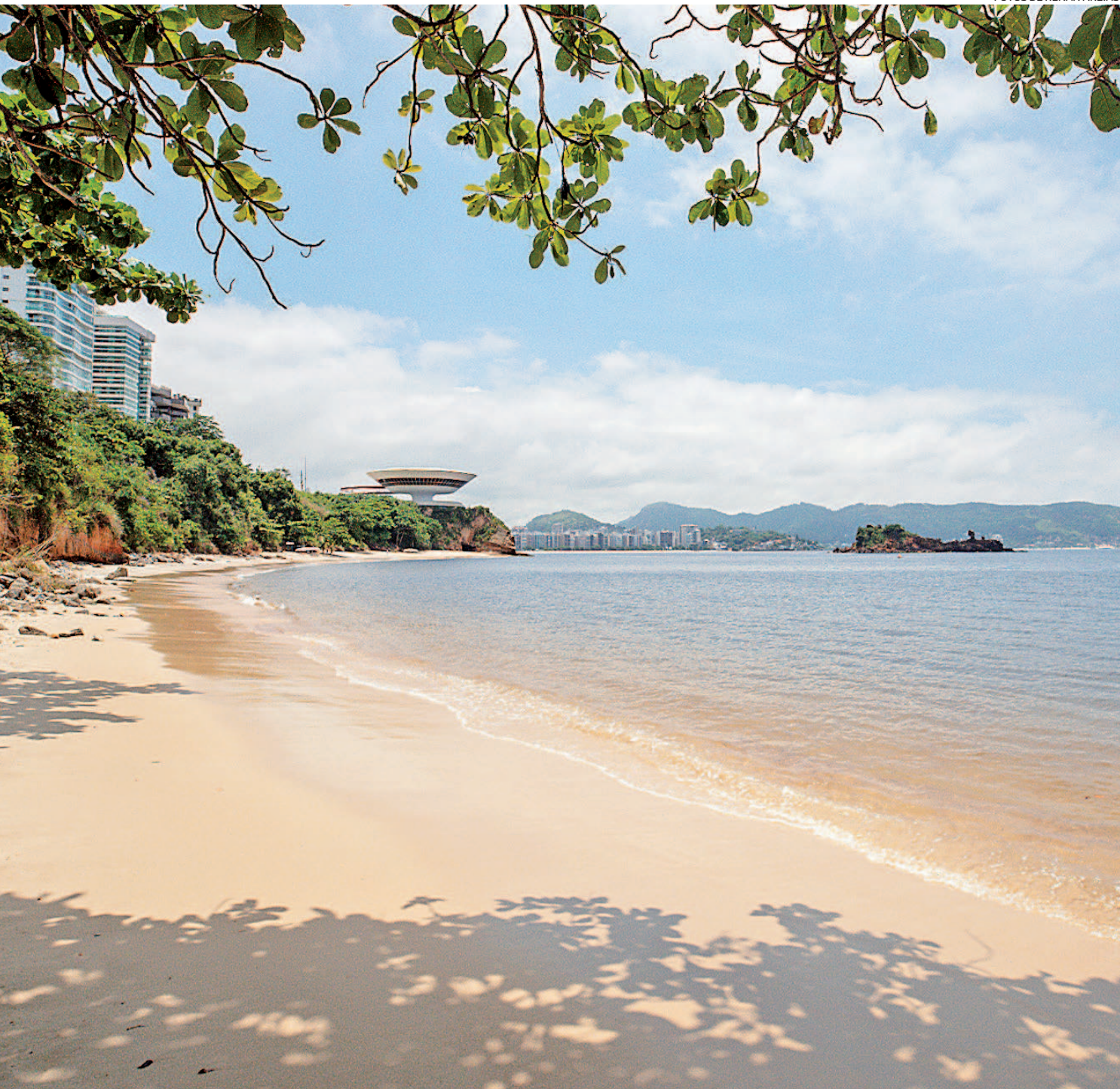
Um dos cartões-postais de Niterói: ao fundo, o Museu de Arte Contemporânea (MAC), projetado pelo arquiteto Oscar Niemeyer

Nos 450 anos de Niterói, festejados hoje, moradores definem o município como sinônimo de lar e de qualidade de vida