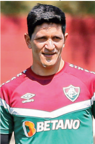
Cano não joga desde a final