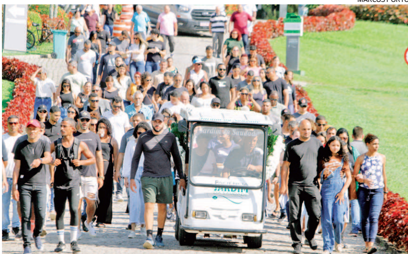
Enterro do corpo do guia de turismo aconteceu no Cemitério Jardim da Saudade