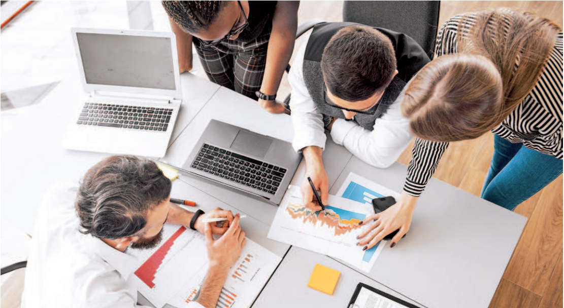
As vagas de empregos e estágios abrangem candidatos sem experiência comprovada e também para PCDs

CIEE O Centro de Integração Empresa-Escola (Ciee) oferta 1.155 oportunidades de estágio, sendo que 671 para Ensino Superior. Os interessados devem acessar o site: www.ciee.org.br .