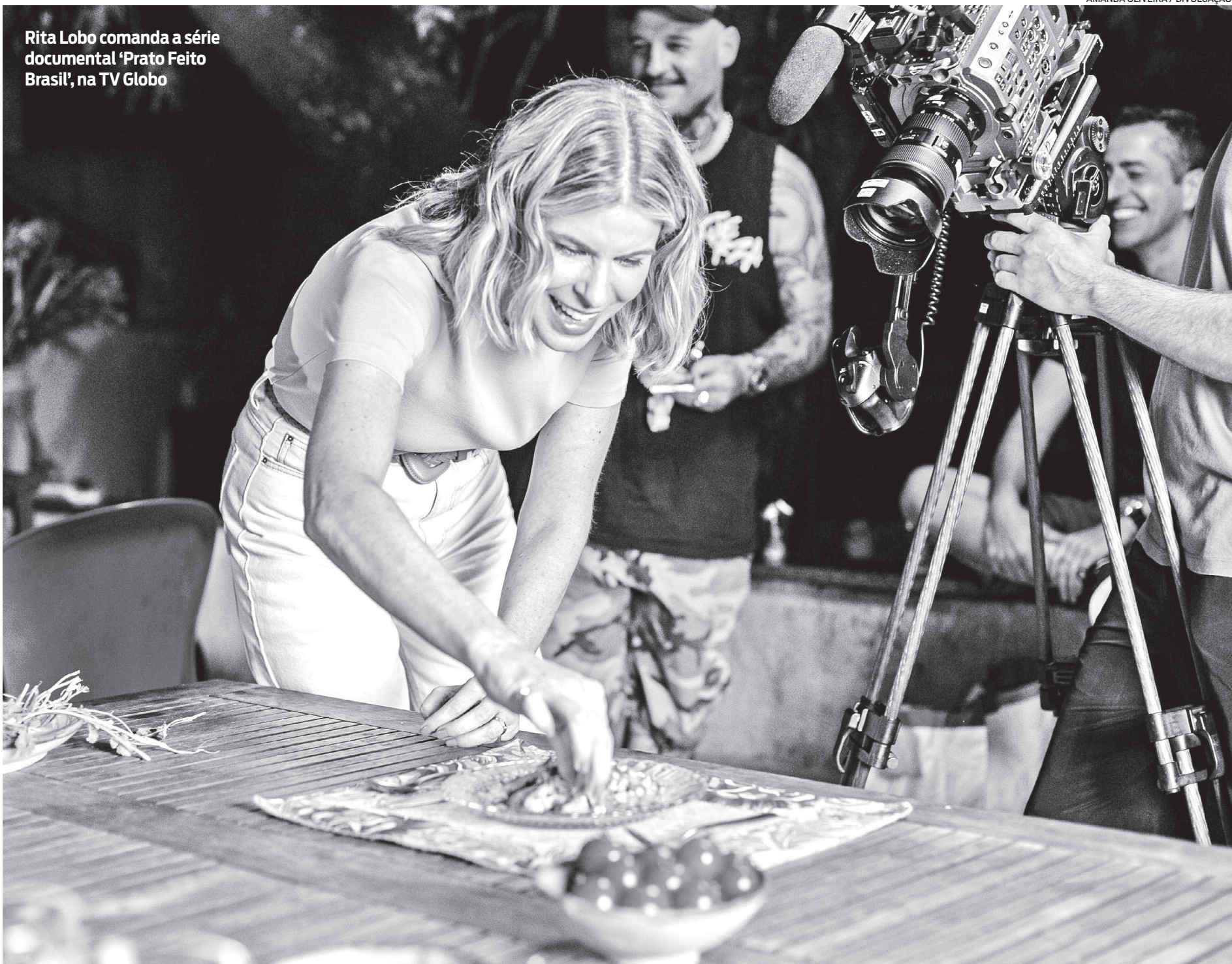
Rita Lobo comanda a série documental 'Prato Feito Brasil', na TV Globo