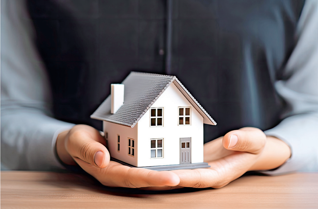
As dificuldades maiores são na Zona Sul do Rio, onde ficam os bairros que são destinos turísticos