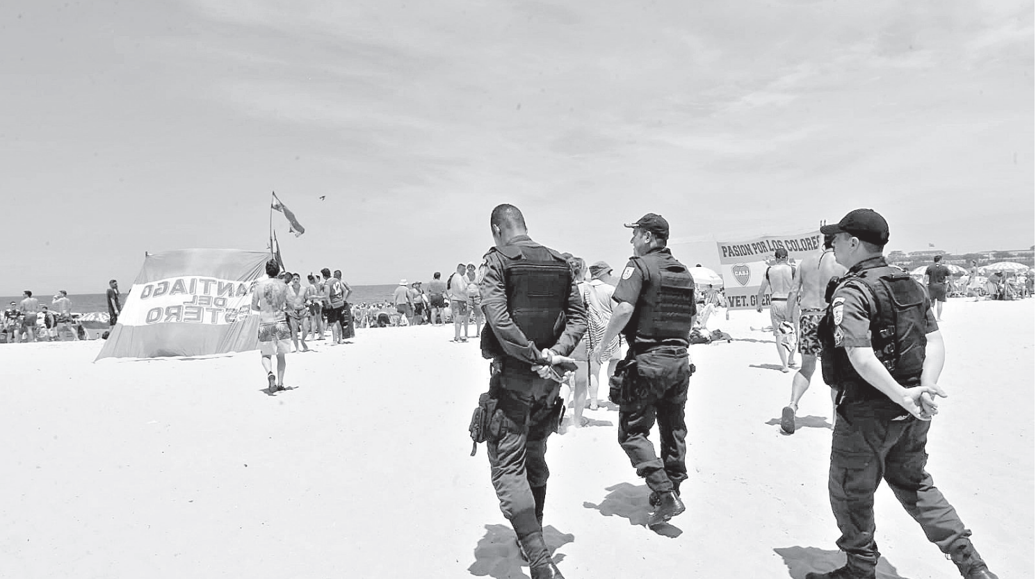
Polícia Militar reforçou o policiamento pelas regiões de Copacabana, na Zona Sul, para coibir brigas e ações de cambistas com ingressos falsos

que foram adquiridos com cambistas. “A gente tem um ingresso falso, essa que é a verdade. A gente é argentino, mas mora em Arraial do Cabo. A gente está vendo o que fazer aqui fora. A gente está com um QR code que não é válido”, disse um dos torcedores ao site ‘GE’.