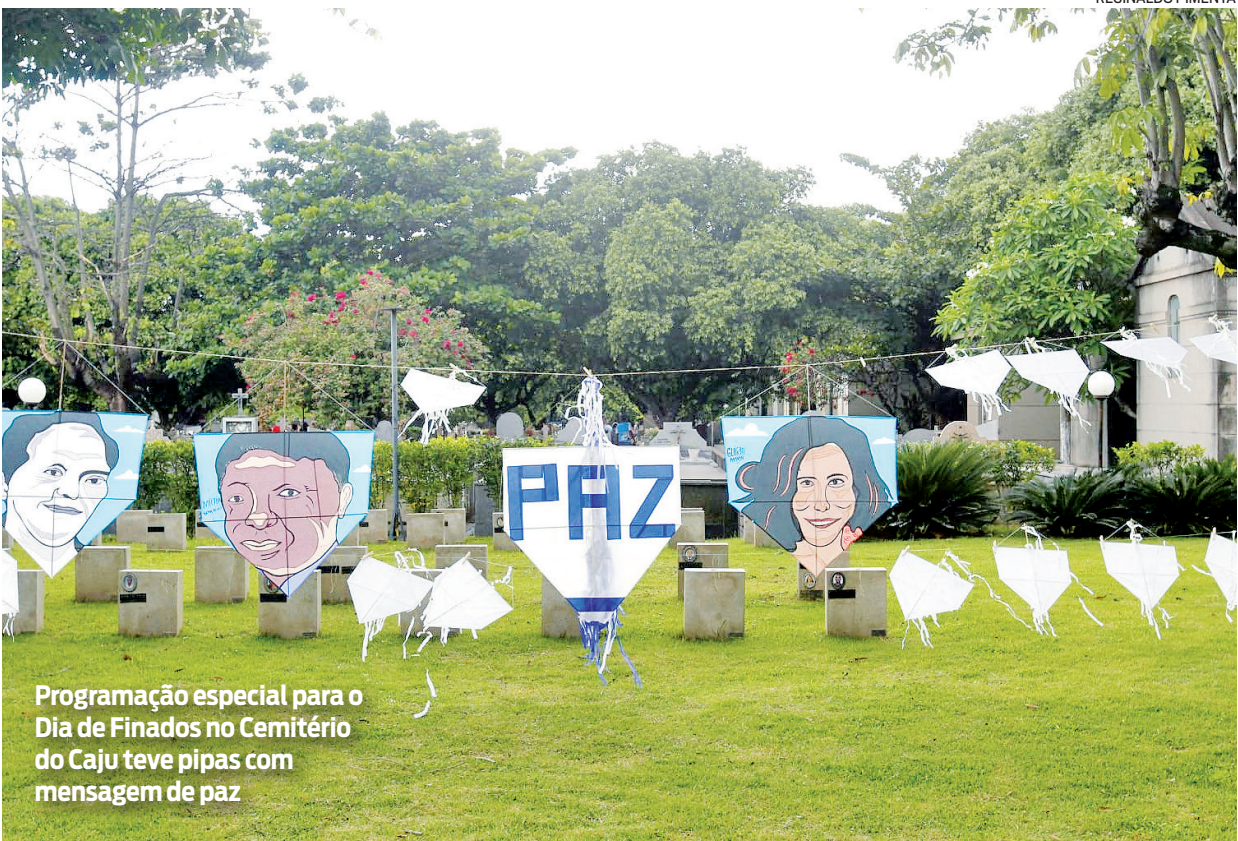
Programação especial para o Dia de Finados no Cemitério do Caju teve pipas com mensagem de paz