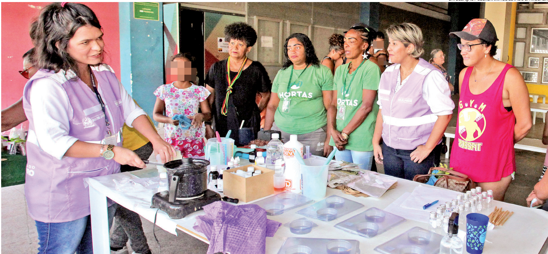
Estudo realizado pelo Sebrae aponta que o Rio é o estado com maior proporção de empreendedoras. São 38% dos empreendimentos liderados por mulheres

W orkshops, palestras e rodadas de negócios serão algumas das atividades que celebrarão o Mês da Mulher Empreendedora. Foi sancionada uma lei pelo governo do Rio que estabelece que a data será comemorada, anualmente, no mês de novembro. A abertura das homenagens será na segunda-feira, às 13h, com um seminário no plenário da Assembleia Legislativa do Rio de Janeiro (Alerj). A Secretaria de Estado da Mulher promoverá, em pelo menos oito municípios, eventos sobre empreendedorismo comandados por figuras femininas. Segundo estudo realizado pelo Sebrae, com base na Pesquisa Nacional por Amostra de Domicílios Contínua (PNADC), do IBGE, no terceiro trimestre de 2022, o Rio é o estado com maior proporção de empreendedoras. São 38% dos empreendimentos liderados por mulheres. O governador Cláudio Castro enfatizou a importância da decisão para o público feminino. “As mulheres merecem respeito e homenagens o ano inteiro. Mas, em novembro,