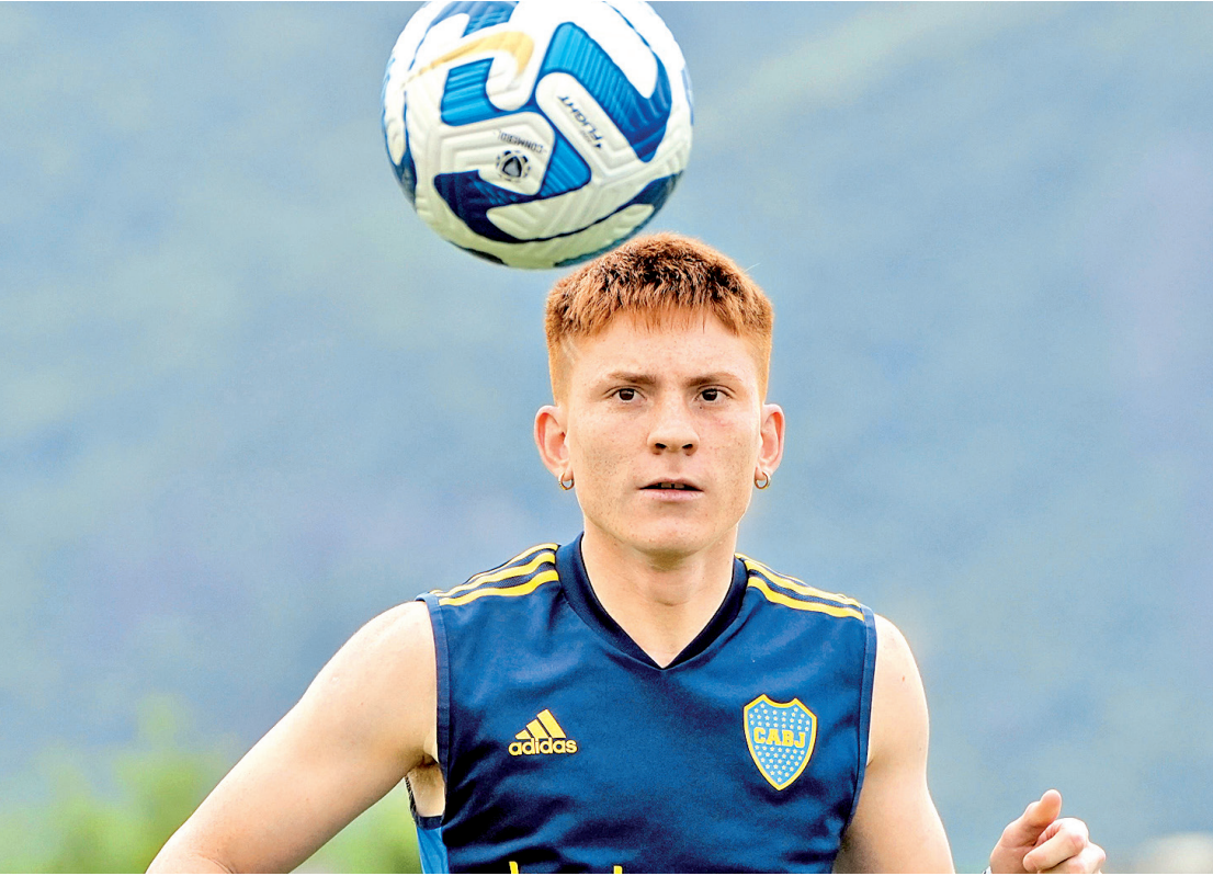
PRINCIPAL JOGADOR DE LINHA DO BOCA, VALENTÍN BARCO ESTÁ RECUPERADO DE DORES MUSCULARES E SERÁ TITULAR

Apesar disso, pelo que se viu nos treinos dos últimos dias, a única mudança em relação ao time que bateu o Palmeiras na semifinal é a entrada de Nicolás Valentini, recuperado de uma pancada, na vaga do zagueiro Marcos Rojo, que está suspenso após ter sido expulso no Allianz Parque. Dessa forma, o provável Boca Juniors para a decisão tem: Sergio Romero, Advíncula, Nicolás Figal, Nicolás Valentini e Frank Fabra; Cristian Medina, Ezequiel Fernández, Pol Fernández e Valentín Barco; Miguel Merentiel e Edinson Cavani.