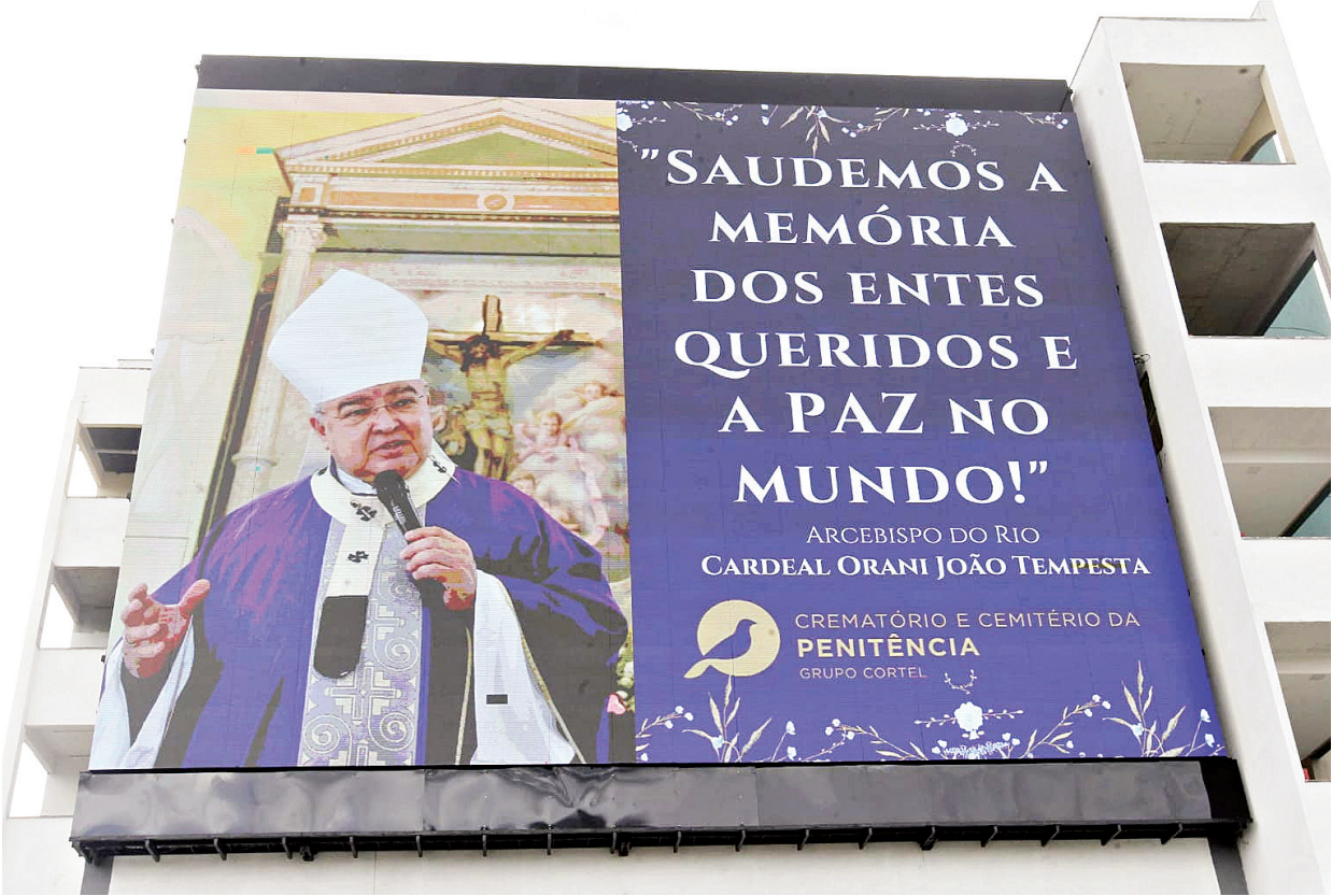
Pedido de paz ao mundo, feito pelo Cardeal Orani Tempesta, registrado no LED gigante no cemitério vertical do Caju