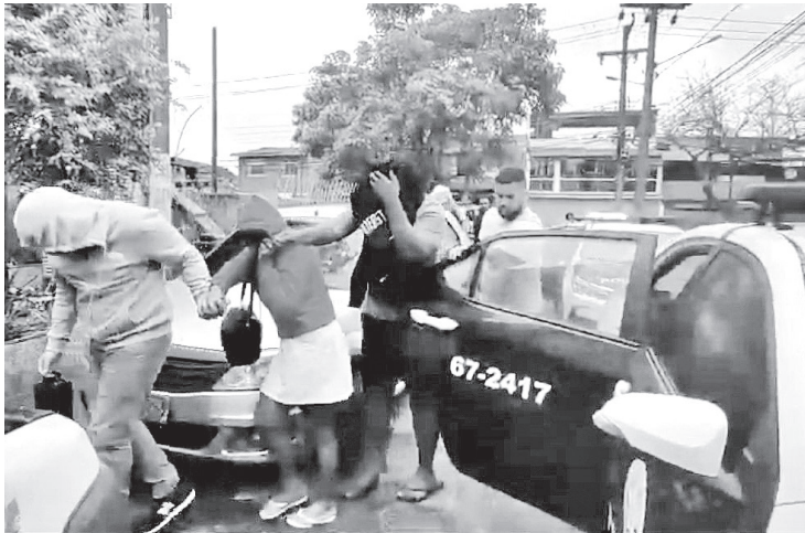
Integrantes de quadrilha são presos em flagrante por estelionato