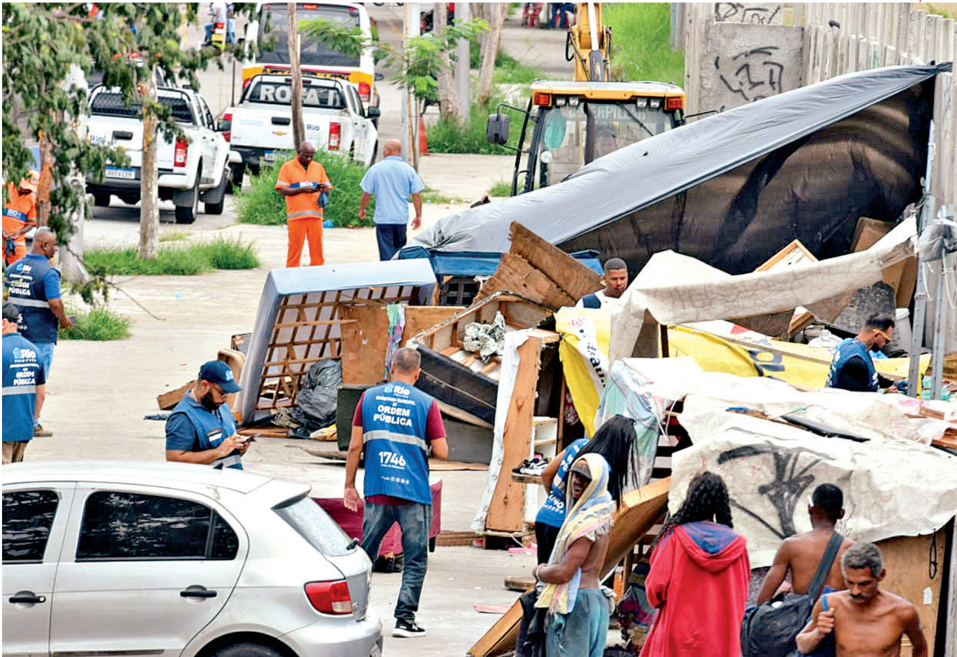
No entorno do estádio do Maracanã, as equipes encontraram 14 estruturas precárias que serviam de moradia. Operação faz parte da preparação para final da Libertadores

Os tricolores com entradas para os portões C e D (setores