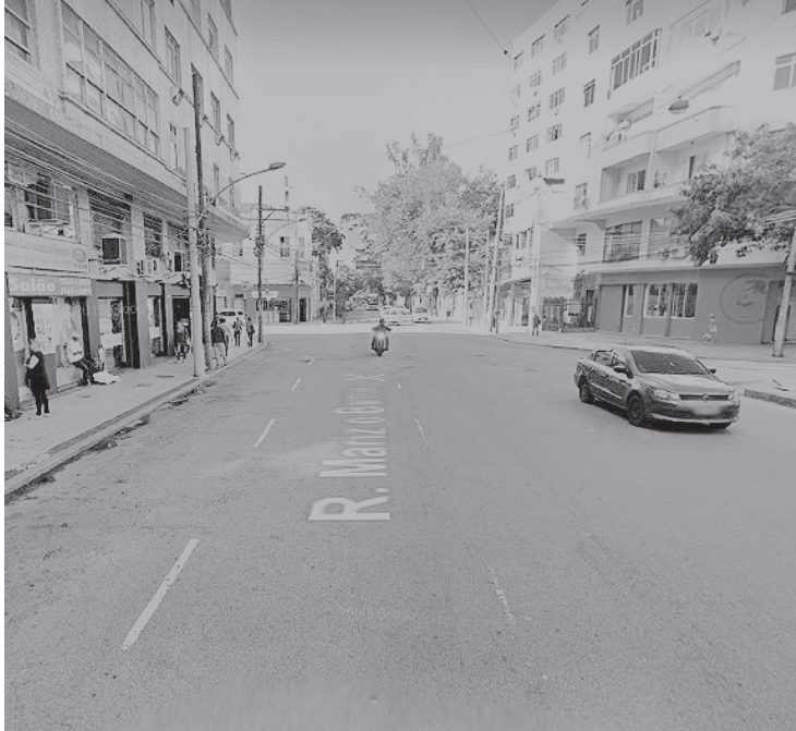
Empresário foi sequestrado na Rua Mariz e Barros, na Tijuca

Após ser solto em Olaria, o homem contou que conseguiu pedir ajuda a populares e contatar sua família. Em seguida, ele seguiu para a 18ª DP (Praça da Bandeira) e foi enca-