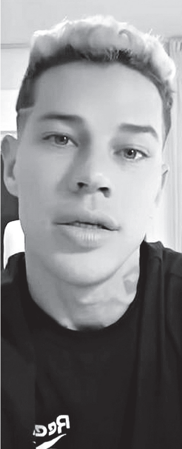
O ator José Loreto: ‘Estou ótimo’