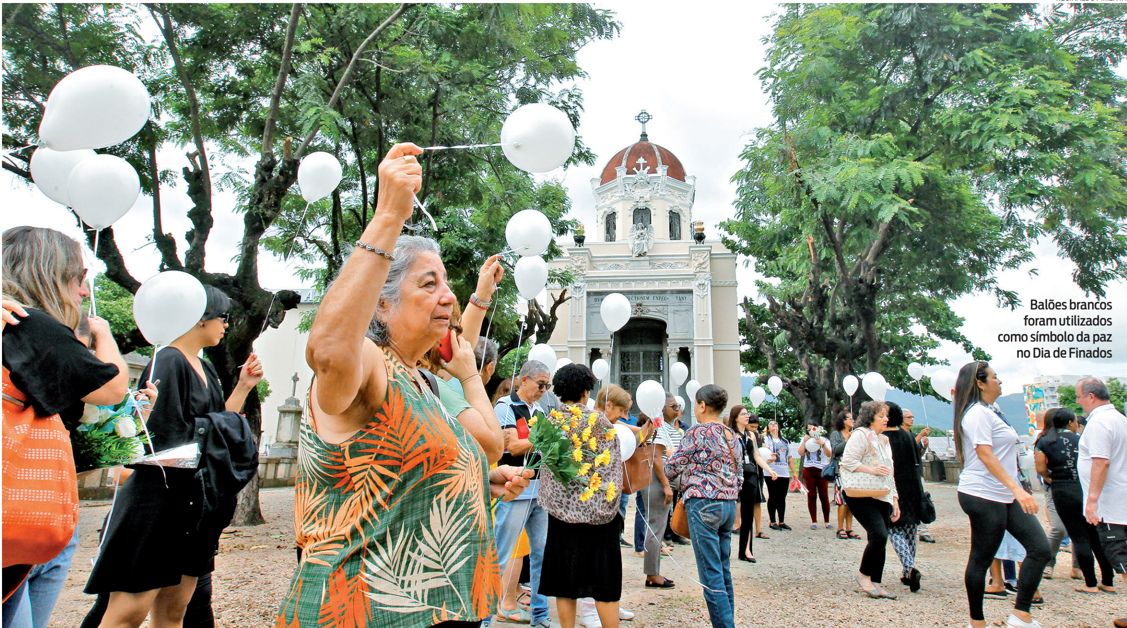
Balões brancos foram utilizados como símbolo da paz no Dia de Finados