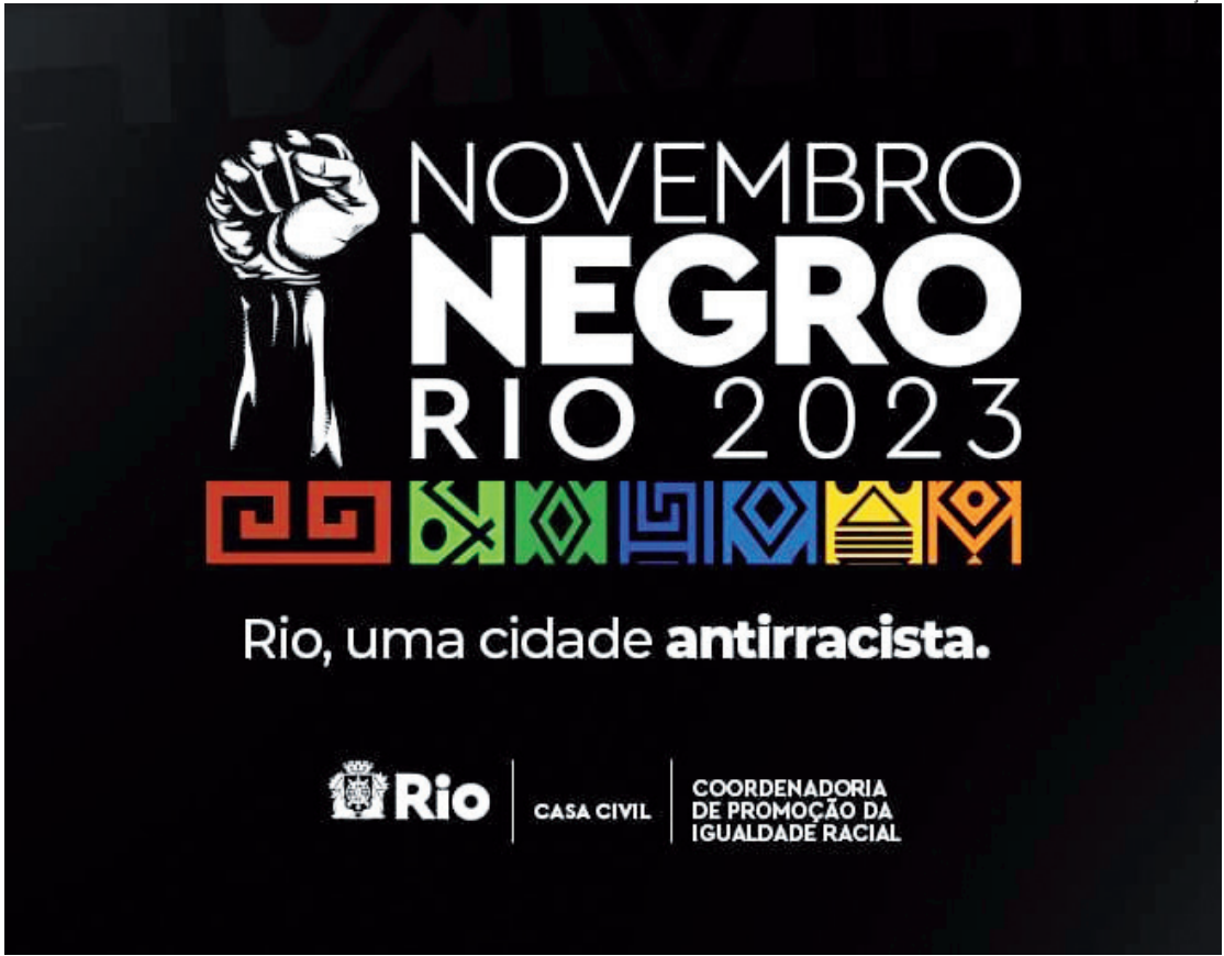
Ações estão sendo organizadas pela Coordenadoria de Promoção da Igualdade Racial (CPIR)