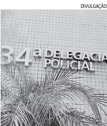
Caso foi registrado na 34ª DP

Quatro pessoas ficaram feridas após um ataque a tiros, ontem, na Praça do Dragão, na comunidade do Sapo, em Senador Camará, Zona Oeste do Rio. De acordo com a Polícia Militar, agentes do 14º BPM (Bangu) foram acionados por populares após o registro de tiros no local. Na praça, os policiais encontraram quatro homens feridos. Eles foram socorridos e encaminhados até a Unidade de Pronto Atendimento (UPA) de Pedra Branca. Até o momento, não há informações sobre a identificação e estado de saúde