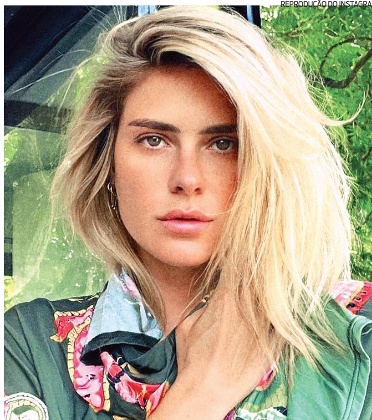
Carolina Dieckmann usa o super blond nos fios: o mais pedido nos salões

O super blond, eleito por Carolina Dieckmann, é o mais pedido dos salões. “É o loiro da raiz às pontas e pode ser usado por todas as mulheres”, afirma a cabeleireira, que faz