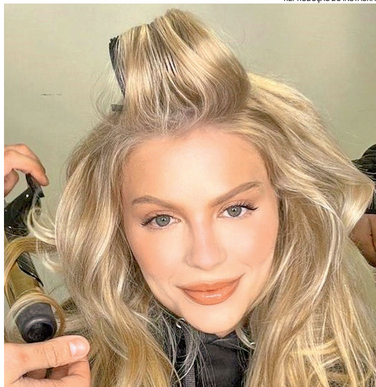
Luísa Sonza adotou o platinado de baixa manutenção no cabelo

Conheça as tonalidades que vão ser tendência na primavera até o verão e estão fazendo a cabeça de famosas como Luísa Sonza, Fernanda Rodrigues e Carolina Dieckmann