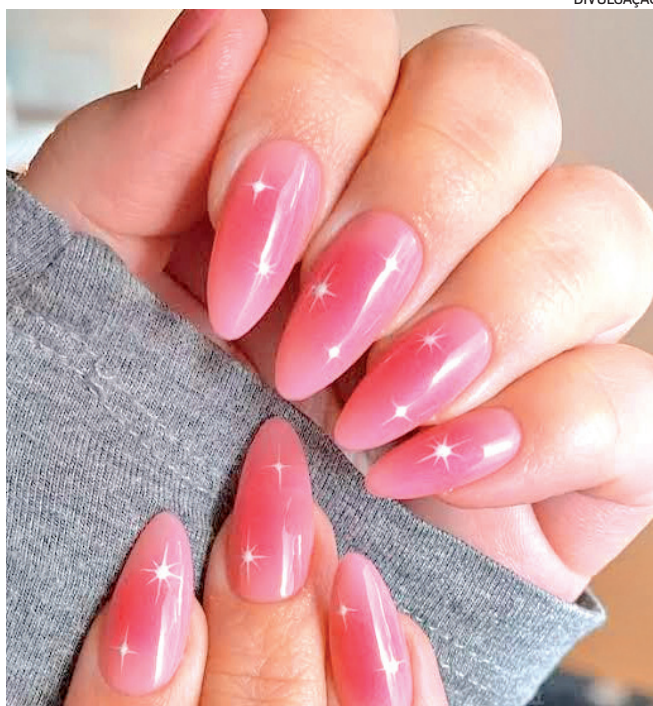
Minimalistas aos extravagantes, estilos para todos os gostos

Texturas em destaque: A complexidade das tendências de nail art ganha destaque com o estilo texturizado. Agora, suas unhas podem ter a aparência do