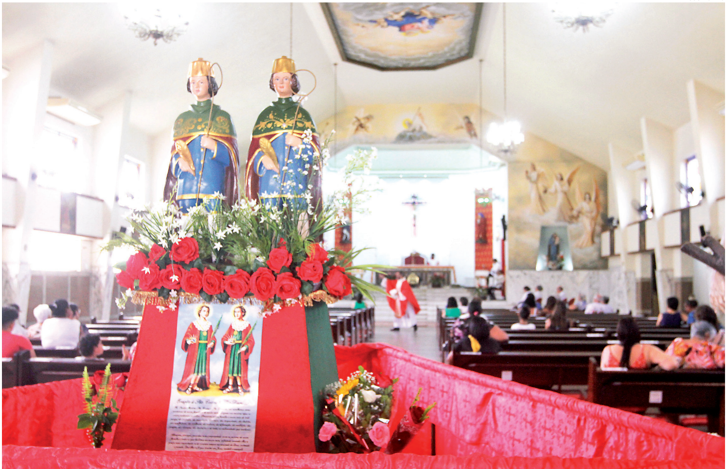
Paróquia de São Cosme e Damião, localizada no bairro do Andaraí, costuma receber muitos fiéis na semana de homenagem aos santos