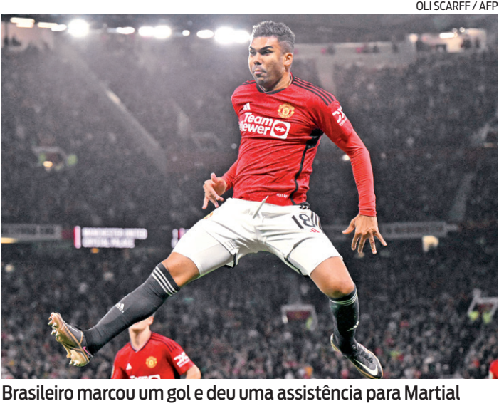
Brasileiro marcou um gol e deu uma assistência para Martial