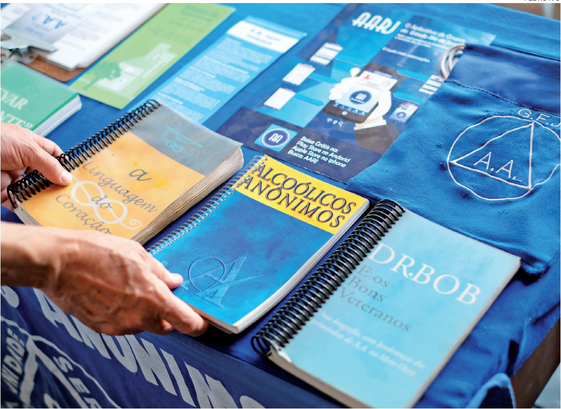
A literatura de Alcoólicos Anônimos é uma das maneiras de propagação da mensagem fora dos grupos

O Comitê Trabalhando com os Outros (CTO) de AA promove ações para organizar, estruturar, padronizar, facilitar e executar a divulgação da mensagem fora dos grupos