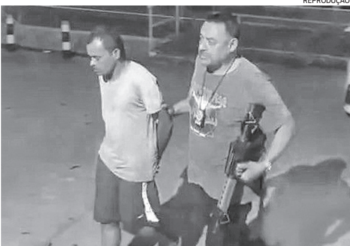
Davidson foi preso, ontem, em Vargem Grande, na Zona Oeste

líbrio emocional do acusado. “Fator que pode contribuir para que as testemunhas se sintam constrangidas para prestar depoimento sabendo que o autor de um crime de tamanha gravidade estará solto no mesmo ambiente. Ressalte-se que a principal testemunha dos fatos é outra filha do custodiado e conta com apenas 13 anos de idade, devendo-se destacar que a menor relata o temor que sente do pai, justamente pelo comportamento descompensado”, escreveu a juíza na decisão.