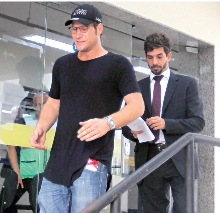
Diego Alemão foi preso ontem portando uma arma ilegalmente

ser internado espontaneamente em clínica de reabilitação. Pedimos a compreensão de todos pelo fatídico ocorrido. Diego, infelizmente, vem sofrendo de um mal que tem acometido muitas pessoas atualmente. Há alguns meses tem enfrentado profunda depressão e uso de substâncias químicas. Em breve teremos novamente o Diego Alemão que os brasileiros já conheceram, saudável, alegre e querido por muitos”, disse a postagem. Alemão foi preso na madrugada de ontem no Leblon, Zona Sul do Rio, portando uma arma ilegalmente. Segundo a Polícia Militar, equipes do 23º BPM (Leblon) foram acionadas para chegar