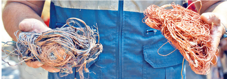
Cerca de 20 quilos de cobre foram apreendidos em ferro-velho ilegal

“Ressalto que o furto de fio de cobre passa por esses tipos de estabelecimentos e prejudica demais a rotina da população. Não vamos permitir esse tipo de irregularidade na cidade”, enfatizou o secretário de Ordem Pública