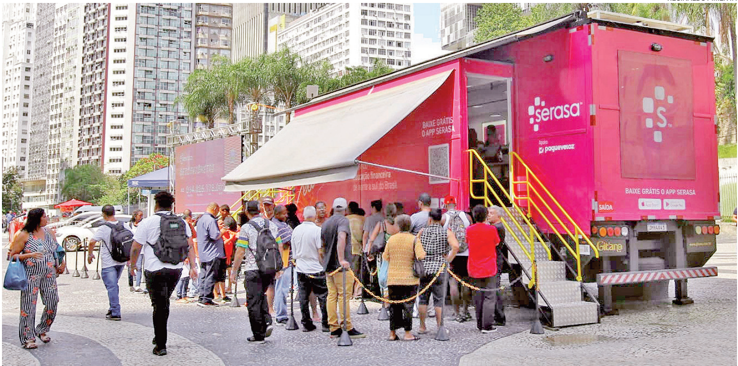
Horário de atendimento durante a semana vai das 9h às 18h. No sábado, o caminhão estará aberto até as 13h no Largo da Carioca