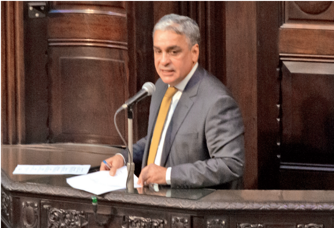
Secretário André Ceciliano é porta-voz da Caravana Federativa

O secretário Especial de Assuntos Federativos do Ministério das Relações Institucionais, André Ceciliano, que antes ocupava a presidência da Assembleia Legislativa do Rio, será o porta-voz de uma notícia que vai mexer com estados e municípios. E agradar em cheio as prefeituras do Estado do Rio. A Caravana Federativa, que desembarca por aqui no espaço Expor Mag, no Centro do Rio, entre amanhã e sexta, será o palco do anúncio de que o Rio de Janeiro também será beneficiado por recursos do PAC Seleção, recebendo parte de um gigante montante de R$ 136 bilhões para Saúde, Educação, Cultura e Esporte. O evento, com a presença de Ceciliano, terá à disposição atendimento às administrações municipais e vai ampliar serviços da União nos Estados.