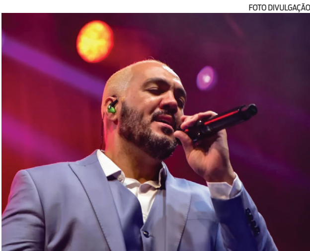
Bar do Belo foi lançado no início deste ano