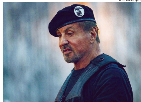
Sylvester Stallone estrela Os Mercenários 4