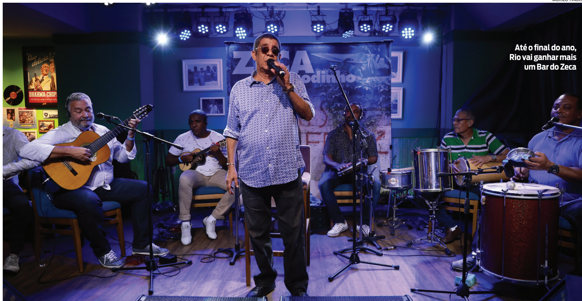
Até o final do ano, Rio vai ganhar mais um Bar do Zeca