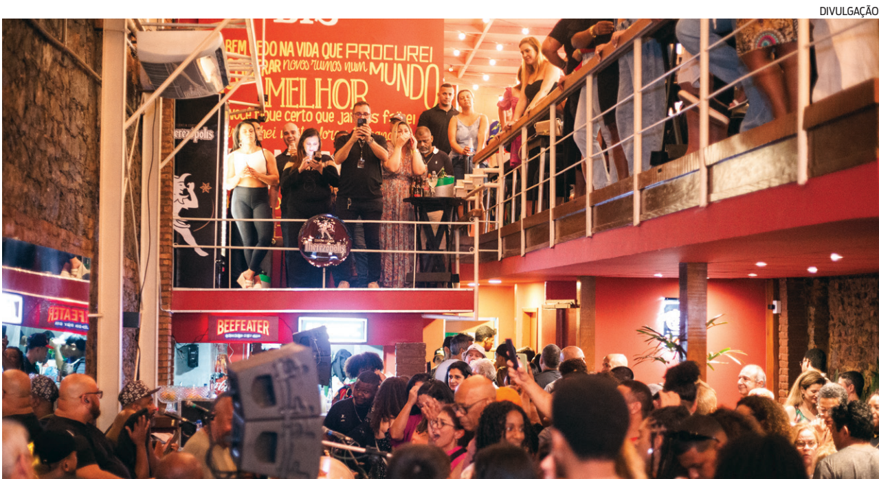
Boteco Fundo de Quintal é a mais recente novidade