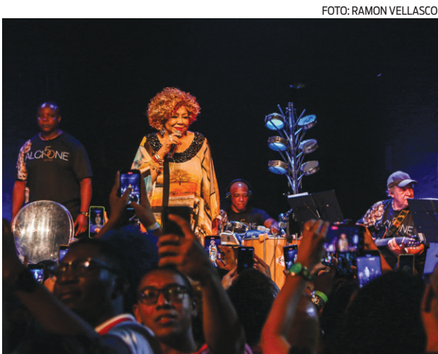
Bar da Alcione foi inaugurado em 2020