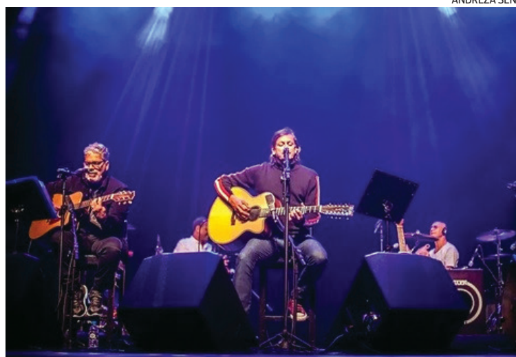
Quarteto de Minas Gerais sobe ao palco sexta, sábado e domingo

Há mais de 40 anos em atividade, o grupo festeja a carreira com o show “14 Bis