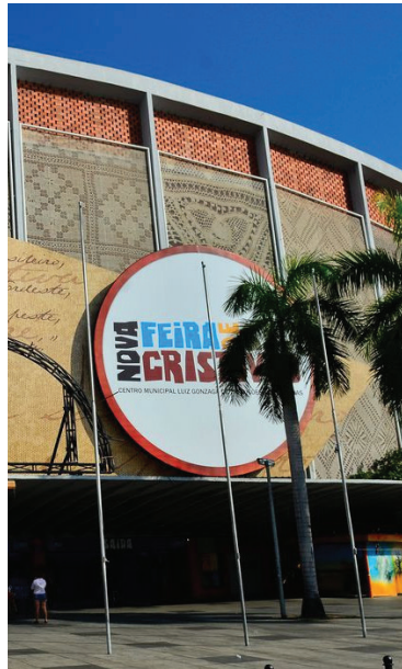
Centro Municipal Luiz Gonzaga de Tradições Nordestinas

Completando 78 anos em setembro, a Feira de São Cristóvão vai apresentar o esquete musical “Pau de Arara Carioca”, que narra a história dos seus fundadores. Em parceria com o Sesc RJ, o espetáculo será apresentado sexta-feira (8) e sábado (9), às 21h, e domingo (10), às 13h, no palco da Praça Catolé do Rocha.