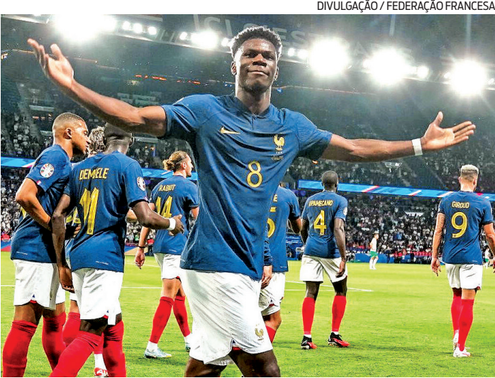
Tchouaméni, do Real Madrid, foi quem abriu o placar em Paris