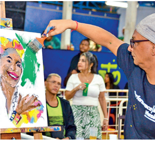
Parceria campeã levou um pintor para quadra