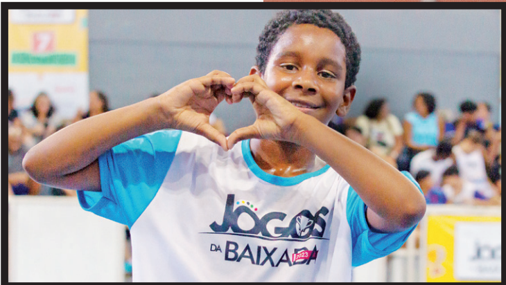
Até dia 24, 14 municípios disputarão o pódio em diversas modalidades

Neste sábado e domingo, o Sesc Nova Iguaçu recebe mais uma etapa dos XXIV Jogos da Baixada 2023, uma realização do jornal O DIA, apresentação do Sesc RJ e apoio da Refit e da Cedae, envolvendo 14 prefeituras da região: basquete masculino no sábado e o futsal masculino no domingo. Ambos sub-14. No sábado, Japeri encara Mesquita logo na primeira rodada; na segunda vem Nilópolis x Queimados; Belford Roxo x Nova Iguaçu e Caxias x São João de Meriti. No futsal de domingo, o jogo de abertura é São João de Meriti x Queimados; depois Belford Roxo encara Nova Iguaçu; o terceiro dos jogos da primeira rodada é Mesquita x Nilópolis e depois vem Sero pédica x Paracambi. O quinto dos jogos é entre Itaguaí e Japeri e fechando a primeira rodada, temos Magé X Caxias. No último final de semana, quando abriram os jogos, Mesquita sediou o handebol feminino, que sagrou São João de Meriti como campeão; Nova Iguaçu foi vice e Paracambi, em terceiro, fechou o pódio. No atletismo feminino, o primeiro lugar ficou com Duque de Caxias (com 112 pontos); Belford Roxo veio em segundo, com a metade: 61; e o terceiro ficou com Nova Iguaçu, que somou 42 pontos. No masculino, São João de Meriti ficou levou ouro (69 pontos); no masculino, São João de Meriti foi campeão (com 69 pontos); Duque de Caxias veio em segundo,