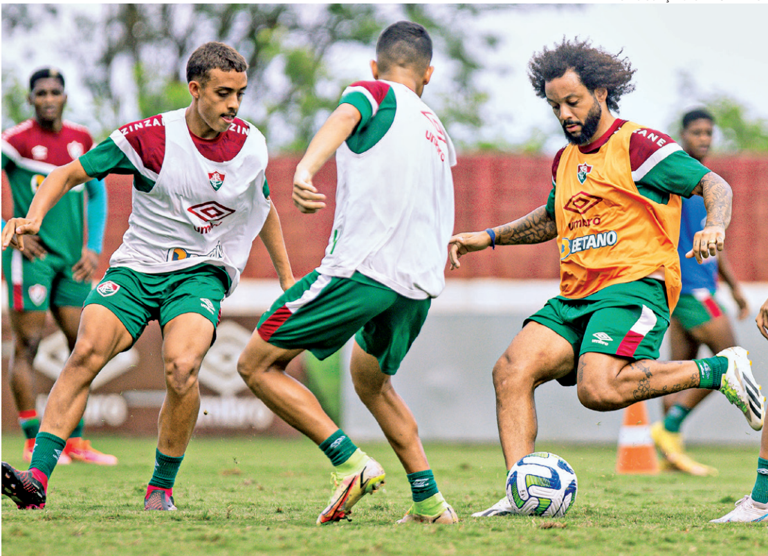
Lateral-esquerdo voltou a treinar com o elenco na atividade de ontem, sob comando do auxiliar Marcão

Em 17 temporadas na Europa, o camisa 12 foi um dos jogadores mais vitoriosos do continente