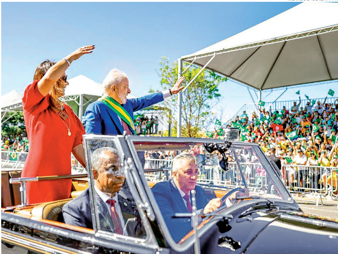
Na companhia da esposa, Lula acena para o público: cerca de 50 mil pessoas estiveram presentes