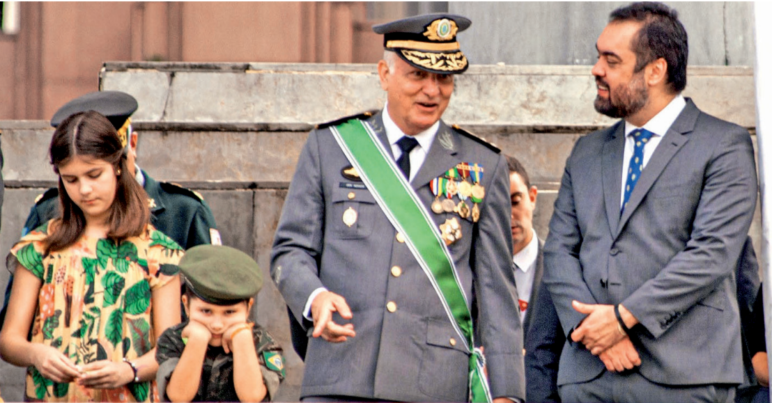
Governador do Rio, Cláudio Castro apresentou a banda do 1º Batalhão de Guardas do Exército