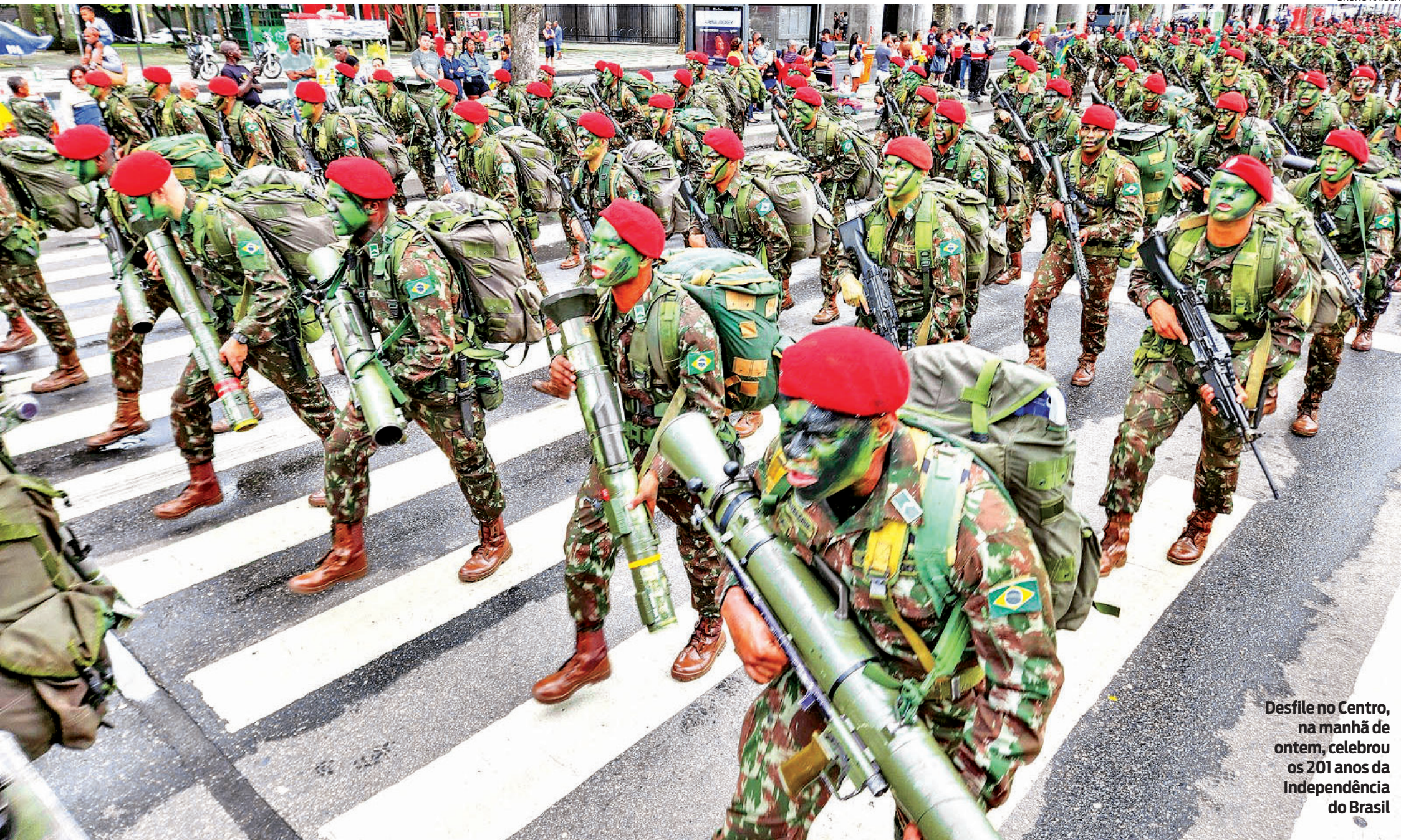
Desfile no Centro, na manhã de ontem, celebrou os 201 anos da Independência do Brasil