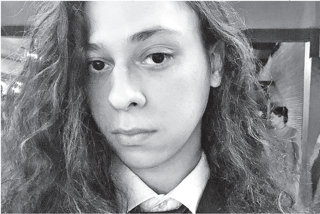
O ator Victor Meyniel foi agredido na portaria de um prédio em Copacabana, na Zona Sul, no sábado

TENTOU ENTRAR NO QUARTO Ainda segundo a amiga, o artista voltou a tentar entrar em seu quarto e, ao perceber que a porta estava trancada, passou a bater incessantemente. Ao abrir, Victor te-