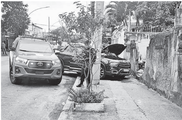
Crime teria relação com a disputa dos serviços de internet na região

Viaturas do 41º BPM (Irajá) estiveram no local e isolaram a área até a chegada de peritos da Delegacia de Homicídios da Capital. A especializada está responsável pela investigação e ainda não divulgou a identidade da vítima.