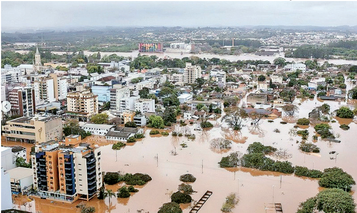
Chuvas alagaram cidades e causaram estragos em todo o estado