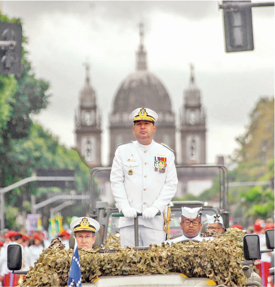
No local do desfile cívico-militar de 7 de setembro, foi possível ver famílias reunidas para celebração

Como foi a festa da Independência em Brasília. Pág. 9