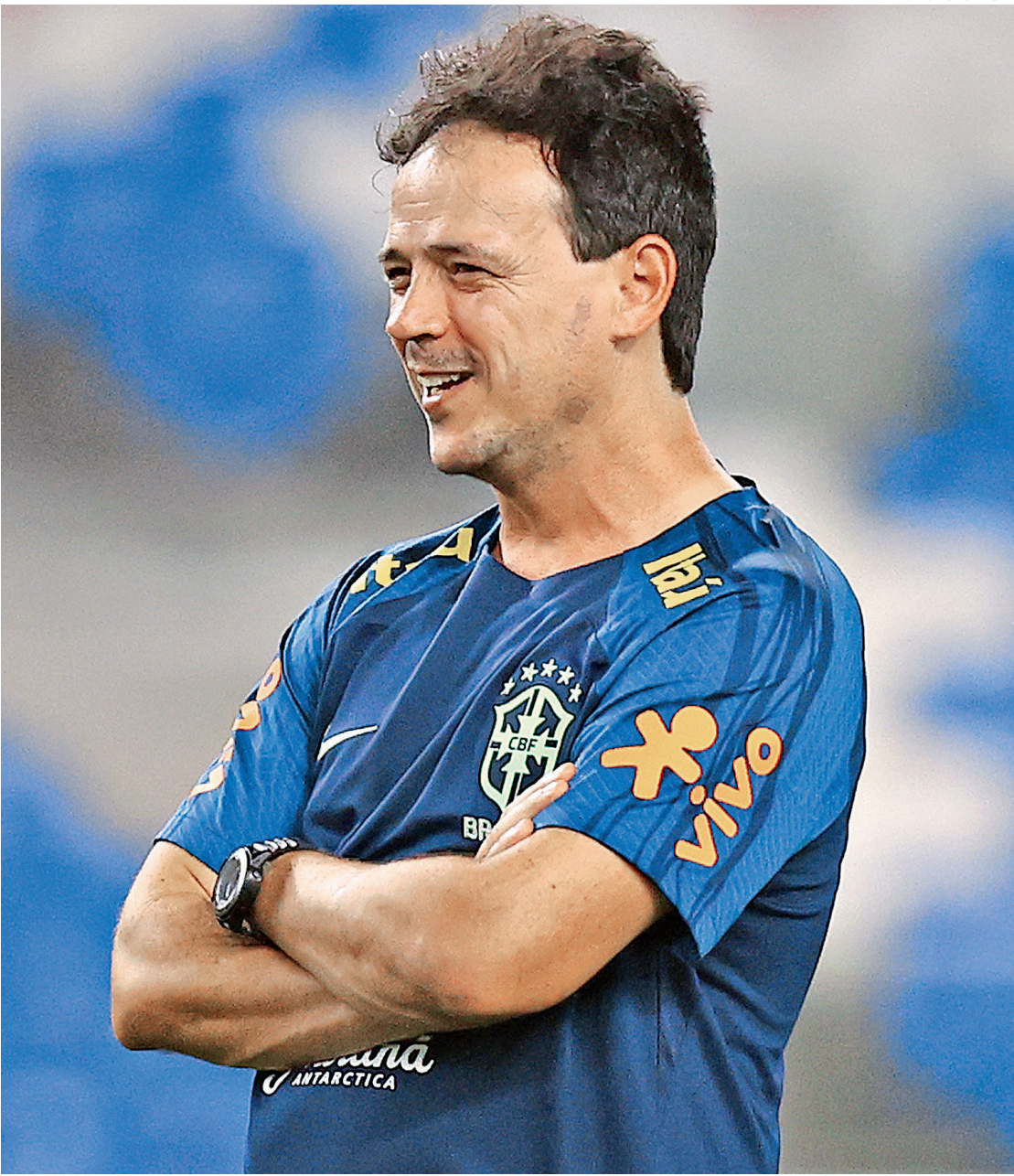
Treinador teve apenas três dias de atividades com o elenco para transmitir suas ideias aos jogadores