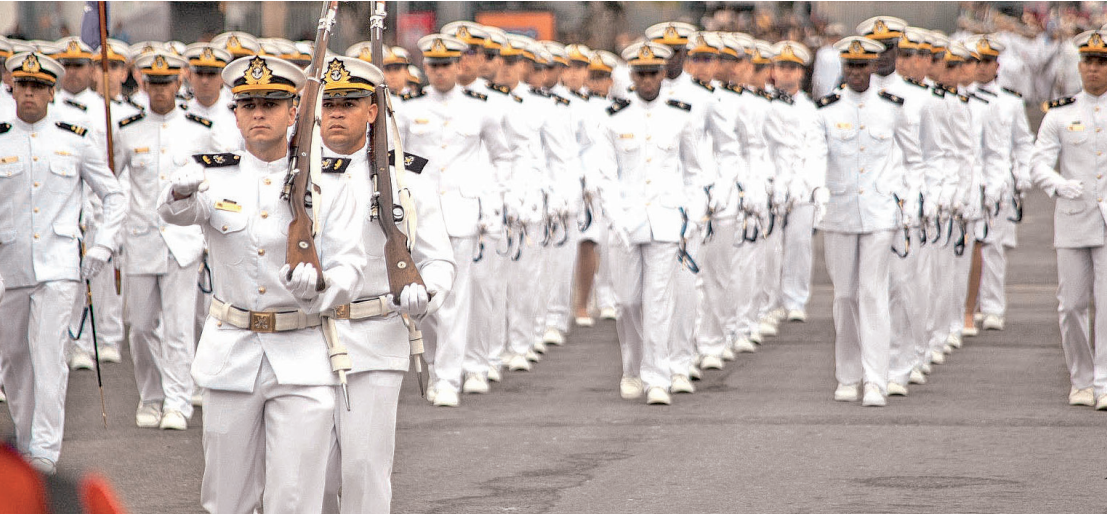
Após dois anos de celebração suspensa, desfile cívico-militar de 7 de setembro voltou ao Centro do Rio