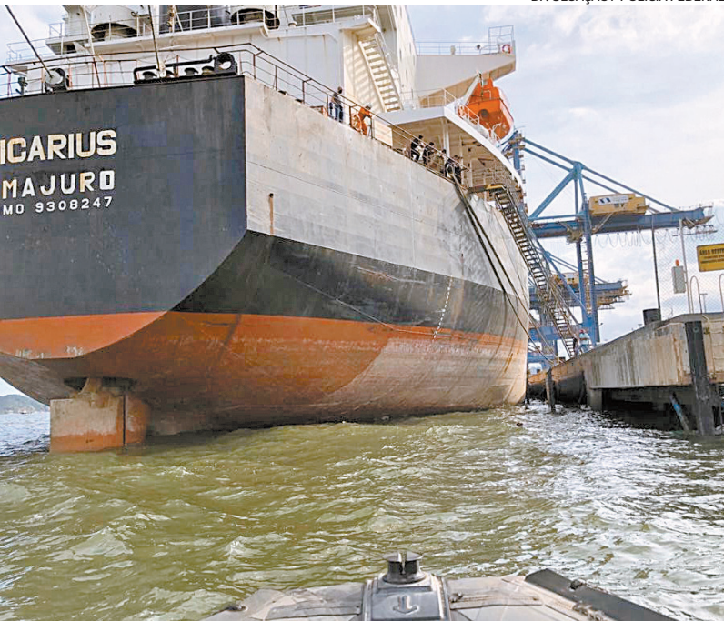
Operação da PF apreendeu cloridrato de cocaína que iria para a Europa