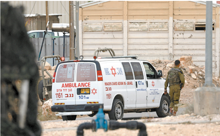
Ambulância é fotografada perto da base militar israelense

no primeiro ataque era uma mulher, identificada pelo exército como Lia Ben Nun, de 19 anos. A identidade do terceiro soldado morto não foi divulgada. As Forças Armadas israelenses anunciaram uma investigação “com plena colaboração” do exército egípcio. Um porta-voz militar indicou que o exército israelense está apurando o caso. Com AFP