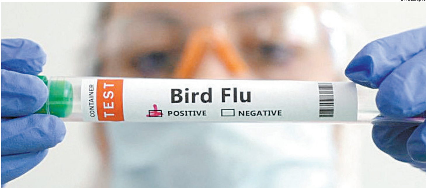
As infecções humanas pelo vírus da Influenza Aviária ocorrem por meio do contato direto com aves infectadas (vivas ou mortas)

As secretarias de Estado de Saúde (SES-RJ) e de Agricultura, Pecuária, Pesca e Abastecimento (Sea-