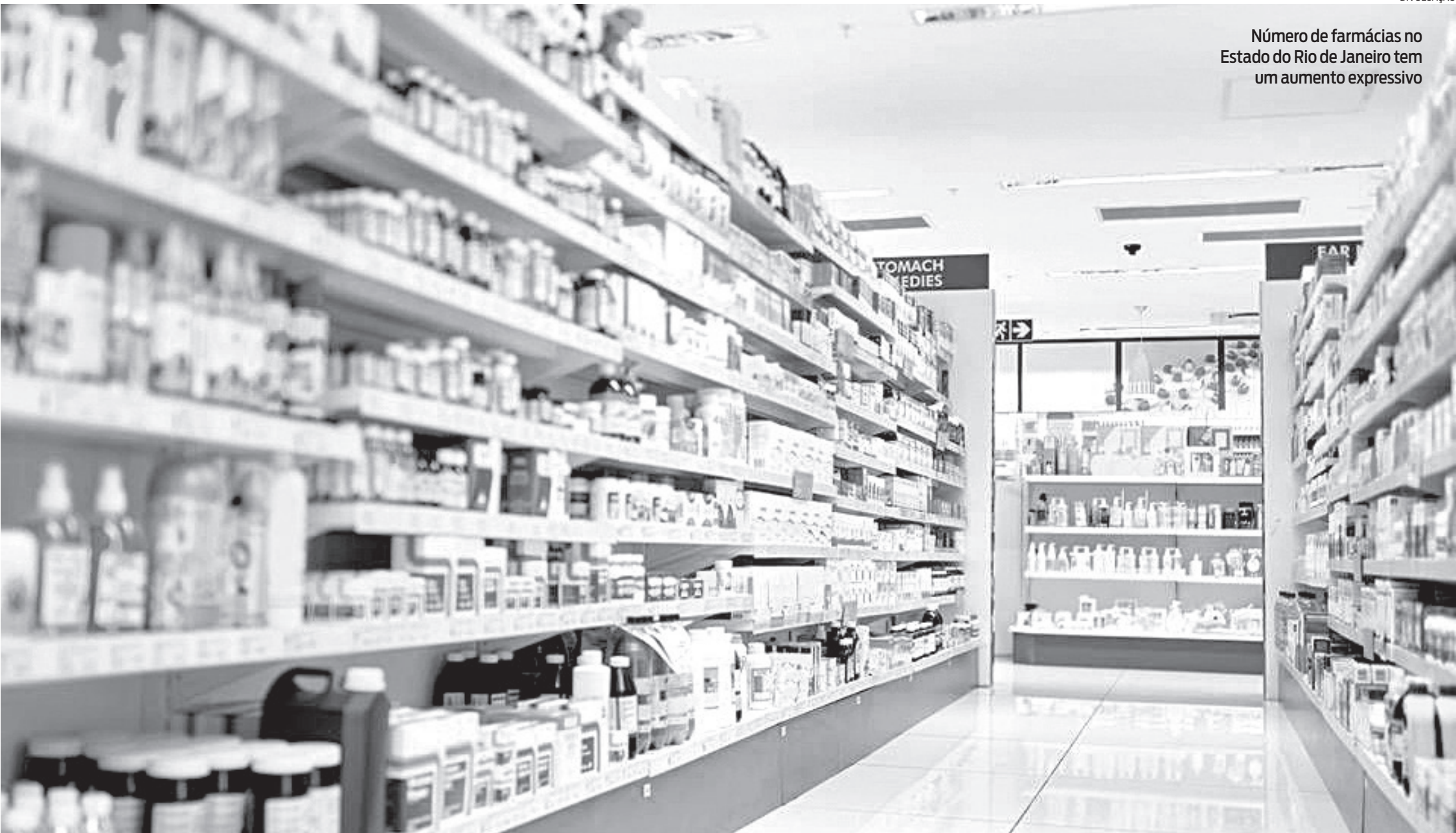
Número de farmácias no Estado do Rio de Janeiro tem um aumento expressivo