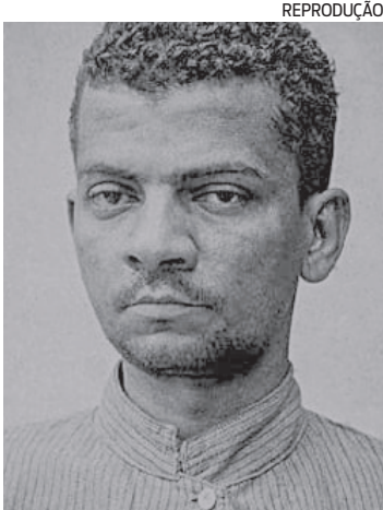
Lima Barreto morreu em 1922

Segundo o parecer do processo, entre os 14 e 16 anos prestou concurso de acesso ao Colégio Pedro II e, habilitado, prosseguiu com os estudos para con-