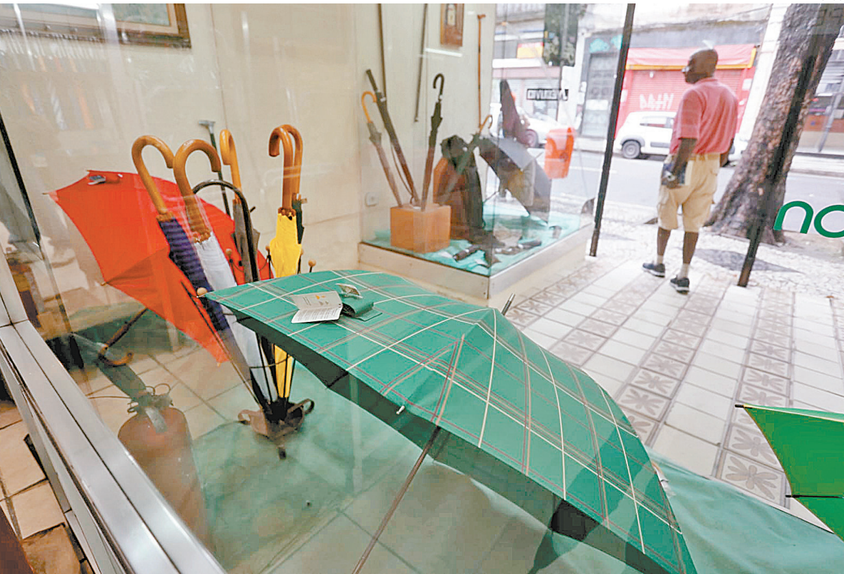
Vitrine da loja Vesúvio, comércio tradicional de guarda-chuvas, que existe há mais de 80 anos no Centro do Rio

Inaugurado em 1946 com a presença do comunicador Chacrinha, estabelecimento segue em plena forma, resistindo a uma onda de fechamentos no Centro da cidade