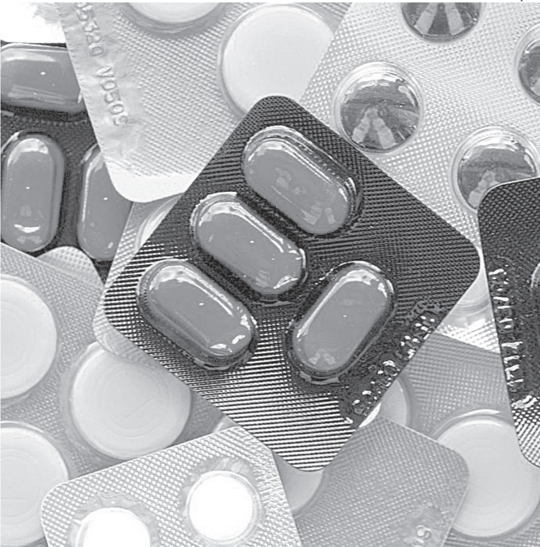
Segundo a Abrafarma, o varejo de medicamentos teve crescimento médio anual de 12,5% de 2010 a 2019

Reportagem da estagiária Júlia Vianna , sob supervisão de Marlucio Luna