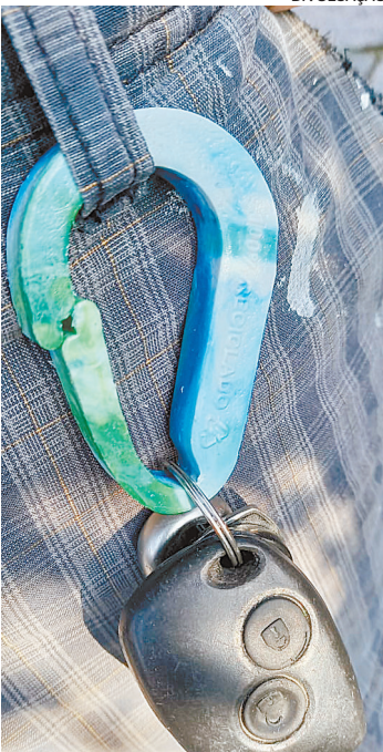
Chaveiro é um dos objetos que podem ser criados