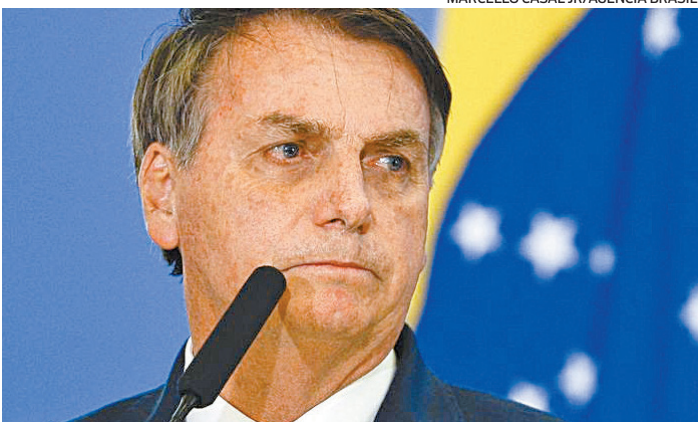
Ex-presidente foi autuado por falta de máscara em ato