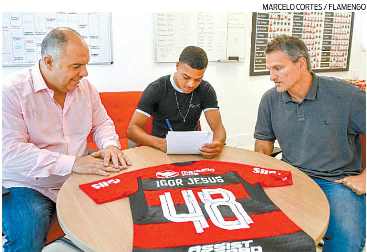
Volante chegou ao clube em 2020, após se destacar no Goiás

O volante chegou ao Flamengo em 2020, após se destacar pelo sub-17 do Goiás. No Rubro-Negro se firmou como titular no sub-20, tam-