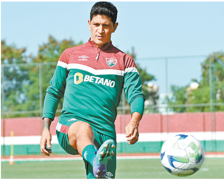
Argentino ainda é o artilheiro do Brasil na temporada, com 24 gols

Ainda sem Aleksander e Keno, Fernando Diniz deve escalar Fábio, Samuel Xavier, Nino, Felipe Melo e Guga; André, Martinelli, Lima e Ganso; Arias e Cano.