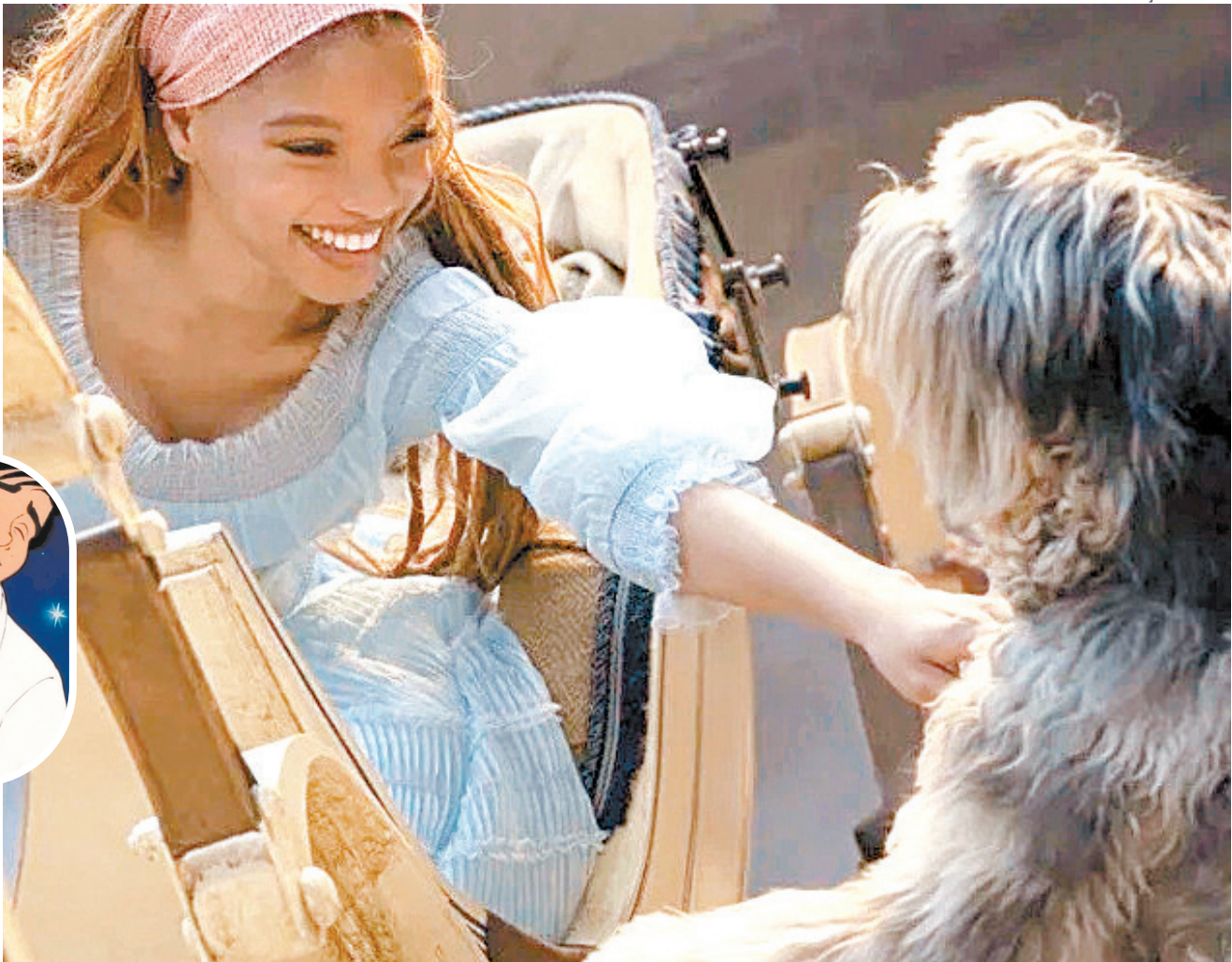
Max apareceu pela primeira vez na animação de 1989 e é considerado por muitos fãs da Disney o melhor pet a aparecer nas animações da empresa