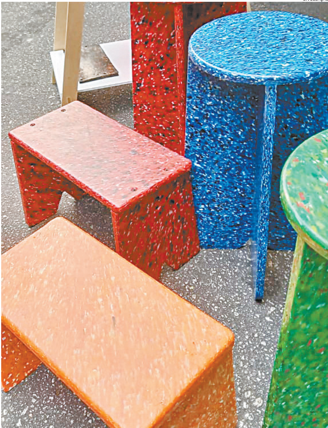
Plástico retirado do ambiente é transformado em placas, que depois podem virar produtos de design

A partir das inscrições, serão formadas três turmas. Ao final das aulas, os alunos terão o aprendizado avaliado a partir de apresentação individual de um trabalho de conclusão.