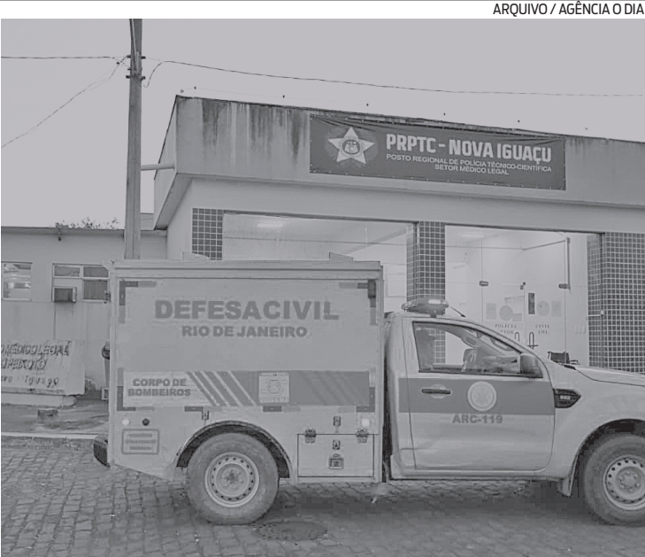
Corpos das crianças mortas no incêndio foram levados para o IML

dio, na região de Tinguazinho, em Nova Iguaçu. De acordo com o comando da unidade, dois menores que estavam no interior da residência não resistiram. A Polícia Civil informou que o caso foi registrado na 58ª DP (Posse). Houve perícia no local, e testemunhas e familiares serão ouvidos. Diligências estão em andamento para esclarecer os fatos.