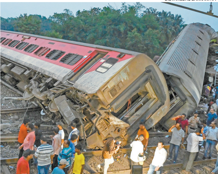
Foram registradas quase 300 mortes e mais de 900 ficaram feridos

escreveu Modi no Twitter. Imagens do local do acidente mostraram compartimentos de trem destruídos e abertos com buracos manchados de sangue perto de Balasore, no estado de Odisha (leste). Alguns vagões viraram completamente na colisão e os socorristas buscavam sobreviventes presos nos destroços retorcidos, enquanto dezenas de corpos estavam dispostos sob lençóis brancos ao lado dos trilhos. Com a chegada do amanhecer, os trabalhadores de resgate puderam ver a exten-