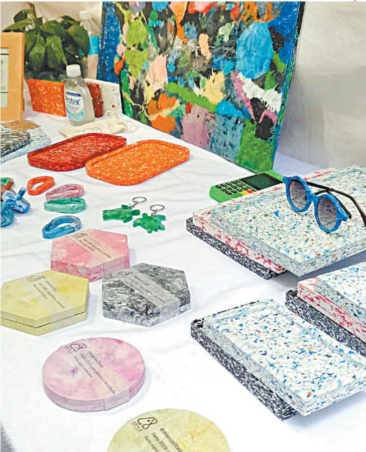
Porta-copos e outros produtos feitos com plástico reaproveitado