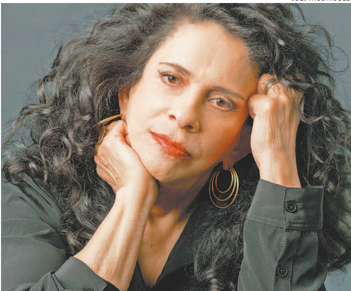
Baiana de Salvador, Gal Costa viveu durante 20 anos no Rio

mente no reparo de um vazamento de água em tubulação que compõe o Sistema Guan- du, em Nova Iguaçu. Além disso, a companhia reiterou que a Equipe da Segurança Patrimonial também estava no local fazendo levantamento dos eventuais danos a serem ressarcidos pela companhia, que prestará a assistência necessária aos moradores. Já a concessionária Águas do Rio informou, nas redes sociais, que o rompimento em uma adutora operada pela Cedae provocou a interrupção parcial do abastecimento para municípios da Baixada e localidades da Zona Norte da capital.