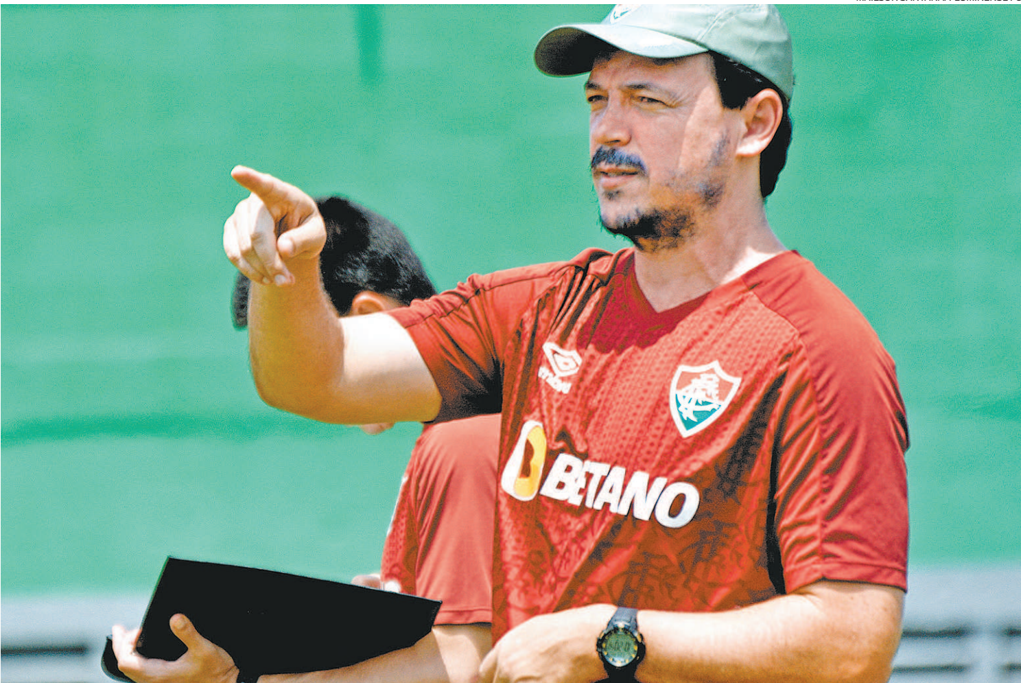
Principal reforço para o Fluminense, dentro do planejamento traçado pelo treinador e toda a diretoria, será a manutenção do elenco

A reapresentação do elenco tricolor está marcada para o dia 2 de janeiro e uma equipe alternativa deve iniciar a campanha no Campeonato Carioca. O Fluminense estreia fora de casa, contra o Resende, em 14 ou 15 de janeiro.