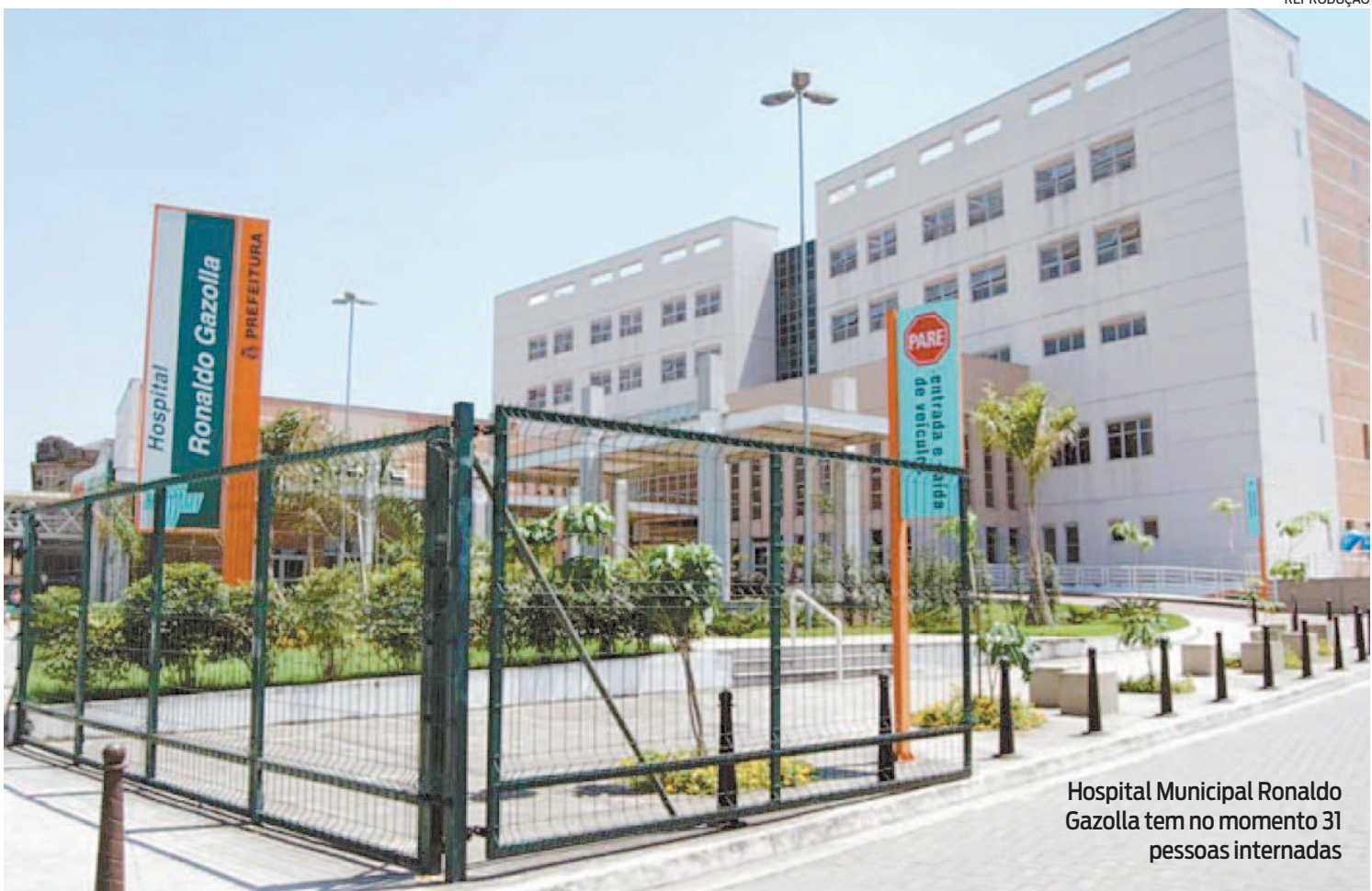
Hospital Municipal Ronaldo Gazolla tem no momento 31 pessoas internadas

O Painel Rio Covid-19 alerta sobre o baixo número de pessoas que se vacinaram com as doses de reforço. De acordo com o levantamento, 24,4% dos moradores do Rio ainda não tomaram a primeira dose de reforço. Além desse número, apenas 35,7% dos municípios receberam a segunda dose