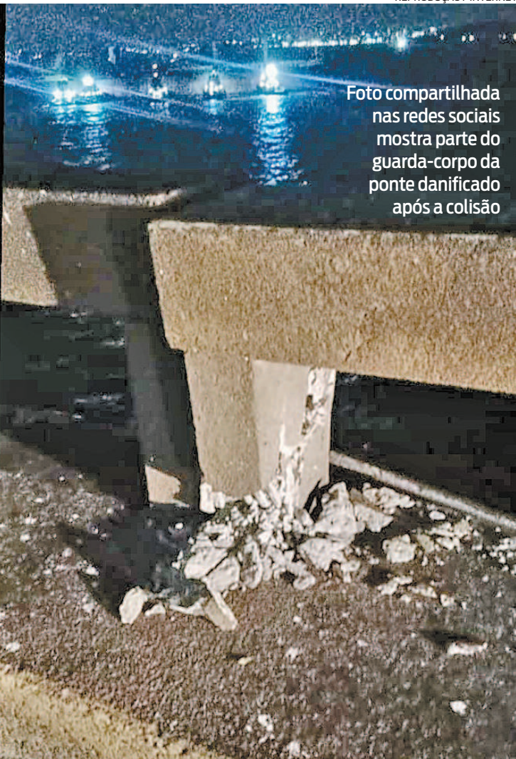
Foto compartilhada nas redes sociais mostra parte do guarda-corpo da ponte danificado após a colisão

Em nota, a Companhia Docas informou que o navio estava fundeado na área 2F06 e que, após constatar a sua movimentação, acionou rebocadores para conter e rebocar o navio, a Capitania dos Portos para ciência e providências cabíveis, e a Ecoponte para interromper o trânsito na ponte.