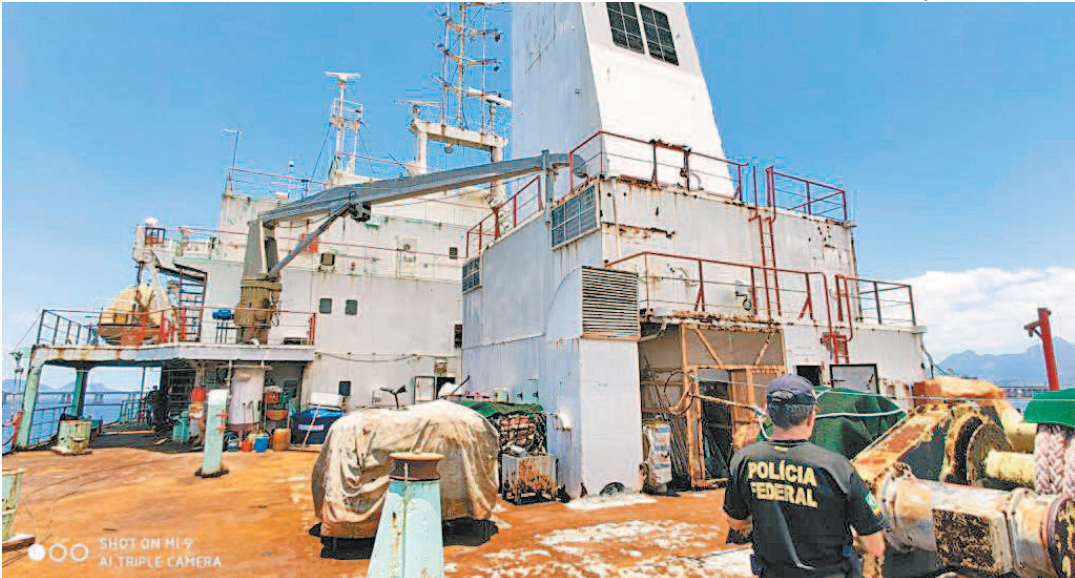
Navio São Luiz foi alvo de operação da PF em 2021, com apoio de auditores do Trabalho