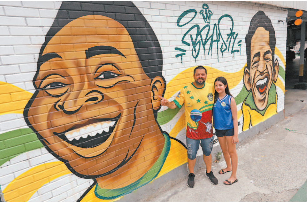
Trecho fica na Rua Pereira Nunes, entre a Boulevard 28 de Setembro e a Rua Teodoro Silva