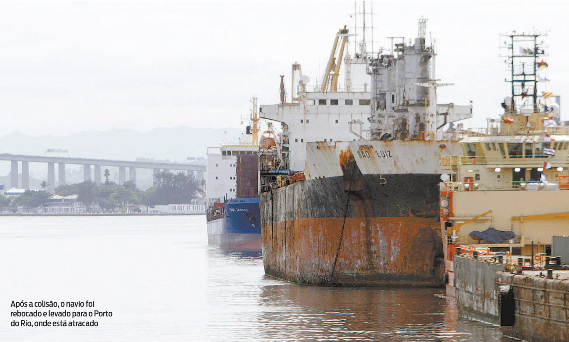
Após a colisão, o navio foi rebocado e levado para o Porto do Rio, onde está atracado

Até 2018, havia tripulação a bordo, mas depois disso, as informações são incertas ao seu respeito.