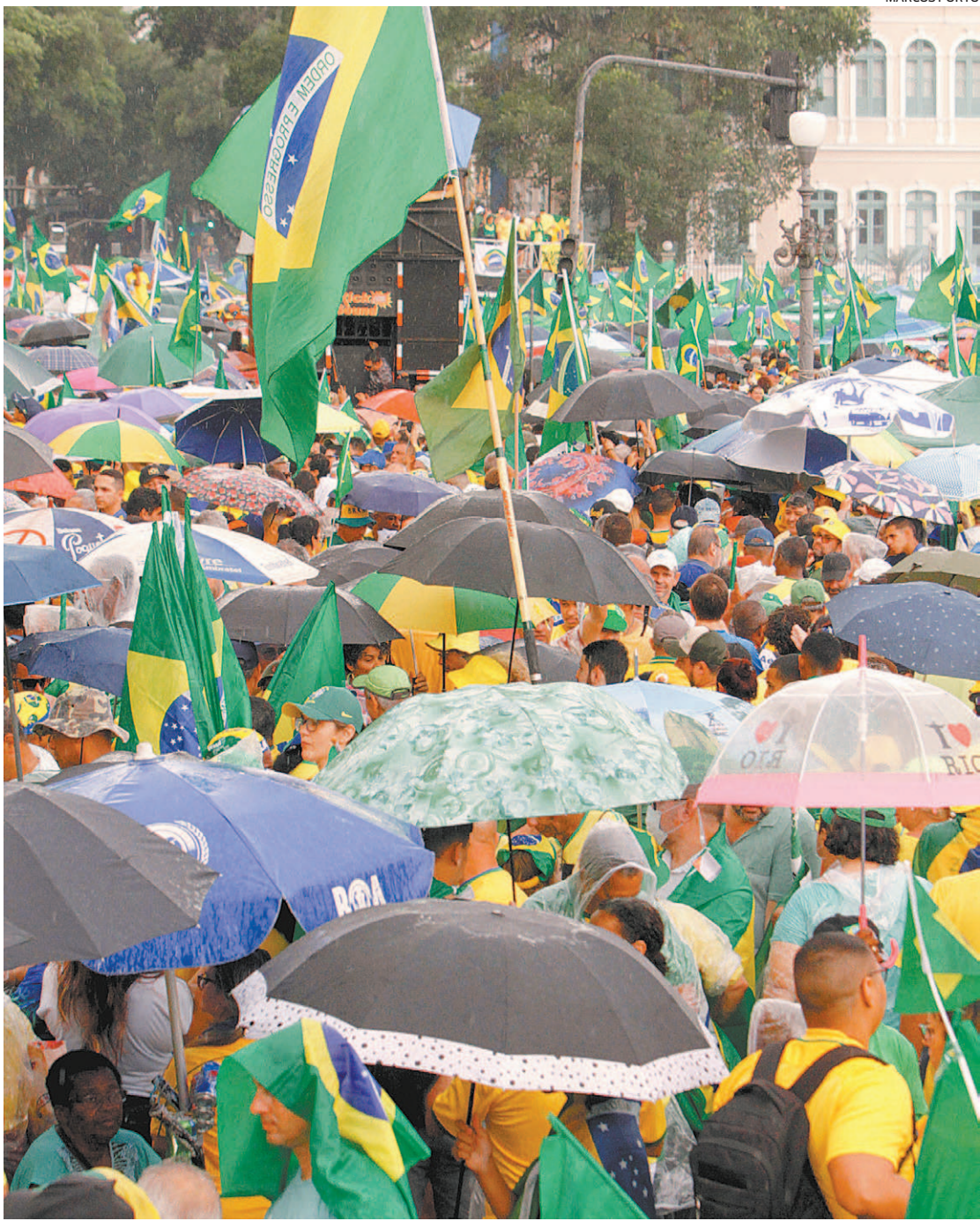
Bolsonaristas vão às ruas com blusas nas cores verde e amarela e envoltos na bandeira do Brasil

Em nota, o Ministério da Defesa disse que manifestações “ordeiras” são “exercício da liberdade de manifestação de pensamento e de reunião”.