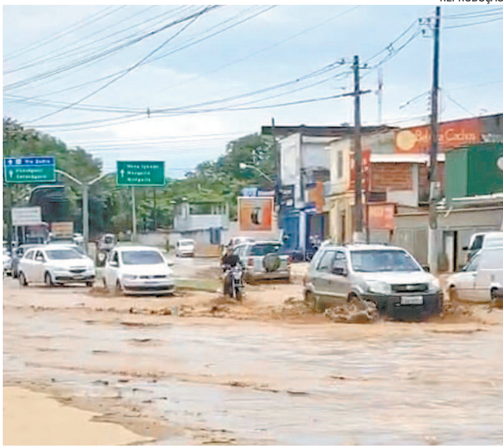
Ruas ficaram completamente alagadas com o vazamento

Uma adutora de água da Cedae se rompeu, na tarde de ontem, em Nova Iguaçu, afetando o fornecimento de água para municípios da Baixada Fluminense e localidades da Zona Norte da capital. De acordo com a companhia, o reparo emergencial seria concluído ainda ontem. Nas redes sociais, um vídeo, gravado por populares, mostrava as ruas completamente alagadas com o vazamento de água. Procurada pelo DIA , a companhia informou que técnicos da Cedae estavam trabalhando emergencial-