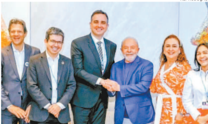
Lula cumprimenta Pacheco, ao lado de Haddad e senadores

Silvinei Vasques é inspetor da Polícia Rodoviária Federal desde 1995 e já exerceu atividades de gerência e comando em áreas como a Superintendência nos Estados de Santa Catarina e Rio de Janeiro e também atuou como Coordenador-Geral de Operações.