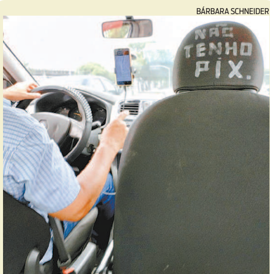
Muita gente ainda não aderiu ao PIX, e nem quer!