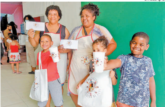
Evento teve a presença de mães e responsáveis pelas crianças