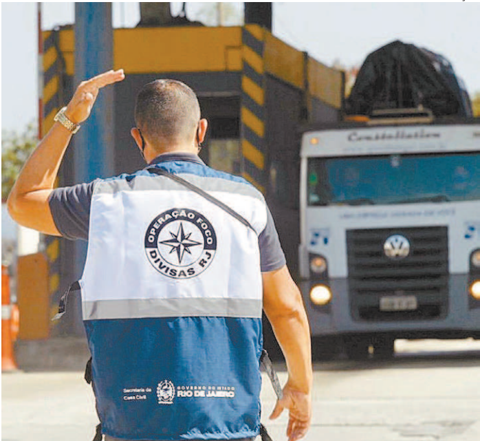
Operação Foco atuou na Avenida Brasil, altura do bairro da Penha