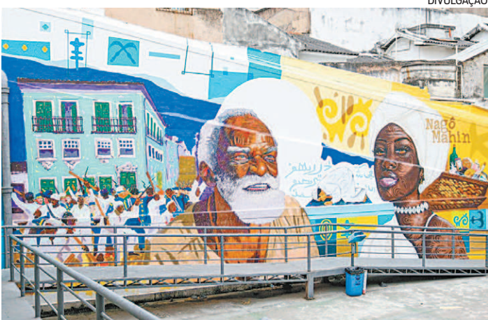
Duas obras com representações de fatos históricos

Já o Caixa Gente Arteira é um programa de arte-educação e educação patrimonial que desenvolve ações de mediação cultural. O programa proporciona atividades lúdicas e educativas com oficinas criativas e visitas orientadas de acordo com o contexto das exposições em cartaz, gerando valor para a sociedade como agente de políticas públicas de cultura e de sustentabilidade.