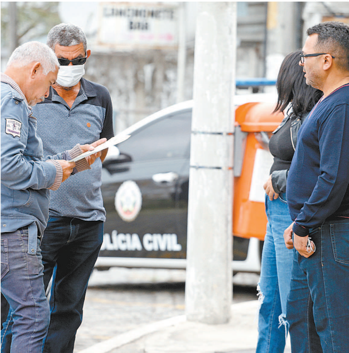
Familiares da vítima na manhã de ontem, no IML, para liberação do corpo; enterro foi em Austin