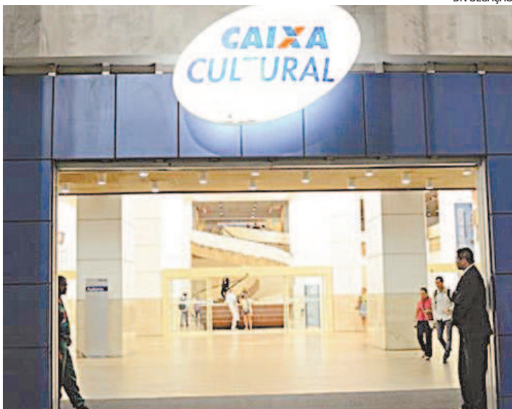
Centro Cultural será na Rua do Passeio, 38, Centro do Rio

Com a inauguração, a Caixa Cultural Rio de Janeiro contará com dois espaços na cidade: a unidade Passeio e o Teatro da Caixa Nelson Rodrigues, na Avenida República do Paraguai, 230, também