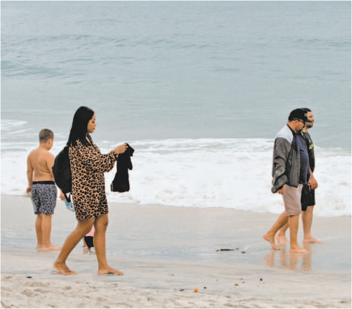
Clima será de muito frio e chuva para os cariocas nesta semana