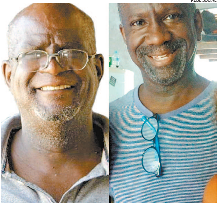
Vizinho matou irmãos após morte do cachorro do acusado

“Quero pedir somente oração de todos vocês pela nossa família e nossa perda, conscientemente sabemos que meu pai e meu tio estão no céu, salvos, eram homens temente a Deus, e estavam certos de sua salvação, somos uma família de paz, de trabalho, caráter e respeito. Meu pai estava em um lugar realizado, em uma comunidade que muito amava, meu pai não tinha inimidade com ninguém, sequer nunca dis-