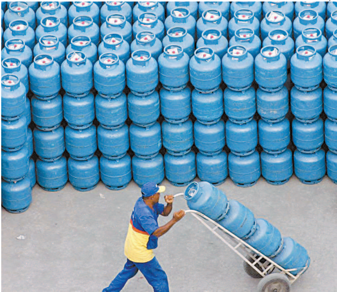
Preço do botijão de gás de cozinha bateu recorde histórico em abril passado, batendo R$ 113,48

A Petrobras anunciou ontem uma redução de 4,7% no preço do gás de cozinha (GLP). Com isso, o valor médio do insumo vendido às distribuidoras vai cair de R$4,23 por quilo para R$4,03 por quilo, o que leva o botijão de 13 quilos para R$52,34. Trata-se de uma redução média de R$2,60 no preço da botija. O redução passa a valer a partir de hoje. Segundo pesquisa da Agência Nacional do Petróleo (ANP), o preço do GLP no varejo registra alta de 48,18% no ano, subindo de R$ 75,29 para R$ 111,57. O gás de cozinha, combustível largamente usado pelas camadas mais pobres da população, não era reajustado há mais de cinco meses, desde 9 de abril, quando teve o preço rebaixado de R$4,48 para R$ 4,23 por quilo, o equivalente a uma queda média R$ 3,27 no preço do botijão de 13 quilos, que, então, passou a custar R$ 54,94. A Petrobras informou que essa redução “acompanha a evolução dos preços de referência” e é “coerente” com a prática de preços da empresa, a qual busca o equilíbrio dos seus preços com o mercado, mas sem repassar aos preços internos a volatilidade conjuntural das cotações e da taxa de câmbio.