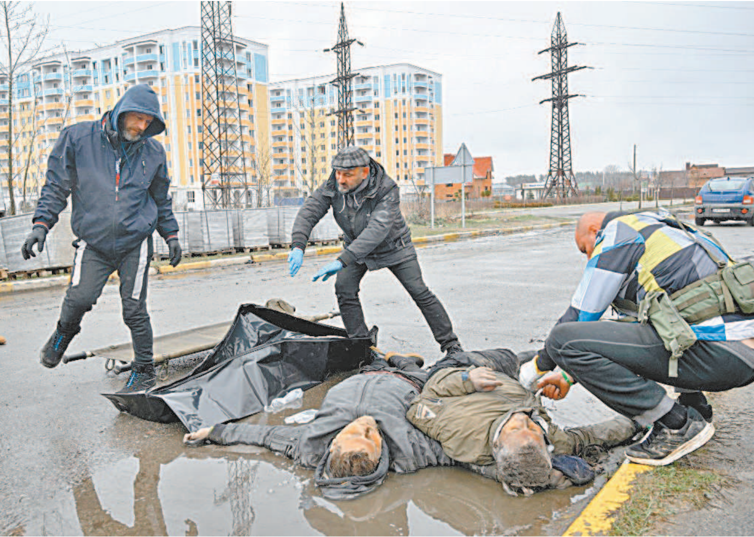
Anistia Internacional pediu a autoridades ucranianas que ‘deem prioridade à compilação de provas’ de crimes de guerra