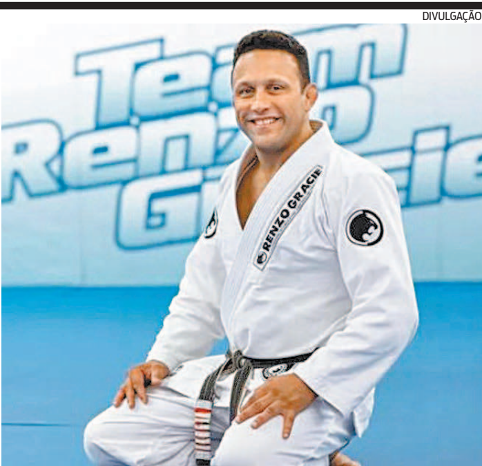
Renzo é neto de Carlos Gracie e sobrinho-neto de Hélio Gracie