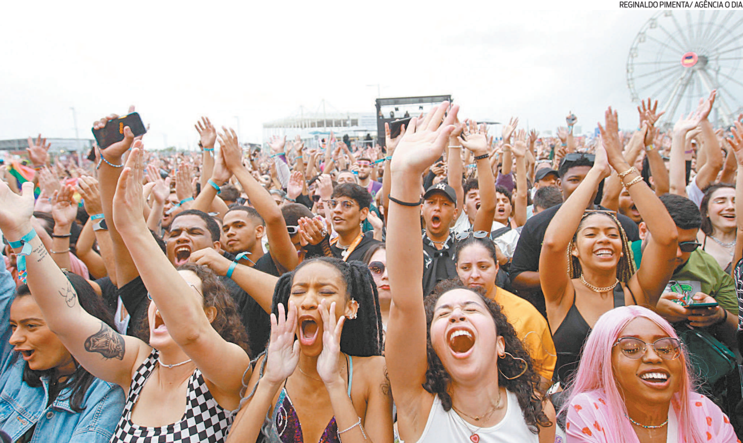
RIR atraiu 360 mil turistas, o que representa 60% do público no total dos sete dias de festa. Cerca de 10 mil vieram de 31 países diferentes

Retorno do evento gerou 28 mil empregos. Média de ocupação hoteleira ficou em 94,51% na segunda semana do festival