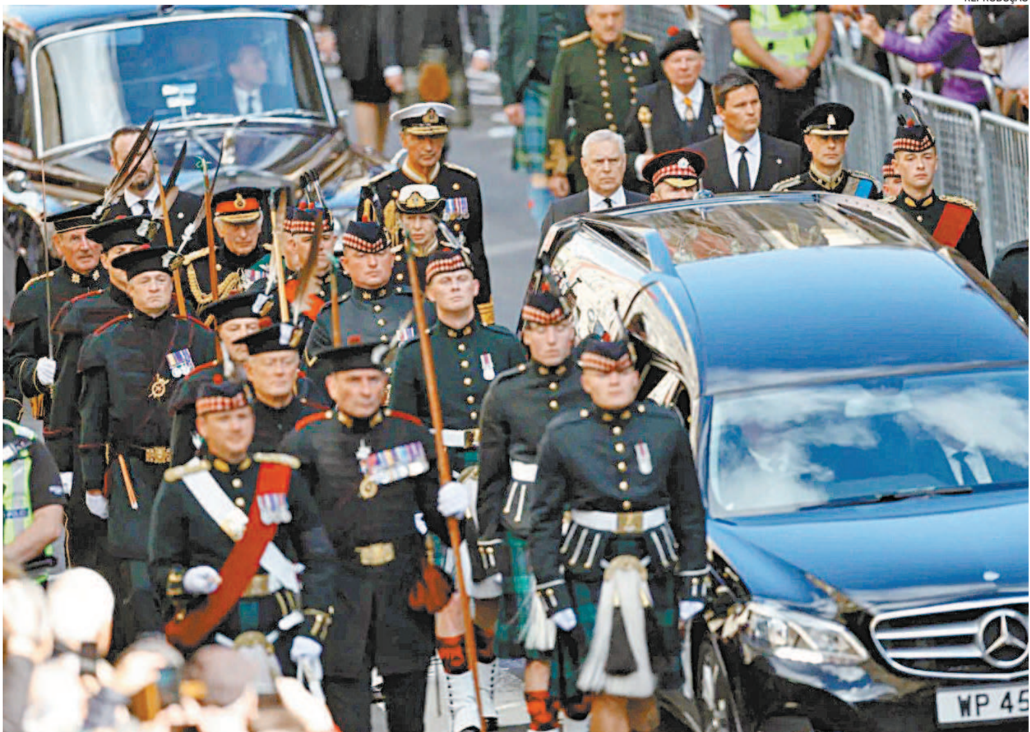
Novo monarca também iniciou nesta segunda-feira uma delicada viagem pelas nações que integram o Reino Unido

As autoridades calculam que até 750 mil pessoas podem tentar participar na despedida da monarca em