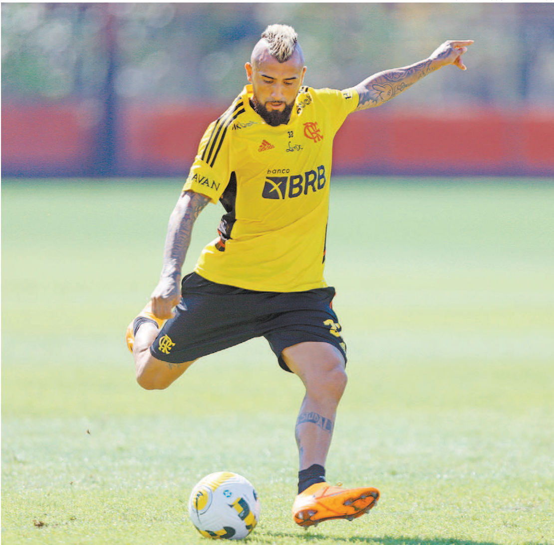
GILVAN DE SOUZA/FLAMENGO

Gabigol chegou ao Flamengo em 2019 e em pouco tempo se tornou um dos