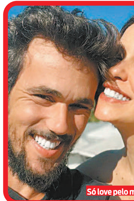
Só love pelo m