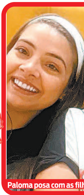
Paloma posa com as filh