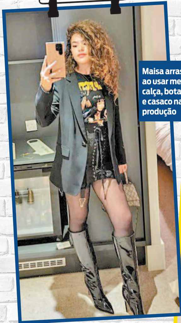
Maisa arrasou ao usar meia-calça, bota e casaco na produção

Famosas como Marina Ruy Barbosa, Larissa Manoela e Rafa Kalimann usam o truque de estilo nas produções