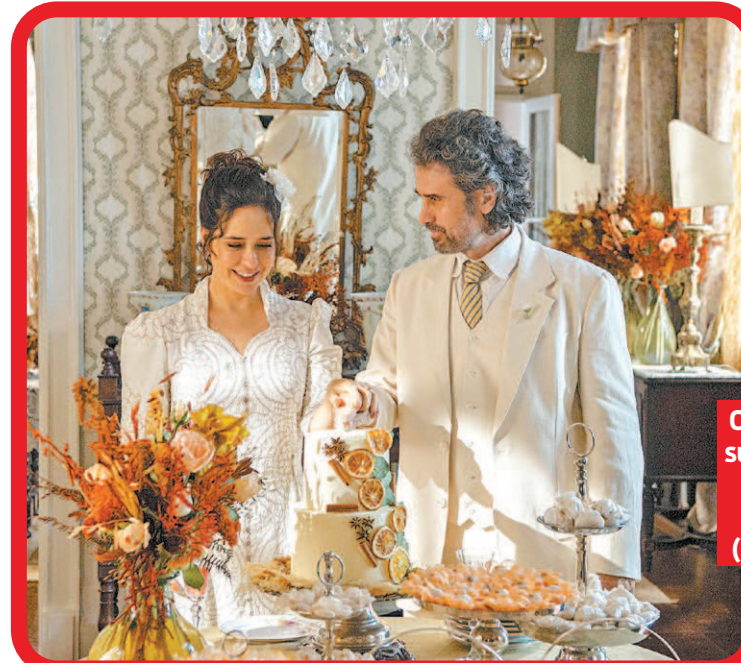
Cena de novela: sua personagem se casa com Leônidas (Eriberto Leão)