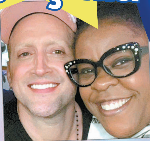
A atriz e o amigo Paulo Gustavo: 'É difícil de acreditar que ele se foi', lamenta Cacau