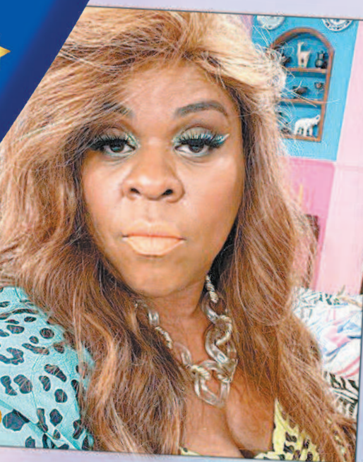
Em cena como a hilariante Terezinha, do programa 'Vai que Cola', do Multishow

Cacau coleciona personagens de sucesso. Na televisão, a atriz ganhou destaque como Zezé de 'Avenida Brasil' (2012), da TV Globo, Terezinha do 'Vai Que Cola' (2013-2022) e Shirley de 'Família Paraíso' (2022), ambas do Multishow. Ela também já arrancou boas gargalhadas do público nos cinemas, em comédias como 'Vai que