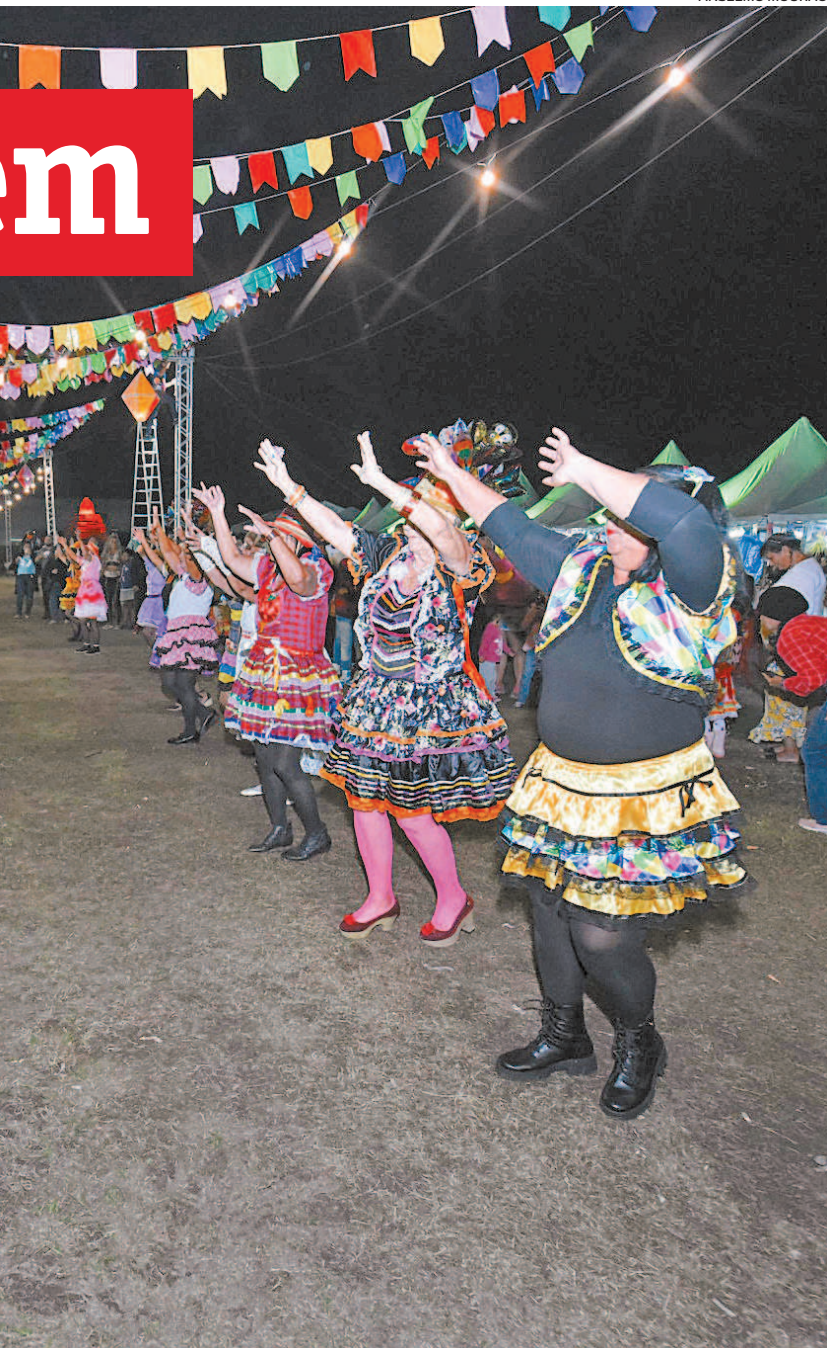
ho e transbordaram felicidade para todos que estavam na festa