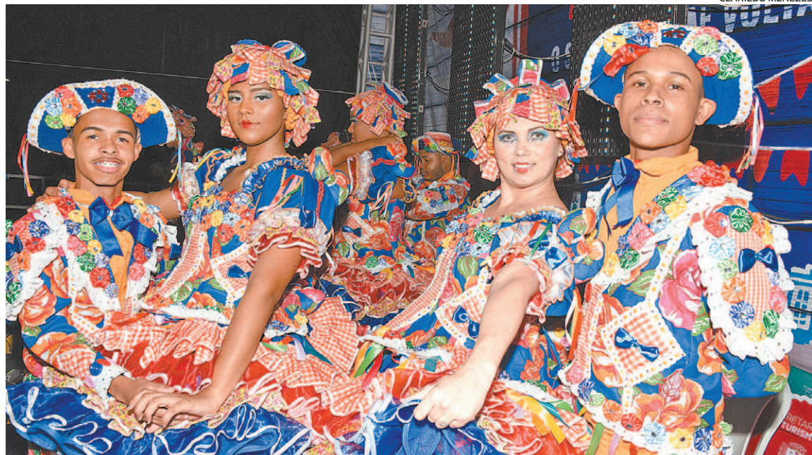
Beleza da decoração junina e das apresentações de dança caipira chamaram a atenção em todos locais