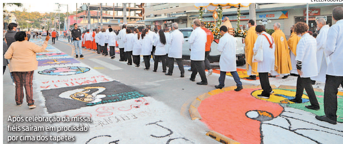
Após celebração da missa, fiéis saíram em procissão por cima dos tapetes

A montagem dos tapetes começou às 7h. Além de sal, foram utilizados materiais como corantes, pó de café, farinha de trigo, papel e caixa de ovo. Entre os desenhos, imagens da cruz da eucaristia, de Jesus Cristo, de Nossa Se-