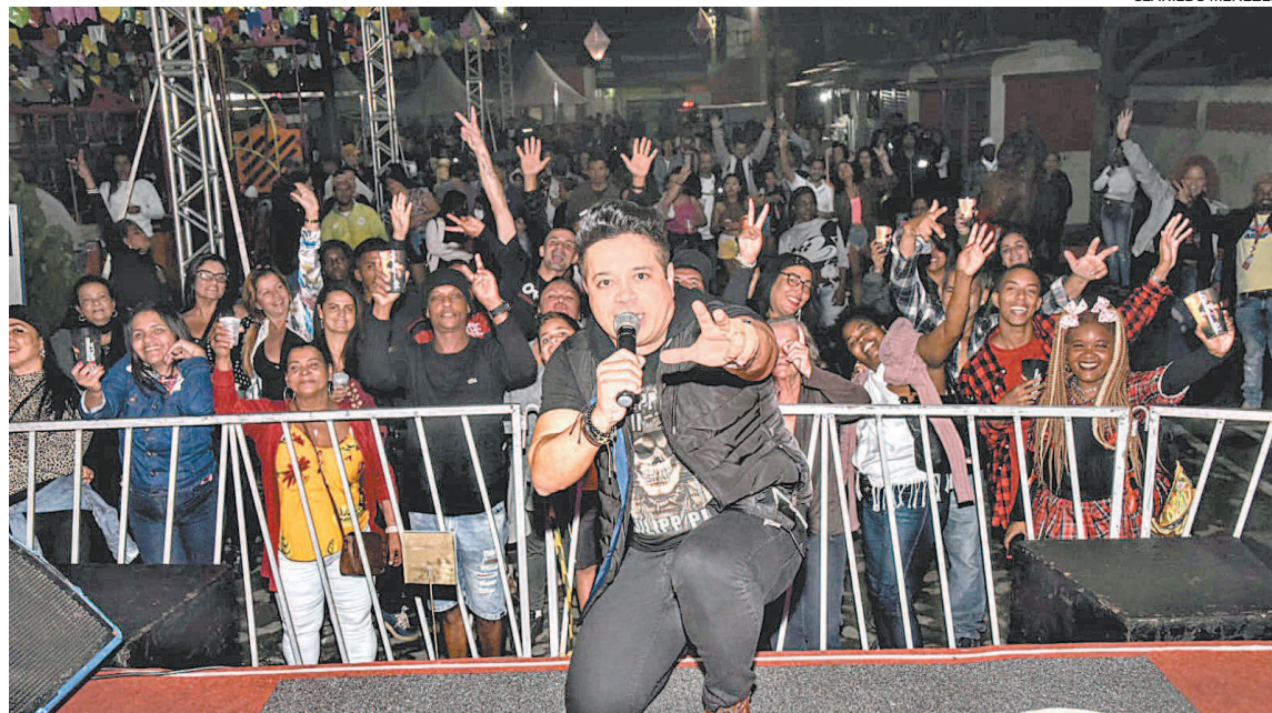
As apresentações lotaram os locais de festa. Moradores e visitantes compareceram e não pararam de dançar