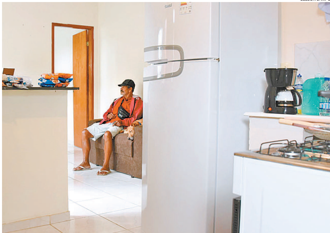
Morador de Colinas recomeça a vida com conforto e dignidade, após compra de móveis e eletrodomésticos

“Enquanto gestores públicos, devemos cuidar da nossa gente. As chuvas deixaram um rastro de destruição, levando embora muitos sonhos. A gestão do governo Fabiano Horta conseguiu responder prontamente a essa eventualidade depositando os valores do aluguel social menos de 48h depois e concedendo o Auxílio Recomeço às vítimas, cestas básicas, mas principalmente, colocando a eficiência da gestão pública a favor do interesse social. O senhor Modesto e o cachorri-