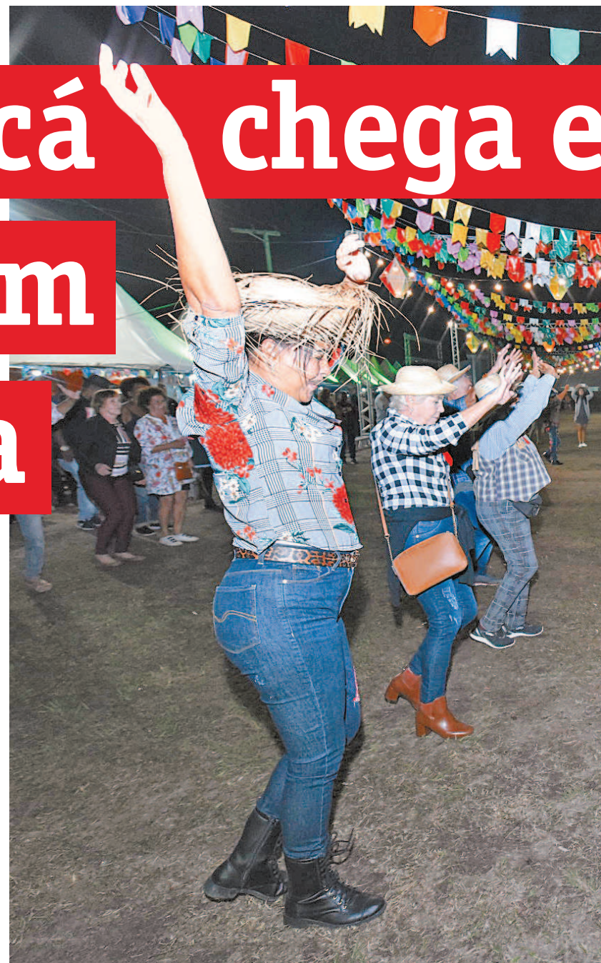
Integrantes da Casa do Idoso participaram da quadrilha no Arraiá de Cordeiro