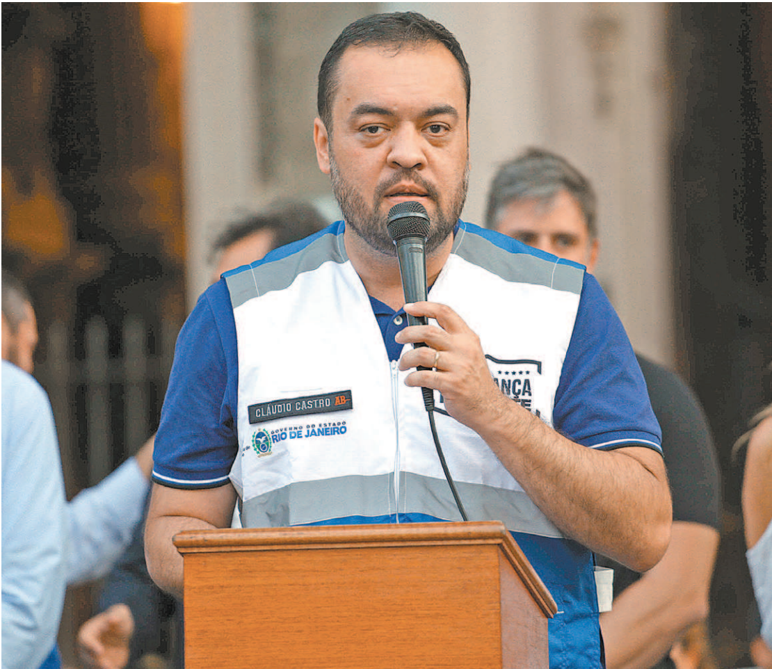
Mudanças feitas pelo governador Cláudio Castro obedecem à legislação eleitoral