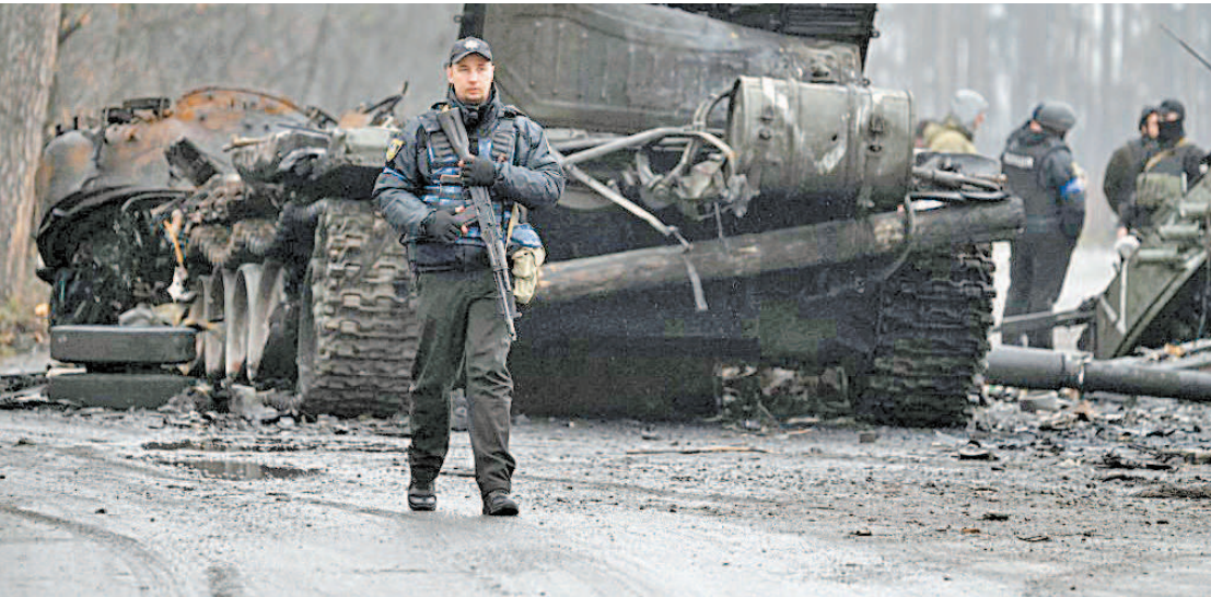
Cena de guerra em Dmytrivka: segundo a ONU, mais de 4 milhões de refugiados fugiram da Ucrânia