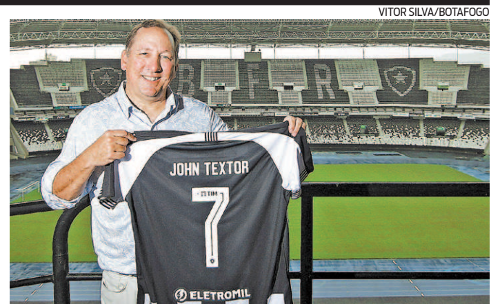
O americano John Textor é dono de 90% da SAF do Glorioso