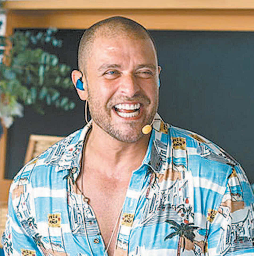
A partir do dia 20, grandes nomes se apresentam, como Diogo Nogueira, Alcione e Jorge Aragão