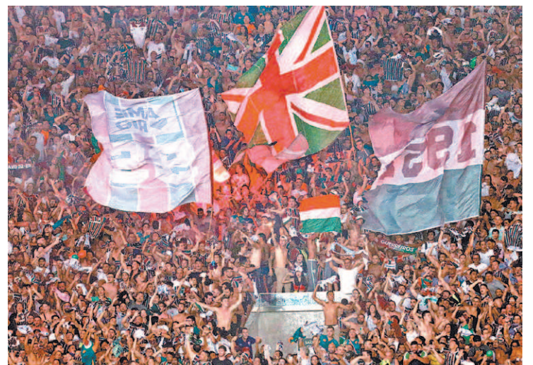
Fim do jejum de títulos: torcida tricolor faz a festa no Maracanã