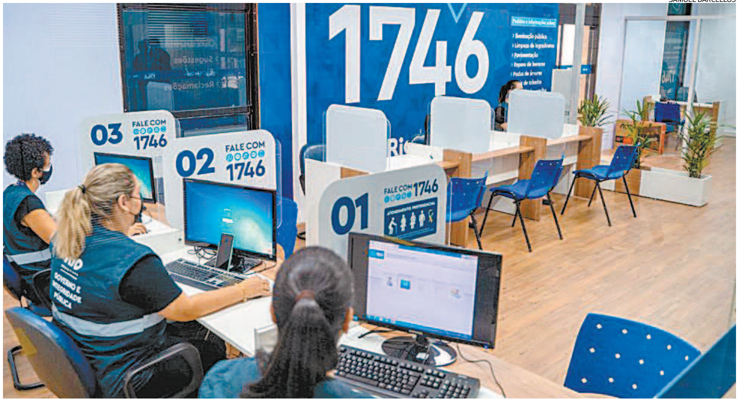
O canal 1746 é coordenado pela Subsecretaria de Transparência e Governo Digital, por meio da Secretaria de Governo e Integridade Pública