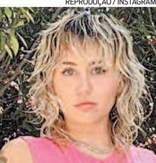
Miley Cyrus esteve no Brasil

“os novos imperialismos”, que carregam o risco de uma “guerra fria prolongada que pode sufocar a vida de povos e gerações inteiras”. O Comitê Internacional da Cruz Vermelha (CICV) informou que enviou uma equipe a Mariupol para evacuar civis, após uma tentativa fracassada na sexta-feira porque “as condições tornaram impossível prosseguir” com a operação.