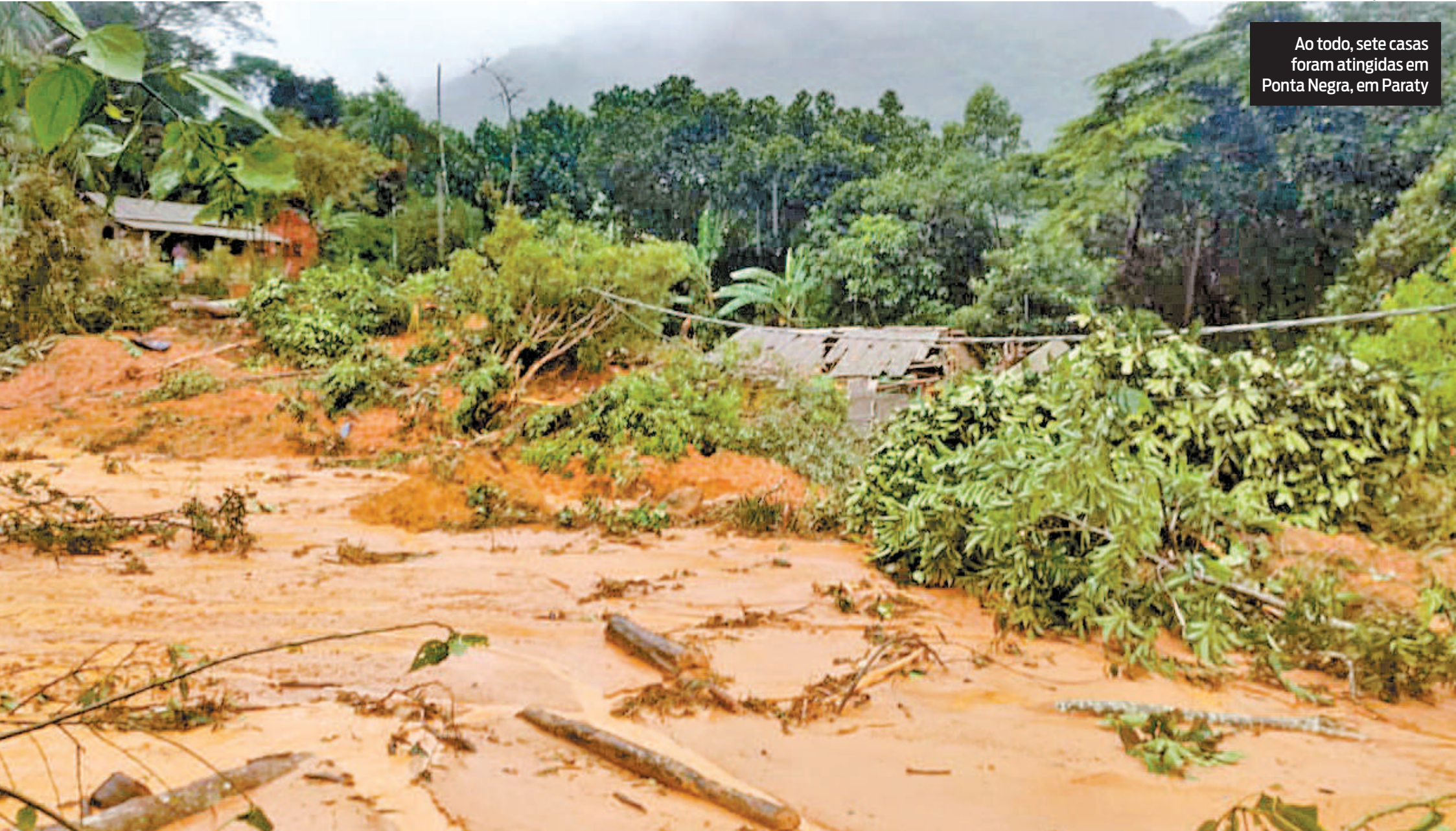
Ao todo, sete casas foram atingidas em Ponta Negra, em Paraty

MARINA CARDOSO marina.cardoso@odia.com.br