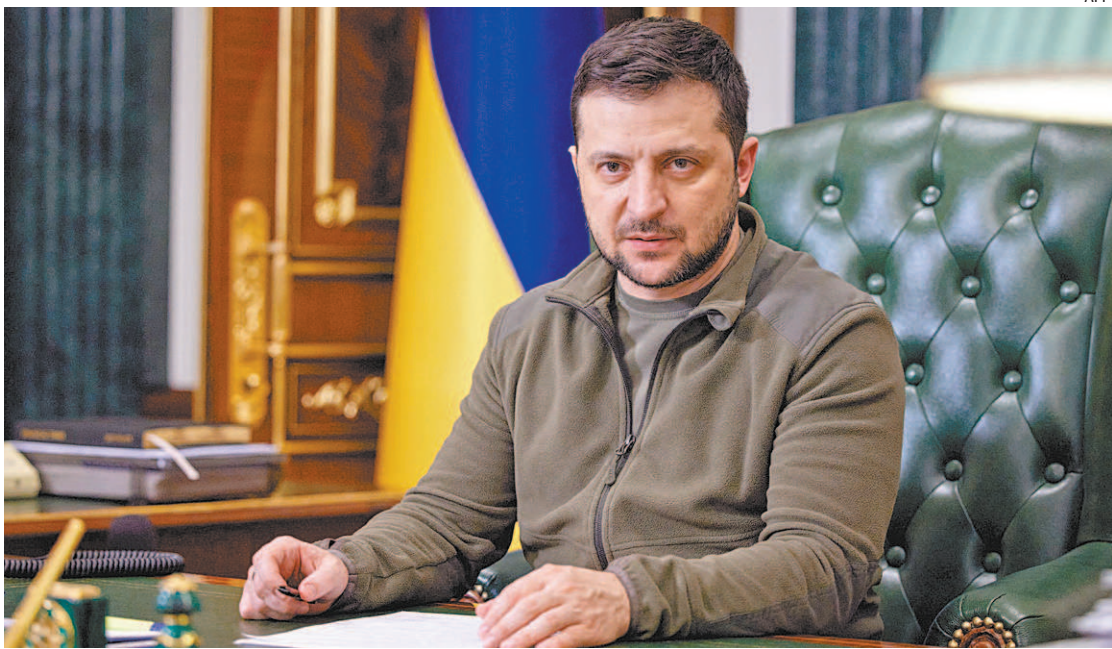
Presidente ucraniano, Zelensky afirmou que é preciso aceitar que seu país não será membro da Otan