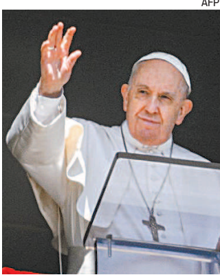
Papa Francisco fez oração

compromisso. As duas partes negociam por videoconferência desde segunda-feira e as conversações prosseguem nesta quarta-feira, quando a ofensiva russa em território ucraniano completa três semanas. A Suécia, país não alinhado, não é membro da Otan, mas é aliado da Aliança desde meados dos anos 1990. O país abandonou oficialmente sua neutralidade ao final da Guerra Fria, período que também coincidiu com sua entrada na União Europeia (UE). Áustria é um país neutro e não pode enviar soldados a um país em guerra, com exceção das missões da ONU. Na terça-feira, Zelensky deu um passo na direção da Rússia e afirmou que era necessário aceitar que seu país nunca será membro da Otan. Esta possibilidade é um dos principais argumentos usados pela Rússia para justificar a ofensiva contra a Ucrânia.