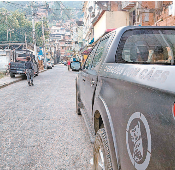
Polícia Militar faz operação no Morro dos Macacos, em Vila Isabel

O policiamento foi reforçado ontem no Morro da Formiga, na Tijuca, também na Zona Norte. Policiais militares estavam baseados num acesso