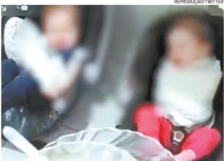
Imagem mostra duas crianças presas em camisa de forças

A escola infantil Colmeia Mágica, localizada no bairro Vila Formosa, na Zona Leste de São Paulo, está sendo investigada pela Polícia Civil após vazarem vídeos das crianças sendo maltratadas. As imagens mostram dois bebês amarrados com lençóis e chorando embaixo de uma pia. A escola se tornou alvo de um inquérito policial aberto na Central Especializada de Repressão a Crimes e Ocorrências Diversas da 8ª Delegacia Seccional. A Polícia Civil informou, em nota, que os fatos citados são alvo de investigação pela instituição. “Diligências e oitivas estão em andamento. Mais detalhes serão preservados para garantir a autonomia do trabalho policial”, diz documento. De acordo com informações do G1, a Cerco decidiu