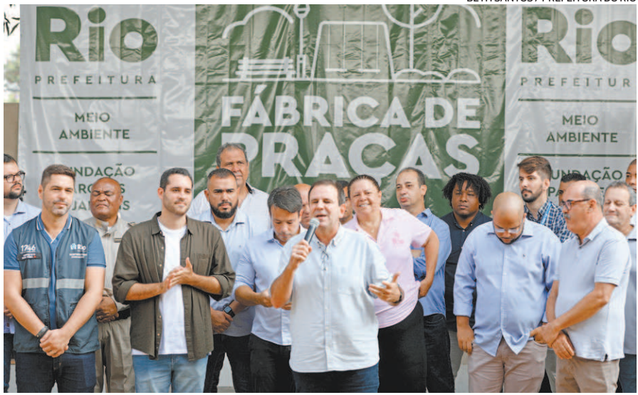
Eduardo Paes anunciou ontem projeto Fábrica de Praças