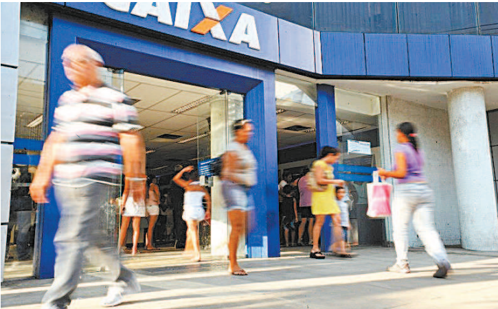
Primeira parcela do 13º do INSS sairá na folha do mês que vem

dimento da Central de Atendimento está disponível de segunda a sábado, no horário de 7h às 22h. No site, o segurado pode acessar o Meu INSS. É necessário fazer o login, clicar no serviço de “Extrato de Pagamento” e ter acesso ao extrato e todos os detalhes sobre o pagamento do benefício. No aplicativo, é preciso ter celular disponível para Android e iOS. O caminho segue o mesmo adotado pelo portal.