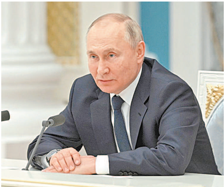
Presidente russo, Putin reforça controle sobre notícias do conflito

A agência russa reguladora do setor de telecomunicações, a Roskomnadzor, bloqueou os sites de pelo menos outros 30 meios de comunicação, segundo constatou a AFP, ontem, no momento em que Moscou reforça seu controle sobre as notícias publicadas online sobre o conflito na Ucrânia. As páginas online do veículo investigativo Bellingcat, de jornais locais russos e de veículos em russo baseados em Israel e na Ucrânia estavam inacessíveis hoje na Rússia, sem uma