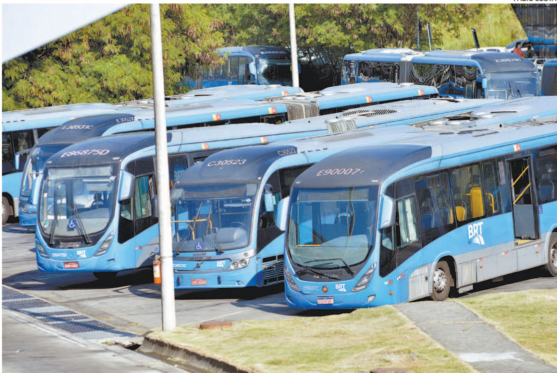
Uma segunda licitação, prevista para o segundo semestre, prevê a aquisição dos outros 250 veículos

Apesar da tentativa, a Prefeitura do Rio não conseguiu nenhum interessado na licitação do BRT. O pregão, realizado ontem pela manhã, para comprar 307 ônibus e renovação da frota não recebeu nenhuma proposta. A informação foi confirmada pelo prefeito Eduardo Paes. As datas para requalificação do transporte poderão ser comprometidas. “O ‘sistema’ não é fácil! Mas vamos superar. Somos perseverantes!”, comentou Paes sobre a dificuldades de encontrar interessados na licitação. A renovação da frota, que faz parte da requalificação do sistema, será dividida em duas licitações. De acordo com a Secretaria Municipal de Transportes (SMTR), a primeira prevê a aquisição dos 307 veículos articulados, de um total de 557, possibilitando a substituição gradativa antiga a partir de outubro deste ano. A segunda licitação, prevista para o segundo semestre, prevê a aquisição dos outros 250 veículos, com entrega para o segundo semestre de 2023. O objetivo é ‘garantir mais qualidade no serviço prestado, com maior oferta de ônibus e redução dos intervalos’. No entanto, com a falta de interessados na compra dos ônibus, as da-