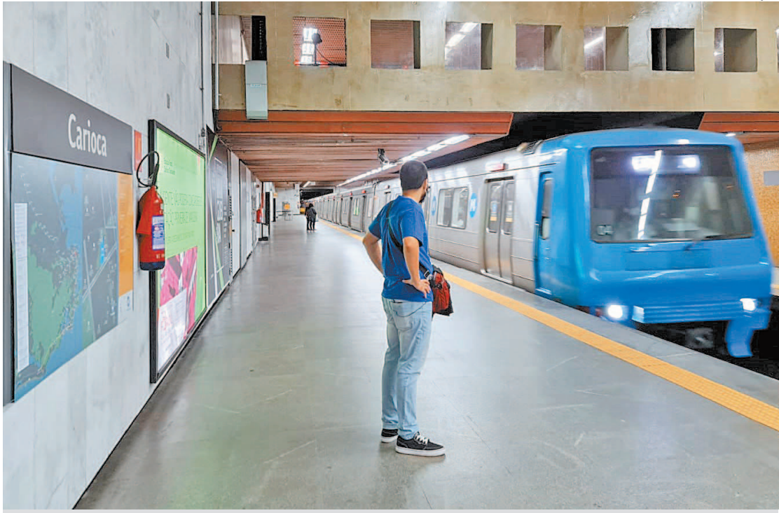
Com reajuste, passageiros passariam a pagar 16,91% a mais do que pagam atualmente

A nova tarifa foi aprovada durante sessão regulatória, na tarde de sexta-feira (25). O reajuste, baseado no IGP-M, é previsto pelo contrato de concessão assinado