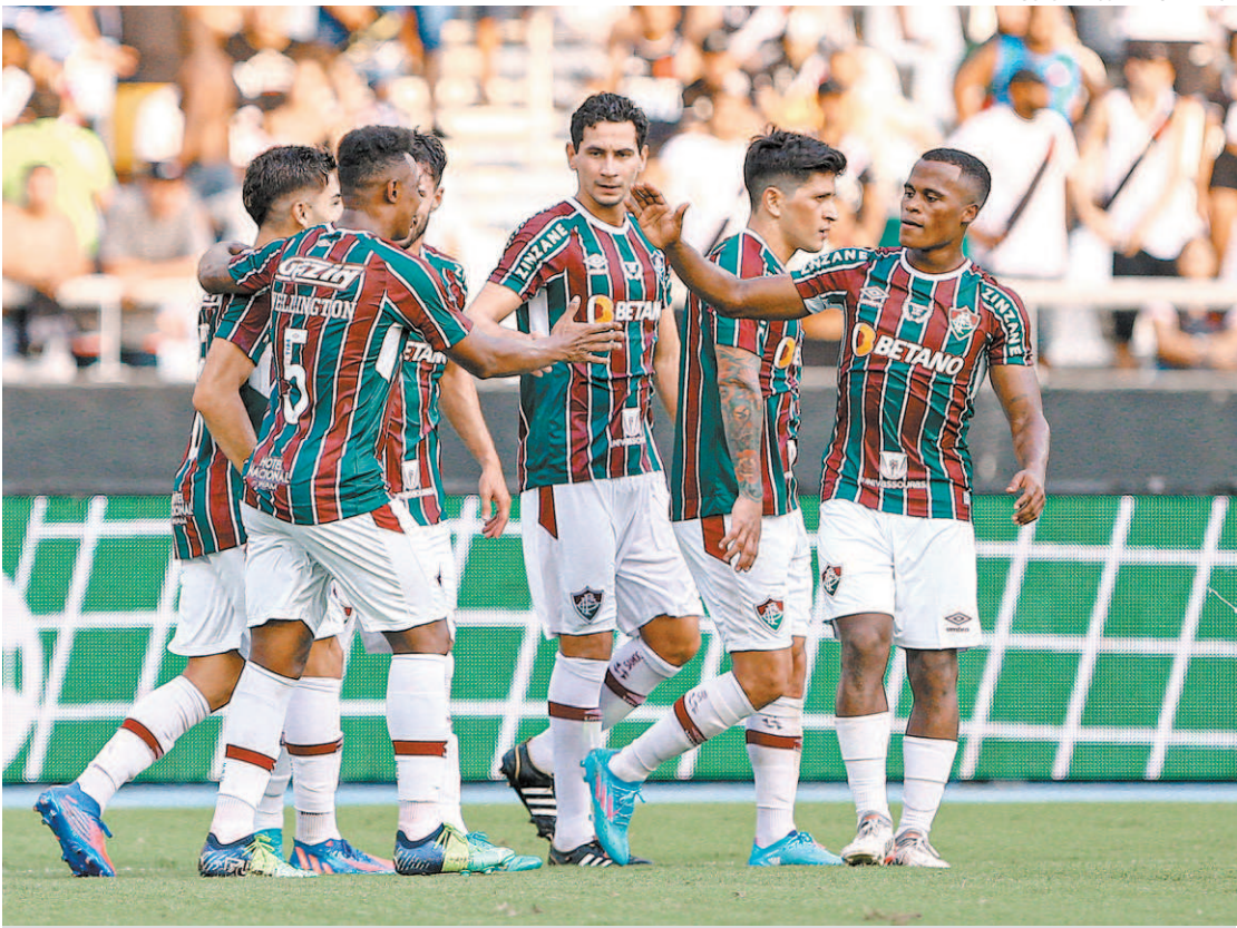
Equipe tricolor dominou o duelo contra o Vasco, conquistando sua nona vitória na temporada 2022