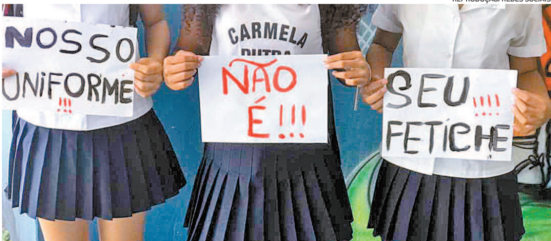
Segurando cartazes, estudantes pediram ajuda em protesto realizado na tarde de sexta-feira

sadores usam este motivo para justificar os comentários de duplo sentido. “É um absurdo a gente ir para a escola procurar uma educação de qualidade e encontrar assédio. Isso é inaceitável. É por isso que a gente está aqui (denunciando). Queremos uma escola onde as meninas possam circular tranquilamente sabendo que não vão ser assediadas nem dentro e nem fora da escola por causa de seus uniformes”, disse uma das alunas durante o protesto. Segurando cartazes com dizeres “A minha saia não é um convite, é um uniforme” e “Não é fetiche, a minha saia não é convite”, estudantes pediram ajuda.