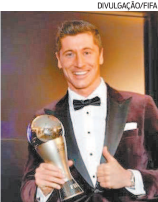
Lewandowski apoia decisão

A seleção polonesa não pretende disputar o duelo da repescagem para a Copa do Mundo contra a Rússia, no dia 24 de março, em Moscou. O anúncio foi feito pelo presidente da Federação Polonesa, Cezary Kulesza, no Twitter. “Chega de falar, é hora de agir. Devido à escalada de agressão da Rússia na Ucrânia, a seleção polonesa não pretende jogar o play-off contra a equipe russa”, disse Kulesza. O centroavante polonês Robert Lewandowski, que atua no Bayern de Munique, apoiou a decisão: