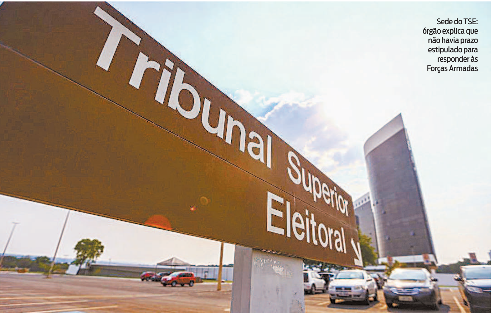
Sede do TSE: órgão explica que não havia prazo estipulado para responder às Forças Armadas

O Comprova ainda enviou mensagem para o perfil do Coronel Koury no Telegram, mas também não houve resposta. Em pesquisas na internet, foi possível identificar o Grupo B-38 e suas pautas.