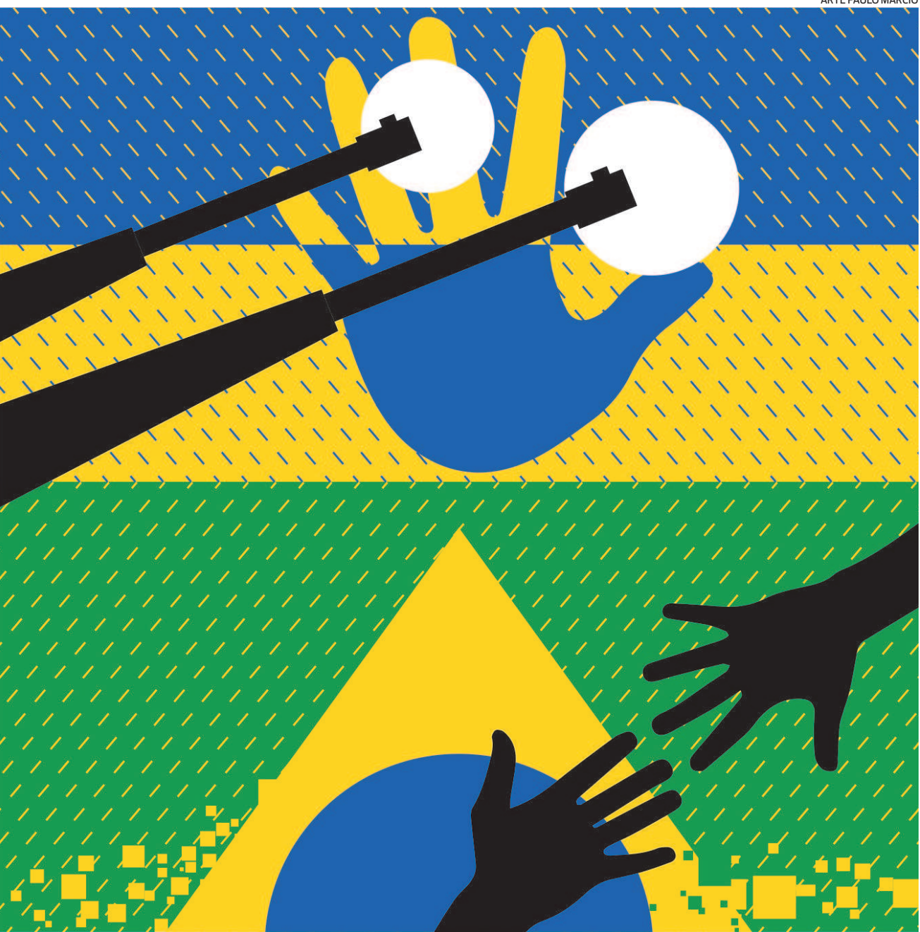
ARTE PAULO MÁRCIO

Se isso acontecer, o preço dos combustíveis que já andam pela hora da morte nos postos brasileiros, aumentará ainda mais — e, junto com eles, se elevarão a inflação e a insatisfação da população. Nesse quesito é importante res-