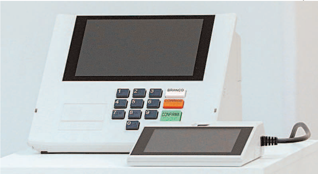
Urna: TSE citou trecho que pede que “as respostas sejam enviadas à medida que estiverem disponíveis”