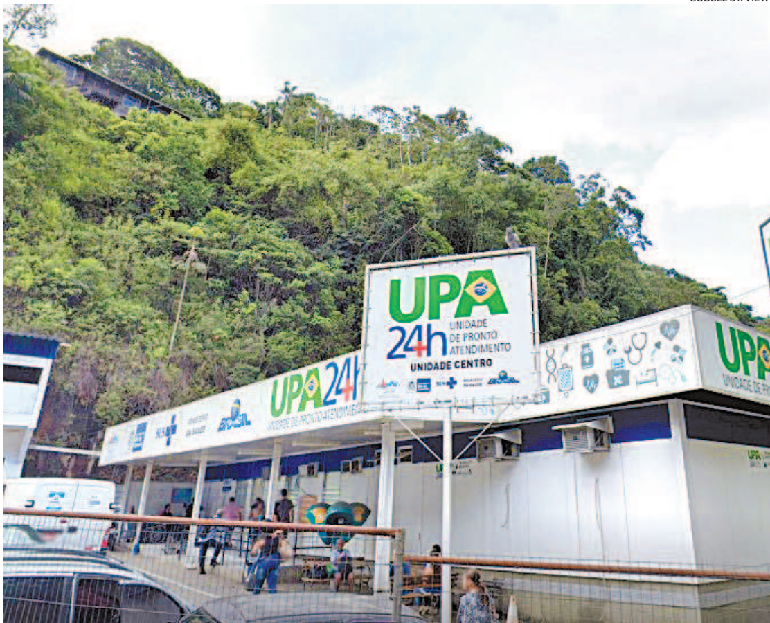
Deslizamento aconteceu em área atrás da UPA Centro, na Rua Washington Luiz, em Petrópolis

O funcionário faz parte das equipes de limpeza de