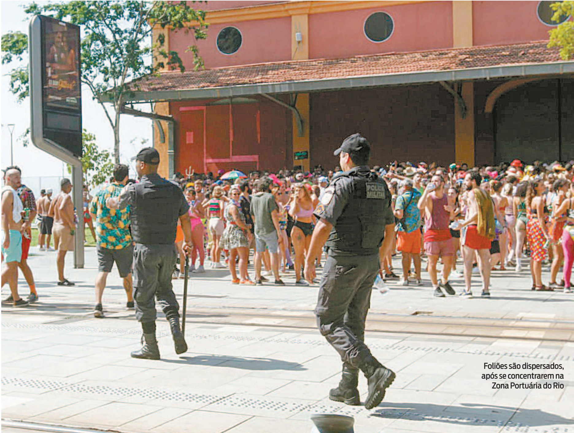
Foliões são dispersados, após se concentrarem na Zona Portuária do Rio

■ Um evento que reuniria blocos de rua, na Feira de São Cristóvão, Zona Norte, programado para ontem e hoje, não recebeu aval da Prefeitura do Rio para acontecer. Chamado de Encontro dos Blocos de Rua do Rio, a festa teve a sua solicitação indeferida pela Secretaria de Ordem Pública (Seop), que alegou questões de ordem pública, falta de licenciamento sanitário, não liberação do Corpo de Bombeiros e divergências em dados demandados pela CET-Rio. De acordo com a Seop, mesmo sem a autorização para que o evento acontecesse, os responsáveis iniciaram a venda de ingressos, com entradas de R$ 20 a R$ 120, com bebida liberada.