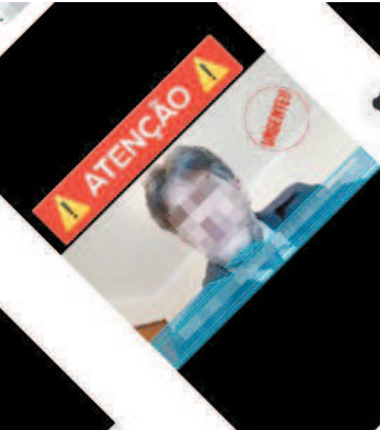
Comprova classifica o vídeo como enganoso