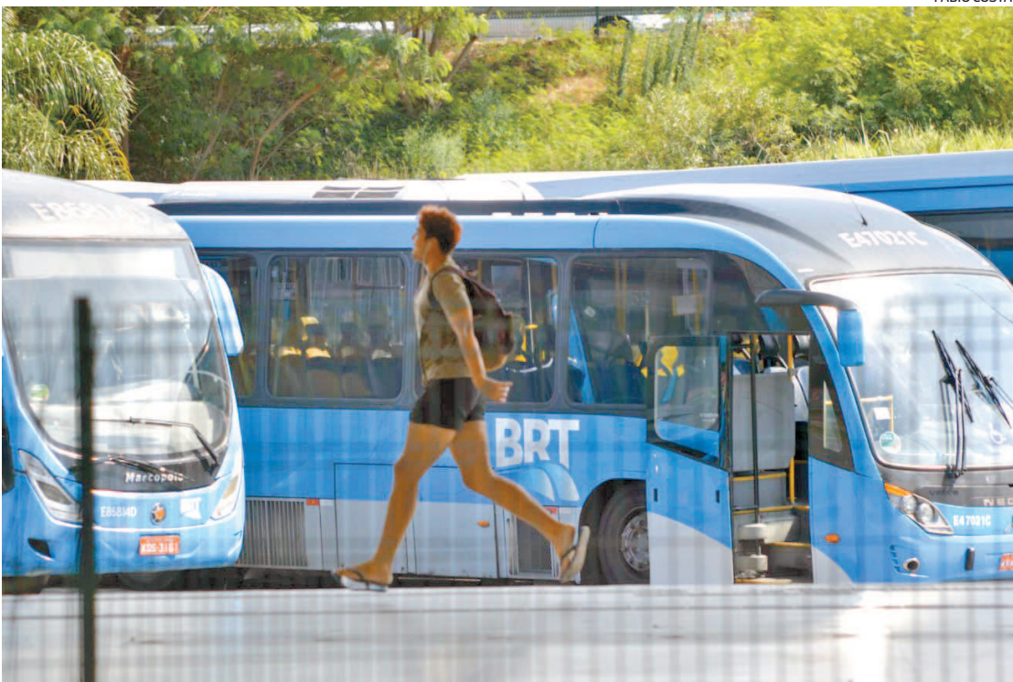
Enquanto Prefeitura e consórcio brigam na Justiça, paralisação prejudica trabalhadores

sempre se entende”. Paes escreveu ainda que “suspender a encampação por causa da paralisação é dar razão ao locaute feito por aqueles que destruíram o BRT”. Em entrevista à TV Globo, disse que a liminar “só vai gerar mais confusão”: “Todos os funcionários do consórcio BRT foram demitidos. Os direitos trabalhistas dos funcionários foram pagos pela prefeitura, e todos eles estão contratados pela Mobi-Rio. Esses funcionários que acabaram de entrar e receberam rescisão, de repente paralisam tudo. É claro que tem coisa por trás, e não estou dizendo que todos os funcionários estão envolvidos”.