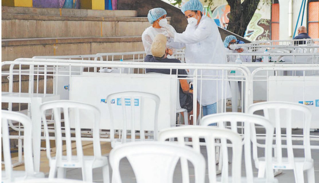
Centro montado no CIEP Nação Rubro Negra, no Leblon, já chegou a testar 1.806 positivos em um dia

A Secretaria Municipal de Saúde (SMS) informou que a vacinação para crianças na capital será retomada na segunda-feira. Segundo o chefe da pasta, Daniel Soranz, ontem mesmo a cidade do Rio receberia o envio de Rio 33.510 doses do imunizante Pfizer ped e 76 mil de Coronavac. A busca ativa também será retomada. Soranz anunciou que a SMS decidiu fechar o centro de testagem do Leblon. O local, que chegou a testar 4.702 pessoas em um dia, com 1.806 positivos, realizou na quinta 236 exames, com 22 positivos. De acordo com o painel de monitoramento da Prefeitura do Rio, mais de 6 milhões de pessoas já foram vacinadas contra a covid-19 com pelo menos uma dose na capital e 5,4 milhões com a segunda. Mais de 2 milhões já foram imunizadas com a dose de reforço e 152 mil com a dose única. Entre 1º de janeiro e 18 de fevereiro, o sistema registrou 892 óbitos por covid na capital e 2,7 mil casos graves da doença. Hoje, a cidade