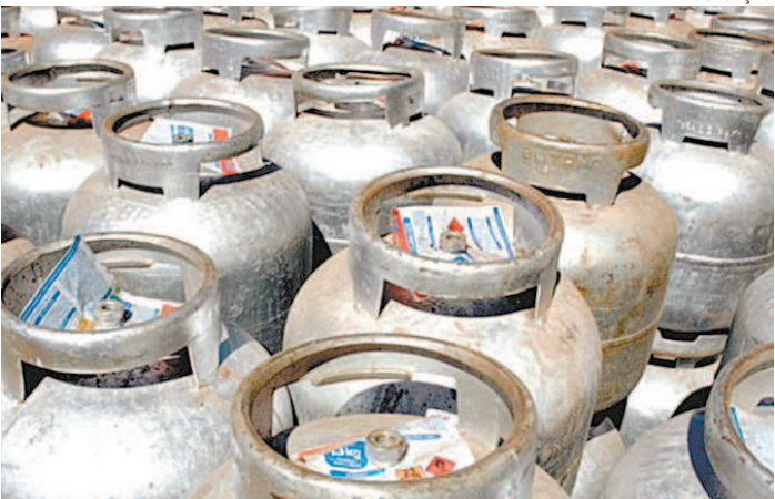
União com empresas viabilizará programa de GLP

ao longo deste ano, nas cinco regiões do país. Serão beneficiadas mais de 1 milhão de pessoas, com até cinco entregas por família. “Cada um dos atores agrega suas características e recursos que são capazes de tirar do papel tudo aquilo que pretendemos fazer. É um ganho de escala exponencial para fazer chegar, com oportunidade, o que é necessário a quem mais precisa”, afirmou o presidente da Petrobras, Joaquim Silva e Luna. As ações somam R$ 300 milhões e vão beneficiar mais de 4 milhões de pessoas, direta e indiretamente, até o fim deste ano. Elas envolvem a doação de auxílios para compra de gás de cozinha e de cestas básicas para famílias que vivem em comunidades no entorno das unidades operacionais, em conjunto com instituições parceiras da companhia em projetos socioambientais; a entrega de auxílios para aquisição de GLP para famílias beneficiadas pela campanha solidária ‘Brasileiros pelo Brasil’, por meio de parceria entre a Petrobras e a Fundação Banco do Brasil; e a doação para a compra do gás de cozinha para instituição sem fins lucrativos que fornece alimentação para pessoas em situação de rua.