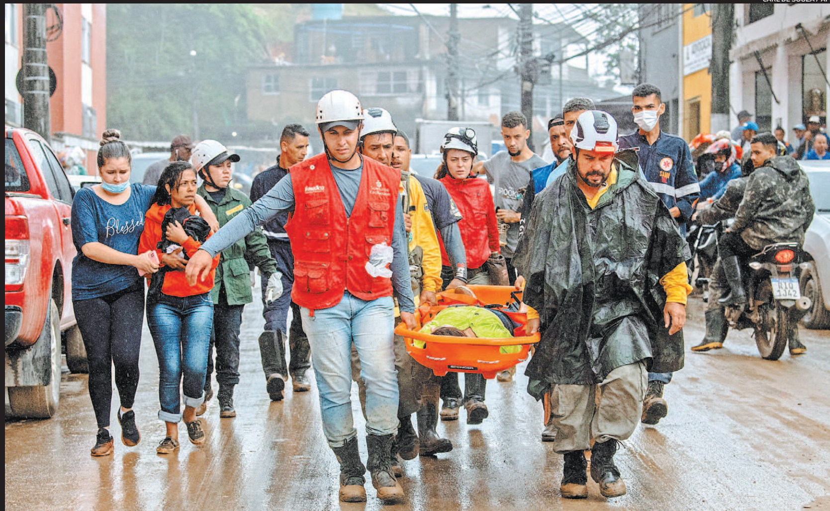
Equipe de resgate transporta na maca uma pessoa encontrada em meio a escombros após deslizamento de terra causado pela forte chuva na região

CHUVAS: BOMBEIROS ALERTAM PARA O RISCO DE MAIS DESLIZAMENTOS