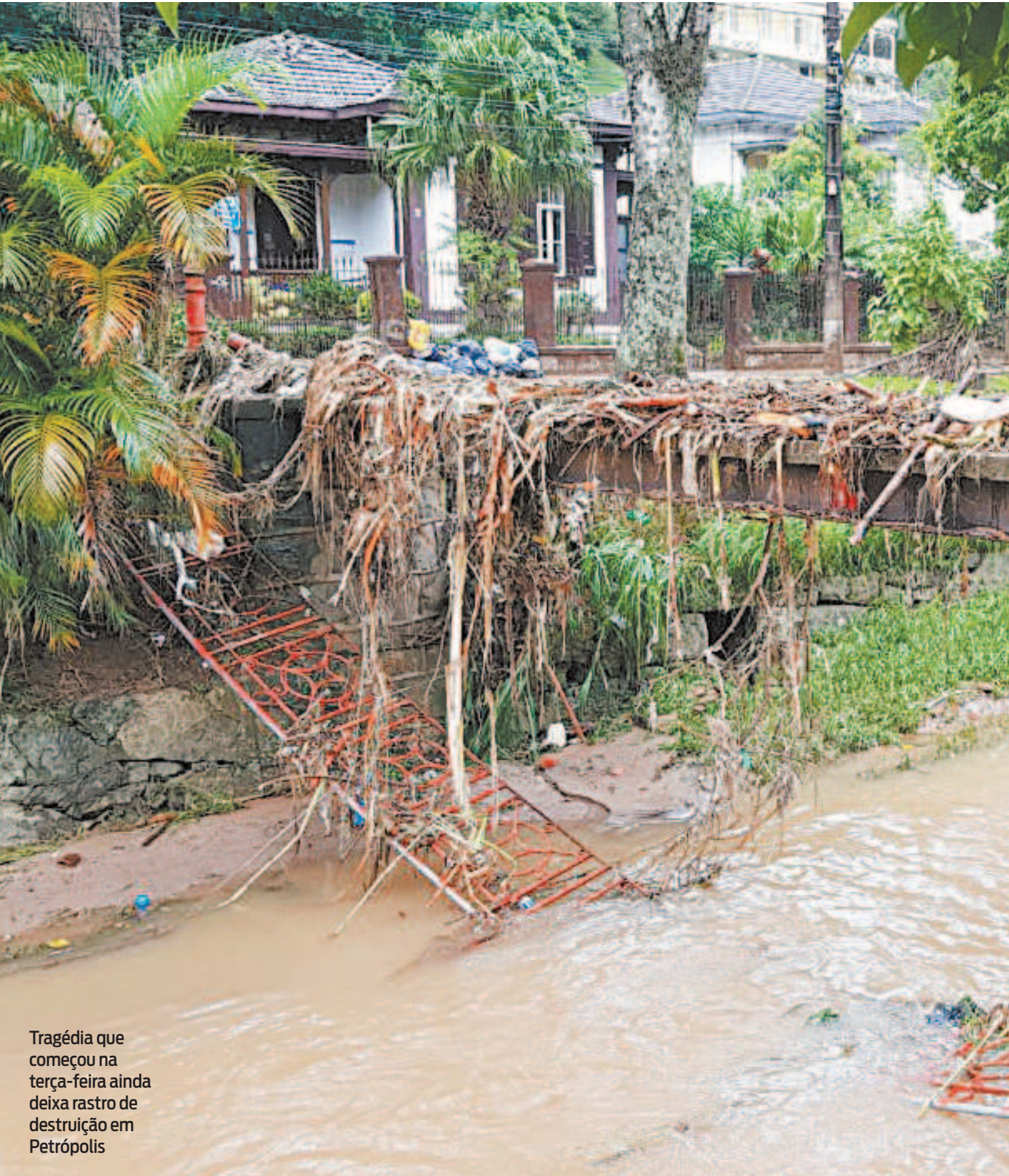
Tragédia que começou na terça-feira ainda deixa rastro de destruição em Petrópolis

Corpo de Bombeiros precisou interromper os trabalhos pelo menos duas vezes desde o fim da tarde de quinta-feira, quando voltou a chover na região