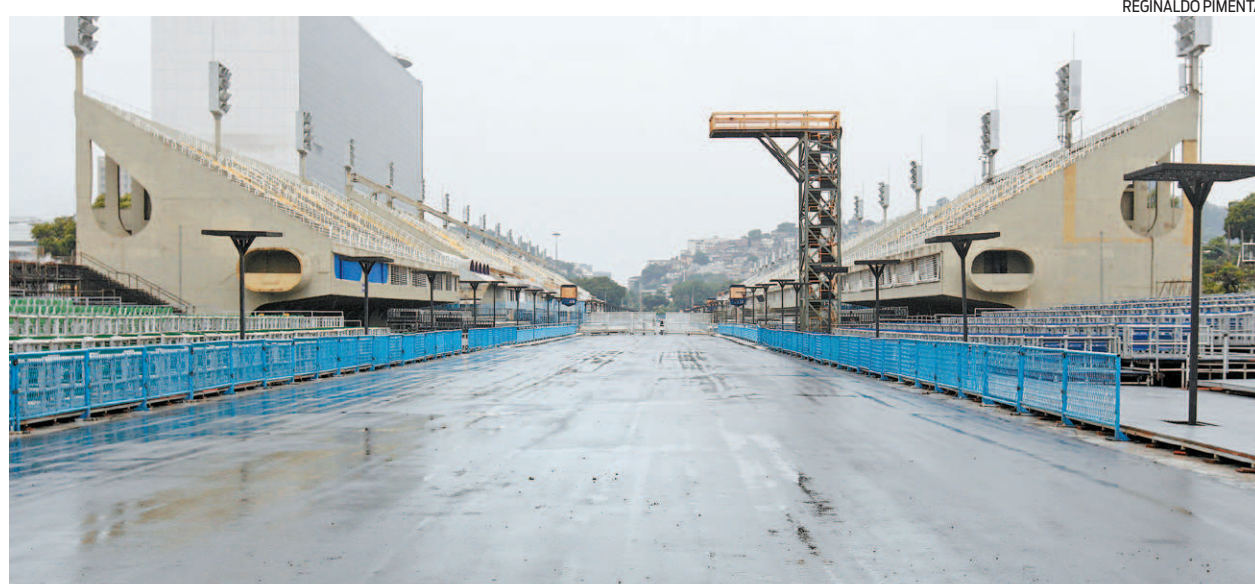
Restauração do Sambódromo inclui novo sistema de drenagem e iluminação ‘cênica’: um teste será feito no dia 24

VEJA OS DIAS DOS ENSAIOS TÉCNICOS DAS ESCOLAS