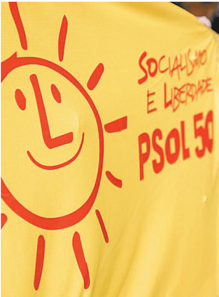
Nova Executiva Municipal do PSOL traz mudanças no partido

pagou a parcela única de R$ 500 a 3.918 pessoas. Para quem ainda não procurou a prefeitura, é preciso fazer o registro no site carioca. Os inscritos recebem uma mensagem de texto com as instruções para baixar um aplicativo — e poder receber o dindim.