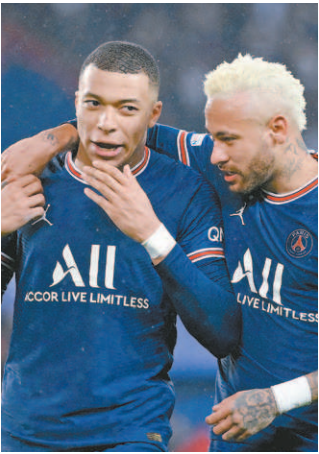
Neymar ao lado de Mbappé