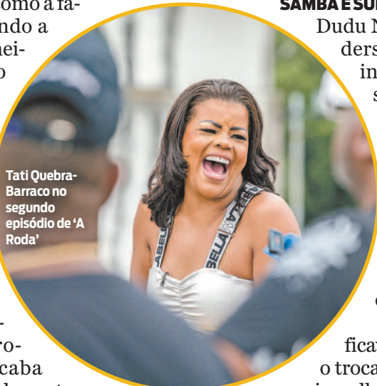
Tati Quebra-Barraco no segundo episódio de 'A Roda'