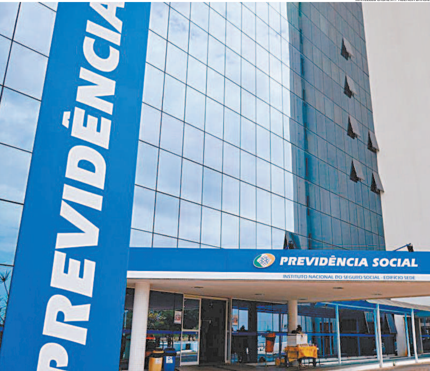
Este ano o INSS anunciou a possibilidade de conseguir o extrato de IR também pelo chat humanizado da Helô