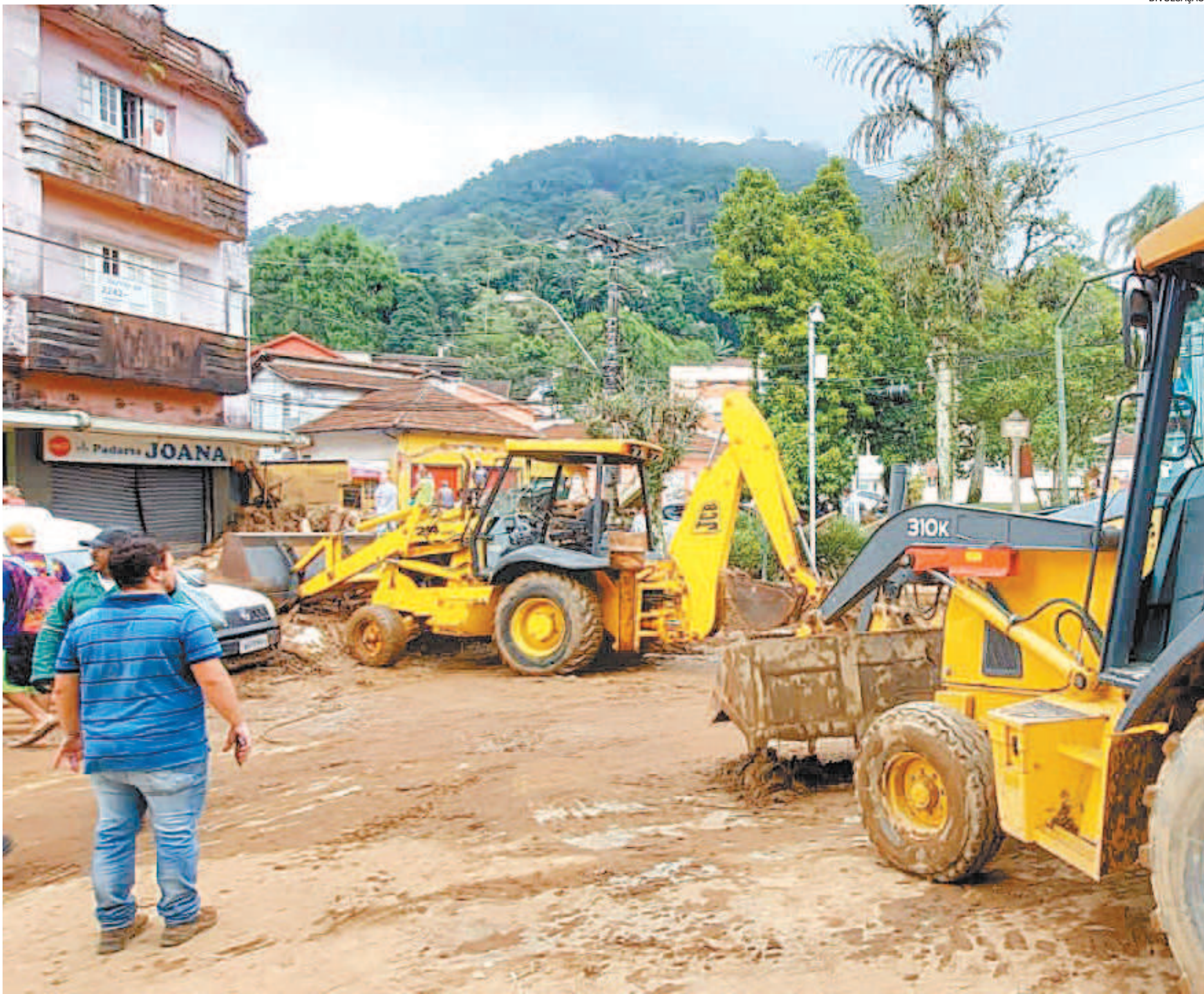
O Governo do Estado iniciou, desde as primeiras horas de ontem, o quarto dia da força-tarefa em Petrópolis, após tempestade que provocou calamidade pública

As linhas de crédito serão concedidas pela Agência de Fomento do Estado do Rio (AgeRio), terão taxa de juros zero e carência de até 12 meses. O financiamento será feito com recursos do Fundo de Recuperação Econômica dos Municípios Fluminenses (FREM-F). O governador sancionou ainda a Lei 9.566, que permite aos beneficiários do Programa Supera RJ que moram em Petrópolis a acumular outros auxílios dados pela prefeitura ou pela União.