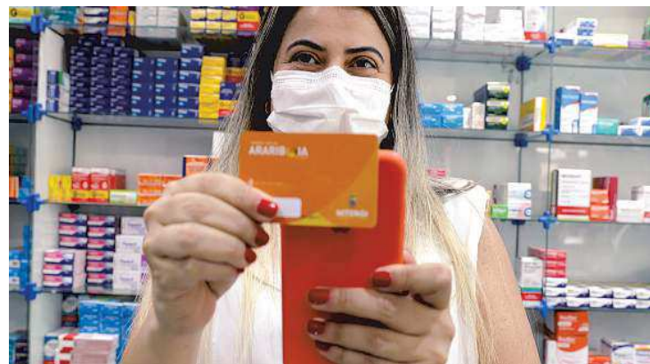
Clientes usam cartão para comprar remédios, leite em pó, fraldas e papel higiênico.