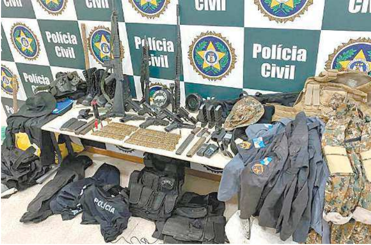
No ano passado 246 armas foram apreendidas após denúncias

drogas de variados tipos e apreender também 4,3 mil cigarros contrabandeados que estavam sendo comercializados. Já o programa Desaparecidos ajudou na localização de 67 pessoas que eram procuradas por suas famílias. O programa “Linha Verde” do órgão, canal destinado a receber informações sobre crimes ambientais, recebeu informações sobre extração irregular de árvores, desmatamento florestal