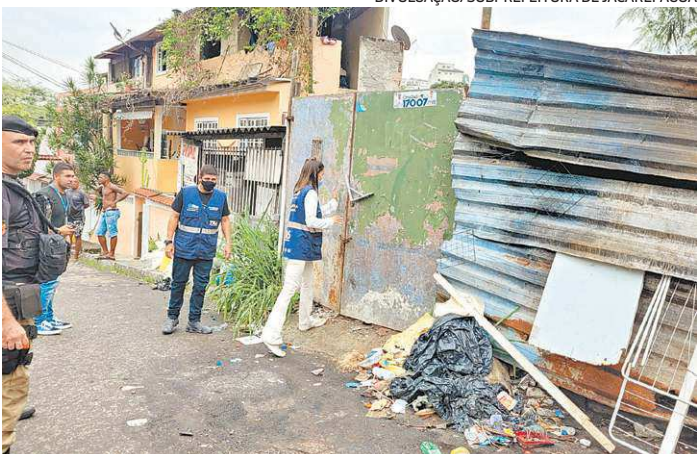
Foram derrubados um portão e depósito construídos na calçada

Os bombeiros já atenderam mais de 200 chamadas decorrentes da chuva, em 22 municípios. Nas regiões Norte e Noroeste, os rios Muriaé, Carangola, Itabapoana, Pombo e Paraíba do Sul transbordaram, afetando as cidades de Itaperuna, Italva, Natividade, Porciúncula, Bom Jesus do Itabapoana, Laje do Muriaé, Cambuci, Aperibé, Santo Antônio de Pádua e Cardoso Moreira.