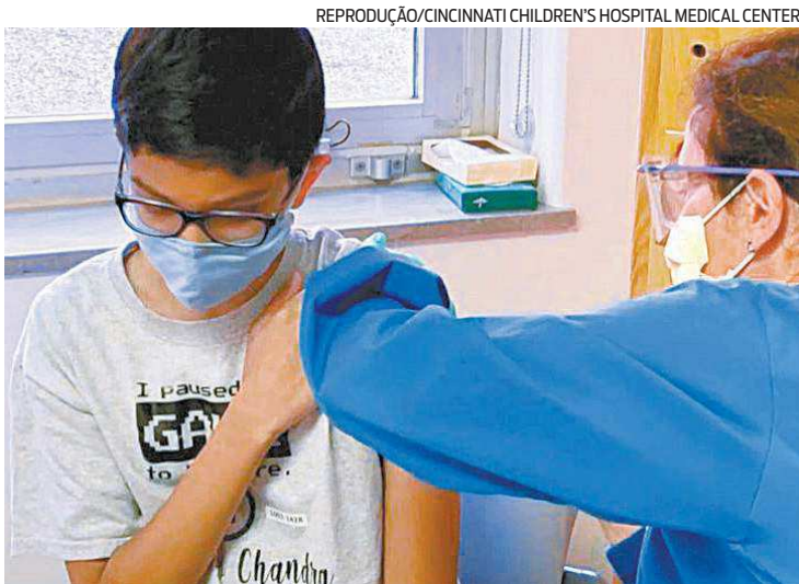
Procuradoria: vacinação infantil não é assunto para a confederação