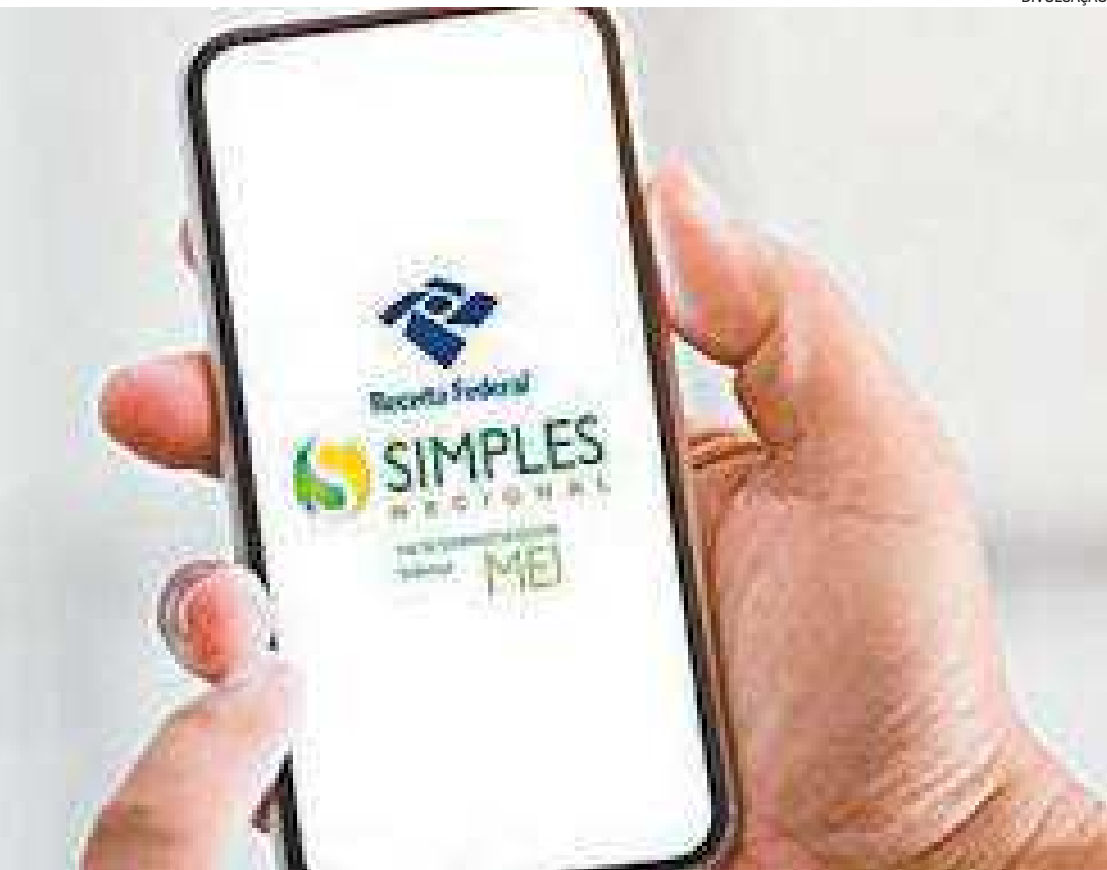
Para aderir, o MEI deve fazer o login no portal Regularize ou entrar com uma conta no portal do Governo

conta no portal do governo. No sistema de negociações, clicar no menu “Emissão de Documento”. Click na opção “Emitir Guia de Pagamento” - “Emitir DARF/DAS de parcela”. Nesse caso, precisa ser informado o CPF/CNPJ do contribuinte devedor e a conta de negociação — que pode ser encontrada no campo “Número de Referência” que aparece no Darf das parcelas e no recibo da transação. Orientação completa do serviço: https://www.gov.br/pgfn/pt-br/servico .