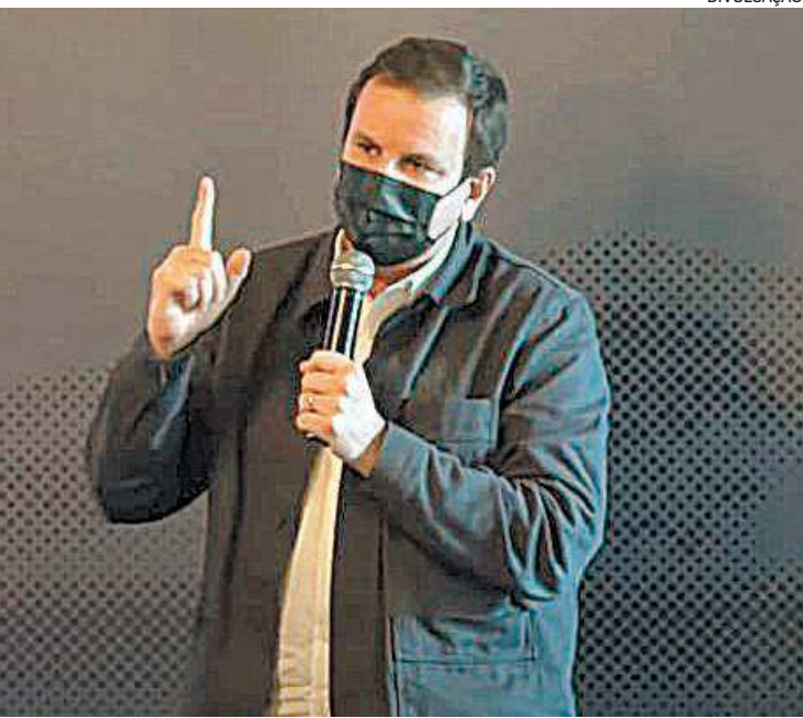
Prefeito Eduardo Paes sancionou lei ontem

O crime de injúria racial está previsto no Código Penal e prevê pena de um a três anos de reclusão. É considerado um delito qualquer ofensa que tenha como base elementos referentes à raça, cor, etnia, religião, idade ou deficiência de alguém. A violação é diferente dos crimes de racismo, que tem penalidade mais severa e pode chegar até a cinco anos de prisão.