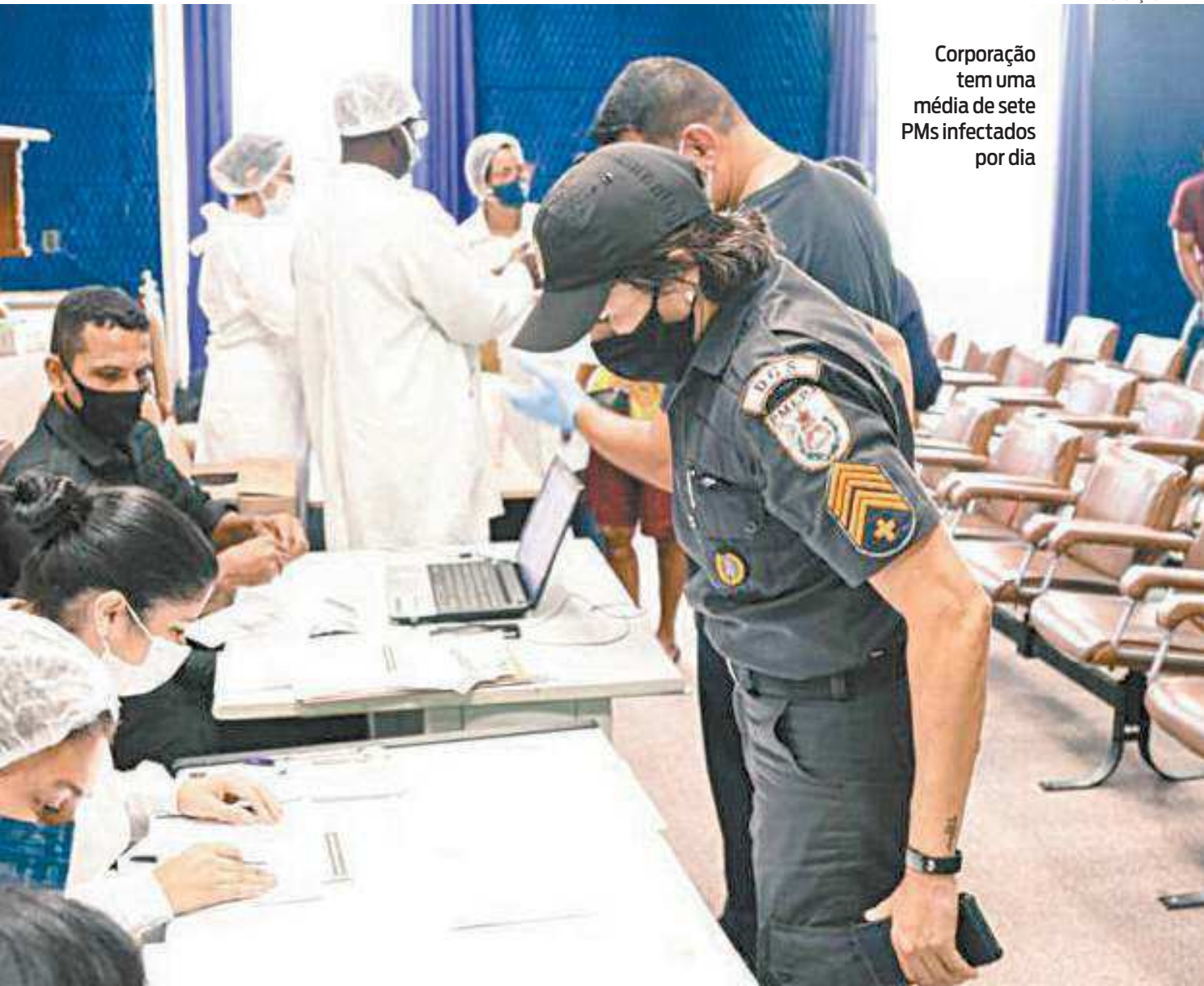
Corporação tem uma média de sete PMs infectados por dia