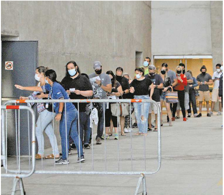
Fila no posto de vacinação na Cidade das Artes, na Barra da Tijuca