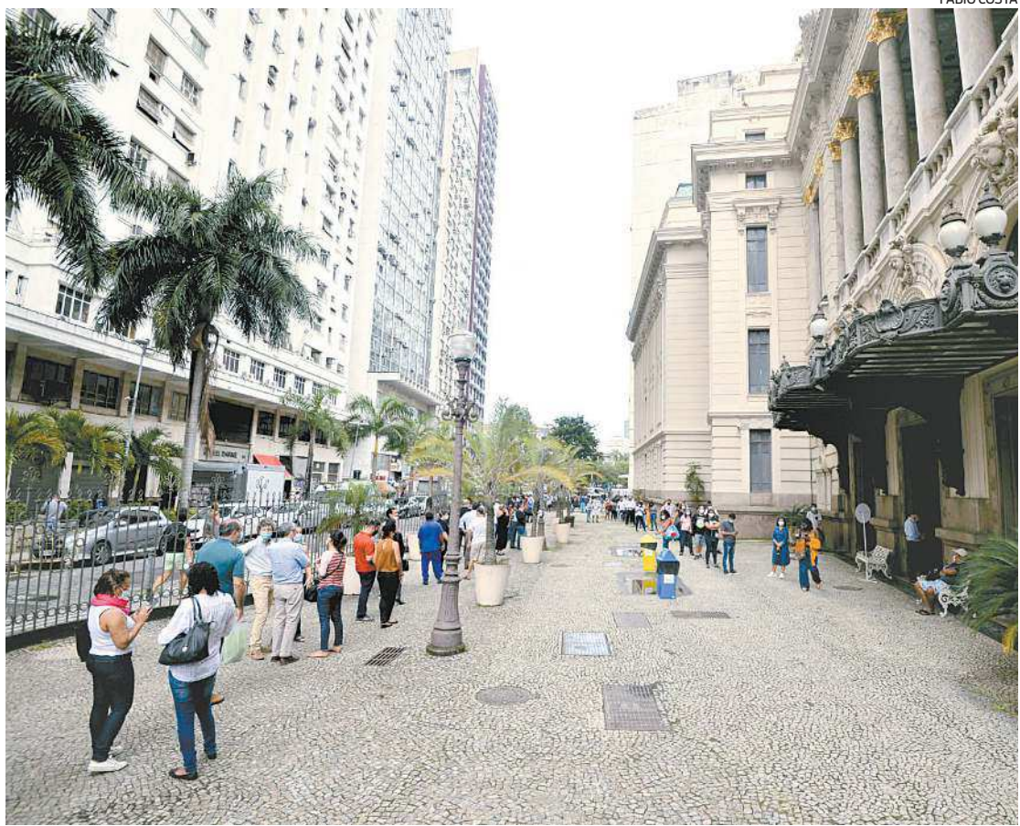
A movimentação no Centro do Rio mostra que grande parte dos cariocas aderiu à terceira dose

“Devemos nos vacinar não só por nós, mas também pelas pessoas que não podem vir. Acho fundamental que a gente faça esse esforço como sociedade, não só para nos