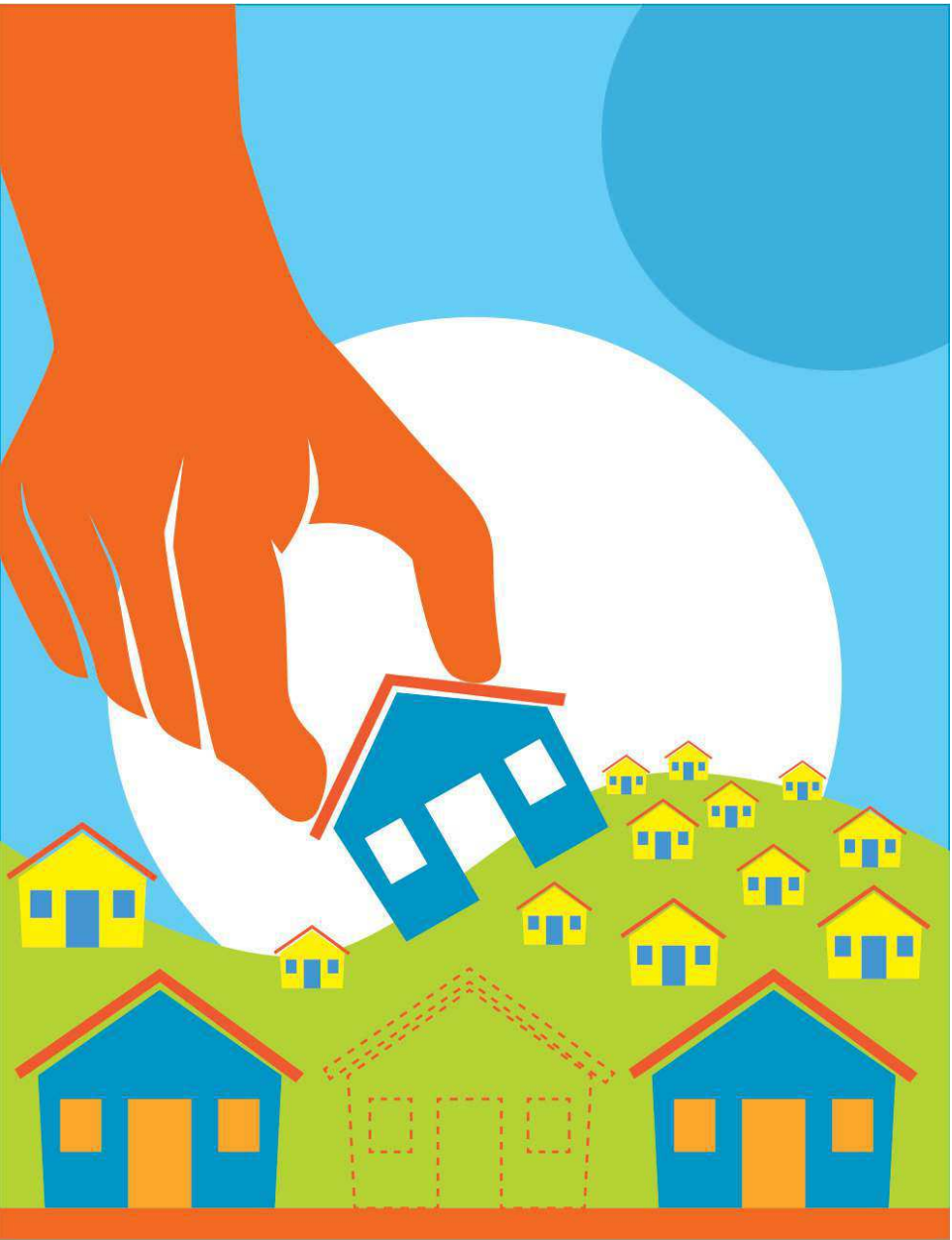
ARTE PAULO MÁRCIO

Para referendar as ações do grupo de trabalho, a SMH vai promover