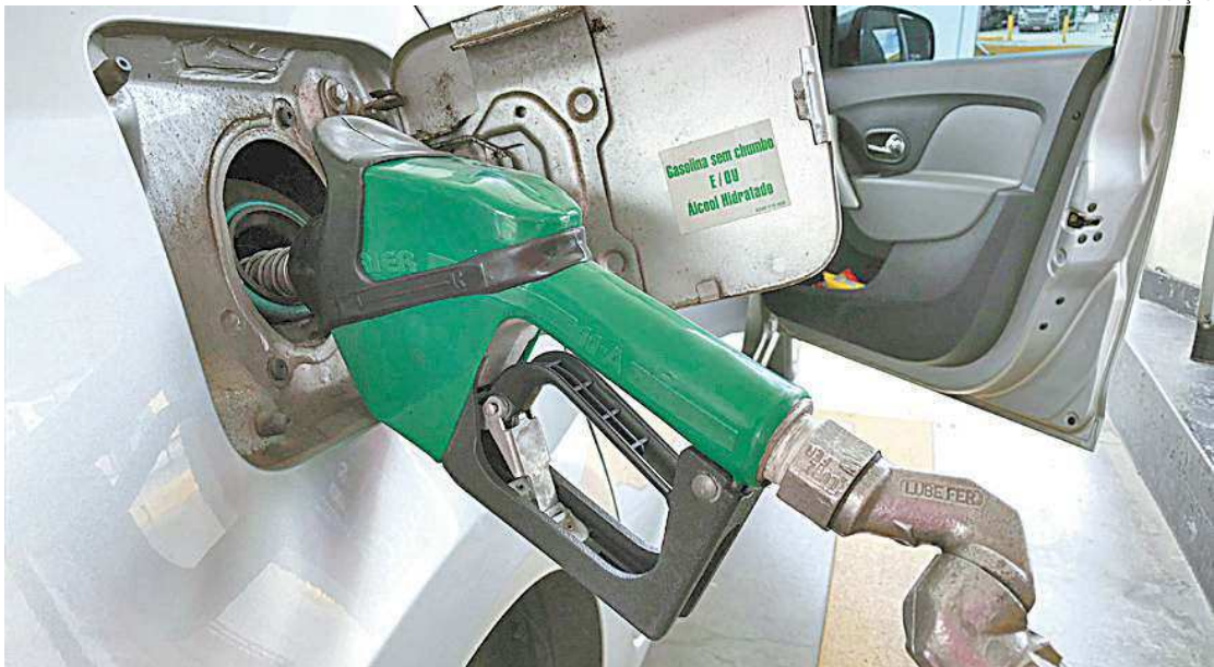
Ano novo começou com mais um aumento dos preços dos combustíveis que pesará para os motoristas

No caso do diesel, levando em conta a mistura obrigatória de 10% de biodiesel e 90% de diesel A para a composição do diesel comercializado nos postos, a parcela da Petrobras no preço ao consumidor passará de R$ 3,01, em média, para R$ 3,25 a cada litro vendido na bomba. Uma variação de R$ 0,24 por litro. Em nota, a estatal informou que o último aumento ocorreu 77 dias atrás, no dia 26 de outubro de 2021 e, desde então os preços praticados pela Petrobras para a gasolina foram reduzidos em R$ 0,10 litro em 15 de dezembro 2021. Foi a primeira queda desde 12 de junho. No caso do diesel, os valores permaneceram estáveis. “Esses ajustes são importantes para garantir que o mercado siga sendo suprido em bases econômicas e sem riscos de desabastecimento