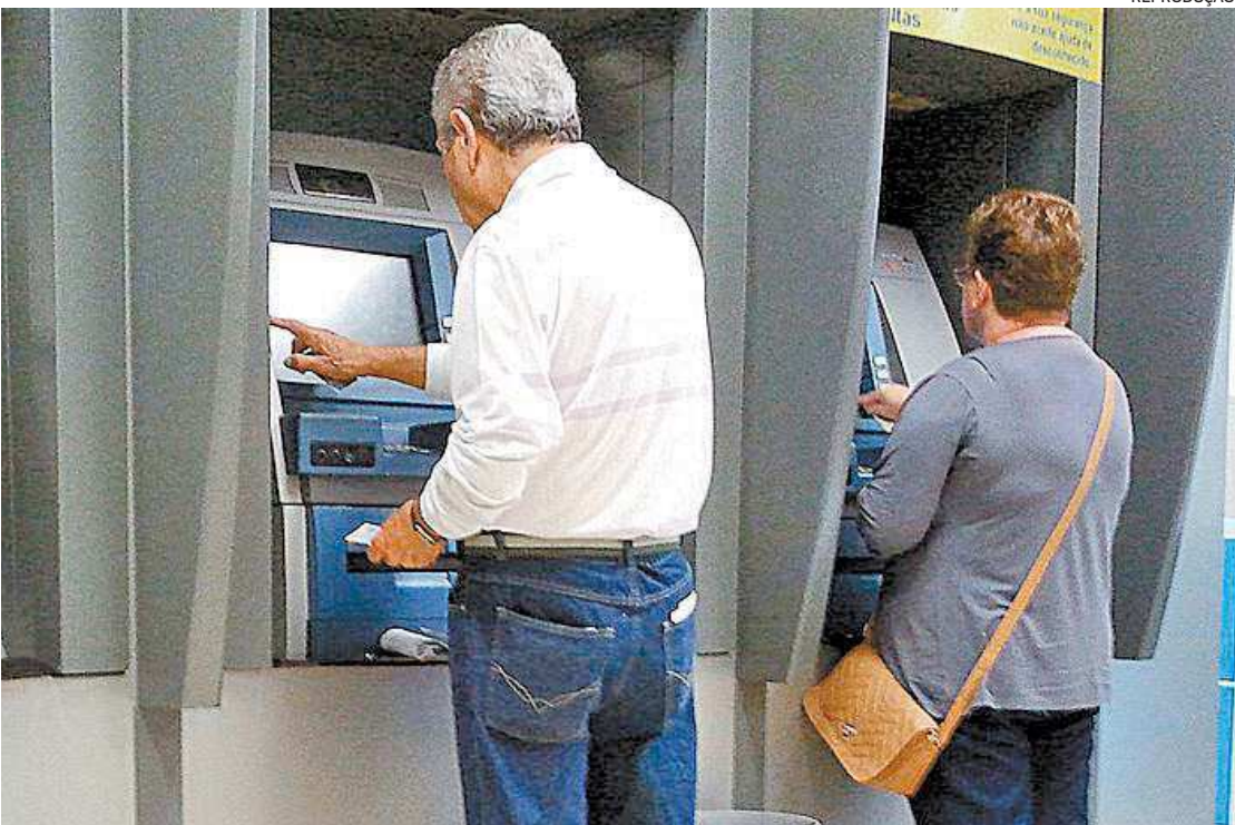
Bandidos ligam para os aposentados argumentando que eles terias direito a receber atrasados

ta aplicada é a da falsa revisão de benefício. Nesse tipo de golpe, os estelionatários abordam os segurados e afirmam que teriam direito a receber valores referentes a uma falsa revisão de benefícios concedidos em governos anteriores. Também é solicitada a transferência de dinheiro para outra conta para a revisão fraudulenta. O órgão adverte que todas as revisões de benefícios são baseadas na legislação e os segurados não precisam fazer nenhum pagamento para ter direito. Outra prática fraudulenta aplicada para iludir os aposentados do INSS é a da falsa revisão de benefício O INSS também recomenda que os segurados não forneça dados pessoais, além de observar o remete das mensagens, não clicar em links de e-mails ou mensagens de WhatsApp de remetentes que o segurado não conheça e não compartilhar nada nas redes sociais sem checar a procedência e a veracidade das informações.