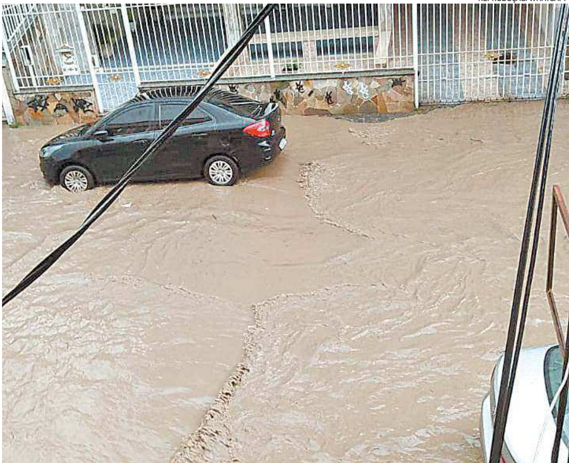
Alagamento na Rua Antonio Braune, na Penha. Outros bairros afetados: Vila Isabel e Engenho Novo

vão, Saúde, Piedade, Irajá, Ilha do Governador, Jardim Botânico e Madureira. Parte do muro do Cemitério do Cacuia, na Ilha do Governador, desabou. Em vídeos compartilhados nas redes sociais, é possível ver que jazigos ficaram destruídos e algumas ossadas espalhadas pela calçada. Diversos bolsões d’água e alagamentos foram registra-