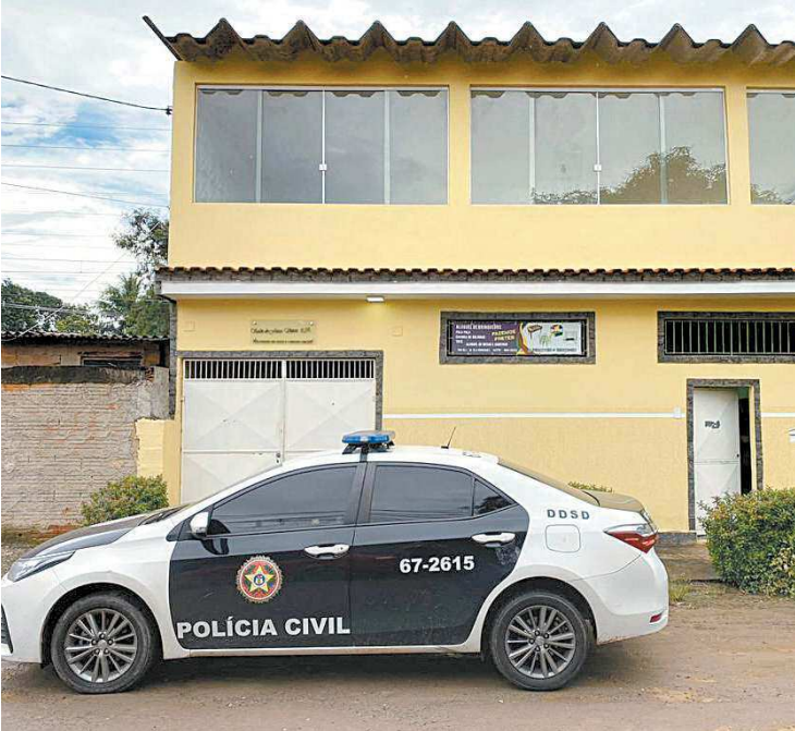
Agentes de departamentos especializados participaram da ação

homens. Um dos suspeitos estava com mandado de prisão pendente por associação criminosa e os agentes acreditam que ele seria responsável por cometer extorsões contra comerciantes. O outro preso é um ex-traficante que aderiu à milícia. Em Queimados e Nova Iguaçu, na Baixada Fluminense, os agentes da Delegacia de Defesa dos Serviços Delegados (DDSD) capturaram sete pessoas e interditaram estabelecimentos de venda irregular de gás e provedores clandestinos de internet. Também em Nova Iguaçu, agentes da Polinter (Serviço de Polícia Interestadual) prendeu um miliciano foragido.