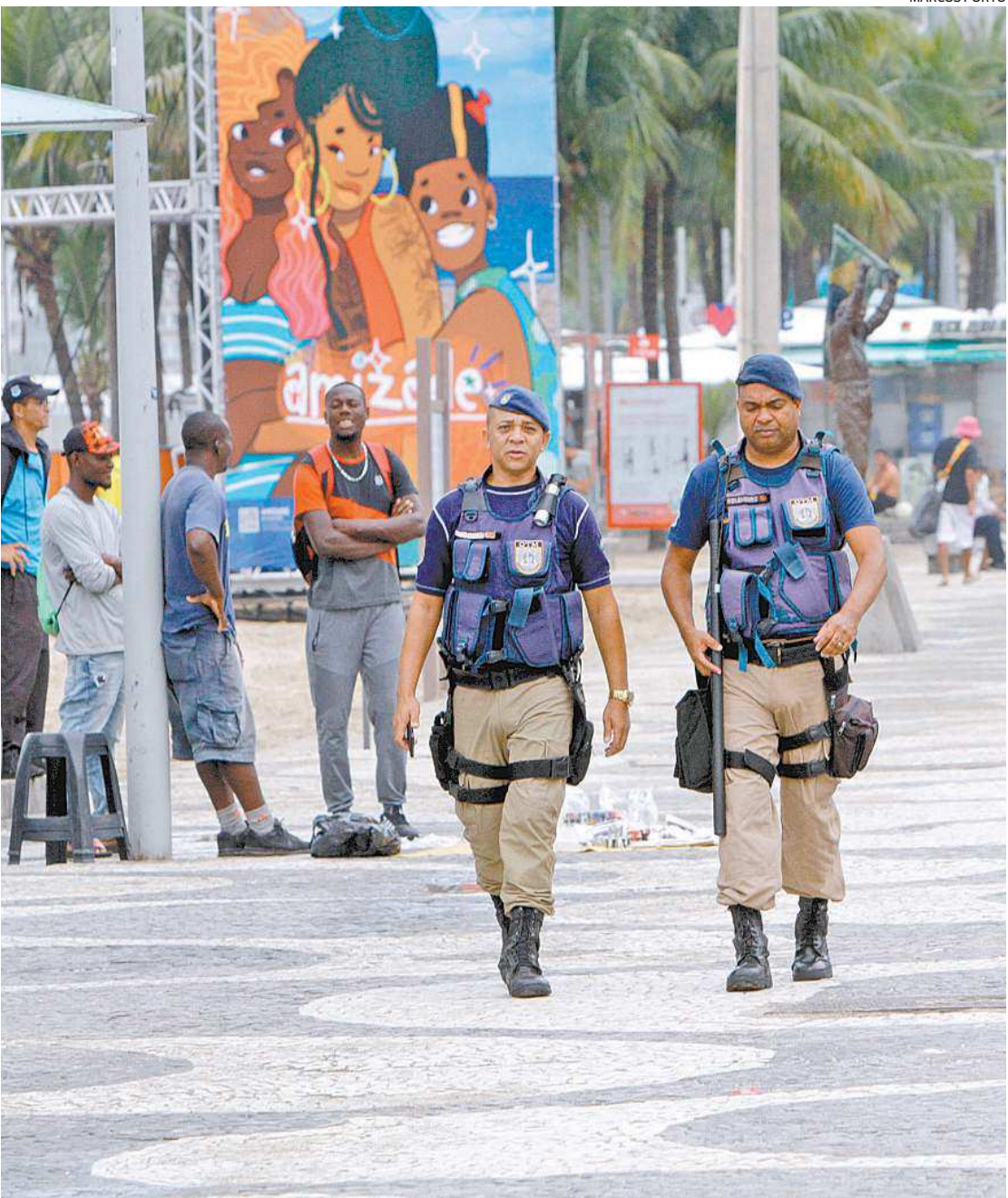
Tempo chuvoso e aumento de casos de covid-19 desaceleram turismo que tentava se reerguer no Rio