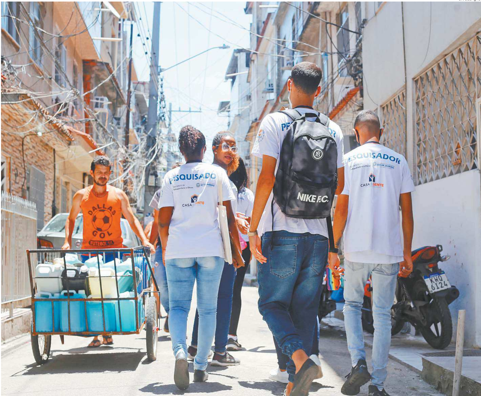
Na Régua: pesquisadores do programa percorrem comunidades da capital e da Baixada Fluminense para identificar as moradias que serão reformadas