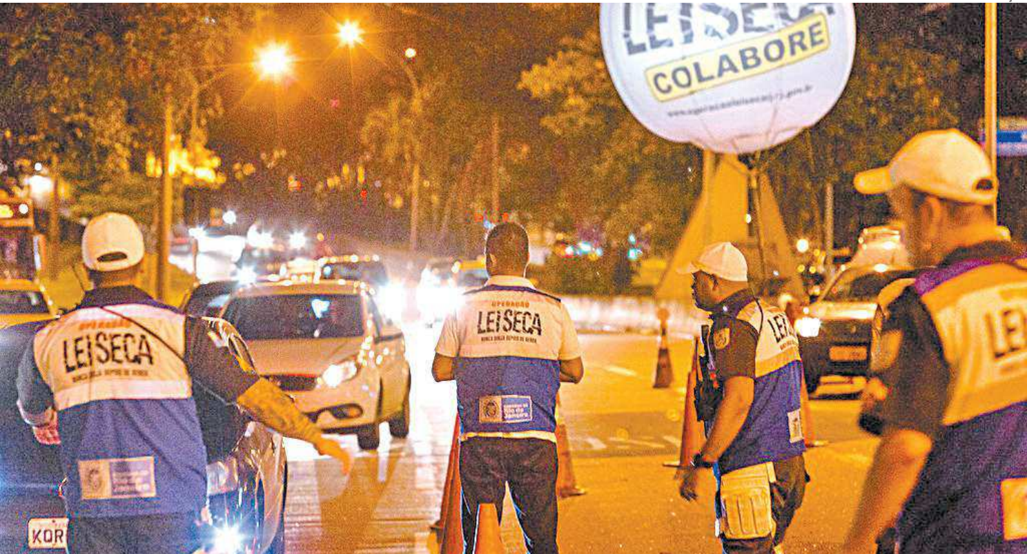
Programa da Operação Lei Seca, que atua diariamente, tem sua operação intensificada em períodos de festas e feriados