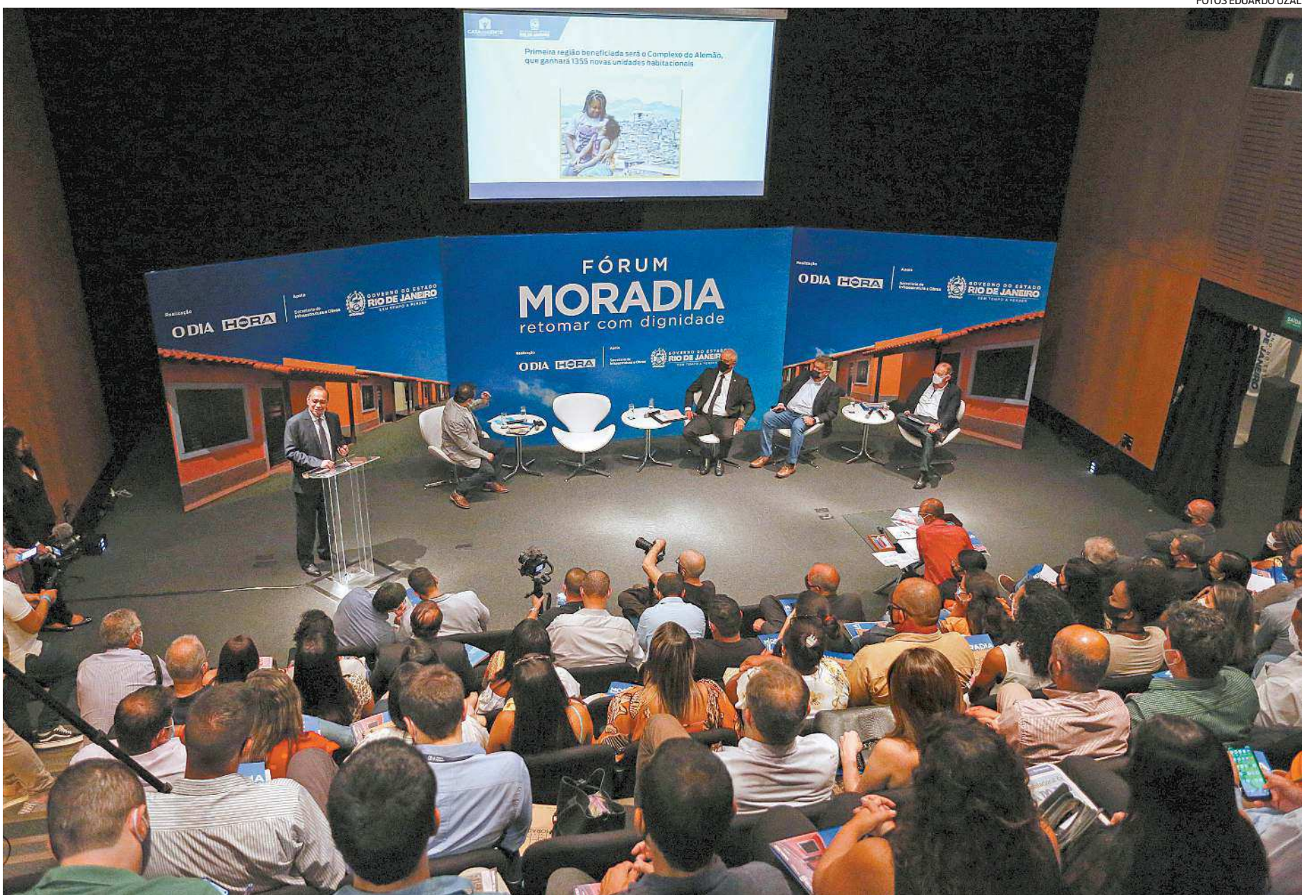
O Fórum Moradia reuniu autoridades, acadêmicos, técnicos e representantes da sociedade civil no debate em busca de soluções para o crônico problema no país

“Não se trata só de um projeto que executa obras, mas que discute com as famílias as melhorias” CLÁUDIO CASTRO, governador do Rio de Janeiro