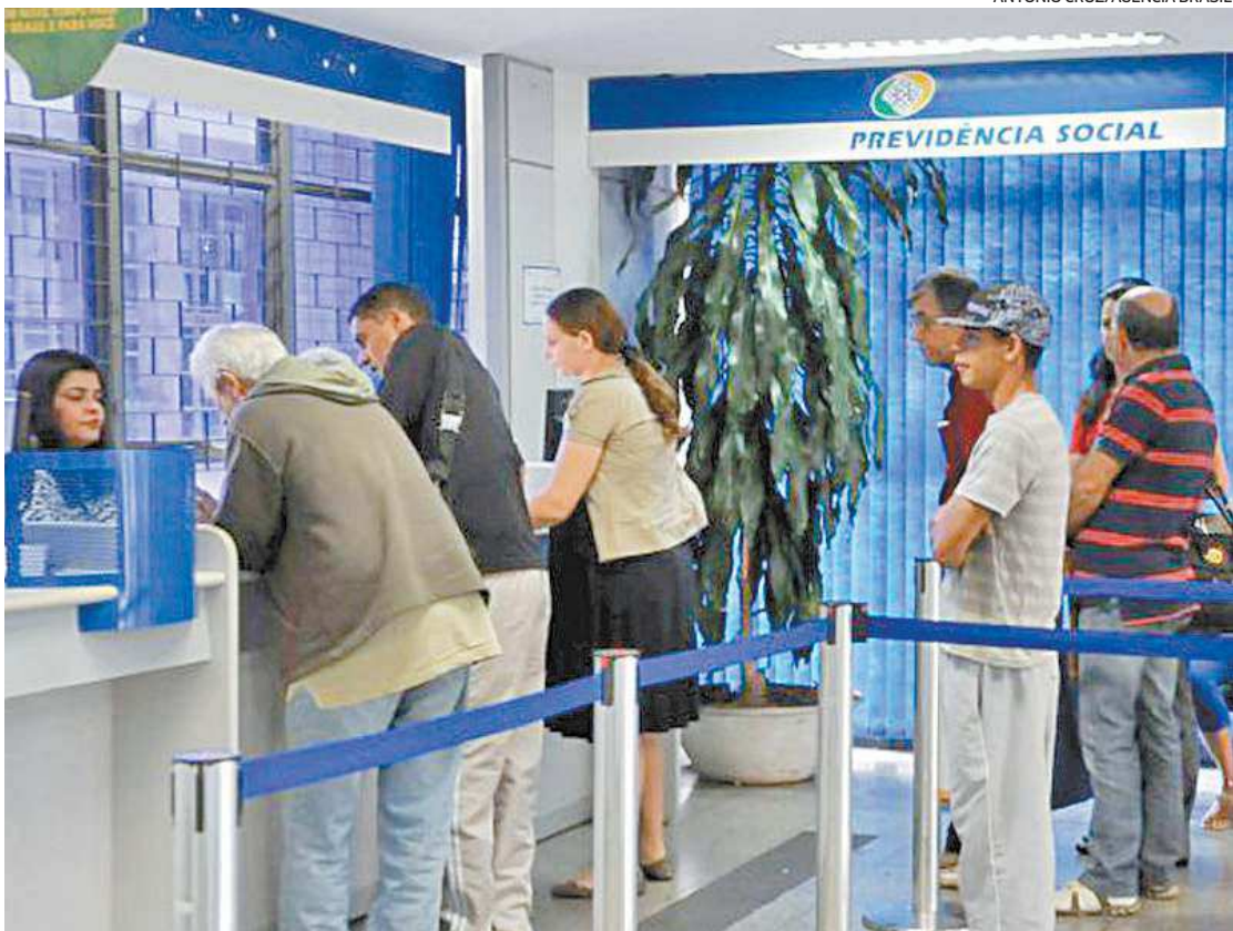
INSS prorrogou a suspensão do bloqueio de aposentadorias pela falta da realização da prova de vida

O Instituto Nacional do Seguro Social (INSS) decidiu prorrogar mais uma vez a suspensão do bloqueio de aposentadorias pela falta da realização da prova de vida. Ontem, foi publicada uma portaria no Diário Oficial da União que estende os prazos do procedimento até julho do próximo ano. Além disso, o texto também traz o calendário que define as datas para os beneficiários que não realizaram o procedimento desde o ano de 2020. Dessa forma, a portaria define que o segurado do INSS só terá o benefício suspenso a partir de julho de 2022, caso não realize a prova de vida no mês de aniversário do titular do benefício. O documento também autoriza as instituições financeiras responsáveis pelo pagamento a realizar a prova de vida no mês anterior ao mês de aniversário do titular do benefício. Os titulares de benefícios cujo vencimento da última comprovação de vida for até