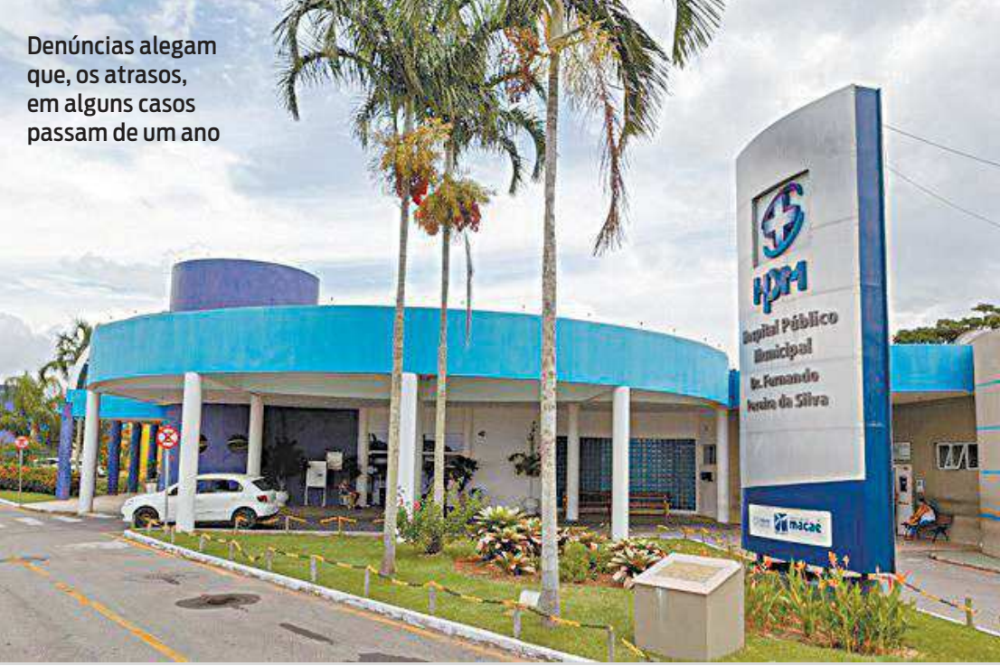
Denúncias alegam que, os atrasos, em alguns casos passam de um ano

Em um cenário instável com a chegada da Ômicron da Covid-19, o município de Macaé, que já possui dois casos em investigação da nova variante, passa por um momento delicado no setor da Saúde. A redação do jornal O DIA recebeu denúncias de que serviços essenciais podem ser suspensos a qualquer momento por falta de pagamento da Prefeitura aos fornecedores, prejudicando diretamente a população que depende da Saúde Pública para ser amparada. Ainda de acordo com a denúncia, o entrave para os atrasos e a não realização de pagamentos das empresas prestadoras de serviços emergenciais da saúde na cidade, não se dá por falta de recursos, e sim, pela lentidão na burocracia, proveniente da má administração. Denúncias alegam que, os atrasos, em alguns casos passam de um ano, se transformam em uma bola de neve, uma vez que as empresas fornecedoras também não conseguem manter os pagamentos