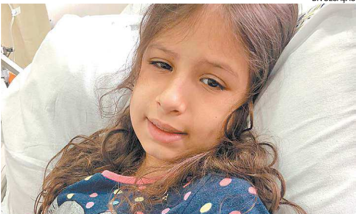
Criança foi socorrida e levada a um hospital particular da região