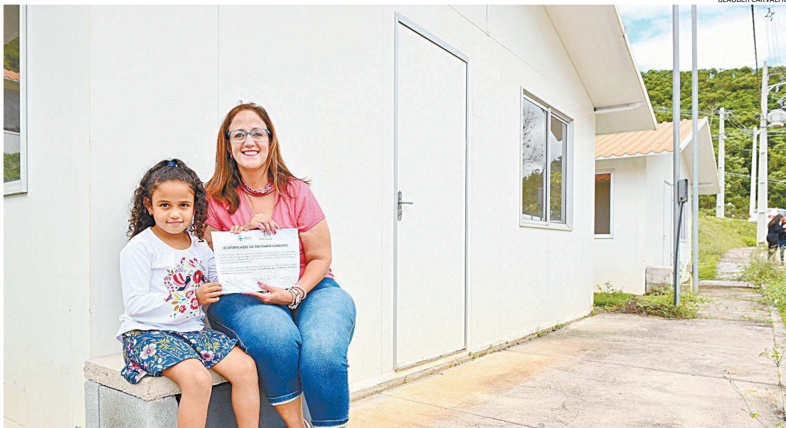
Após uma longa espera, o sonho da casa própria se torna uma realidade para muitas famílias em Areal, na Região Serrana do Rio

As intervenções incluem drenagem e pavimentação da via de acesso, com extensão de 800m; contenção de encostas; construção de Estação de Tratamento de Esgoto (ETE); e implementação de dois reservatórios de 100 metros cúbicos de água, cada.