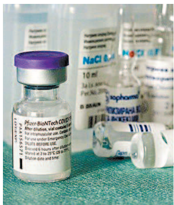
Mais lotes chegam até dezembro

A pesquisa visitou 2.774 unidades do bairro, das quais 1.552 eram domicílios particulares permanentes.