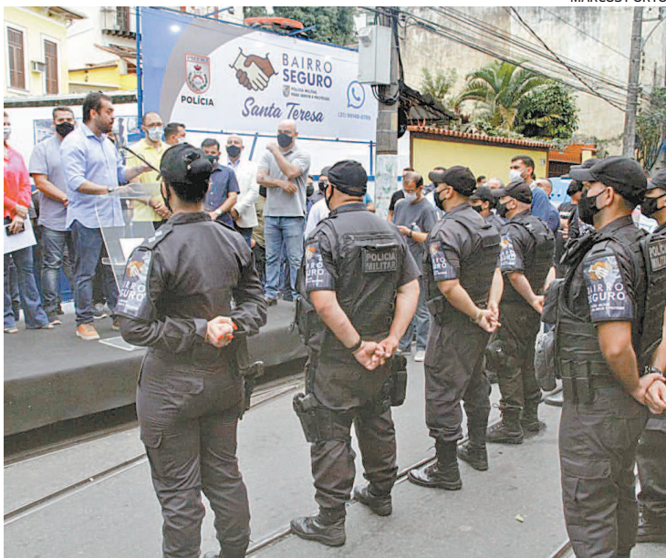
Operação possui 30 agentes, cinco viaturas e três bases fixas

Conhecido como um bairro histórico e boêmio, com ruas de paralelepípedo, bondinho e grande circulação de turistas, Santa Teresa acaba de receber reforço na segurança. Ontem, o Governo do Estado inaugurou o programa Bairro Seguro na região. A localidade é a 30ª em todo o estado a receber o esquema especial de patrulhamento. O governador Cláudio Castro participou da cerimônia de inauguração. “Programas como o Bairro Seguro têm ajudado a diminuir sensivelmente as manchas criminais onde atuam. Isso auxilia não só a população, como o comércio e os empreendedores da localidade. São estes homens e mulheres que têm trabalhado duramente para que a sensação de segurança aumente em todo o estado, o que fomenta o crescimento econômico”, afirmou o governador. O patrulhamento do bairro