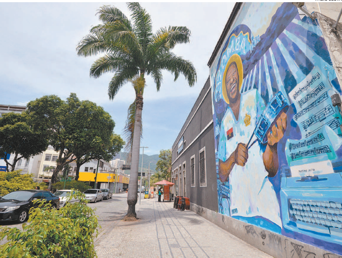
Pintura tem pouco mais de 11 metros de altura por seis metros de largura e características do sambista