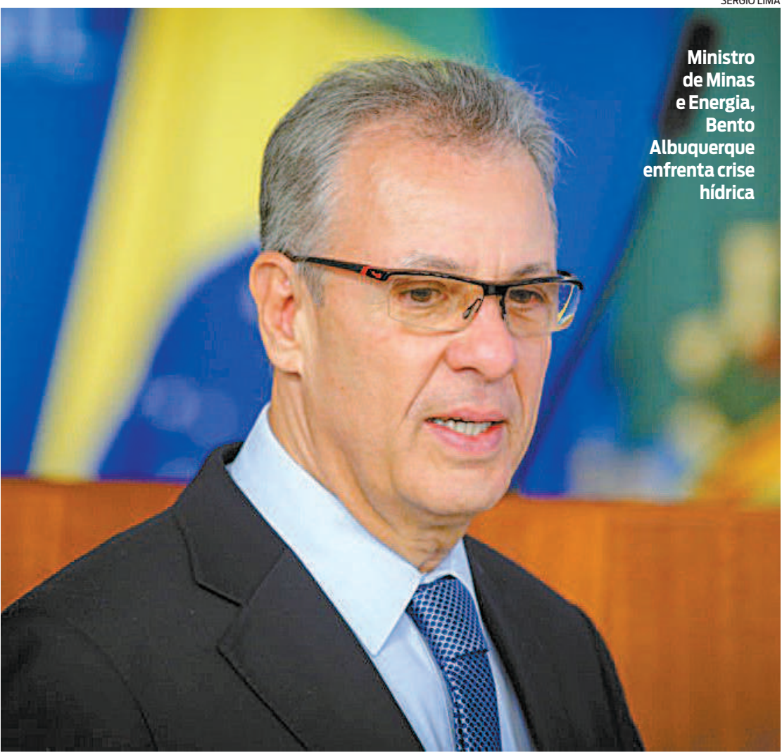
Ministro de Minas e Energia, Bento Albuquerque enfrenta crise hídrica