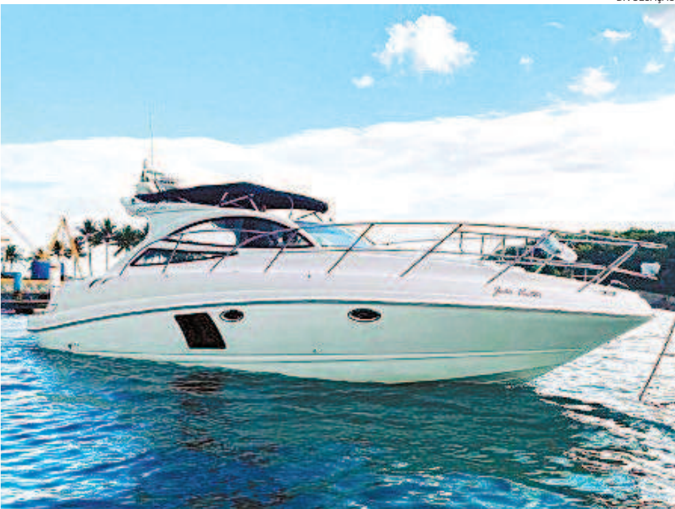
Lancha apreendida com criminosos pode virar um bem revertido para a polícia

A investigação patrimonial e financeira é focada na parte dos ativos que são gerados na atividade criminosa FLÁVIO PORTO, delegado