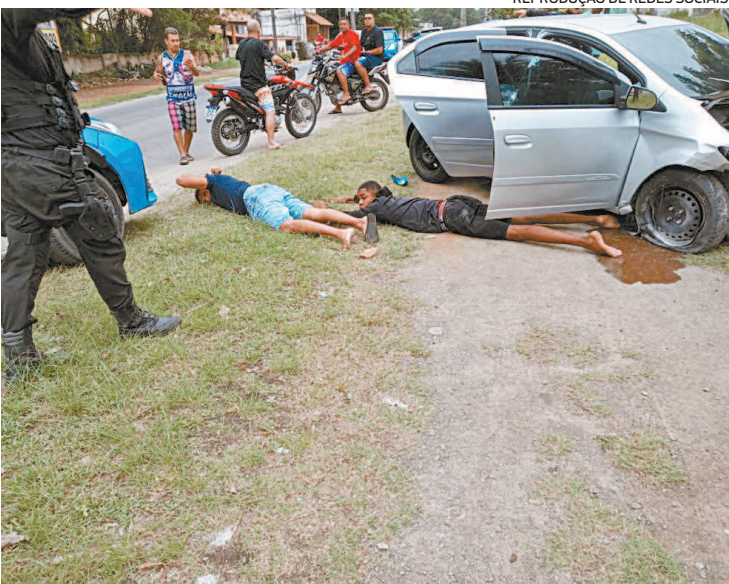
Dois assaltantes ainda foram baleados; outro se rendeu e foi preso

dos assaltantes, que estava no banco do passageiro, abre a porta e se joga no chão com as mãos para o alto, deitando-se próximo à lateral esquerda do veículo. Na ação, foram apreendidos um revólver calibre 38, com seis munições, uma arma falsa, celulares e bonecas. O caso foi registrado na 35ª DP (Campo Grande). Procurada, as Lojas Americanas ainda não se pronunciaram sobre o caso.