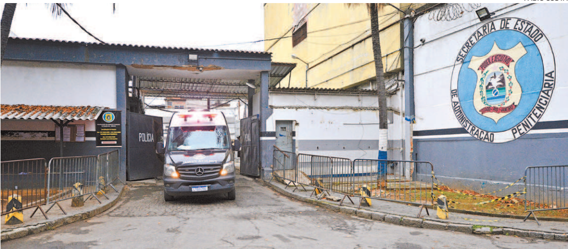
Crime ocorreu no presídio José Frederico Marques. Agente feminina alertou a direção da unidade

O homem, que não teve a identidade revelada, foi autuado em flagrante pelo crime de estupro, com pena de 6 a 10 anos de prisão. Segundo a Seap, uma policial penal feminina, que estava no plantão da mesma unidade, soube do ocorrido e