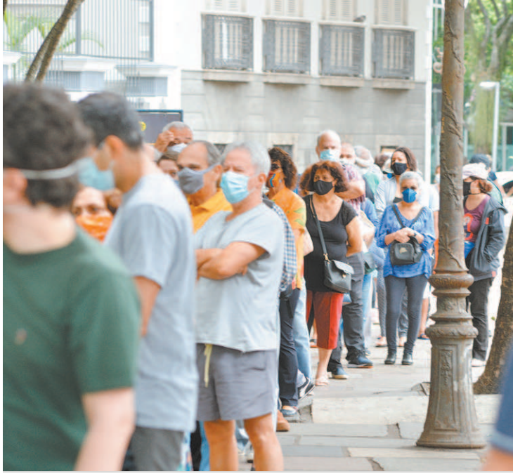
Vacinação na cidade do Rio agora se concentra na dose de reforço

O calendário de vacinação contra a covid-19 na cidade do Rio continua hoje, apesar do feriadão. Segundo a Secretaria Municipal de Saúde (SMS), idosos de 71 anos ou mais vão receber a dose de reforço nesta véspera de feriado. Amanhã, feriado nacional de Nossa Senhora Aparecida, não haverá vacinação. A imunização contra a covid-19 no município retorna normalmente na quarta-feira, com dose de reforço para idosos de 70 anos ou mais, além de profissionais de saúde que tomaram a segunda dose em fevereiro. De acordo com informações da SMS, as pessoas com segunda dose agendada