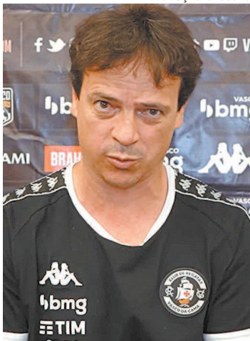
Diniz: descuido no contra-ataque

No último sábado, o Vasco foi derrotado por 1 a 0 para o Sampaio Corrêa, no Castelão de São Luís, pela 29ª rodada do Brasileirão Série B. Em entrevista coletiva, o técnico Fernando Diniz lamentou o resultado, mas afirmou que acredita no acesso à Série A. “Tivemos grandes chances para sair com a vitória. Infelizmente não conseguimos o placar, vamos seguir brigando e lutando. Todo mundo com a cabeça em pé, chateado com a derrota, mas com a cabeça em pé e acreditando no acesso. Não poderíamos ter tomado um gol de bola parada, que era praticamente a única chance do Sampaio Corrêa jogando com um a menos. Mas tentamos até o fim”, disse o técnico