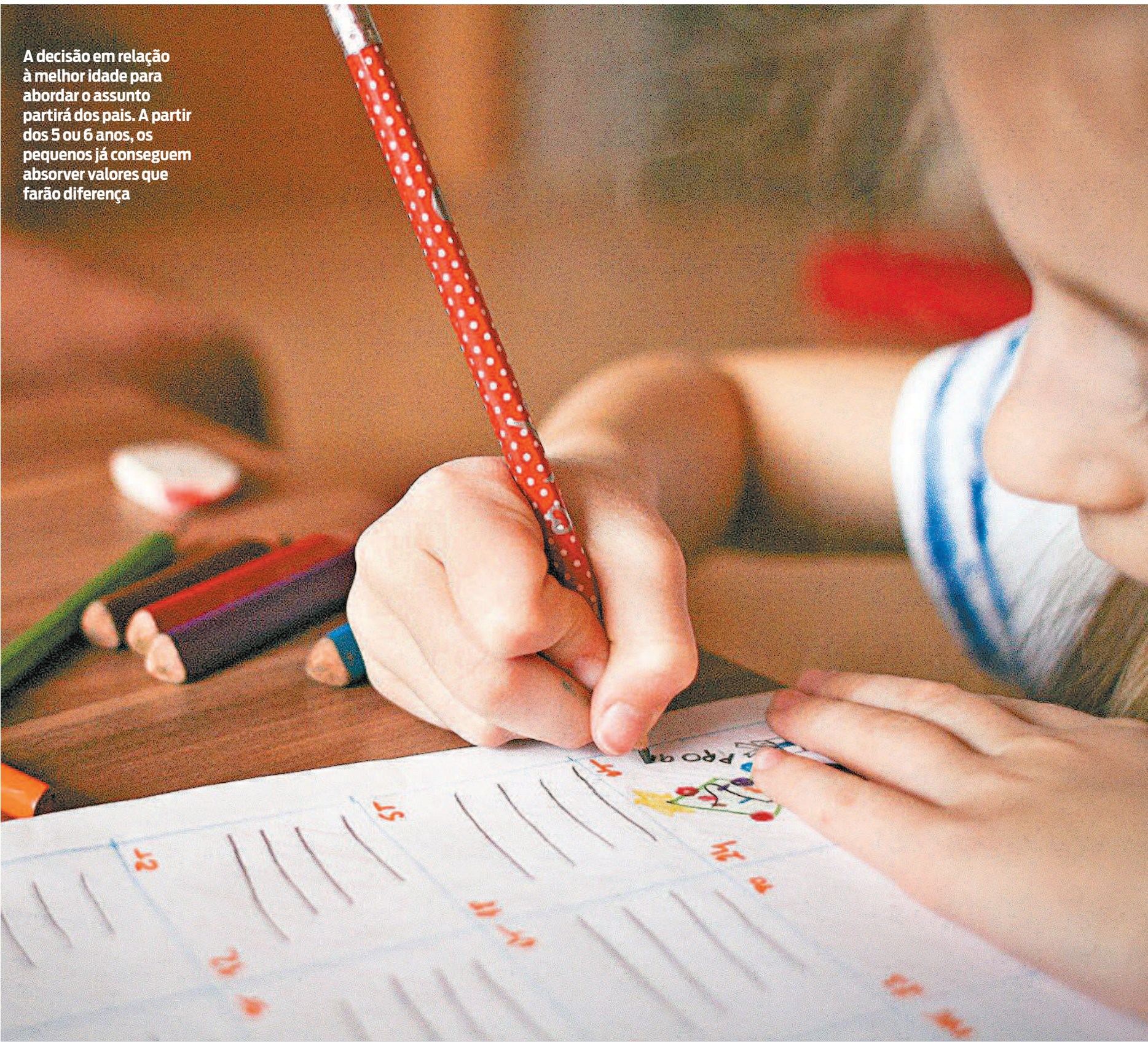
A decisão em relação à melhor idade para abordar o assunto partirá dos pais. A partir dos 5 ou 6 anos, os pequenos já conseguem absorver valores que farão diferença

Amanhã, é comemorado o Dia das Crianças, além dos presentes que marcam a data, deve ser um momento para refletir sobre um tema que afetará o futuro dos pequenos: a educação financeira infantil. Pesquisa de Endividamento e Inadimplência do Consumidor (Peic), da Confederação Nacional do Comércio de Bens, Serviços e Turismo (CNC) de setembro, revela que 74% das famílias relataram estar endividadas, o maior percentual já detectado. Apesar da conjuntura econômica desfavorável, a educação financeira é o primeiro passo para aprender como lidar com crise, e essa lógica deve fazer parte do cotidiano dos baixinhos. Pequenas ações de educação financeira infantil podem ser adotadas desde cedo. A decisão em relação à melhor idade para abordar o assunto partirá dos pais, a depender da maturidade de cada criança, mas, a partir dos 5 ou 6 anos, os pequenos já conseguem absorver valores que farão a diferença no futuro. Escola e família devem estar em sintonia. “A escola tem papel complementar em relação, por exemplo, ao estímulo ao empreendedorismo”, afirma o professor de Economia Lauro Barillari. Para o especialista, ótima forma de desenvolver a criança nesse sentido é diferenciar, na prática, “preço” de “valor”. Presenteá-la com objetos de valor simbólico, feitos à mão