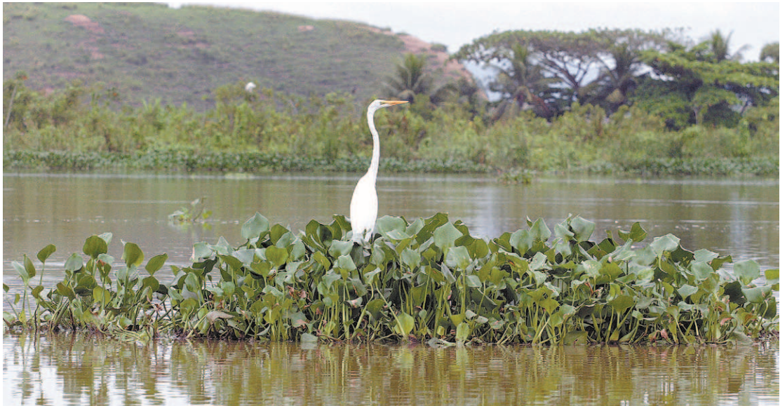
A Bacia do Rio Guandu receberá obras para evitar que lançamento de esgoto sem tratamento continue

presa, segundo o diretor-presidente da Águas do Rio, já está em funcionamento e foi implantado nesses primeiros dois meses de assinatura do contrato.