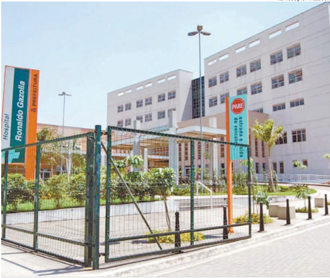
No Hospital Ronaldo Gazolla, em Acari, 95% dos pacientes internados com covid não se vacinaram

Rangel conta que, na maioria dos relatos das pessoas que não se va-