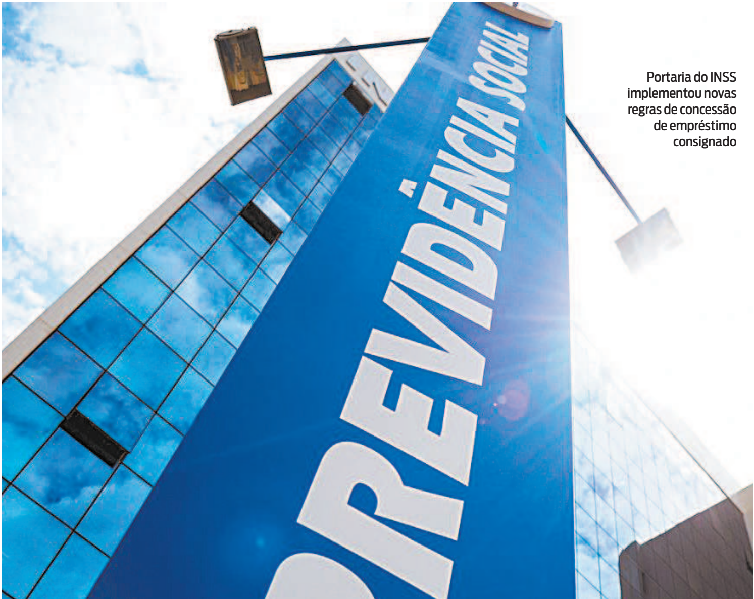
Portaria do INSS implementou novas regras de concessão de empréstimo consignado

Nos casos em que não for possível requerer os serviços via Meu INSS, os segurados poderão ligar para a Central