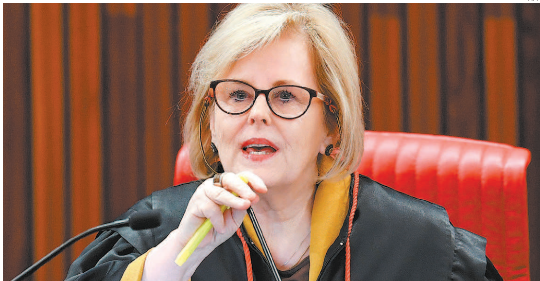
Rosa Weber afirmou que não cabe ao MP ao Judiciário fazer juízo de valor sobre as normas sanitárias

Ao se manifestar sobre o caso no mês passado, a subprocuradora-geral da República Lindora Araújo considerou que Bolsonaro não cometeu crime. Ela argumentou que não é possível atestar a 'exata eficácia da máscara de proteção como meio de prevenir a propagação do novo coronavírus', o que em sua avaliação impede o enquadramento do presidente por deixar de usar