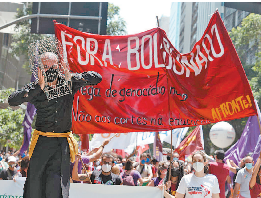
A manifestação no Rio contra Bolsonaro começou as 10h na Candelária e foi até a Cinelândia

feriado da Proclamação da República, com maior capilaridade política e presença de público. A intenção é confrontar em tamanho atos de apoio ao presidente em 7 de Setembro, que tiveram pautas anti-democráticas, como pedidos de fechamento do STF. O ato reuniu 13 partidos de esquerda e centro-esquerda: PT, PSOL, PCdoB, PSB, Cidadania, Solidariedade, PDT, Rede, PV, PCB, UP, PCO e PSTU. Organizações sociais, sindicais e movimentos de juventude levaram militantes. Boa parte com cartazes e camisetas em favor de Lula, que lidera pesquisas de intenção de votos. Boneco inflável do ex-presidente participou.