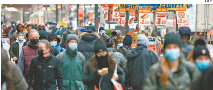
Uso de máscaras ainda divide os norte-americanos

O posicionamento contraria a comunidade científica, que já atestou a importância da máscara na prevenção para frear o contágio pelo coronavírus.